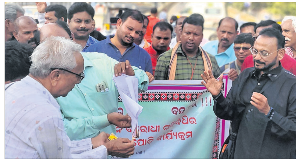
ଏତଲା କପି ପୋଡ଼ିବା ସମ୍ବନ୍ଧରେ ସଂଗଠନ କର୍ମକର୍ତ୍ତା।

୨୦୨୦-୨୧ରେ ଦିଲ୍ଲୀରେ କେନ୍ଦ୍ର ସରକାରଙ୍କ ନୂତନ କୃଷି ନୀତି ବିରୋଧରେ ହୋଇଥିବା ଚାଷୀ ଆନ୍ଦୋଳନରେ ମିଛ ମାମଲାରେ ଗିରଫ ଚାଷୀଙ୍କୁ ତୁରନ୍ତ ଖଲାସ କରିବାକୁ ସମ୍ବଲପୁରର ବିଭିନ୍ନ ଚାଷୀ ସଙ୍ଗଠନ ପକ୍ଷରୁ ଦାବି କରାଯାଇଛି। ଏହି ପରିସ୍ଥିତିରେ ସୋମବାର ସଂଯୁକ୍ତ କିଷାନ ମୋର୍ଚ୍ଚାର ଆହ୍ୱାନ କ୍ରମେ ନେଲେ ସମ୍ବଲପୁରର ଉପସଭାପତି ଓଡ଼ିଶା କୃଷକ ସମନ୍ୱୟ ସମିତି, ଜିଲ୍ଲା କୃଷକ ସୁରକ୍ଷା ସଙ୍ଗଠନ ଆଦି ଚାଷୀ ସଂଗଠନ ଏକାଠି ହୋଇ ଆନ୍ଦୋଳନରେ ସାମିଲ ଚାଷୀଙ୍କ ବିରୋଧରେ ରୁଜୁ ମିଛ ମାମଲା ପ୍ରତ୍ୟାହାର ଦାବି ସହ ଉକ୍ତ ଏତଲା କପିପୁଡ଼ିକୁ ପୋଡ଼ିଥିଲେ।