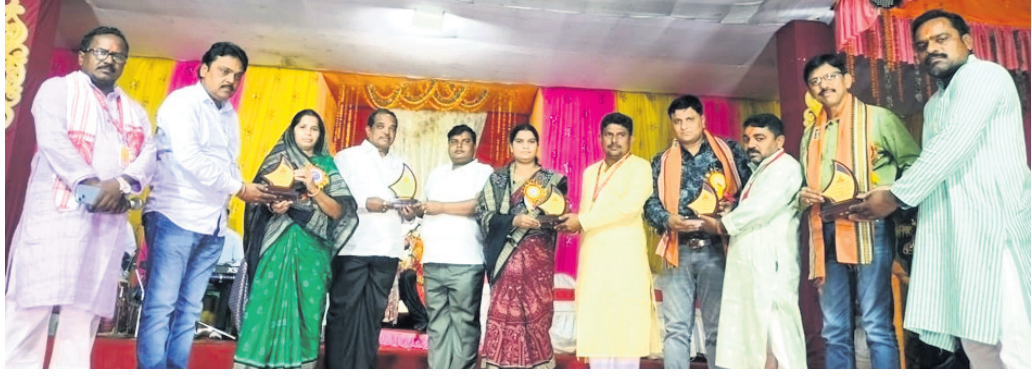
ଅଭିଯାନକୁ ସମର୍ଥନ କରାଯାଇଛି।

ଅମରପାଳି, ୬।୧୧ (ପାତାମର ସାହୁ) ସୁବର୍ଣ୍ଣପୁର ଜିଲ୍ଲା ବାରମହାରାଜପୁର ବ୍ଲକ୍ ଅନ୍ତର୍ଗତ ମୁଣ୍ଡିଝିରେ ଗଜଲକ୍ଷ୍ମୀ ପୂଜା ଅବସରରେ ହେଉଥିବା ମୁରାସୁର ବଧ ପର୍ବରେ ସମ୍ପୂର୍ଣ୍ଣ ହୋଇଛି। ମୁରାସୁର ବଧ ସହିତ ସମ୍ପୂର୍ଣ୍ଣ ହୋଇଛି ମୁରାସୁର ବଧବାର। ପ୍ରଭାକାଶ ରଞ୍ଜନୀଶରେ ପରିବେଷଣ ହେଉଥିବା ଲାଳା ନାଟକର ଅଷ୍ଟମ ସନ୍ଧ୍ୟାରେ ପୁତ୍ର ନାଟି ବିଶାଶ ଶୁଣି ମୁରାସୁରର ଶୋକ, ତ୍ରୋଧୁତ ହୋଇ ବାବୁଲୀସୁର କାଳ, ମହାକାଳଙ୍କୁ ପ୍ରେରଣା ପରିବେଷଣ ହୋଇଥିଲା। ଅତିଥି ଭାବେ ପୂର୍ବତନ