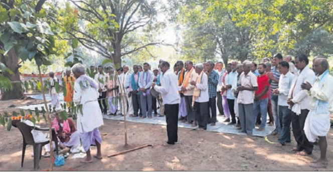
ବୈଠକରେ ଉପସ୍ଥିତ ଚଷା ମହାସଭା ସଦସ୍ୟମାନେ।