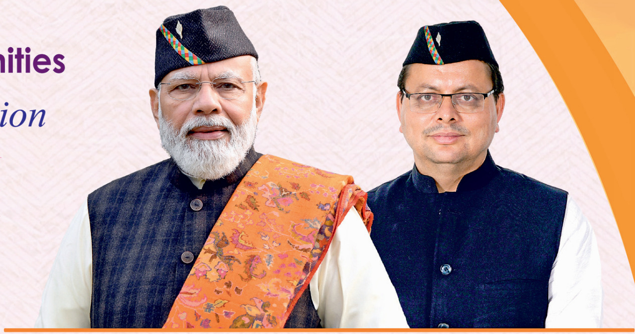
Narendra Modi Prime Minister