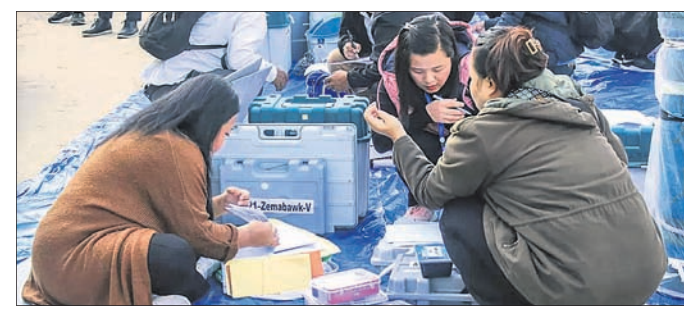
ମିଜୋରାମ ଭୋଟ ପାଇଁ ପୋଲିଂ କର୍ମଚାରୀମାନେ ଲଢ଼ିବନ୍ ଓ ଅନ୍ୟ ସାମଗ୍ରୀ ସଂଗ୍ରହ କରୁଛନ୍ତି। ନଭେମ୍ବର ମୋଦି ତାଙ୍କୁ ଗାଉଁଟ କରିଥିଲେ। ଅନ୍ୟପକ୍ଷରେ ଭାଙ୍ଗିବା ବିରୋଧୀ ନେତାମାନଙ୍କ ବିରୋଧରେ କେନ୍ଦ୍ରୀୟ ଅନ୍ତର୍ଜାତୀୟ ସାମାଜିକ ରହିଛି। ରାଜ୍ୟ ସାମାଜିକ ଅଭିଯୋଗ କରିଥିଲା। କଂଗ୍ରେସ ବିଦାୟ ପୁଷ୍ପାମଣ୍ଡା ବଦଳାଇ ନେତୃତ୍ୱରେ ନିର୍ବାଚନ ଲଢ଼ୁଥିବାବେଳେ ଭାଙ୍ଗିବା ପ୍ରଧାନମନ୍ତ୍ରୀ ମୋଦିଙ୍କ ଲୋକପ୍ରିୟତାକୁ ପୁଣି କରି ନିର୍ବାଚନ ମଜଲ୍ଲୀକୁ ଓହ୍ଲାଇଛି। ୪୦

ବିଷ୍ଣୋଗଣ୍ଡରେ ଜଣେ ଯବାନ, ୨ ପୋଲିଂ କର୍ମଚାରୀ ଆହତ ରାୟପୁର, ୬୧୧ ନୂଆଦିଲ୍ଲୀ, ୬୧୧ ଛତିଶଗଡ଼ ଓ ମିଜୋରାମ ବିଧାନସଭା ନିର୍ବାଚନ ଲାଗି ମଜଲ୍ଲୀର ମତଦାନ ହେବାକୁ ଯାଉଛି। ୧୦ ଆସନ ବିଶିଷ୍ଟ ଛତିଶଗଡ଼ ବିଧାନସଭାରେ ୨୦ଟି ଆସନରେ ମଜଲ୍ଲୀର ପ୍ରଥମ ପର୍ଯ୍ୟାୟରେ ଭୋଟ ନିଆଯିବ। ସେହି ନିର୍ବାଚନ ମଞ୍ଚଳଗୁଡ଼ିକ ମାଓବାଦୀ ପ୍ରବଳ ବସ୍ତ୍ର ଓ ଜରବଳପୁର ଜିଲ୍ଲାରେ ରହିଛି। ଏଥିପାଇଁ କଡ଼ା ସୁରକ୍ଷା ବ୍ୟବସ୍ଥା ଗ୍ରହଣ କରାଯିବା ସହ ୨୦,୦୦୦ ସୁରକ୍ଷା କର୍ମୀଙ୍କୁ ନିୟୋଜିତ କରାଯାଇଛି। ପୋଲିଂ କର୍ମଚାରୀମାନେ ଗୁପ୍ତଚୁକ୍ତିରେ ପହଞ୍ଚି ଯାଉଛନ୍ତି। ରିପୋର୍ଟର ପ୍ରଚାର ଶେଷ ହୋଇଥିବାବେଳେ ବିଭିନ୍ନ ଦଳର ନେତା ଭୋଟରମାନଙ୍କୁ ଆକୃଷ୍ଟ କରିବା ପାଇଁ ଚୁପ୍ଚାପ ଉଦ୍ୟମ କରିଥିଲେ। ମହାବେଦ ବେଢ଼ି ଆସ୍ ସହ ପୁଷ୍ପାମଣ୍ଡା ଭୂପେଶ ନେତୃତ୍ୱରେ ବିଷ୍ଣୋଗଣ୍ଡ ଯାଉଥିଲା।