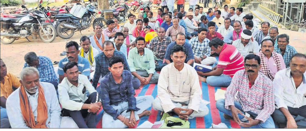
ବିଦ୍ୟୁତ୍ କାର୍ ପ୍ରତିବାଦରେ ଧାରଣା ଦିଆଯାଇଛି ।

ବରଗଡ଼, ୬।୧୧ (ପ୍ରେମାନନ୍ଦ ଖମ୍ବାରୀ) ବରଗଡ଼ ଜିଲ୍ଲା ଭଟ୍ଟାଚାର୍ଯ୍ୟ ବ୍ଲକ୍ରେ ବିଦ୍ୟୁତ୍ କାର୍ ପ୍ରତିବାଦରେ ଧାରଣା ଦିଆଯାଇଛି । ଏହି ଅବସରରେ କଳସ ଯାତ୍ରା, ଶ୍ରୀକୃଷ୍ଣ ଜନ୍ମ, ଚଣ୍ଡିକା ବିବାହ, ବରାହପୂଜା ଆଦି ଅନୁଷ୍ଠିତ ହୋଇଥିଲା । ଚଣ୍ଡିକା ବିବାହରେ ଭାରତୀ ପକ୍ଷୀମାନଙ୍କୁ ଓହ୍ଲାଇ ପକ୍ଷୀମାନଙ୍କୁ ବରପକ୍ଷ ଥିବାବେଳେ ସମ୍ପୂର୍ଣ୍ଣ ଦାଶ ଓ ରବିନ୍ଦ୍ର ଦାଶ କର୍ମାଧ୍ୟକ୍ଷ ଥିଲେ । ପ୍ରତ୍ୟହ ଶ୍ରୀକୃଷ୍ଣ ଭକ୍ତମାନଙ୍କ ଭିଡ଼ ପରିଲକ୍ଷିତ ହୋଇଥିଲା ।