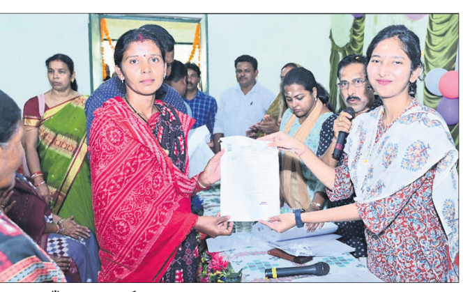
ଗୃହାଳ ପାଇଁ ଚାଷୀଙ୍କୁ କାର୍ଯ୍ୟାଦେଶ ବଞ୍ଚନ କରାଯାଇଛି।

ମୁଖ୍ୟମନ୍ତ୍ରୀ କୃଷି ଉଦ୍ୟୋଗ ଯୋଜନାରେ ଉପକୃତ ହୋଇପାରିବେ ସେ ସମ୍ପର୍କରେ ଅତିଥିମାନେ ଆଲୋଚନା କରିଥିଲେ। ଏହାସହ ଚାଷୀମାନେ ଅଧିକ ଗୋପାଳନ କରି ଦୁଗ୍ଧ ସମବାୟ ସମିତିକୁ ସୁଦୃଢ଼ କରିବାକୁ ପରାମର୍ଶ ଦେଇଥିଲେ। ଏହି ଅବସରରେ କୃତିଷ୍ଣା ବ୍ଲକ ଦୁଗ୍ଧ ଉତ୍ପାଦନ