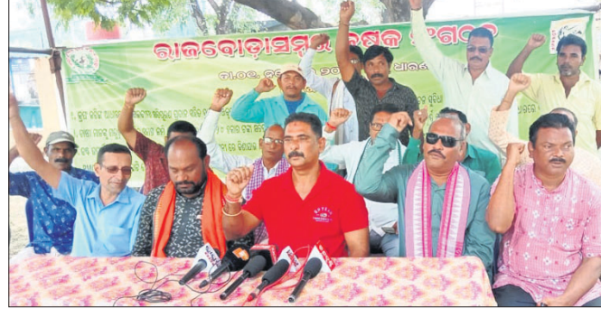
ଖବରଦାତା ସମ୍ମିଳନୀରେ ସଙ୍ଘଠନର କର୍ମକର୍ତ୍ତା ସୂଚନା ଦେଉଛନ୍ତି ।

ବରଗଡ଼ ଜିଲ୍ଲା ରାଜବୋଡ଼ାସମ୍ବର କୃଷକ ସଙ୍ଘଠନ ନେତୃତ୍ୱରେ ମଙ୍ଗଳବାର ବିରାଟ କୃଷକ ସମାବେଶ ଅନୁଷ୍ଠିତ ହେବ । ଏହି ସମାବେଶରେ ବିଦ୍ୟୁତ୍ ସମସ୍ୟା, ଇନ୍ଦ୍ରିୟ ସଂସ୍କୃତି, ୨୦୨୧ ବାମା ଓ ମରୁଡ଼ି ସହାୟତା, ଭୁକ୍ତ ମଣ୍ଡି ଖୋଲିବା, କର୍ମା ଛବନା ବନ୍ଦ, ବିସ୍ଥାପନ ବିହୀନ ଜଳସେଚନ ସୁବିଧା, ମାଣ୍ଡି ସୁନିତ ମାଗଣା ବିଦ୍ୟୁତ୍ ଯୋଗାଣ, ଧାନ ମଣ୍ଡି ସହ ଅନ୍ୟ ଲାଭକାରୀ ସମସ୍ୟାରେ ମଣ୍ଡି ବ୍ୟବସ୍ଥା, କୋଷ୍ଠକ ରାଜ୍ୟ ଯୋଷଣା ସହ ପଦ୍ମପୁରକୁ ଜିଲ୍ଲା ମାନ୍ୟତା ପ୍ରଦାନ କରିବା ଆଦି ଦାବି ଉପସ୍ଥାପନ କରାଯିବ । ଉପସମ୍ବର ଶେଷ ସମାବେଶରେ କୃଷକ ସଙ୍ଘଠନ ଯୋଷଣା ପୂରଣ ନ ହେଲେ କାର୍ଯ୍ୟକ୍ରମ ୧୨