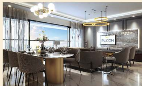
Living / Dining Room