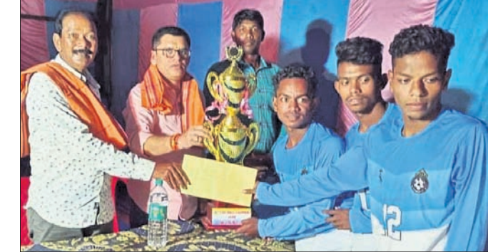
ଉଲ୍ଲସରେ ପୁରସ୍କାର ପ୍ରତିଯୋଗିତାର କୃତୀ ପୁରସ୍କାର ଦଳକୁ ପୁରସ୍କୃତ କରାଯାଇଛି ।