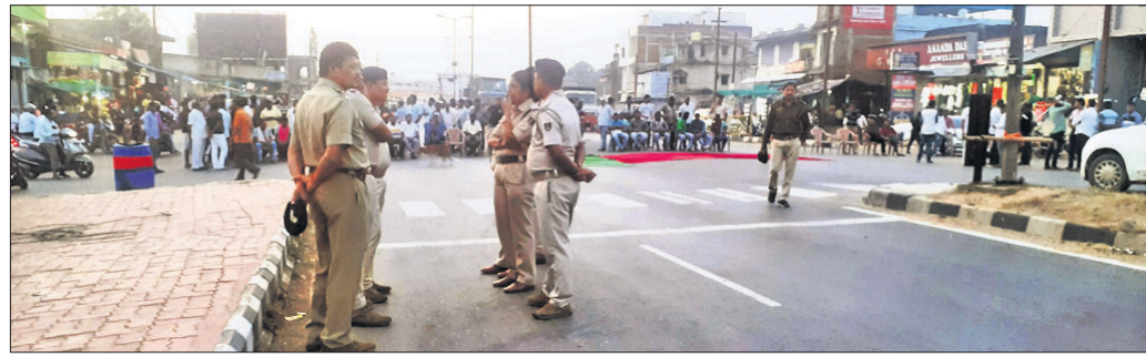
ବରଗଡ଼, ୬।୧୧ (ପ୍ରେମାନନ୍ଦ ଖମ୍ବାରୀ)

ଅଧ୍ୟାପକ ଥାନା ଉତ୍ତରାଞ୍ଚଳ ଘଟଣା ■ ସିସିଟିଭି ଫୁଟେଜକୁ ନେଇ ତଦନ୍ତ ■ ସୋହେଲା ଓ ଭଟ୍ଟାଚାର୍ଯ୍ୟଙ୍କ ରାସ୍ତାରେକୋ ■ ବିଧାୟକ ସୁଶାନ୍ତ ସିଂଙ୍କ ସମ୍ପୂର୍ଣ୍ଣ ଥିବା କହିଲା ଭାଜପା