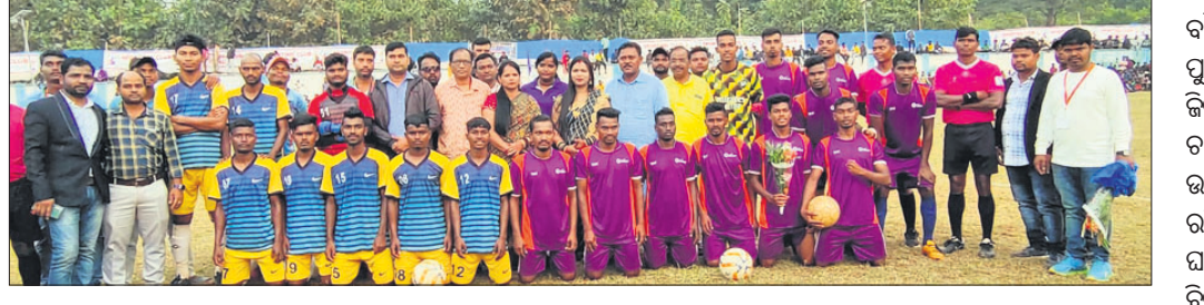
ପ୍ରତିଯୋଗିତାରେ ଭାଗ ନେଇଥିବା ଖେଳାଳି