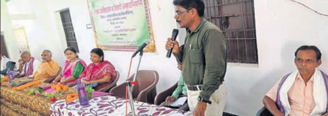
କାର୍ଯ୍ୟକ୍ରମରେ ମହାସଭା ଅତିଥିବୃନ୍ଦ ।