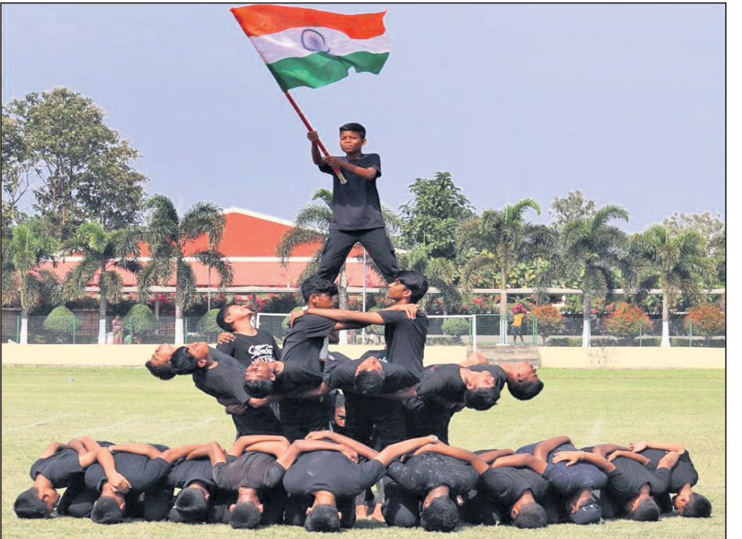
ସଂସ୍କୃତିକ କାର୍ଯ୍ୟକ୍ରମରେ ପିଲାଙ୍କ କ୍ରୀଡ଼ା କୌଶଳ ପ୍ରଦର୍ଶନ।