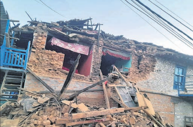
ଶୁକ୍ରବାର ବିକସିତ ରାତିରେ ହୋଇଥିବା ଭୂକମ୍ପ ଯୋଗୁଁ ବିଧ୍ୟ ଏକ ଘର।

କାଠମାଣ୍ଡୁ/ନୂଆଦିଲ୍ଲୀ, ୬୧୧ ନେପାଳରେ ୩ ଦିନ ମଧ୍ୟରେ ତୃତୀୟ ଭୂକମ୍ପ ସୋମବାର ଅପରାହ୍ନ ୪ଟା ୧୪ ମିନିଟ୍ରେ ହୋଇଛି। ଭୂକମ୍ପର ତୀବ୍ରତା ୫.୬ ଥିଲା। ଏହାର ପ୍ରଭାବରେ ଦିଲ୍ଲୀ-ଏନସିଆର୍ ସମେତ ଉତ୍ତର ଭାରତରେ ଶକ୍ତିଶାଳୀ ଝଟକା ଅନୁଭୂତ ହୋଇଛି। ଗତ ଶୁକ୍ରବାର ରାତିରେ ଏହି ପାର୍ବତ୍ୟାଞ୍ଚଳ ଦେଶରେ ୬.୪ ତୀବ୍ରତାର ଭୂକମ୍ପ ୧୫୬ ଲୋକଙ୍କ ଜୀବନ ନେଇଥିବାବେଳେ ୨୫୦୦ ଉର୍ଦ୍ଧ୍ୱ ଆହତ ହୋଇଥିଲେ। ଶକ୍ତିଶାଳୀ ଭୂକମ୍ପ ଯୋଗୁଁ ଶହ ଶହ ଘର ମାଟିରେ ମିଶିଯାଇଛି। ଏହାର କେନ୍ଦ୍ରସ୍ଥଳ ରାଜଧାନୀ କାଠମାଣ୍ଡୁରୁ ୫୦୦ କିଲୋମିଟର ପଶ୍ଚିମରେ ବୋଲି ଜଣାପଡ଼ିଥିଲା। ସୋମବାର ଭୂକମ୍ପର କେନ୍ଦ୍ରସ୍ଥଳ ୧୦ କିଲୋମିଟର ଗଭୀରରେ ହୋଇଥିବା ଜାଣିବା ପରେ ଭୂକମ୍ପ କେନ୍ଦ୍ର ପକ୍ଷରୁ କୁହାଯାଇଛି। ନେପାଳ ସବୁରୁ ସକ୍ରିୟ ଟେକ୍ଟୋନିକ୍ ଜୋନ୍ ୪ ଓ ୫ ମଧ୍ୟରେ ରହୁଥିବାରୁ ଏଠାରେ ଭୂକମ୍ପ ଅତ୍ୟଧିକ କ୍ଷତିକାରକ ହୋଇଥାଏ। ନେପାଳରେ