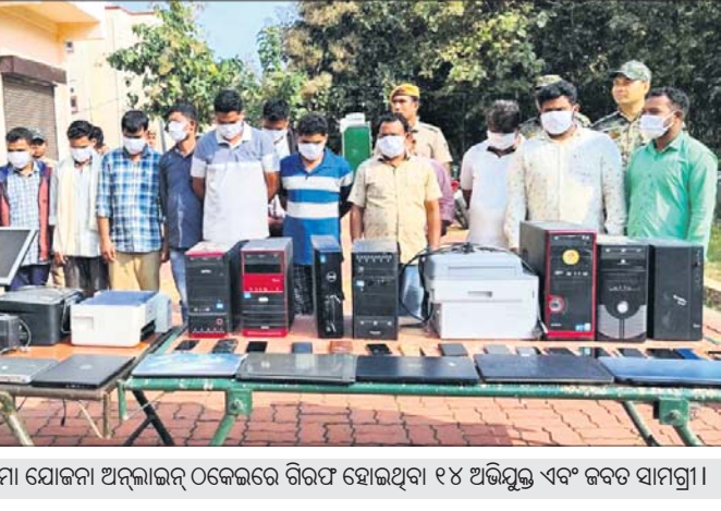
ପ୍ରଧାନମନ୍ତ୍ରୀ ଫସଲ ବାମା ଅନୁଲାଇନ୍ ଠକେଇରେ ଗିରଫ ହୋଇଥିବା ୧୪ ଅଭିଯୁକ୍ତ ଏବଂ କବଚ ସାମଗ୍ରୀ।