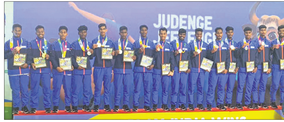
ଜାତୀୟ କ୍ରୀଡାର ଖୋ ଖୋ ଇଭେଣ୍ଟରେ ରୌପ୍ୟ ପଦକ ବିଜୟୀ ଓଡ଼ିଶା ପୁରୁଷ ଓ ମହିଳା ଦଳ।