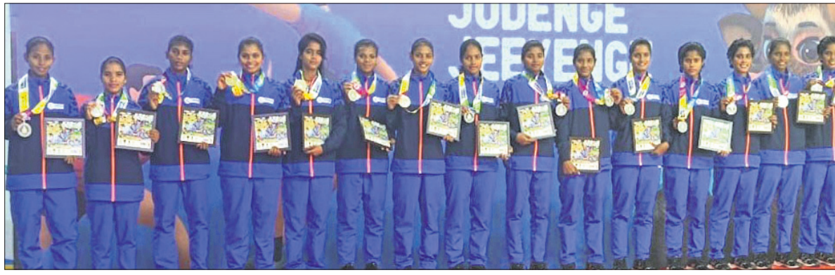
ଜାତୀୟ କ୍ରୀଡାର ଖୋ ଖୋ ଇଭେଣ୍ଟରେ ରୌପ୍ୟ ପଦକ ବିଜୟୀ ଓଡ଼ିଶା ପୁରୁଷ ଓ ମହିଳା ଦଳ।