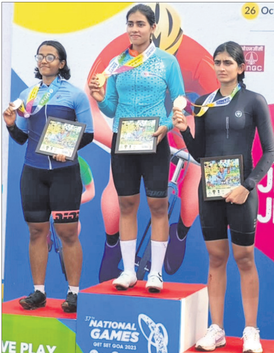
ପୋଡ଼ିୟମ ଉପରେ ସର୍ବ୍ୱ ପଦକ ଗ୍ରହଣ ଅବସରରେ ଓଡ଼ିଶାର ସ୍ପ୍ରିଟ୍ ଦଳ (ମଝି)।