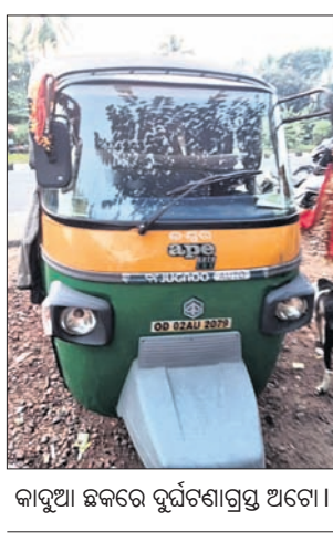
କାପୁଆ ଛକରେ ବୁର୍ଲିଗାଗ୍ରସ୍ତ ଅଟୋ।

ପୁରୀ-ଭୁବନେଶ୍ୱର ଜାତୀୟ ରାଜପଥର ବନ୍ଦ୍ୟବାଦୀ ଥାନା ଅଧୀନ କାପୁଆ ଛକ ନିକଟରେ ରୁଧିରୀ ଅପରାଧ ୪ଟାରେ ଏକ ଅଟୋ ଓଲଟି ପଡ଼ିଛି। ଫଳରେ ଜଣେ ମହିଳାଙ୍କ ମୃତ୍ୟୁ ଘଟିଥିବାବେଳେ ତାଙ୍କ ସ୍ୱାମୀ ଗୁରୁତର ଆହତ ହୋଇଛନ୍ତି। ପୁରୀରେ ରହୁଥିବା ତାଙ୍କ ପୁଅ ପାଖକୁ ଏହି ବନ୍ଦ୍ୟବାଦୀ ଅଟୋକୁ ବୁର୍ଲିଗାଗ୍ରସ୍ତ ଅଟୋ।