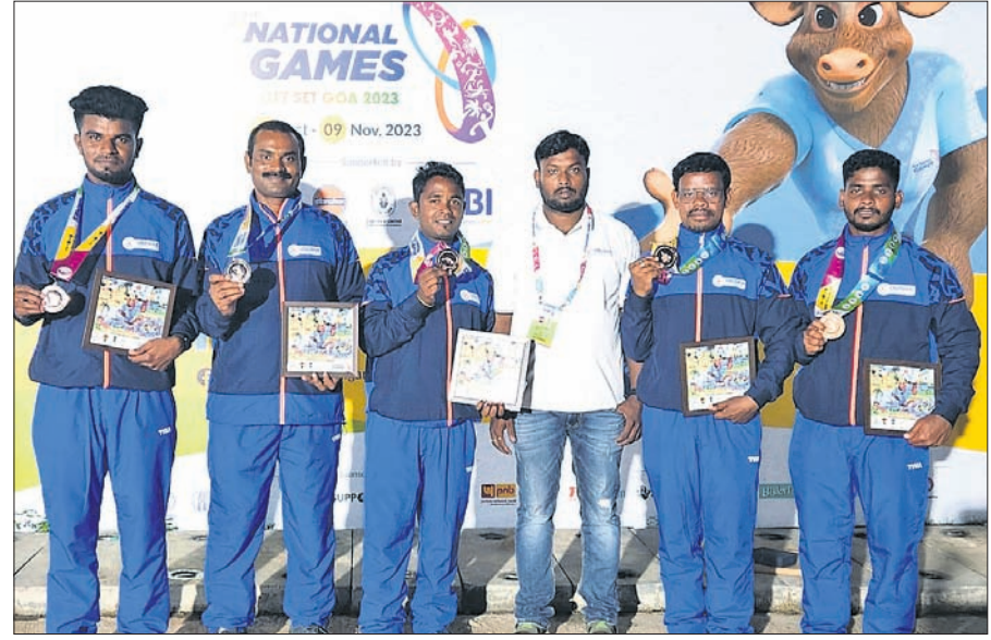
ଇନ୍ଦୋରରେ ଗ୍ରୋଜି ବିଜୟୀ ଓଡ଼ିଶା ଦଳ।

ଭୁବନେଶ୍ୱର, ୮।୧୧ (ସରୋଜ କେନା) ଗୋଆରେ ଅନୁଷ୍ଠିତ ୩୭ ତମ ଜାତୀୟ କ୍ରୀଡାରେ ଓଡ଼ିଶା ଖେଳାଳିଙ୍କ ତନୁକାର ପ୍ରଦର୍ଶନ ଜାରି ରହିଛି। ରୁଧିରୀ ଓଡ଼ିଆ ସାଲକ୍ସ୍ ସ୍ପ୍ରିଟ୍ ଦଳ ସର୍ବ୍ୱ ପଦକ ହାସଲ କରିଥିବା ବେଳେ ଓଡ଼ିଶାର ପଦକ ସଂଖ୍ୟା ୫୦ ପାର କରିଛି। ୭୫ କି.ମି. ମାସ୍ ଷ୍ଟାର୍ଟ ରୋଡ୍ ସାଇକ୍ଲିଂ ଇଭେଣ୍ଟରେ ସ୍ପ୍ରିଟ୍ ସର୍ବ୍ୱ