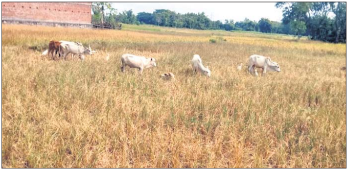
ଧାନ କ୍ଷେତରେ ଗୋରୁ ଚରୁଛନ୍ତି।

ଝରପୁର, ୮।୧୧ (ସଂକ୍ଷେପ ପତ୍ର): ଚଳିତ ବର୍ଷ ଗଞ୍ଜାମ ଜିଲ୍ଲାରେ କମ୍ ବର୍ଷା ହୋଇଛି। ଏଥିପାଇଁ ଧାନ ଫସଲ ଉତ୍କଳିକାଣି ହୋଇଛି। ଏପରିକି ପର୍ଯ୍ୟାପ୍ତ ଧାନ ଫସଲ ଉତ୍କଳିକାଣି ହୋଇଛି। ଏପରିକି ପର୍ଯ୍ୟାପ୍ତ ଧାନ ଫସଲ ଉତ୍କଳିକାଣି ହୋଇଛି।