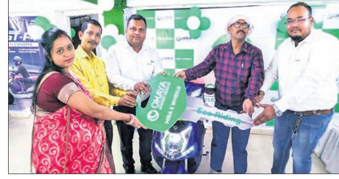
ଉଦ୍‌ଘାଟନା ଅବସରରେ ପ୍ରଥମ ଗ୍ରାହକଙ୍କୁ ଓକାୟା ଲଭିର ଚାରି ହସ୍ତାନ୍ତର କରାଯାଇଛି।

ବୈଦ୍ୟୁତିକ ଗତିଶୀଳତାର ଏକ ନୂତନ ଦୁନିଆରେ ଅବସ୍ଥାପିତ କରିବ, ଯେଉଁଠାରେ ସେମାନେ ଓକାୟା ଲଭିର ବିକ୍ରୟ ଉତ୍ପାଦ ଓ ପୋର୍ଟଫୋଲିଓକୁ ଠିକ୍ ଭାବେ ଅନୁସନ୍ଧାନ କରିପାରିବେ।