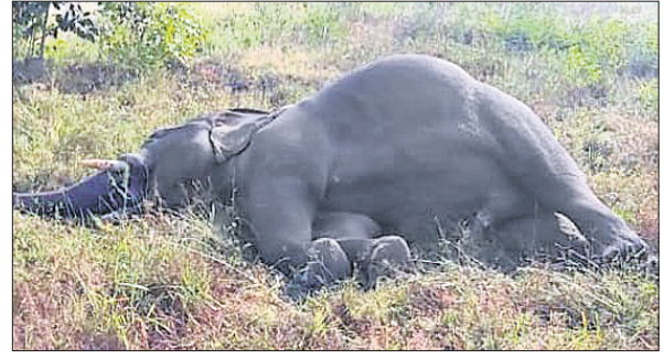
ବିଦ୍ୟୁତ୍ ପାଖରେ ପଡ଼ି ପ୍ରାଣ ହରାଇଥିବା ଦନ୍ତାହାତୀ।