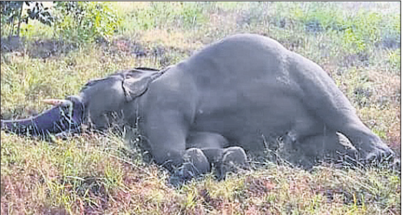
ବିଦ୍ୟୁତ୍ ପାଖରେ ପଡ଼ି ପ୍ରାଣ ହରାଇଥିବା ଦନ୍ତାହାତୀ।