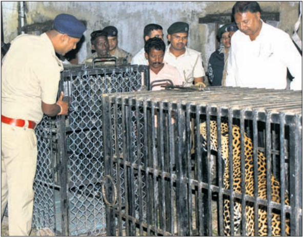
ସଙ୍ଗରୋଧରେ ଚିକିତ୍ସିତ ହେଉଥିବା ବାଘ।