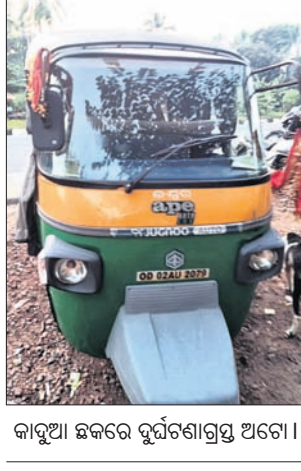
କାହୁଆ ଛକରେ ଦୁର୍ଘଟଣାଗ୍ରସ୍ତ ଅଟୋ।

ସାକ୍ଷୀଗୋପାଳ, ୮୧୧ (ପ୍ରଶାନ୍ତ କୁମାର ବାରିକ/ କିଶୋର ମହାପାତ୍ର) ପୁରୀ-ଭୁବନେଶ୍ୱର ଜାତୀୟ ରାଜପଥର ଦୈନିକ ସାମାନ୍ ଅଧୀନ କାହୁଆ ଛକ ନିକଟରେ ବୁଧବାର ଅପରାହ୍ଣ ୪ଟାରେ ଏକ ଅଟୋ ଓଲଟି ପଡ଼ିଛି।