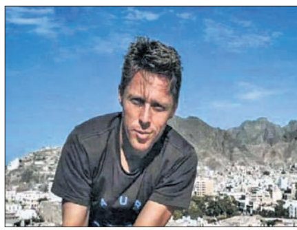
ଭିତରେ ବିଶ୍ୱର ସମସ୍ତ ଦେଶ ବୁଲିଯାଉଥିଲେ। ହେଲେ ସେ ଏଥିରେ ଛୁଟି ନ ଥିଲେ। ଏହି କାରଣରୁ ସେ ପୁନଶ୍ଚ ବିଶ୍ୱ ବୁଲିବାକୁ ଯୋଜନା କଲେ ଏବଂ ତାଙ୍କ ଯାତ୍ରା ଆରମ୍ଭ କଲେ।

ଉତ୍ତମ: ବହୁ ବ୍ୟକ୍ତି ଭ୍ରମଣରେ ରୁଚି ରଖୁଥାନ୍ତି। ତେବେ ଏପରି କଣେ ବ୍ୟକ୍ତି ଅଛନ୍ତି, ଯେ ୪୮ ବର୍ଷ ବୟସରେ ୨ଥର ବିଶ୍ୱ ଭ୍ରମଣ କରିଛନ୍ତି। ଏଥିରେ ମୁଖ୍ୟ ପ୍ରଭାବିତ ଦେଶୀ ଚଳଚ୍ଚିତ୍ର ଆରମ୍ଭ କରି ସବୁଠାରୁ ରହସ୍ୟମୟ ଦେଶ ଭରଣ କରିଥିବା ମଧ୍ୟ ସାମିଲ ରହିଛି।