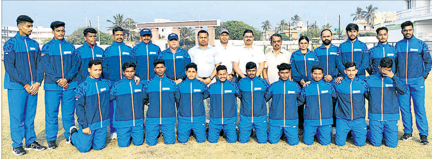
ଗୋଆରେ ଅନୁଷ୍ଠିତ କାତୀୟ କ୍ରୀଡ଼ା ପ୍ରତିଯୋଗିତାର ଖୋ ଖୋ ଖେଳରେ ଭାଗନେଇଥିବା ଓଡ଼ିଶାର ଖେଳାଳିମାନେ।

ପିପିଲି, ୮୧୧ (ବୃନ୍ଦାମାଧବ ମିଶ୍ର): ପିପିଲି ଲକ୍ଷ୍ମୀ ନାରାୟଣପୁର ପଞ୍ଚାୟତ ବିଳିପଡ଼ା ଛକରେ ଥିବା ବେଆଇନ କରତକଳା ଉପରେ ରୁଧିରା ବନ ବିଭାଗ ଓ ଭିଜିଲାଟର ସ୍ୱତନ୍ତ୍ର ଚିଠି ଚଢ଼ାଇ କରିଛି।