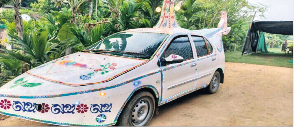
ହେଲିକପ୍ଟର ଭଳି ସଜାଯାଇଥିବା ଇଣ୍ଡିଗୋ କାର୍।

ଅସ୍ତରଙ୍ଗ, ୮୧୧ (ମମତା ଜେନା) ଇଣ୍ଡିଗୋ କାରରେ ହେଲିକପ୍ଟର ମଜା। ଏକ ଭଳି ଏକ ଇଣ୍ଡିଗୋ କାର ରହିଛି, ଯାହାକୁ ଦେଖିଲେ ସେଇଟା ସମ୍ପୂର୍ଣ୍ଣରୂପେ ହେଲିକପ୍ଟର ଭଳି ଦେଖାଯାଉଛି।