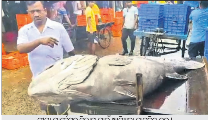
ଦାଘା ମାର୍ଜେଟକୁ ନିଲାମ ପାଇଁ ଆସିଥିବା ସାମୁଦ୍ରିକ କଞ୍ଚ ।

ଭୋଗରାଇ, ୯।୧୧(ପ୍ରଦୀପ ଦାସ) ଏକ ମାସ ବ୍ୟବଧାନ ପରେ ପୁଣି ଏକ ବିଶାଳକାୟ ସାମୁଦ୍ରିକ କଞ୍ଚ ମାଛ ପାରାସ୍ତ୍ରୀୟ ଗଭୀର ସମୁଦ୍ରରୁ ଧରାଯାଇଛି । ମାଛକୁ ପାରାସ୍ତ୍ରୀୟ ଏକ ଚୁଲର ମାଲିକ ଦାଘା ପୁରୀର ମାଛ ମାର୍ଜେଟରେ ଗୁରୁବାର ବିକ୍ରି କରିବାକୁ ଆଣିଥିଲେ । ଏହାର ଓଜନ ବେଢ଼ କୁଳାଖିଲ ହୋଇଥିବାବେଳେ ୭୦ ହଜାର ବଙ୍କା ନିଲାମରେ ବ୍ୟାଲୀଦେଶର ତଳଫିନ୍ ନାମକ କମ୍ପାନୀ କିଣି ନେଇଥିଲେ । ଏଭଳି ପ୍ରକାରେ ମାଛ ବ୍ୟାଲୀଦେଶ, କୁଏତ, ଆରବ ଦେଶରେ ଅଧିକ ଦାମ୍‌ରେ ବିକ୍ରି ହେଉଥିବା ବେଳେ ମାଛ ଶରୀରରୁ ଉତ୍ପନ୍ନ ଔଷଧ ଓ ମାଟିର ଅପଦେଶନ ବେଳେ ଏକ ମୂଲ୍ୟବାନ ସୂତା ବ୍ୟବହାର ହୁଏ ବୋଲି କୁହାଯାଉଛି । ଚଳିତ ଋତୁରେ ୫ଟି ଏହି ପ୍ରକାରେ ସାମୁଦ୍ରିକ କଞ୍ଚ ବଜାୟପାସାର ଓଡ଼ିଶା ଉପକୂଳକୁ