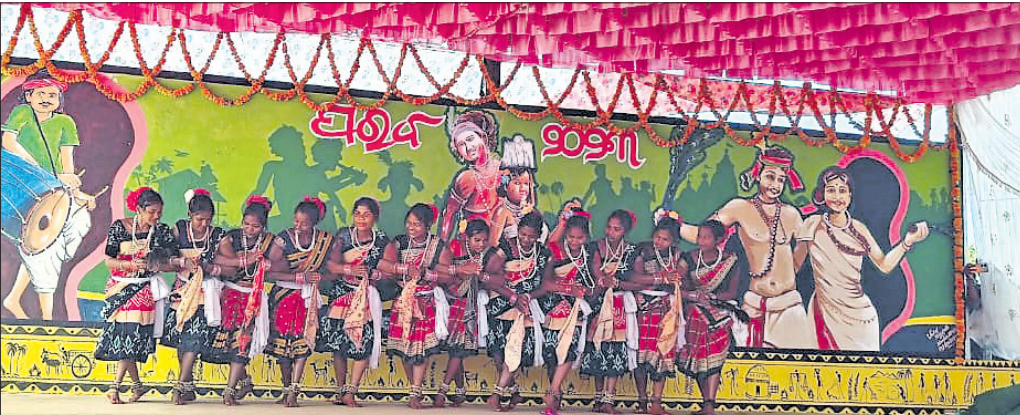
ପଞ୍ଚାୟତସ୍ତରୀୟ ପରବରେ ପ୍ରତିଯୋଗୀମାନେ ନୃତ୍ୟ ପରିବେଷଣ କରୁଛନ୍ତି ।