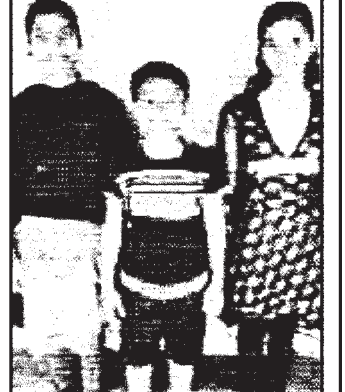
ସ୍ୱା./- ଜିଲ୍ଲା ଶିଶୁ ସୁରକ୍ଷା ଅଧିକାରୀ, କଟକ