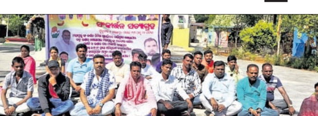
ସୁନାବେଡ଼ା ଜଗନ୍ନାଥ ମନ୍ଦିର ବାଇଶି ପାହାଚରେ ସଂକୀର୍ତ୍ତନ ସତ୍ୟାଗ୍ରହରେ କଂଗ୍ରେସ କର୍ମକର୍ମୀମାନେ ବସିଛନ୍ତି ।

ସୁନାବେଡ଼ା/ନନ୍ଦପୁର, ୯/୧୧ (କୃଷିବାସ ପ୍ରଧାନ ନନ୍ଦପୁର, ଶଙ୍କର ପୂଜାରୀ)