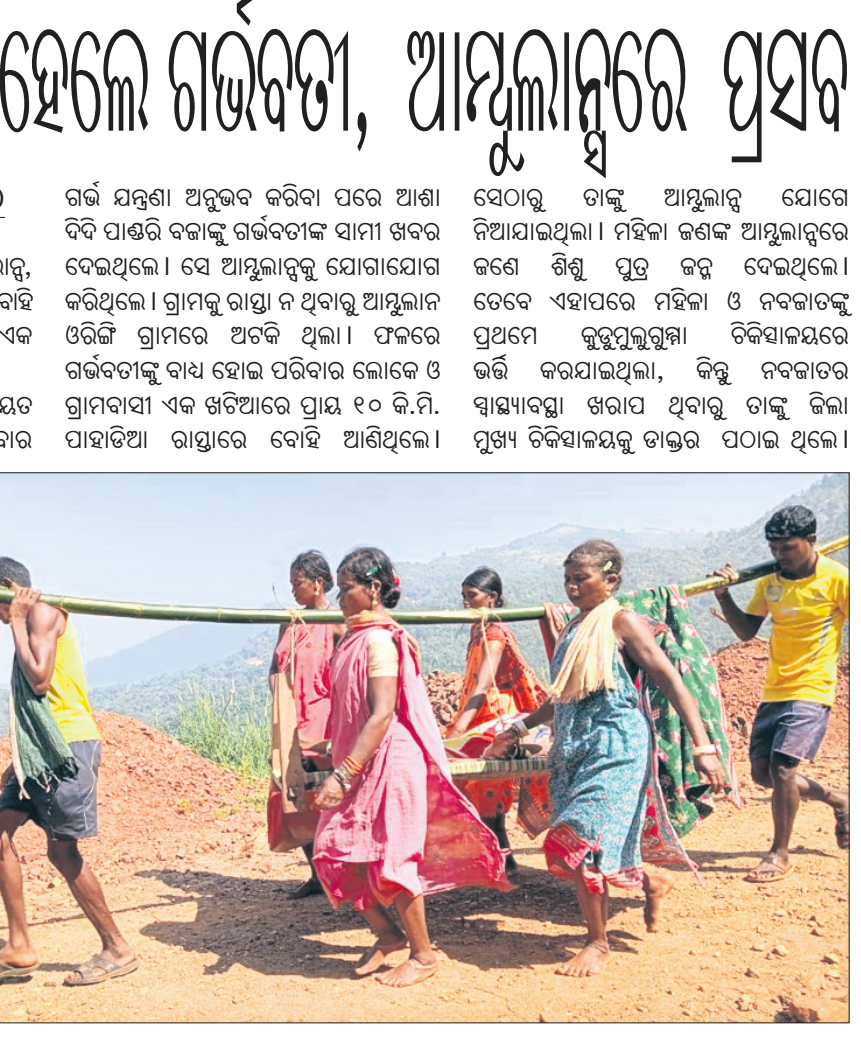
ଝଟିଆରେ ବୁଢ଼ା ହେଲେ ଗର୍ଭବତୀ, ଆୟୁଲାନୁରେ ପ୍ରସର