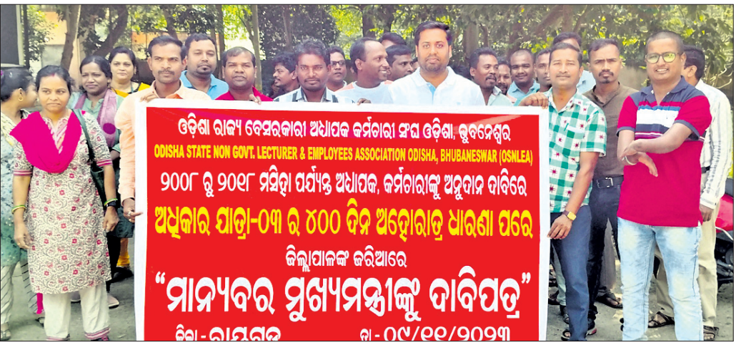
ଜିଲ୍ଲାପାଳଙ୍କୁ ଦାବିପତ୍ର ଦେବାକୁ ଆସିଥିବା ସଂଘର ସଦସ୍ୟମାନେ ।