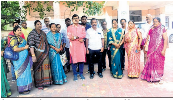
ଜିଲ୍ଲା ପ୍ରଶାସନକୁ ଅଭିଯୋଗ ଜଣାଇବାକୁ ଆସିଥିବା ସରପଞ୍ଚ, ସମିତି ସଭ୍ୟବୃନ୍ଦ ।