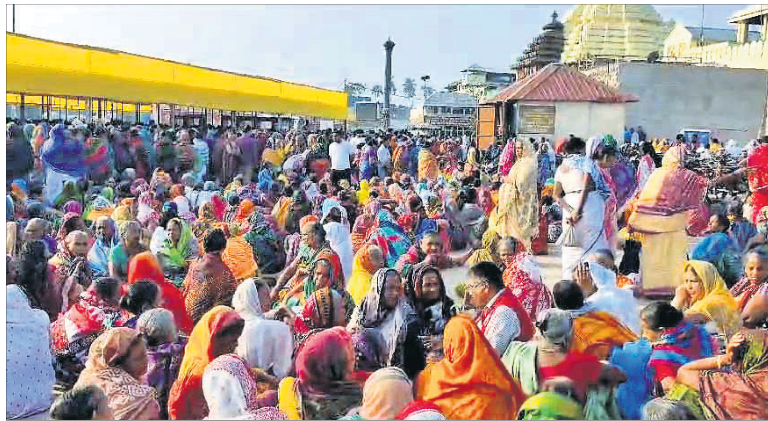
ମହାପ୍ରଭୁଙ୍କ ଦର୍ଶନ ପାଇଁ ଶୁକ୍ରବାର ଶ୍ରୀମନ୍ଦିର ସମ୍ମୁଖରେ ଶ୍ରଦ୍ଧାଳୁ ଓ ହରିଷିଆଳିକ ଭିଡ଼।

କେତେଜଣ ଅଣନ୍ତରାୟୀ ହୋଇ ପଡ଼ିଥିବା ବେଳେ ଅନ୍ୟ କେତେଜଣଙ୍କ ହାତ ଓ ଗୋଡ଼ରେ ଆଘାତ ଲାଗିଥିଲା। ସେଠାରେ ଦାୟିତ୍ୱରେ ଥିବା ଜେଟିପି, ଓଡ଼ିଶା ପୋଲିସ୍, ସ୍ୱେଚ୍ଛାସେବୀ, ସେବାୟତମାନେ ଆହତମାନଙ୍କୁ ଉଦ୍ଧାର କରି ପ୍ରଥମେ ଶ୍ରୀମନ୍ଦିର ପରିସରରୁ କାର୍ଯ୍ୟାଳୟକୁ ନେଇଥିଲେ। ସେଠାରେ ସେମାନଙ୍କୁ ଫ୍ୟାନ୍ ଏବଂ ଏସି ଲଗାଇ ଶୁଆଇ ଦେଇଥିଲେ। ଓଆର୍ଏସ୍ ପାଣି ମଧ୍ୟ ପିଇବାକୁ ଦେଇଥିଲେ। ରୁଗୁଚର ଆହତମାନଙ୍କୁ ଆମ୍ବୁଲାନ୍ସ ଯୋଗେ ଜିଲ୍ଲା ମୁଖ୍ୟ ଚିକିତ୍ସାଳୟକୁ ନିଆଯାଇଥିଲା। ସେଠାରେ ସେମାନଙ୍କର ଚିକିତ୍ସା ପରେ ସମସ୍ତେ ସୁସ୍ଥ ଥିବା ପ୍ରଶଂସନ ପସନ୍ଦ ପୂର୍ବକ ନିଆଯାଇଛି।