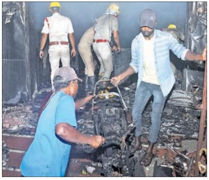
ଯୋଡ଼ିଆଇଥିବା ଗାଡ଼ିକୁ ବାହାରକୁ କଢ଼ାଯାଇଛି।

ଯୋଗା କେନାଲ ରୋଡ଼ରେ ଥିବା 'ଇଡି ଡ୍ୱାର୍ଡ଼' ନାମକ ଏକ ଇଲେକ୍ଟ୍ରିକ୍ ବାଇକ୍ ଶୋ'ରୁମ୍ରେ ଶୁକ୍ରବାର ସନ୍ଧ୍ୟାରେ ଭୟାବହ ଅଗ୍ନିକାଣ୍ଡ ଘଟିଛି। ଅଗ୍ନିଶମ ବାହିନୀର ଆକଳନ ଅନୁସାରେ ପ୍ରାୟ ୨୦ ଲକ୍ଷ ଟଙ୍କାରୁ ଉର୍ଦ୍ଧ୍ୱ ସମ୍ପତ୍ତି ନଷ୍ଟ ହୋଇଛି। ୩ ମହଲା ବିଶିଷ୍ଟ ଉଚ୍ଚ କୋଠାଘରର ତଳ ମହଲାରେ ହୋଇଥିବା ଇଡି ଶୋ'ରୁମ୍ ଜଳି ପାଉଁଶ ହୋଇଯାଇଛି। ଶୋ'ରୁମ୍ରେ ଥିବା ୧୫ଟି ଇଡି ବାଇକ୍ ସମ୍ପୂର୍ଣ୍ଣ ଜଳିଯାଇଛି। ବିଦ୍ୟୁତ୍ତରଳିତ ବାଇକ୍ ପାଇଁ ବ୍ୟବହାର ହେଉଥିବା ଏକ ବ୍ୟାଚେରି ଫାଟିର ଫଳରେ ଏହି ଅଗ୍ନିକାଣ୍ଡ ଘଟିଥିବା ଜିଲା ଅଗ୍ନିଶମ ଅଧିକାରୀ