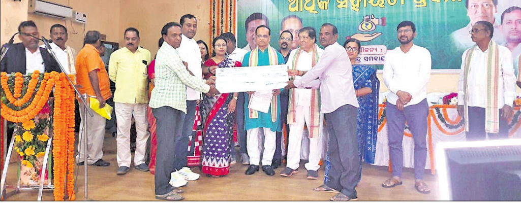
ଟେକ୍ ପ୍ରଦାନ ଅବସରରେ ବିଧାୟକ ଗୋପାଳନାଥ ନାଥ ମିତ୍ର ଏବଂ ଅନ୍ୟ ଅତିଥି।