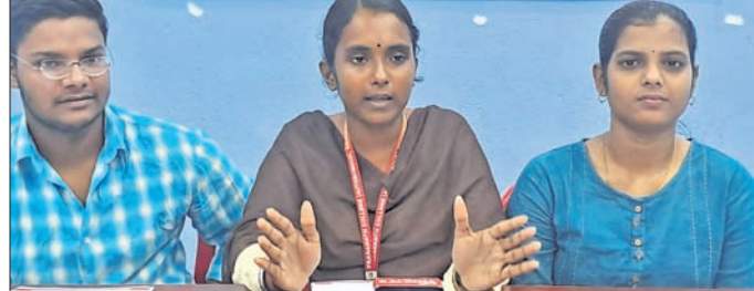
ଖବରଦାତା ସମ୍ମିଳନୀରେ ସୂଚନା ଦିଆଯାଇଛି।