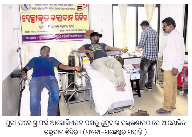
ପୁରୀ ଫଟୋଗ୍ରାଫର୍ସ ଆସୋସିଏସନ୍ ପକ୍ଷରୁ ଶୁକ୍ରବାର ରକ୍ତଚକ୍ରାଂଶୁରେ ଆୟୋଜିତ ରକ୍ତଦାନ ଶିବିର ।

ସୁପାରିଶକ୍ରମେ କରାଯାଇଛି ବୋଲି କନିଷ୍ଠ ଯତ୍ନ ଓ ବିତି ମତବ୍ୟକ୍ତ କରୁଛନ୍ତି। ରାଜ୍ୟ ସରକାରଙ୍କ ସମସ୍ତ ବିକାଶମୂଳକ କାର୍ଯ୍ୟ, ଜନସଚେତନ କାର୍ଯ୍ୟକ୍ରମ ଗ୍ରାମ ପଞ୍ଚାୟତରେ କରୁଥିବା ସ୍ତର ଏପରି କାର୍ଯ୍ୟକ୍ରମରେ ସରପଞ୍ଚମାନଙ୍କୁ ରୁହେଇ ନ ଦେବା ଦୃଷ୍ଟିରେ ଘଟଣା। ବିଭିନ୍ନ ସରକାରୀ ଅନୁଦାନ ବିଧାୟକ ପାଣ୍ଠି, ସାମ୍ବଦ ପାଣ୍ଠିର ଫଲ୍‌ସ୍‌ଫିଲ୍ କଲି ସରକାରୀ ଅର୍ଥକୁ ଆତ୍ମସାତ କରାଯାଇଛି ବୋଲି ସରପଞ୍ଚ ଏବଂ ସମିତିସଭାମାନେ ଅଭିଯୋଗ କରିଛନ୍ତି। ତେବେ ଅଭିଯୋଗ ରୁଚିକର ପୁନଃବିଚାର କରି ଯଦି ଆସନ୍ତା ସାତ ଦିନ ମଧ୍ୟରେ ସମାଧାନ ନ କରାଯାଏ ତୁଳ୍ୟ ସମ୍ମୁଖରେ ଧାରଣା ଦିଆଯିବ ବୋଲି ଚେତାବନୀ ଦେଇଛନ୍ତି।