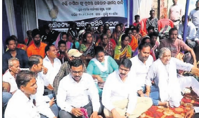
ତହସିଲ କାର୍ଯ୍ୟାଳୟ ସମ୍ମୁଖରେ ଧାରଣା ଦିଆଯାଇଛି।

ଏବଂ ସଙ୍ଗଠନ ବସ୍ତ୍ରବାସିନ୍ଦାଙ୍କୁ ଅଇଥାନ ଦାବିରେ ସ୍ୱର ଉଠାଇ ଥିଲେ ମଧ୍ୟ ସୁଫଳ ନିଳିଳା ନାହିଁ। ଏନେଇ କଟଣା ନାଗରିକ