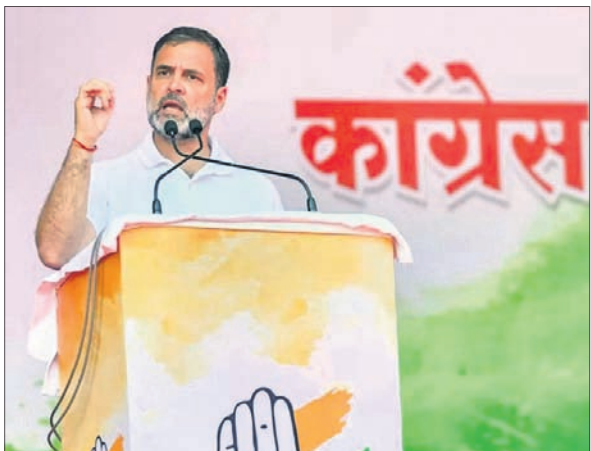
ମଧ୍ୟପ୍ରଦେଶର ସାତନାଠାରେ ଉଦ୍ଦେଶ୍ୟରେ ଦେଇଛନ୍ତି ରାହୁଲ ଗାନ୍ଧୀ।

ଭୋପାଳ, ୧୦/୧୧ ନଭେମ୍ବର: କାଂଗ୍ରେସ ନେତା ରାହୁଲ ଗାନ୍ଧୀ କଂଗ୍ରେସ ଦଳରେ ପରିବର୍ତ୍ତନ ଆଣିବ ବୋଲି କଂଗ୍ରେସ ନେତା ରାହୁଲ ଗାନ୍ଧୀ ଶୁକ୍ରବାର କହିଛନ୍ତି। ମଧ୍ୟପ୍ରଦେଶ ବିଧାନସଭା ନିର୍ବାଚନ ଜିତି କଂଗ୍ରେସ କ୍ଷମତାକୁ ଆସିଲେ, ଜାତି ଜନଗଣନା ତୁରନ୍ତ କାର୍ଯ୍ୟକାରୀ କରାଯିବ ବୋଲି ରାହୁଲ ପ୍ରତିଶ୍ରୁତି ଦେଇଛନ୍ତି। ଆସନ୍ତା ୧୭ ତାରିଖରେ ମଧ୍ୟପ୍ରଦେଶ ବିଧାନସଭା ନିର୍ବାଚନ ହେବାକୁ ଥିବାବେଳେ ସାତନାଠାରେ ଏକ ରାଲିକୁ ଉଦ୍ଦେଶ୍ୟରେ ଦେଇ ରାହୁଲ କହିଥିଲେ, ଅନ୍ୟାନ୍ୟ ପକ୍ଷର ବର୍ଗକୁ ବାସ୍ତବ ସଂଖ୍ୟା ଜାଣିବାକୁ ହେଲେ ଜାତି ଜନଗଣନା କଂଗ୍ରେସ ସରକାରଙ୍କ ପ୍ରଥମ କାର୍ଯ୍ୟ ହେବ।