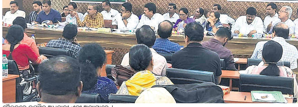
ବୈଠକରେ ଉପସ୍ଥିତ ଅଧିକାରୀ ଏବଂ ଅନ୍ୟମାନେ ।

ଅଗ୍ରଗତ ସମ୍ପର୍କରେ ସମୀକ୍ଷା କରାଯାଇଛି। ପ୍ରକଳ୍ପ ଅଧିକାରୀ ଏହି ବୈଠକରେ କୃଷି, ଜଳସେଚନ, ପାନୀୟ ଜଳ, ଗମନାଗମନ, ସ୍ୱାସ୍ଥ୍ୟ, ଖାଉଟି, ଶିଶୁ ବିକାଶ ଆଦି ବିଭାଗର କାର୍ଯ୍ୟକ୍ରମ ସମ୍ପର୍କରେ ଆଲୋଚନା କରାଯାଇଥିଲା। ଏହାଛଡା ପିପିଲି ଗ୍ରାମ୍ୟ ଉନ୍ନୟନ ବିଭାଗ ଅଧୀନରେ ଥିବା ସିପ୍ଟର, ନୂଆ ଶାସନ ଏବଂ ସିପ୍ଟର ଅଧିକାରୀଙ୍କ ସମେତ ନିର୍ଦ୍ଦେଶ ଦିଆଯାଇଥିବା କାର୍ଯ୍ୟଗୁଡ଼ିକ ଶେଷ କରିବା ପାଇଁ ନିର୍ଦ୍ଦେଶ ଦେଇଥିଲେ।