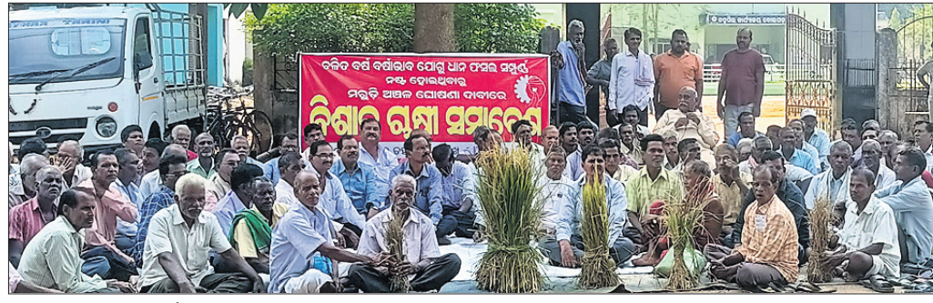
ବୋଲଗଡ଼ ତହସିଲ କାର୍ଯ୍ୟାଳୟ ସମ୍ମୁଖରେ ଚାଷୀମାନେ ଧାରଣାରେ ବସିଛନ୍ତି।

ଜଳସେଚନର ସୁବିଧା ନ ଥିବା ଓ ବର୍ଷା ଅଭାବରୁ ବୋଲଗଡ଼ ରୁକ୍ ଅଞ୍ଚଳରେ ଜମି ଫାଟି ଥିବା କିଛି ସହ ଧାନକେଣ୍ଡା ଶୁଖିଗଲାଣି। ତୁରନ୍ତ ଜଳସେଚନର ସୁବିଧା ନ କରାଗଲେ ରୁକ୍ ଅଞ୍ଚଳର ୮୦ ପ୍ରତିଶତ ଧାନ ଫସଲ ନଷ୍ଟ ହୋଇଯିବ। ଆଶଙ୍କା ରହିଛି। ଏପରିକି ମରୁଡ଼ି ଭଳି ସ୍ଥିତି ଉଠିଲାଣି। ଫଳରେ ବ୍ୟାଙ୍କ, ଅନାମ୍ୟ ସଂସ୍ଥା ଓ ମହାଜନଙ୍କଠାରୁ ରଶି ନେଇଥିବା ଚାଷୀ କିପରି ଶୁଦ୍ଧିବ ତିଆରି କରନ୍ତୁ ବୋଲି କାର୍ଯ୍ୟାଳୟ ସମ୍ମୁଖରେ ସମ୍ବନ୍ଧୀୟ ଚାଷୀ ସମଘର ଆବାହକ ସମ୍ବନ୍ଧୀୟ ପ୍ରତିରୋଧୀ ପଦକ୍ଷେପ ନେବେ ଏକ କୃଷକ ସମାବେଶ ଅନୁଷ୍ଠିତ ହୋଇଯାଇଛି। ଏଥିରେ ବୋଲଗଡ଼ ପଞ୍ଚାୟତ କଂଗ୍ରେସ