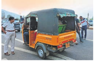
ନିରାକାରପୁର, ୧୦।୧୧ (ମାନବ ଚକ୍ର ପଞ୍ଚନାୟକ)

ନିରାକାରପୁର ଥାନା ପକ୍ଷରୁ ଶୁକ୍ରବାର ୧୨ ନମ୍ବର ଡାକରା ରାଜପଥରେ ମଲାଗୁଣି ଡ୍ରକ୍ ନିକଟରେ ଯାନବାହନ ଯାଞ୍ଚ କରାଯାଇଛି। ଯାଞ୍ଚ ବେଳେ କେତେକଟା ବିନା ହେଲମେଟଧାରୀ, ବିନା ବ୍ରାକେଟ୍ ରାଇସେନ୍ସଧାରୀ ଓ ବୁଡ ବେଗରେ ଗାଡି ଚାଳନା କରୁଥିବା ଚାଳକଙ୍କଠାରୁ ଜରିମାନା ଆଦାୟ କରାଯାଇଛି। ଏମାନଙ୍କଠାରୁ ୧୫ ହଜାରରୁ ଊର୍ଦ୍ଧ୍ୱ ଟଙ୍କା ରାଜସ୍ୱ ଆଦାୟ ହୋଇଥିବା ସ୍ୱତନ୍ତ୍ରପଦକ୍ତର ଦାସାଳିଶା ନାୟକ ସୂଚନା ଦେଇଛନ୍ତି। ଆଗାମୀ ଦିନରେ ମଧ୍ୟ ଚଢ଼ାଇ ଜାରି ରହିବ ବୋଲି ଥାନା ଅଧିକାରୀ ସୂଚିତ। ଜେନା କହିଛନ୍ତି। ଯାଞ୍ଚ ସମୟରେ ଥାନାର ସମସ୍ତ କର୍ମଚାରୀ ଉପସ୍ଥିତ ଥିଲେ।