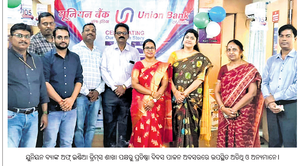
ସୁନୟନ ବ୍ୟାଙ୍କ ଅଫ ଇଣ୍ଡିଆ ଡ୍ରିମ୍‌ସ ଶାଖା ପକ୍ଷରୁ ପ୍ରତିଷ୍ଠା ଦିବସ ପାଳନ ଅବସରରେ ଉପସ୍ଥିତ ଅତିଥି ଓ ଅନ୍ୟମାନେ।

ଆମ ଓଡ଼ିଶା ନବୀନ ଓଡ଼ିଶା କାର୍ଯ୍ୟକ୍ରମର ସମୀକ୍ଷା ବୈଠକ