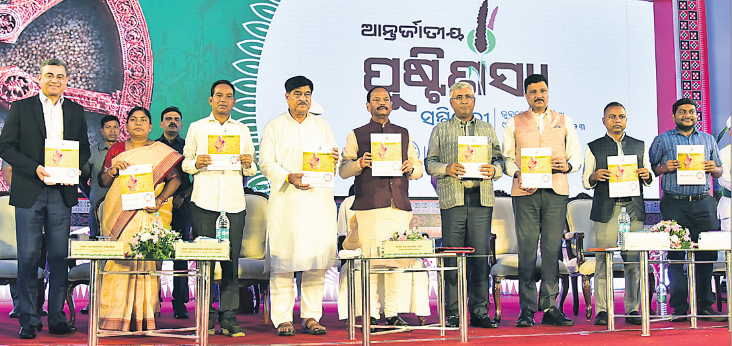
ରାଜ୍ୟ କୃଷି ଓ କୃଷକ ସଶକ୍ତୀକରଣ ବିଭାଗ ପକ୍ଷରୁ ଭୁବନେଶ୍ଵରସ୍ଥିତ ଜନତା ମଇଦାନରେ ଚାଳିଥିବା ଆନ୍ତର୍ଜାତୀୟ ମିଲେଟ୍ ସମ୍ମିଳନୀର ଶୁଭକାରୀ ଉଦ୍ଘାଟନ ଅବସରରେ ରାଜ୍ୟପାଳ ରଘୁବର ଦାସ ଏବଂ ଅନ୍ୟ ଅତିଥିମାନେ 'ରିପୋର୍ଟ୍ ଅଂ ମିଲେଟ୍ ଆଣ୍ଡ ଏକ୍ସପ୍ଲୋର ଉନ୍ନତୀକରଣ କରୁଛନ୍ତି।