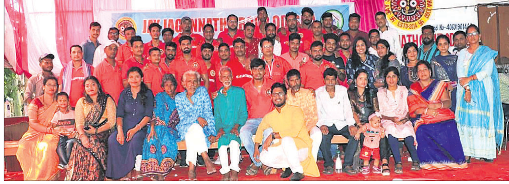
ଜୟଜଗନ୍ନାଥ ସଂଗଠନର ସଭ୍ୟସଭ୍ୟା।

ଧରି ରାଜ୍ୟର ୧୩ଟି ଜିଲ୍ଲାରେ ସେବା ଯୋଗାଇ ଦେଇ ଆସୁଛି ଏହି ସଂଗଠନ, ଯେଉଁଥିରେ ବର୍ତ୍ତମାନ ସଦସ୍ୟ ସଂଖ୍ୟା ୭୫୫ରୁ ଊର୍ଦ୍ଧ୍ୱ। ଓଡ଼ିଆଳ ପରମ୍ପରା ଓ ପର୍ବପର୍ବାଣିମାନଙ୍କରେ ଲୋକଙ୍କୁ ସଚେତନ କରାଇବା ସହ ଅନେକ ଅସହାୟ ପରିବାରକୁ ସାହାଯ୍ୟ ସହଯୋଗ ଯୋଗାଇ ଦେଇ କୁନି କୁନି ଶିଶୁ ବୃଦ୍ଧ ବୃଦ୍ଧାମାନଙ୍କ ପୂର୍ଣ୍ଣ ହସ ଫୁଟାଇ ଆସୁଅଛନ୍ତି ସଦସ୍ୟମାନେ। କଟକ ଜିଲ୍ଲା ପୁଲିକାଶୀର ଗ୍ରାମ୍ୟାଞ୍ଚଳରେ