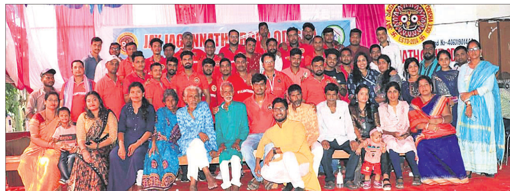
ଜୟଜଗନ୍ନାଥ ସଂଗଠନର ସଭ୍ୟସଭ୍ୟା।

ପୂଜା କରିବାର ସମସ୍ତ ବ୍ୟବସ୍ଥା ମଧ୍ୟ ଆୟୋଜନ କରାଯାଇଛି। ସେଠାରେ ସଭିଙ୍କୁ ଏକାଠି ଦେଶ ଓ ରାଜ୍ୟର ମଙ୍ଗଳ ପାଇଁ ଦୀପ ଜଳାଇ ଭଗବାନଙ୍କୁ ପ୍ରାର୍ଥନା କରିବେ। ଏହାବ୍ୟତୀତ ବସ୍ତ୍ରାଞ୍ଚଳରେ ରହୁଥିବା ଅଭାବୀ କୁନି କୁନି ପିଲାମାନଙ୍କୁ ଦୀପାବଳିରେ ଖୁସି ଦେବା ପାଇଁ ନୂତନ ବସ୍ତ୍ର, ଶାତବସ୍ତ୍ର, ଚପଲ ଓ ସ୍କୁଲ ବ୍ୟାଗ୍, ବହି ଖାତା ଓ ମିଠା ଏହିପରି ଅନେକ ଆବଶ୍ୟକ ସାମଗ୍ରୀ ଯୋଗାଇ ଦେବାକୁ ଯୋଜନା ରଖିଛନ୍ତି।