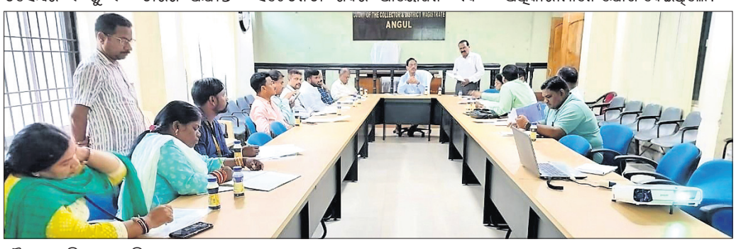
ବୈଠକରେ ଜିଲା ସ୍ୱାସ୍ଥ୍ୟ ବିଭାଗ ଅଧିକାରୀଙ୍କ ସମେତ ଅନ୍ୟମାନେ।