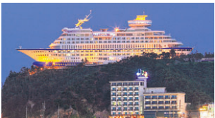
ହୋଟେଲ ଉପରେ ପଡୁଥିବା ବାହାର ସୌନ୍ଦର୍ଯ୍ୟ ଖୁବ୍ ନିଆରା। ହୋଟେଲଟିରେ ୨୧୧୯ ରୁମ୍, କୁର୍, ଖିଚର ପୁଲ୍ ଆଦି ରହିଛି।

ମଣିଷ ଆକୃତିର ହୋଟେଲ: ଚାଇନାର ହେବେଇ ପ୍ରେଭିନ୍‌ରେ ରହିଛି ମଣିଷ ଆକୃତିର ଏକ ହୋଟେଲ, ଯାହାର ନାମ ତିଆଁ ହୋଟେଲ। ଏଠାରେ ତିନିଜଣ ବୃଦ୍ଧଙ୍କ ଆକୃତି କରାଯାଇଛି ଏବଂ ଏହାର ନାମ ଫୁ, ଲୁ ଏବଂ ଶୁ ରଖାଯାଇଛି। ଯାହାର ଅର୍ଥ ଭାଗ୍ୟ, ସମୃଦ୍ଧି, ଦୀର୍ଘଜୀବନ। ତେବେ ଏହା ପୃଥିବୀର ବୃହତ୍ତମ ଜମେନ୍‌ସି ଗର୍ଭିତ ଭାବେ ବିନିକ୍ତ ରେକର୍ଡରେ ମଧ୍ୟ ସ୍ଥାନ ପାଇଛି। ବିକି ହୋଟେଲ ବା ପାଣିଜାହାଜ ଆକୃତିର ହୋଟେଲ: ସାଉଥ କୋରିଆରେ ରହିଛି ସନ୍ ଜୁକଲ୍ ନାମକ ଏକ ରିସର୍ଟ। ହୋଟେଲଟି ପାଣିଜାହାଜ ଆକୃତିରେ ତିଆରି ହୋଇଛି, ଯାହା ସେଠାରେ ଥିବା ପାହାଡ଼ ଉପରେ ଅବସ୍ଥିତ। ସୂର୍ଯ୍ୟକିରଣ ଓ ପ୍ରାକୃତିକ ସୌନ୍ଦର୍ଯ୍ୟ ପାଇଁ ଏହି ସ୍ଥାନଟି ବେଶ୍ ପ୍ରସିଦ୍ଧ। ତେଣୁ ପୂର୍ଯ୍ୟକ ପ୍ରଥମ ବିରାଟ