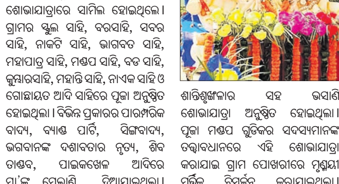
ଶାନ୍ତିଶୃଙ୍ଖଳାର ସହ ଭବାଣୀ ଶୋଭାଯାତ୍ରା ଅନୁଷ୍ଠିତ ହୋଇଥିଲା। ପୂଜା ମଣ୍ଡପ ବୃତ୍ତିକର ସଦସ୍ୟମାନଙ୍କ ତତ୍ତ୍ୱାବଧାନରେ ଏହି ଶୋଭାଯାତ୍ରା କରାଯାଇ ଗ୍ରାମ ପୋଖରୀରେ ମୁଖ୍ୟମା'ଙ୍କୁ ମେଲାଣି ଦିଆଯାଇଥିଲା।

ଡାକଟେର, ୧୧/୧୧ (ମନୋଜ ନନ୍ଦ) ଡାକଟେର ରୁକ ଘଣ୍ଟପଡ଼ା ଗ୍ରାମରେ ମା' ଲକ୍ଷ୍ମୀଙ୍କ ଭବାଣୀ ଉତ୍ସବ ଶିବିରର ଅନୁଷ୍ଠିତ ହୋଇଯାଇଛି। ଏହି ଅବସରରେ ମା' ଲକ୍ଷ୍ମୀଙ୍କୁ ବିଭିନ୍ନ ସୁସଜ୍ଜିତ ମେଢ଼ରେ ଶୋଭାଯାତ୍ରା ମାଧ୍ୟମରେ ଗ୍ରାମ ପରିକ୍ରମା କରାଯାଇଥିଲା। ମୋଟ ୨୧ଟି ପୂଜା ମଣ୍ଡପ ମଧ୍ୟରୁ ୧୮ଟି ମେଢ଼ ଭବାଣୀ ଶୋଭାଯାତ୍ରାରେ ସାମିଲ ହୋଇଥିଲେ। ଗ୍ରାମର ସ୍କୁଲ ସାହି, ବରସାହି, ସର ସାହି, ନାକଟି ସାହି, ଭାଗବତ ସାହି, ମହାପାତ୍ର ସାହି, ମଣ୍ଡପ ସାହି, ବତ ସାହି, କୁମାରସାହି, ମହାନ୍ତି ସାହି, ନାଏକ ସାହି ଓ ଗୋସାଇଁ ସାହି ଆଦି ସାହିରେ ପୂଜା ଅନୁଷ୍ଠିତ ହୋଇଥିଲା। ବିଭିନ୍ନ ପ୍ରକାରର ପାରମ୍ପରିକ ବାଦ୍ୟ, ବ୍ୟାଞ୍ଜ ପାଠ, ସିନ୍ଧବାଦ୍ୟ, ଭଗବାନଙ୍କ ପଶାବତାର ନୃତ୍ୟ, ଶିବ ପାଞ୍ଜରୀ, ପାଇକଖେଳ ଆଦିରେ ମୁଖ୍ୟମା'ଙ୍କୁ ମେଲାଣି ଦିଆଯାଇଥିଲା।