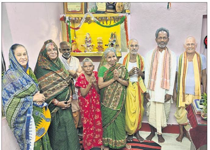
ଶ୍ରୀମନ୍ଦିର ସେବାଶ୍ରମରେ ଅନ୍ତେବାସୀ।

ଆଜି ହେଉଛି ଆଲୋକର ପର୍ବ ଦୀପାବଳି। ସଭିଙ୍କ ମନରେ ଭରି ରହିଛି ଆନନ୍ଦ। କିଏ ଦୀପ ଓ ଭଜନ ଗାନ କରିବେ ଆଲୋକରେ ଘର ସଜାଡ଼ିଛନ୍ତି ତ ଆଉ କିଏ ବାଣ ଫୁଟାଇବାକୁ ନେଇ ଶ୍ରେଣୀଭିତ୍ତିତ ତେବେ ଏମିତି ବି କିଛି ଯୁବତୀମାନେ ଅଛନ୍ତି, ଯେଉଁମାନେ ଏସବୁ ପରିବର୍ତ୍ତେ ଏକାଠି ହୋଇ ନିରାପଦ