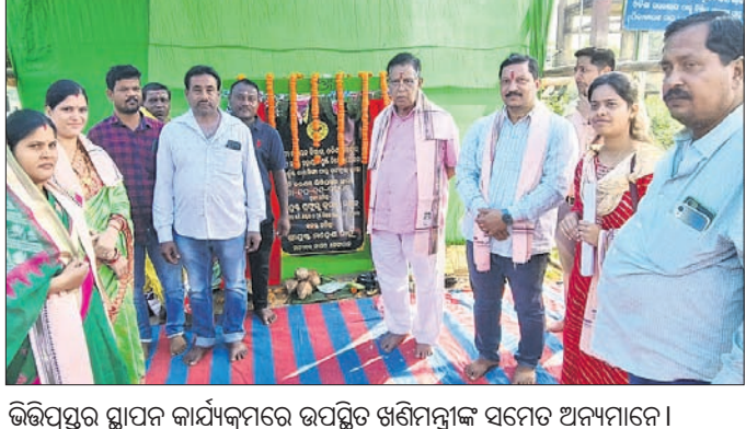
ଭିତ୍ତିପ୍ରସ୍ତର ସ୍ଥାପନ କାର୍ଯ୍ୟକ୍ରମରେ ଉପସ୍ଥିତ ଶଶିମନ୍ତ୍ରୀଙ୍କ ସମେତ ଅନ୍ୟମାନେ।