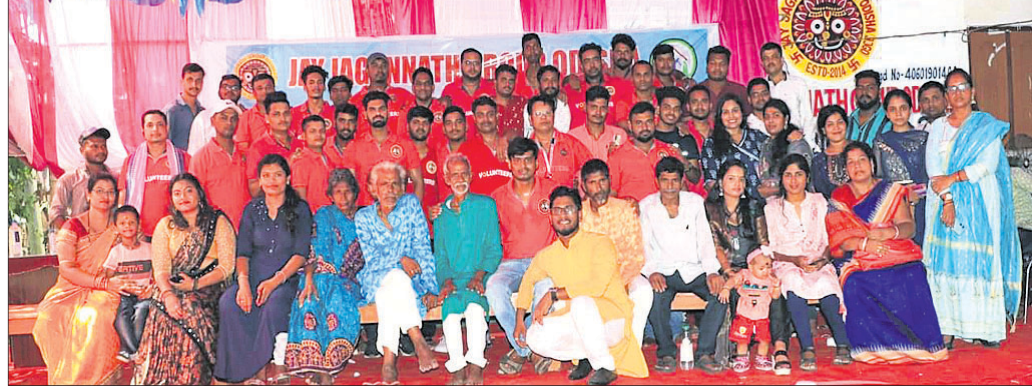
ଜୟଜଗନ୍ନାଥ ସଂଗଠନର ସଭ୍ୟସଭ୍ୟା।

ଧରି ରାଜ୍ୟର ୧୩ଟି ଜିଲ୍ଲାରେ ସେବା ଯୋଗାଇ ଦେଇ ଆସୁଛି ଏହି ସଂଗଠନ, ଯେଉଁଥିରେ ବର୍ତ୍ତମାନ ସଦସ୍ୟ ସଂଖ୍ୟା ୭୫୫ରୁ ଊର୍ଦ୍ଧ୍ୱ। ଓଡ଼ିଆଙ୍କ ପରମ୍ପରା ଓ ପର୍ବପର୍ବାଣିମାନଙ୍କରେ ଲୋକଙ୍କୁ ସଚେତନ କରାଇବା ସହ ଅନେକ ଅସହାୟ ପରିବାରକୁ ସାହାଯ୍ୟ ସହଯୋଗ ଯୋଗାଇ ଦେଇ କୁନି କୁନି ଶିଶୁ ବୃଦ୍ଧଙ୍କୁ ମୁହଁରେ ହସ ଫୁଟାଇ ଆସୁଅଛନ୍ତି ସଦସ୍ୟମାନେ। କଟକ ଜିଲ୍ଲା ପୁଲିକଶାସନିତ ବ୍ରାହ୍ମଣଝରିଲୋରେ