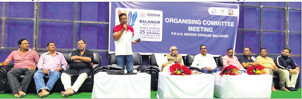
ବଲାଙ୍ଗୀର ପୃଥ୍ୱୀରାଜ ହାଲସ୍କୁଲ ଇନ୍‌ଡୋର ସ୍ଥାପନାରେ ଜାତୀୟ ସର୍ବଜୁନିୟର ବ୍ୟାଡ୍ମିଣ୍ଟନ ଚାମ୍ପିୟନଶିପ୍ ବିଷୟରେ ସୂଚନା ଦିଆଯାଇଛି ।

ବଲାଙ୍ଗୀର, ୧୧/୧୧ (ବାରେନ୍ଦ୍ର କୁମାର ଝାଙ୍କର) ଆସନ୍ତା ୨୧ରୁ ୨୪ ତାରିଖ ପର୍ଯ୍ୟନ୍ତ ବଲାଙ୍ଗୀର ପୃଥ୍ୱୀରାଜ ହାଲସ୍କୁଲ ଇନ୍‌ଡୋର ସ୍ଥାପନାରେ ଜାତୀୟ ସର୍ବଜୁନିୟର (୧୩ ବର୍ଷ ବୟସ ବର୍ଗ) ବ୍ୟାଡ୍ମିଣ୍ଟନ ଚାମ୍ପିୟନଶିପ୍ ଅନୁଷ୍ଠିତ ହେବ । ଭାରତୀୟ ବ୍ୟାଡ୍ମିଣ୍ଟନ ସଂଘ, ରାଜ୍ୟ ବ୍ୟାଡ୍ମିଣ୍ଟନ ସଂଘ ଏବଂ ଜିଲ୍ଲା ବ୍ୟାଡ୍ମିଣ୍ଟନ ସଂଘ ମିଳିତ ଆନୁକୁଲ୍ୟରେ ଆୟୋଜିତ ହେବାକୁ ଥିବା ଏହି ଚାମ୍ପିୟନଶିପ୍ରେ ଦେଶର ସମସ୍ତ ରାଜ୍ୟ ଏବଂ ଦୁଇଟି କେନ୍ଦ୍ରଶାସିତ ଅଞ୍ଚଳର ୪୫୦ରୁ ଊର୍ଦ୍ଧ୍ୱ