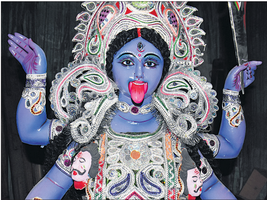
ଭୁବନେଶ୍ୱର ଲକ୍ଷ୍ମୀସାଗର ବେଙ୍ଗଲି କଲୋନୀ ସଂଘଟ୍ରୀ କୁଳ ପକ୍ଷରୁ ନିର୍ମିତ ମା' କାଳୀଙ୍କ ମୂର୍ତ୍ତୀ। (ମନୋରଞ୍ଜନ ମିଶ୍ର)