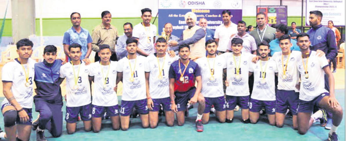
ଆଞ୍ଚଳିକ ବିଶ୍ୱବିଦ୍ୟାଳୟ ଭଲିବଲ୍ ଚାମ୍ପିୟନଶିପ ବିଜେତା କିର୍ ଦଳ ।

ବିଶ୍ୱବିଦ୍ୟାଳୟକୁ ପରାସ୍ତ କରିଥିଲା । ଏହି ୪ଟି ଦଳ ସର୍ବଭାରତୀୟ ଆଞ୍ଚଳିକ ବିଶ୍ୱବିଦ୍ୟାଳୟ, ଆଞ୍ଚଳିକ ଭଲିବଲ୍ (ପୁରୁଷ) ଚାମ୍ପିୟନଶିପ ପାଇଁ ଯୋଗ୍ୟତା ଅର୍ଜନ କରିଛି । ଏହି ସର୍ବଭାରତୀୟ ପ୍ରତିଯୋଗିତା ଆସନ୍ତା ଡିସେମ୍ବରରେ କୁରୁକ୍ଷେତ୍ର ବିଶ୍ୱବିଦ୍ୟାଳୟ ପରିସରରେ ଅନୁଷ୍ଠିତ ହେବ ।