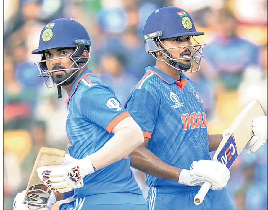
ଦୁଇ ଶତକ ହାସଲକାରୀ ଲୋକେଶ ରାହୁଲ ଓ ଶ୍ରେୟ ଅଧୀନ।

ଅଧିକ ପାଇଁ ବିରାଟ କୋହଲି, ରୋହିତ ଶର୍ମା, ସୂର୍ଯ୍ୟକୂମାର ଯାଦବ ଓ ଶୁଭମନ ଚିଲ୍ଲଙ୍କୁ ବୋଲି କରୁଥିବାର ଦେଖିବାକୁ ମିଳିଥିଲା। ଏପରି କି କୋହଲି ଓ ରୋହିତ ଅତିମ ଦୁଇ ଉଇକେଟ ନେଇଥିଲେ। ଭାରତ ପକ୍ଷରୁ ଶୁଭମନ ଚିଲ୍ଲ ଓ ରୋହିତ ଶର୍ମା ପ୍ରଥମ ଉଇକେଟରେ ମାତ୍ର ୭୧ ବଲ୍ରେ ୧୦୦ ରନ ଯୋଡ଼ିଥିଲେ। ୩୨ ବଲ୍ ଖେଳି ମାତ୍ର ୧୨୦ଟି ଓଭରରେ ପ୍ୟାକିସ୍ତାନ ଫେରିଥିଲେ। ଏହାର