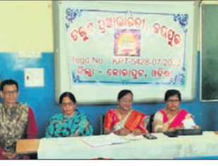
କରପୁର, ୧୩୧୧