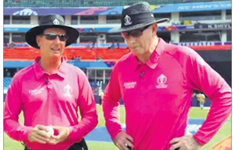
ଚିରାଟ ଇନିଙ୍ଗ୍ସ ଓ ଚଳିତ ଟକର।

ଚଳିତ ଆଇସିସି ଦିନିକିଆ କ୍ରିକେଟ ବିଶ୍ୱକପରେ ଭାରତ ଓ ଲୁକ୍ସମ୍ବର୍କ ମଧ୍ୟରେ ଖେଳାଯିବାକୁ ଥିବା ପ୍ରଥମ ସେମିଫାଇନାଲ ମ୍ୟାଚ୍ରେ ଫିଲ୍ଡ ଅନୁମୋଦିତ ଦାୟିତ୍ୱ ଚୁକ୍ତିଭାବେ ଚଳିତ ଟକର ଓ ଚିରାଟ ଇନିଙ୍ଗ୍ସ ଓ ଅଧିକ୍ଷକ ଆପ୍ତିକା ମଧ୍ୟରେ ଖେଳାଯିବାକୁଥିବା ଦ୍ୱିତୀୟ ସେମିଫାଇନାଲ ମ୍ୟାଚ୍ରେ ନାଟୀନ ମେମନ ଓ ଚିରାଟ କେଟଲବୋରୋ ଅନୁମୋଦିତ କରିବେ। ପ୍ରଥମ ସେମିଫାଇନାଲ ମୁହାଁଇରେ ନଭେମ୍ବର ୧୫ରେ ଏବଂ ଦ୍ୱିତୀୟଟି ନଭେମ୍ବର ୧୬ରେ କୋଲକାତାରେ ଖେଳାଯିବ। ସୁଚନାଯୋଗ୍ୟ, ପୂର୍ବରୁ ୨୦୧୯ ବିଶ୍ୱକପରେ ଭାରତ ଓ ଲୁକ୍ସମ୍ବର୍କ ମଧ୍ୟରେ ଖେଳାଯାଇଥିବା ସେମିଫାଇନାଲରେ ଇନିଙ୍ଗ୍ସ ଓ ଅଧିକ୍ଷକଙ୍କୁ ଅନୁମୋଦିତ କରିଥିଲା। ଏଥିରେ ଲୁକ୍ସମ୍ବର୍କ ୧୮ ରନରେ ବିଜୟ ଲାଭ କରିଥିଲା। ଓଲ୍ଡ ଟ୍ରାଫୋର୍ଡ଼ରେ ଖେଳାଯାଇଥିବା ଏହି ମ୍ୟାଚ୍ରେ