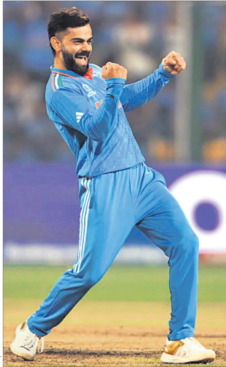
ନେଦରଲାଣ୍ଡ ବିପକ୍ଷରେ ଉଇକେଟ ନେବାପରେ ଉଲ୍ଲାସିତ ବିରାଟ କୋହଲି।