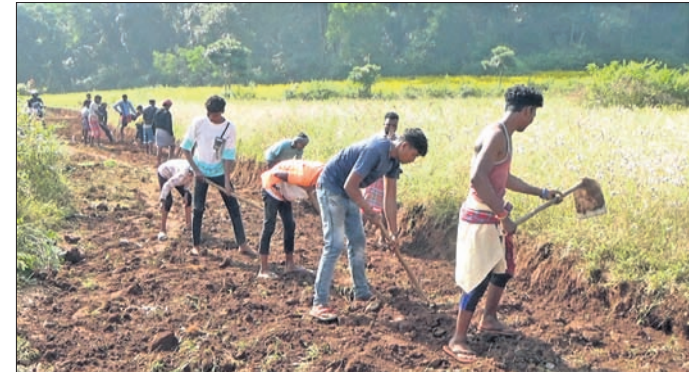
ଗ୍ରାମବାସୀ ରାସ୍ତା ନିର୍ମାଣ କରୁଛନ୍ତି।

ଶୁଣାଣି ପ୍ରଶାସନ ହାତରେ କୋଡି କୋଡିଏ ଗ୍ରାମର ଛୋଟ ଛୋଟ ଠାକୁରଦ୍ୱାରୀ ପର୍ଯ୍ୟନ୍ତ ସମସ୍ତେ ରାସ୍ତା ତିଆରି କରନ୍ତି। ଏପରି ଦେଖିବାକୁ ମିଳିଛି କୋରାପୁଟ ପୌର ପରିଷଦ ୧୬ ନମ୍ବର ଖର୍ଚ୍ଚ ବିହୀନ ଗ୍ରାମରେ। କୋରାପୁଟ ସହରଠାରୁ ମାତ୍ର ୩ କି.ମି. ଦୂରରେ ଥିବା ଚିନ୍ତାମଣିଗ୍ରାମ ଗ୍ରାମରେ ୬୦୦ ଉର୍ଦ୍ଧ୍ୱ ପରିବାର ବାସ କରନ୍ତି। ଗ୍ରାମରୁ ସହରକୁ ନିକଟବିଭିନ୍ନକାର୍ଯ୍ୟରେ ଯିବା ଲାଗି ଭଲ ରାସ୍ତାଟିଏ ନାହିଁ। ସାଧାରଣତଃ ଚାନ୍ଦି କାର୍ଯ୍ୟ ଓ କୁଳି ବୃତ୍ତି ଉପରେ ନିର୍ଭର କରୁଥିବା ଗ୍ରାମବାସୀ ଖରାପ ହୋଇଯାଇଥିବା ରାସ୍ତା ଉପରେ ନିର୍ଭର କରନ୍ତି। କେବଳ ଗ୍ରାମବାସୀ ନୁହଁନ୍ତି ଏହି ରାସ୍ତା ଦେଇ ସ୍କୁଲ କଲେଜକୁ ଯାଉଥିବା ଛାତ୍ରଛାତ୍ରୀମାନେ ମଧ୍ୟ ଅସୁବିଧାର ସମ୍ମୁଖୀନ ହୋଇଥାନ୍ତି। ଶୋଚନୀୟ ରାସ୍ତା ଯୋଗୁ ଗ୍ରାମକୁ