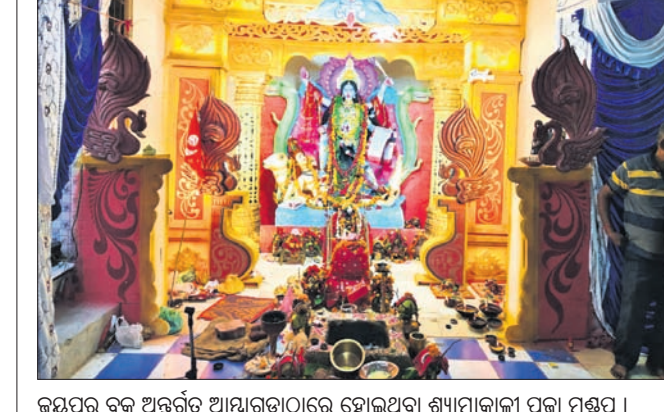
କରପୁର ବ୍ଲକ ଅନ୍ତର୍ଗତ ଆହୁଲୀଗ୍ରାମରେ ଶ୍ୟାମାକାଳୀ ପୂଜା ମଣ୍ଡପ।

ଇନ୍ଦ୍ରପ୍ରସାଦ ରେସିଡେନ୍ସିଆଲ ଏକ୍ସକ୍ୟୁଟିଭ ପ୍ରୋଗ୍ରାମକୁ ନାଲକୋର ଇତି ଇଂ. ସୁଶୀଳ ଖଣି ପାରିପାର୍ଶ୍ୱିକ ଗ୍ରାମର ୪୯ ଛାତ୍ରାଛାତ୍ରୀଙ୍କୁ ବିଦ୍ୟାଳୟରେ ପଢ଼ିବା ପାଇଁ ବ୍ୟବସ୍ଥା କରାଯାଇଛି। ପ୍ରତି ଛାତ୍ରାଛାତ୍ରୀଙ୍କୁ ପଢ଼ିବା ପାଇଁ ନାଲକୋ ବିଏସଆର ପଞ୍ଚୋ ୩୫ ହଜାର ଲେଖାଏ ନିମ୍ନି ପ୍ରକ୍ରିୟା ଶେଷ କରିଛି। କାର୍ଯ୍ୟ କରୁଥିବା ପୁରାତନ କର୍ମଚାରୀମାନଙ୍କୁ ପ୍ରାଧାନ୍ୟ ମିଳିବ ବୋଲି ପ୍ରତିଶ୍ରୁତି ଦେଇଥିଲେ। ମାତ୍ର ଏବେ ଓକାସ୍ତା ବିଶ୍ୱାସନ ବାହାରକରି ୫୭ ସଫେଇ କର୍ମଚାରୀ, ୮ ସୁପରଭାଇଜର, ୫୪ ସୁରକ୍ଷା କର୍ମୀ ଏବଂ ଖର୍ଚ୍ଚ ଆଡେଷ୍ଟାଏ ୨୮ ପଦବୀରେ କୋରାପୁଟ ଆସି ନିମ୍ନି ପ୍ରକ୍ରିୟା ଶେଷ କରିଛି। କାର୍ଯ୍ୟ କରୁଥିବା ପୁରାତନ କର୍ମଚାରୀମାନଙ୍କୁ ପ୍ରତିଶ୍ରୁତି ଅନୁଯାୟୀ ସୁଯୋଗ ମିଳିବ। ଏହି ନିମ୍ନି ପ୍ରକ୍ରିୟାକୁ ବାଟିଲ କରି ପୁଣି ନୂତନ ନିମ୍ନି କରିବାକୁ କର୍ମଚାରୀମାନେ ଦାବି କରିଛନ୍ତି। ଯଦି ଦାବି ପୂରଣ ନ ହୁଏ ତେବେ ଆସନ୍ତା ୨୫ ତାରିଖରେ ପୁରାତନ ସମସ୍ତ କର୍ମଚାରୀ କାର୍ଯ୍ୟବନ୍ଦ କରି ହସିଗାଲ ସମ୍ମୁଖରେ ଧାରଣା ଦେବୁ ବୋଲି ସେମାନେ କହିଛନ୍ତି।