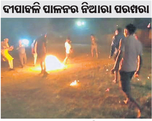
କମିଟି ସଭ୍ୟମାନେ ପୁର୍ବଲରେ ନିଆଁ ଲଗାଇ ଖେଳୁଛନ୍ତି ।

ସମ୍ବଲପୁର ଜିଲ୍ଲା ରେଡ଼ାଖୋଲ ସହରରେ ଦୀପାବଳି ପାଳନର ଏକ ସ୍ୱତନ୍ତ୍ରତା ରହିଛି । ଦୀପାବଳି ଅବସରରେ ରେଡ଼ାଖୋଲ ଯଦୁମଣି ପାଟଣା ଲକ୍ଷ୍ମୀପୁଜା କମିଟି ସଭ୍ୟମାନେ ରବିବାର ସନ୍ଧ୍ୟାରେ ପୁର୍ବଲରେ ନିଆଁ ଲଗାଇ ଖେଳିଥିଲେ । ସ୍ଥାନୀୟ ମିନି ଷ୍ଟାଡ଼ିୟମରେ ଏହି ଖେଳ ଅନୁଷ୍ଠିତ ହୋଇଥିଲା । ଅଞ୍ଚଳରେ ପ୍ରସ୍ତୁତ ଏହି ପୁର୍ବଲକୁ ସ୍ୱତନ୍ତ୍ର ଭାବେ ୩ ଦିନ ପୂର୍ବରୁ ପ୍ରସ୍ତୁତ କରାଯାଇ କିରୋସିନରେ ଜିଲାଇ ରଖାଯାଏ । ଦୀପାବଳି ସନ୍ଧ୍ୟାରେ ପ୍ରଥମେ ପୂଜାର୍ଚ୍ଚନା ପରେ ବଲରେ ନିଆଁ ଲଗାଯାଏ ଓ କମିଟି ସଭ୍ୟମାନେ ଏଥିରେ ଅଧ୍ୟକ୍ଷାଧିକାର ଖେଳିଥାନ୍ତି । ଖେଳ ପାଇଁ ୨ଟି ବଲ୍ ପ୍ରସ୍ତୁତ କରାଯାଇଥାଏ । ତେବେ ନିଆଁ ଜଳୁଥିବା ବଲ୍ ଖେଳିବାକୁ ଛୋଟ ରହିବାକୁ ସମସ୍ତଙ୍କୁ କୁହାଯାଇଥାଏ । ଖେଳିବା ସମୟରେ ସୁରକ୍ଷା