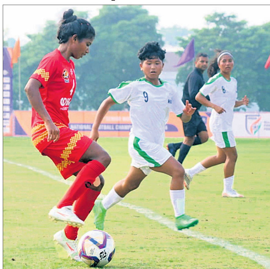
ଓଡ଼ିଶା ଓ ମେଘାଳୟ ମଧ୍ୟରେ ଅନୁଷ୍ଠିତ ମ୍ୟାଚ୍।

ଭୁବନେଶ୍ୱର, ୧୩।୧୧ (କମ ନାରାୟଣ ମେହ୍ତା) ସୁନ୍ଦରଗଡ଼ ଷ୍ଟାଡ଼ିୟମରେ ୨୮ତମ ବର୍ଷ ମହିଳା କାଚାୟ ପୁରୁଷ ଚାମ୍ପିୟନଶିପ ରବିବାର ଉଦଘାଟିତ ହୋଇଯାଇଛି। ଜିଲା କ୍ରୀଡା ସଂସଦ ଓ ପୁରୁଷ ଆସୋସିଏସନ ଅଫ ଓଡ଼ିଶାର ମିଳିତ ଆୟୁକ୍ତଙ୍କଦ୍ୱାରା ଏହା ଆରମ୍ଭ ହୋଇ ଚୁନାମାଣ ପ୍ରଥମ ଦିନରେ ଓଡ଼ିଶା ଓ ଗୋଆ ବିଜୟୀ ହୋଇଛନ୍ତି। ପ୍ରଥମ ମ୍ୟାଚ ଗୋଆ ଓ ଅରୁଣାଚଳ ପ୍ରଦେଶ ମଧ୍ୟରେ