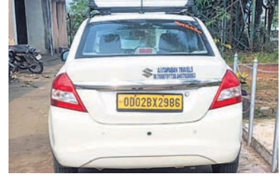
ମୃତଦେହ ନେବାରେ ବ୍ୟବହୃତ ହୋଇଥିବା ଜବତ କାର୍ ।