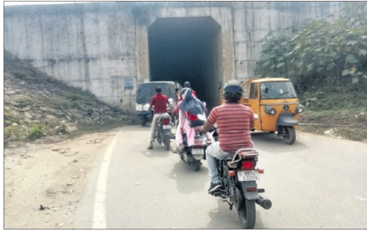
ରେଳଠାରେ ଅଣ୍ଡରପାସ୍ ଯୋଗୁ ଗ୍ରାମିକ ଜାମ୍ ଘଟିବା ଦୃଶ୍ୟ

ପାନପୋଷ ରେଳଷ୍ଟେଶନ ନିକଟରେ ବ୍ରୁଡିଙ୍ଗ ଅନଳକୁ ବୁଲି ଅଣ୍ଡର ପାସ୍ ରହିଛି। ଗୋଟିଏ ପାନପୋଷ ଛକକୁ ପାନପୋଷ ଶବ ବ୍ୟବହାର ଗୃହକୁ ସଂଯୋଗ କରୁଥିବା ବ୍ୟବସ୍ଥା ପାନପୋଷ ରେଳଠାରେ ଷ୍ଟେଶନକୁ ଗୋଷ୍ଠୀ ସାହାଯ୍ୟକେନ୍ଦ୍ରକୁ ସଂଯୋଗ କରିଛି।