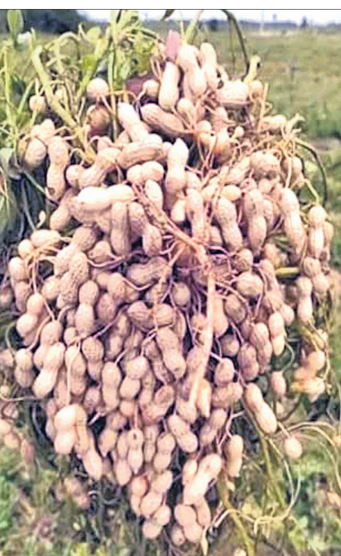
“ବାଲି ଦୋରସା ଏବଂ ଦୋରସା ମାଟି ଚିନାବାଦାମ ଚାଷ ପାଇଁ ଉପଯୋଗୀ ହୋଇଥାଏ । ଏପରିକି ହାଲୁକା ମାଟିରେ ଏହି ଚାଷ କରାଯାଇପାରିବ ଏବଂ ସେଥିରୁ ଭଲ ଅମଳ ମଧ୍ୟ ମିଳିଥାଏ । ଏହି ମାଟିର ଅମ୍ଳ ପରିମାପକ ମୂଲ୍ୟ ୫.୫-୬.୫ ମଧ୍ୟରେ ରହିଥାଏ ।”

ସେ.ମି. ଓ ଗଛକୁ ଗଛ ୧୦ ସେ.ମି. ବ୍ୟବଧାନରେ ଚିନାବାଦାମ ବିହନ ବୁଣନ୍ତୁ । ଖାଦ୍ୟସାର ପରିଚାଳନା ଚିନାବାଦାମ ଚାଷ ସମୟରେ ଏକର ପ୍ରତି ୧୦ ଟନ୍ କମ୍ପୋଷ୍ଟ କିମ୍ପା ଶହା ଗୋବର ଖତ ବିହନ ବୁଣିବା ପୂର୍ବରୁ ଜମିରେ ପ୍ରୟୋଗ କରନ୍ତୁ । ୮ ଟନ୍ ନିୟ ପଡ଼ିଆ ଚାଷ କରନ୍ତୁ । ଧାଡ଼ିକୁ ଧାଡ଼ି ୨୫-୩୦