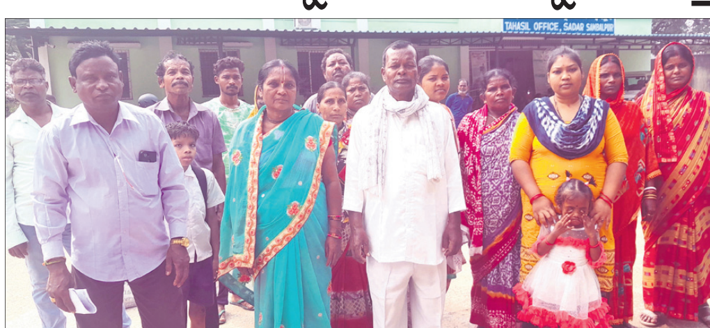
ତହସିଲଦାରଙ୍କୁ ଦାବିପତ୍ର ଦେବାକୁ ଆସିଥିବା ଦଳିତସେନା କର୍ମକର୍ତ୍ତା।