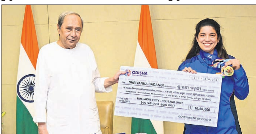
ମୁଖ୍ୟମନ୍ତ୍ରୀ ନବୀନ ପଟ୍ଟନାୟକଙ୍କଠାରୁ ଚେକ୍ ଗ୍ରହଣ କରିବା ଅବସରରେ ଶ୍ରୀୟଙ୍କା ଷଡ଼ଙ୍ଗୀ।

ପ୍ୟାରିସ୍ ଅଲିମ୍ପିକ୍ସ ପାଇଁ ଯୋଗ୍ୟତା ଅର୍ଜନ କରିଥିବା ଓଡ଼ିଶାର ତାରକା ଶୁଭ୍ର ଶ୍ରୀୟଙ୍କା ଷଡ଼ଙ୍ଗୀଙ୍କୁ ମୁଖ୍ୟମନ୍ତ୍ରୀ ନବୀନ ପଟ୍ଟନାୟକ ମଙ୍ଗଳବାର ସମର୍ଥନ କରିଛନ୍ତି।