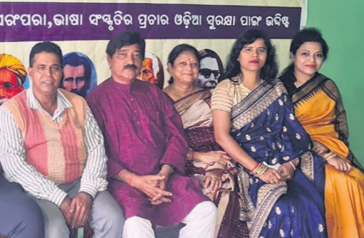
ଅନୁଷ୍ଠାନ ପକ୍ଷରୁ ସଙ୍ଗୀତ ମେଳା ଉପରେ ସୂଚନା ପ୍ରଦାନ କରାଯାଇଛି।

ରାଜରକେଲା, ୧୪।୧୧ (ବିସୁବ ରଜନ ବାଣ) ଆସନ୍ତା ୧୭ ତାରିଖ ସନ୍ଧ୍ୟାରେ ଓଡ଼ିଆ ସଙ୍ଗୀତ ଜଗତର କିମ୍ବଦନ୍ତୀ ପୁସ୍ତକ ସ୍ମରଣ ଅକ୍ଷୟ ମହାନ୍ତି ତଥା ସମସ୍ତଙ୍କ ପ୍ରିୟ ଖୋକା ଭାଇଙ୍କ ୨୧ତମ ଶ୍ରାଦ୍ଧବାର୍ଷିକୀ ପୂର୍ବେ ଓଡ଼ିଆ ପୂର୍ବର ଅନୁଷ୍ଠାନ ପକ୍ଷରୁ ପାଳନ ହେବ।