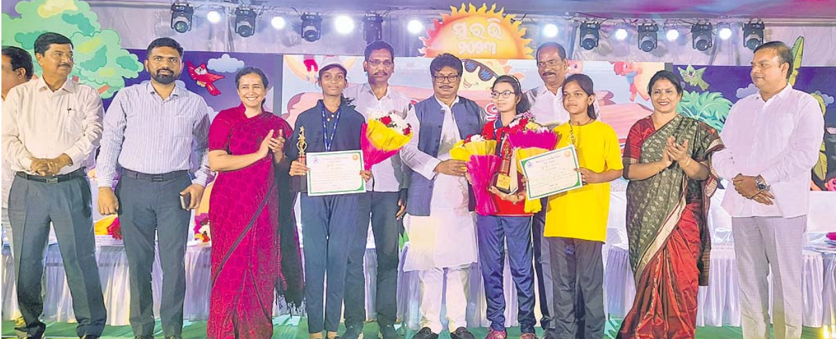
ଭୁବନେଶ୍ୱର, ୧୪।୧୧ (ଅସମାପିକା ସାହୁ)