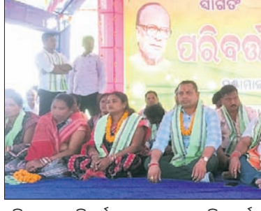
ପରିବର୍ତ୍ତନ ସମାବେଶରେ ସାମିଲ ହେଲେ ବହୁ ବିଜେଡି ନେତା

ବୌଦ୍ଧ/ବାଉଁଶୁଣୀ, ୧୪।୧୧ (ଅତିକ ଜ୍ଞାନ ବାରିକ/ଦେବାଶିଷ୍ୟ ସେନାକ)