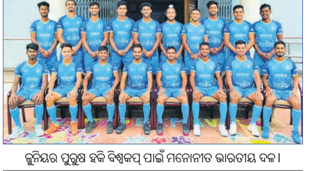
ଟୁର୍ଣ୍ଣାମେଣ୍ଟରେ ଓଡ଼ିଶାରୁ ଚାରୋଟି ଖେଳାଳିଙ୍କୁ ଭାରତୀୟ ଦଳରେ ନେଇଥିବା ଦଳ।