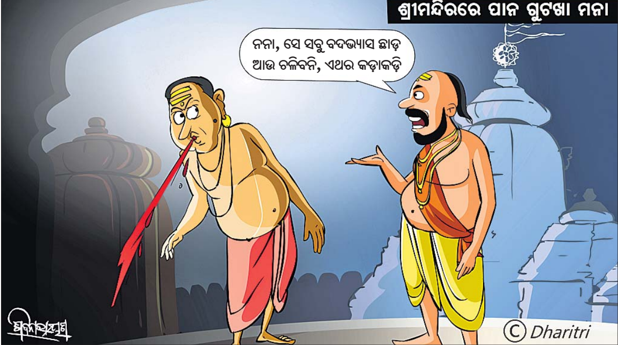
ଶ୍ରୀମନ୍ଦିରରେ ପାନ ଗୁଡ଼ା ମନା