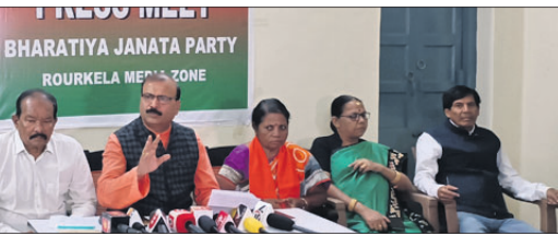
ଖବରଦାତା ସମ୍ମିଳନୀରେ ଉପସ୍ଥିତ ଭାଜପା ନେତୃମଣ୍ଡଳ।