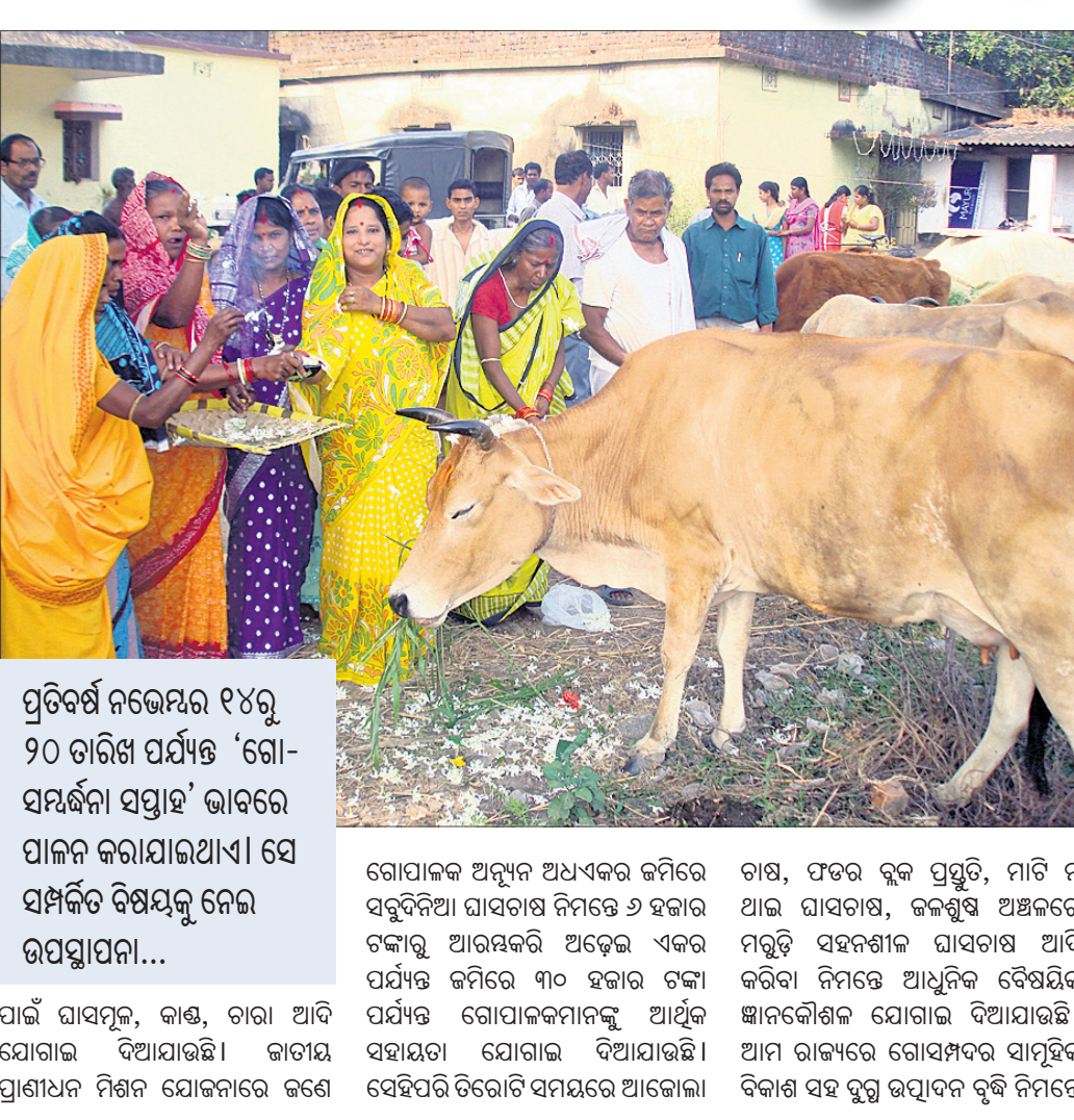
ପ୍ରତିବର୍ଷ ନଭେମ୍ବର ୧୪ରୁ ୨୦ ତାରିଖ ପର୍ଯ୍ୟନ୍ତ ‘ଗୋ-ସମ୍ବର୍ଦ୍ଧନା ସପ୍ତାହ’ ଭାବରେ ପାଳନ କରାଯାଇଥାଏ । ସେ ସମ୍ପର୍କିତ ବିଷୟକୁ ନେଇ ଉପସ୍ଥାପନା...

ଗୋମାତା ତଥା ଗୋକୁଳର ଶ୍ରେଷ୍ଠ ରକ୍ଷକ ଭାବେ ତାଙ୍କ ନାମ ‘ଗୋବିନ୍ଦ’ ଦେଲେ । ସେହିଦିନଠାରୁ ଗିରି ଗୋବର୍ଦ୍ଧନ ଓ ଗୋମାତାର ପୂଜାବିଧି ପ୍ରଚଳିତ ହୋଇ ଆସୁଅଛି । ଏହିଦିନ ଗୋଷ୍ଠୁ ଗାଧୋଇ ଦିଆଯାଇ ମଥାରେ ଅବିର, ସିନ୍ଦୂର ଓ ବେକରେ ଫୁଲମାଳ ପିନ୍ଧାଇ ଶୈଳିକ ଉପାଦାନକୁ ରୂପାନ୍ତରିତ କରିଥାଏ । ତାହା ହେଲା- କୃଷିକାର୍ତ୍ତା ବର୍ଦ୍ଧ୍ୟ ପଦାର୍ଥକୁ ସ୍ଥାନରେ ରୂପାନ୍ତରିତ କରିଥାଏ । ଗୋରୁର ମଳ ହେଉଛି ପବିତ୍ର, ଯାହାର ସଂସ୍ପର୍ଶରେ ଗୋମୟ ପରିବେଶ ସୃଷ୍ଟି ହୋଇଥାଏ । ଗୋବର ହେଉଛି ଭୂମିର ଶ୍ରେଷ୍ଠ ପ୍ରାକୃତିକ ଖାଦ୍ୟ । ଜୈବିକ ଖାଦ୍ୟଶସ୍ୟ ଉତ୍ପାଦନ କ୍ଷେତ୍ରରେ ଗୋବରର ଭୂମିକା ବିଶେଷ ରହିଛି । ଗୋମୂତ୍ର ଏକ ଅବ୍ୟର୍ଥ ଔଷଧ ରୂପେ ବ୍ୟବହାର ହୋଇଥାଏ । ପୁରାଣ କଥା ଅନୁସାରେ ଶ୍ରୀକୃଷ୍ଣ ଗୋପବାସୀ ଓ ଗୋସମ୍ପଦକୁ ପ୍ରବଳ ବୃକ୍ଷପାତରୁ ରକ୍ଷା କରିବାପାଇଁ ନିଜର ବାମ ହାତର କନିଷ୍ଠାଞ୍ଜଳିରେ ଏକାଦିଗୁଣେ ୬ ଦିନ ପର୍ଯ୍ୟନ୍ତ ଗିରିଗୋବର୍ଦ୍ଧନ ଧାରଣ କରିଥିଲେ । ବର୍ଷାର ବେଳ କମାଇବା ପାଇଁ ପ୍ରଭୁ ଶ୍ରୀକୃଷ୍ଣ ସୁଦର୍ଶନ ଚକ୍ରକୁ ନିୟୋଜିତ କରିଥିଲେ । ଶେଷରେ ଇନ୍ଦ୍ର ପରାସ୍ତ ହୋଇ ସର୍ବ ଗାଈ ସୁରକ୍ଷିତ ସହ ଆସି ଗର୍ବଦମନ ନରହରିକୁ ସ୍ମୃତିକଲେ ଓ