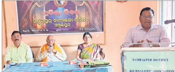
ନାଟ୍ୟକଳା ପରିଷଦର ପ୍ରତିଷ୍ଠା ଦିବସରେ ମଞ୍ଚାସୀନ ଅତିଥିମାନେ।