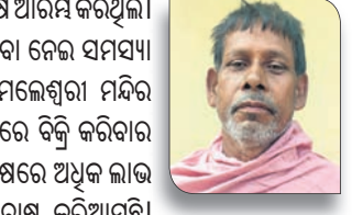
ନିରାକାର ପ୍ରଧାନ, ଫୁଲଚାଷୀ

୨୦୦୨ରେ ପ୍ରଥମେ ଗେଣ୍ଡୁଫୁଲ ଚାଷ ଆରମ୍ଭ କରିଥିଲେ। ଫୁଲ ଫୁଟିବା ପରେ ତାକୁ ବିକ୍ରି କରିବା ନେଇ ସମସ୍ୟା ସୃଷ୍ଟି ହୋଇଥିଲା। ପରେ ଏହାକୁ ନେଇ ସମଲେଶ୍ୱରୀ ମନ୍ଦିର ଆଗରେ ଥିବା ଫୁଲ ବୋକାନରେ ଦେବା ପରେ ବିକ୍ରି କରିବାର ବାଟ ମିଳିଥିଲା। ଧାନ ଚାଷ ଅପେକ୍ଷା ଫୁଲ ଚାଷରେ ଅଧିକ ଲାଭ ରାଶିବା ପରେ ୨୧ବର୍ଷ ହେବ ଗେଣ୍ଡୁଫୁଲ ଚାଷ କରିଆସୁଛି।