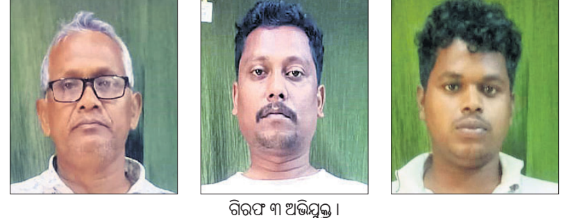
ଗିରଫ ୩ ଅଭିଯୁକ୍ତ ।