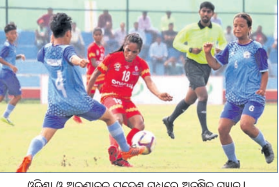
ଓଡ଼ିଶା ଓ ଅରୁଣାଚଳ ପ୍ରଦେଶ ମଧ୍ୟରେ ଅନୁଷ୍ଠିତ ମ୍ୟାଚ୍।

ସୁନ୍ଦରଗଡ଼, ୧୪.୧୧ (କନ୍ୟାମାୟଣ ମେଣ୍ଟାଲି) ସୁନ୍ଦରଗଡ଼ ଜିଲ୍ଲା ଜ୍ରାତା ସଂସଦ ଏବଂ ମୁରୁବଲ ଆସୋସିଏସନ ଅଫ୍ ଓଡ଼ିଶା (ଫା)ର ମିଳିତ ଆନୁକୂଲ୍ୟରେ ସୁନ୍ଦରଗଡ଼ ଝାଡ଼ିୟମରେ ଆୟୋଜିତ ହୋଇଥିବା ୨୮ତମ ଜାତୀୟ ଫିଲ୍ଡ ହକି ମହିଳା ମୁରୁବଲ ଚାମ୍ପିୟନଶିପ୍ରେ ୨ୟ ଦିବସରେ ମଙ୍ଗଳବାର ୨ଟି ମ୍ୟାଚ୍ ଅନୁଷ୍ଠିତ ହୋଇଯାଇଛି।