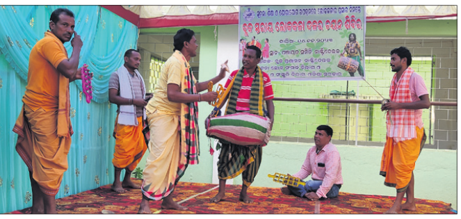
ଶିବିରରେ ଭାଗ ନେଇଥିବା ଲୋକକଳା ଦଳ।