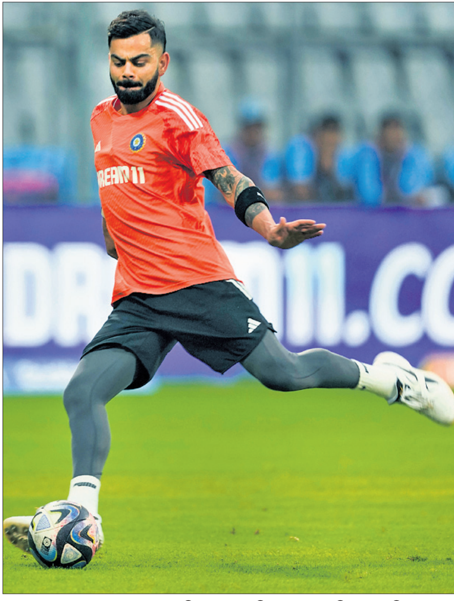
ନେତୃ ସେସନରେ ପୁରସ୍କାର ଖେଳି ଅଭ୍ୟାସ କରୁଛନ୍ତି ତାରକା ବ୍ୟାଟର ବିରାଟ କୋହଲି।