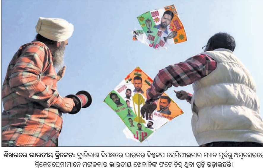
ଶିଖରରେ ଭାରତୀୟ କ୍ରିକେଟର ମୁଖ୍ୟ ବିପକ୍ଷରେ ଭାରତର ବିଶ୍ୱକପ ସେମିଫାଇନାଲ ମ୍ୟାଚ ପୂର୍ବରୁ ଅନୁସରଣରେ କ୍ରିକେଟପ୍ରେମୀମାନେ ମଙ୍ଗଳବାର ଭାରତୀୟ ଖେଳାଳିଙ୍କୁ ପ୍ରଦାନ କରିଥିବା ଗୁଡ଼ି ଉପହାସିତ।