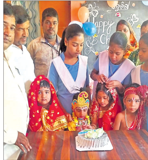
ଛାତ୍ରୀଛାତ୍ର କେକ୍ କାଟି ଶିଶୁ ଦିବସ ପାଳନ କରୁଛନ୍ତି