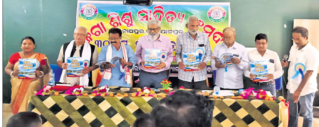
ଜଗା ଶିଶୁ ସାହିତ୍ୟ ସଂସଦର ସ୍ୱନକ୍ଷତ୍ର ଉତ୍ସବରେ ମଞ୍ଚାସୀନ ଅତିଥି ।