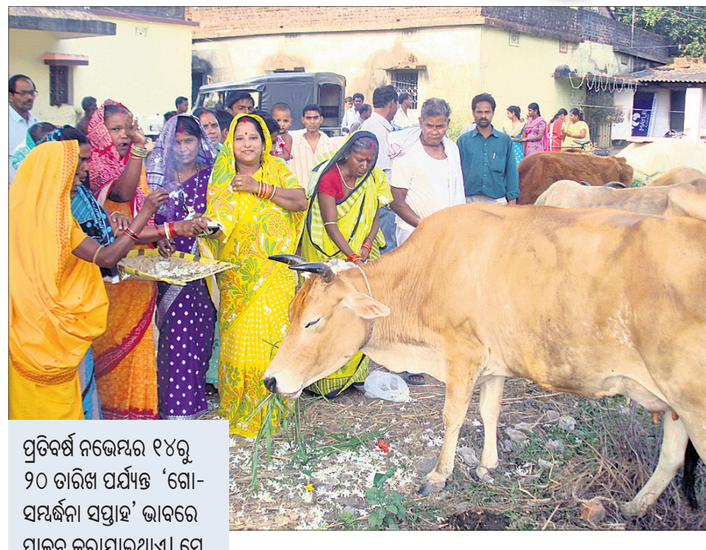
ପ୍ରତିବର୍ଷ ନଭେମ୍ବର ୧୪ରୁ ୨୦ ତାରିଖ ପର୍ଯ୍ୟନ୍ତ ‘ଗୋ-ସମ୍ବର୍ଦ୍ଧନା ସପ୍ତାହ’ ଭାବରେ ପାଳନ କରାଯାଇଥାଏ ।

ଅମୃତଭଣ୍ଡା ଚାଷରେ ଫୁଲଶିଖା ରୋଗ ହେଲେ ଅମୃତଭଣ୍ଡା ଗଛର ମୂଳଶିଖା ରୋଗ ପ୍ରତିକାର ପାଇଁ ଗଛମୂଳକୁ ମାଟି ଦେଲୁ ଓ ପାଣି ଜମିବାକୁ ଦିଅନ୍ତୁ ନାହିଁ ।