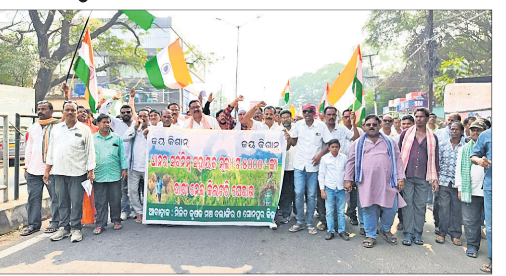
ବଲାଙ୍ଗୀର ଜିଲାପାଳଙ୍କ କାର୍ଯ୍ୟାଳୟ ଅଭିଯୁକ୍ତେ ଗାଷାକ ଶୋଭାଯାତ୍ରା।