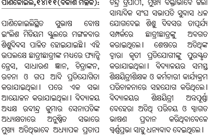
କାର୍ଯ୍ୟକ୍ରମରେ ଉପସ୍ଥିତ ଅତିଥି ।