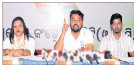
ଖବରଦାତା ସମ୍ମିଳନୀରେ ଛାତ୍ର କଂଗ୍ରେସ କର୍ମକର୍ତ୍ତା।