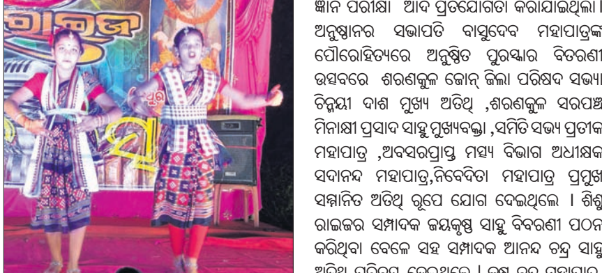
ଛାତ୍ରୀମାନେ ନୃତ୍ୟ ପ୍ରଦର୍ଶନ କରୁଛନ୍ତି