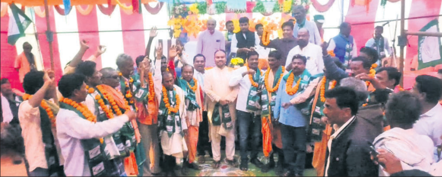
ବିଜେଡି ନେତା, କର୍ମୀଙ୍କ ସହ ନୂତନଭାବେ ବଳରେ ସାମିଲ ହୋଇଥିବା କଂଗ୍ରେସ କର୍ମୀମାନେ।