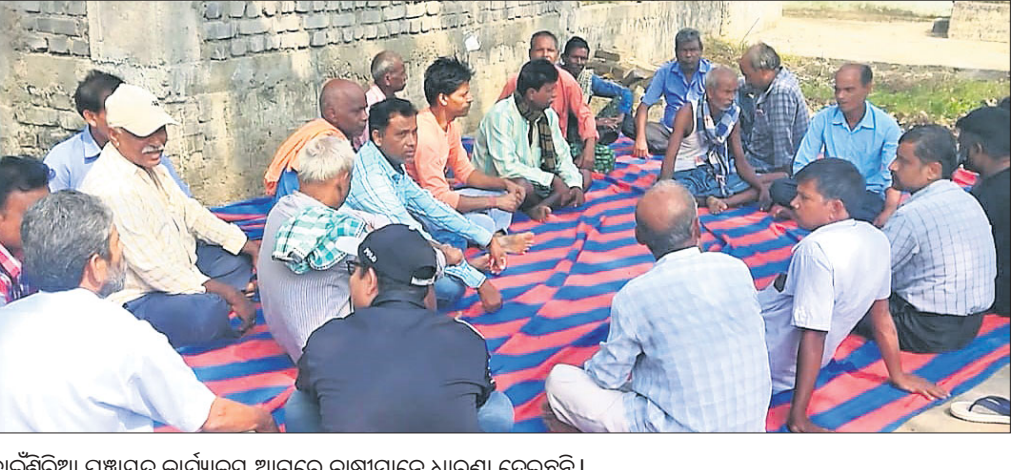
ବାଇଁଶିଆ ପଞ୍ଚାୟତ କାର୍ଯ୍ୟାଳୟ ଆଗରେ ଚାଷୀମାନେ ଧାରଣା ଦେଇଛନ୍ତି ।