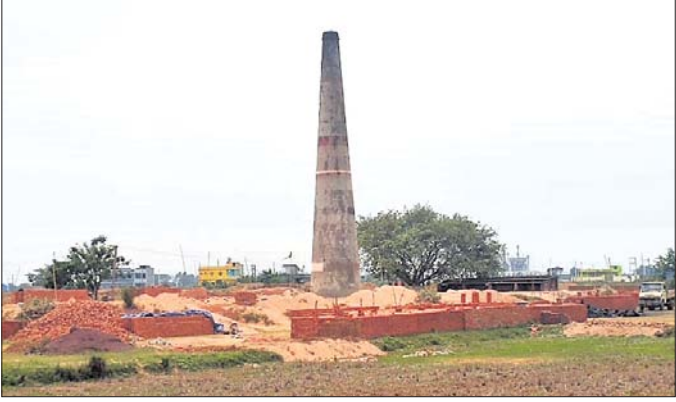
ଚେମିନି ଇଟାଭାଟି ।

ବ୍ୟାପନଗର ଚଉପକ୍ଷିଆର ଅଧୀନ କୋରୋଇ ଅଞ୍ଚଳରେ ଅନେକ ବେଆଇନ ଚେମିନି ଇଟାଭାଟି ଗଢ଼ି ଉଠିଛି । ହେଲେ ଏଗୁଡ଼ିକ କାର୍ଯ୍ୟାନୁଷ୍ଠାନ ନୈରାଶ୍ୟଜନକ ରହିଛି ।