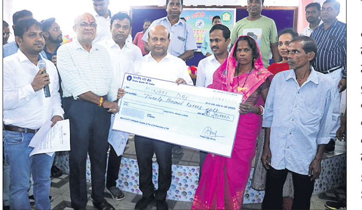
ଜଣେ ହିତାଧିକାରୀଙ୍କୁ ପ୍ରୋତ୍ସାହନ ରାଶିର ଚେକ୍ ପ୍ରଦାନ କରାଯାଉଛି ।