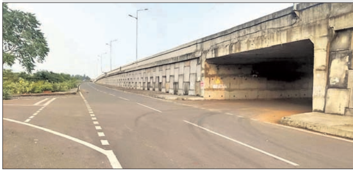
ଡ୍ରାଙ୍ଗଫାଲ୍ ଅନୁସାରେ ଓଡ଼ରଡ୍ରିଜର କାମ ହେବ