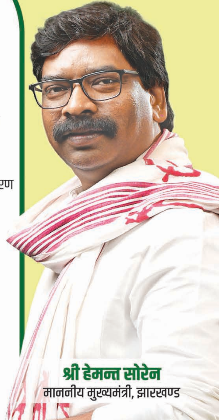
श्री हेमन्त सोरेन माननीय मुख्यमंत्री, झारखण्ड

दिनांक - 15 नवम्बर, 2023 | समय - अपराह्न 02:00 बजे से स्थान - मोरहाबादी मैदान, राँची