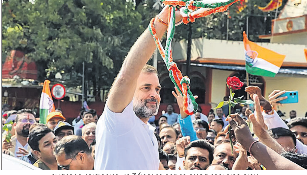
ମଧ୍ୟପ୍ରଦେଶର ଭୋପାଳରେ ଏକ ନିର୍ବାଚନ ରୋଡ଼ଶୋରେ କଂଗ୍ରେସ ନେତା ରାହୁଲ ଗାନ୍ଧୀ।