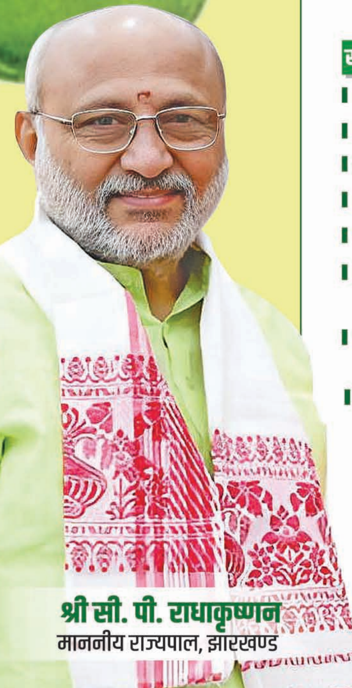
श्री सी. पी. राधाकृष्णन माननीय राज्यपाल, झारखण्ड