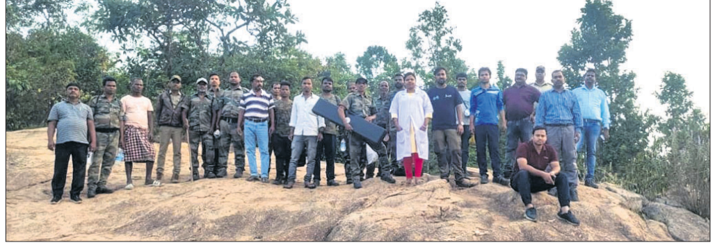
ବନ ବିଭାଗ କର୍ମଚାରୀ ଓ ପ୍ରାଣୀ ଚିକିତ୍ସକ ବନ।