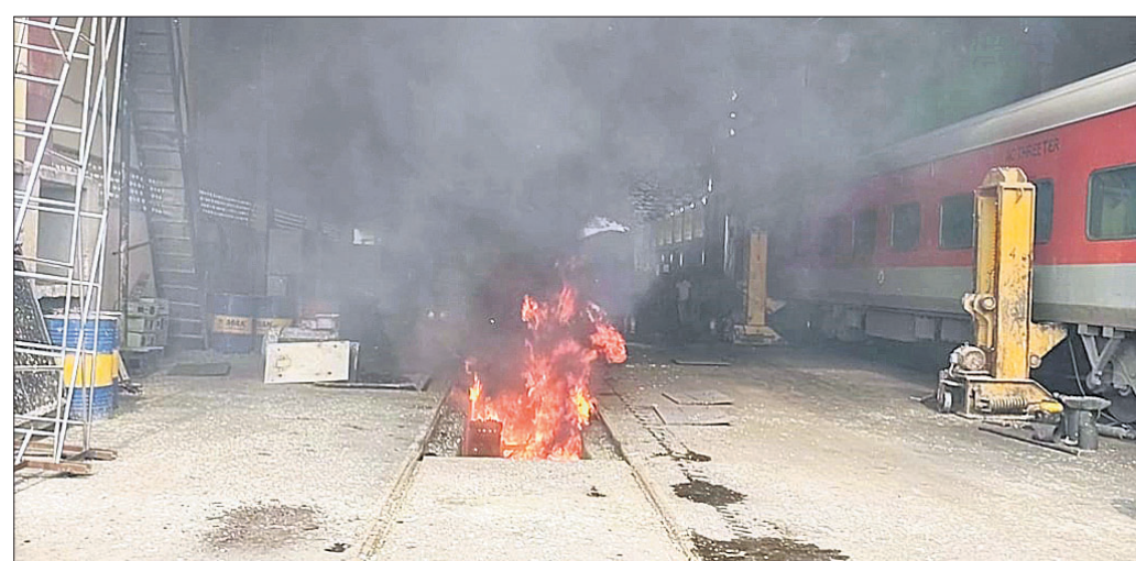
ଡିଏଚ୍ରେ ଥିବା ଏସି ବଗିଚାରେ ମରାମତି ଚାଲିଥିବା ସମୟରେ ହଠାତ୍ କୋଟି ଡିଏଚ୍ରେ ଖଣି ଲାଇନର ଏକ ବଗିଚା