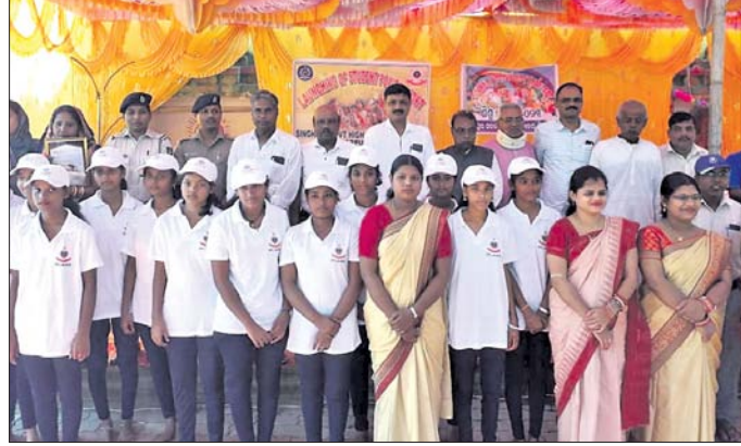
ଶିଶୁ ଦିବସ ଅବସରରେ ଛାତ୍ରଛାତ୍ରୀ ଓ ଶିକ୍ଷୟିତ୍ରୀଶିକ୍ଷକମାନେ ।