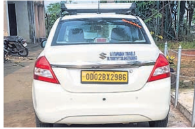
ମୃତଦେହ ନେବାରେ ବ୍ୟବହୃତ ହୋଇଥିବା ଜବତ କାର୍।