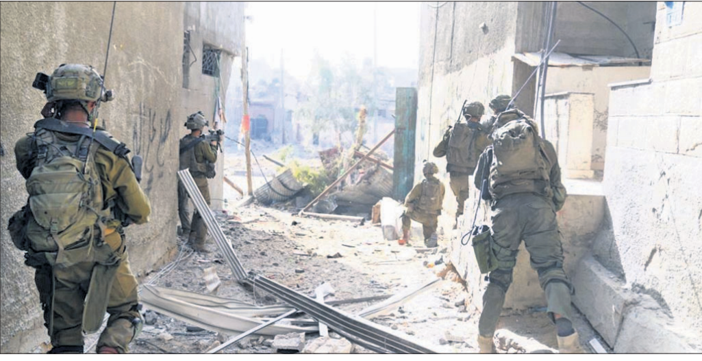
ଗାଜା ସିଟିର ଅଲ୍ ଶିଫା ହସ୍ତିଚାଳରେ ଇସ୍ରାଏଲୀ ଡିଫେନ୍ସ ଫୋର୍ସେସ୍ (ଆଇଡିଏଫ୍)ର ୧୬୨୭ମ ଡିଭିଜନ୍ ସୈନ୍ୟମାନେ ।

କାନାଡାରେ ଦୀପାବଳି ବେଳେ ଖଲିସ୍ତାନୀ ସମର୍ଥକଙ୍କ ଟେକାମାଡ଼