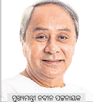
ମୁଖ୍ୟମନ୍ତ୍ରୀ ନବୀନ ପଟ୍ଟନାୟକ