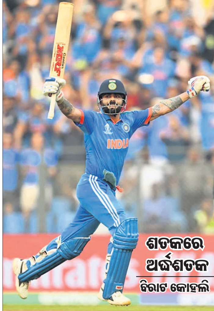
ଶତକରେ ଅର୍ଦ୍ଧଶତକ ବିରାଟ କୋହଲି