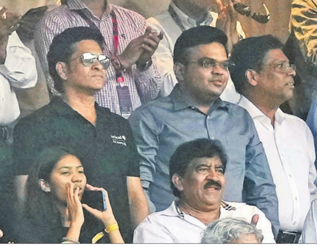
ସଚିନ ଚେନ୍ନାଇକର ଓ ବିସିଆଇ ସମ୍ପାଦକ ଜୟ ଶାହା ମ୍ୟାଚ ଉପଭୋଗ କରୁଛନ୍ତି।

ପୁରୀ, ୧୫୧୧ (ପି.ଟି.): ଦିନିକିଆ କ୍ରିକେଟରେ ୫୦ତମ ଶତକ ହାସଲ କରିଥିବା ବିରାଟ କୋହଲିଙ୍କୁ ଶୁଭେଚ୍ଛା ଜଣାଇଛନ୍ତି ସଚିନ ଚେନ୍ନାଇକର।