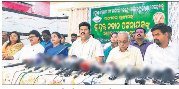
ବିଜେଡିର ଖବରଦାତା ସମ୍ମିଳନୀ।