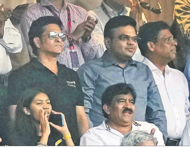
ସଚିନ ତେନ୍ଦୁଲକର ଓ ବିସିଆଇ ସମ୍ପାଦକ ଜୟ ଶାହା ମଧ୍ୟରେ ଉପଭୋଗ କରୁଛନ୍ତି।

ପୁରୀ, ୧୫୧୧ (ପି.ଟି.): ଦିନିକିଆ କ୍ରିକେଟରେ ୫୦ତମ ଶତକ ହାସଲ କରିଥିବା ବିରାଟ କୋହଲିଙ୍କୁ ଶୁଭେଚ୍ଛା ଜଣାଇଛନ୍ତି ସଚିନ ତେନ୍ଦୁଲକର।