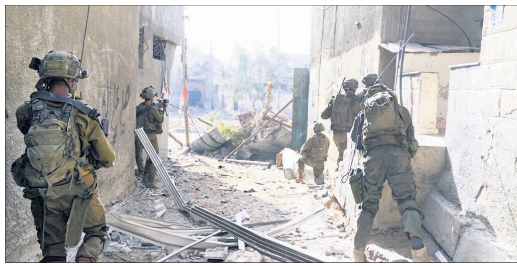
ଗାଜା ସିଟିର ଅଲ୍ ଶିଫା ହସ୍ତିଚାଳରେ ଇସ୍ରାଏଲୀ ଡିଫେନ୍ସ ଫୋର୍ସେସ୍ (ଆଇଡିଏଫ୍)ର ୧୬୨୭ମ ଡିଭିଜନ୍ ସୈନ୍ୟମାନେ ।

କାନାଡାରେ ଦୀପାବଳି ବେଳେ ଖଲିସ୍ତାନୀ ସମର୍ଥକଙ୍କ ଟେକାମାଡ଼