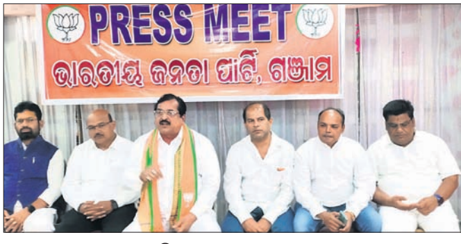
ଖବରଦାତା ସମ୍ମିଳନୀରେ ଭାଜପା ନେତା