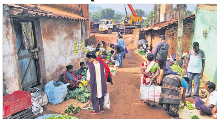
ବ୍ୟବସାୟୀ ଅଣସନ୍ତୋଷ ରାସ୍ତାରେ ବସି ବ୍ୟବସାୟ କରୁଛନ୍ତି। ପ୍ରତିଦିନ ନିତ୍ୟ ବ୍ୟବସାୟୀ ପରିବା ବିଶିଷ୍ଟ ରାସ୍ତା ବିପଦପୂର୍ଣ୍ଣ ବସ୍ତି ବାସିନ୍ଦାଙ୍କ ମୁଖ୍ୟ ପାଇଁ ଆସୁଥିବା ଗ୍ରାହକ ଖସି ପଡ଼ୁଛନ୍ତି। ରାସ୍ତା ହୋଇଥିବା ବେଳେ ବୁଲି ଚଳିଥା

କେନ୍ଦ୍ରର ଜିଲ୍ଲା ଯୋଡ଼ା ସହରର ମୁଖ୍ୟ ପରିବା ବଜାରକୁ ରାସ୍ତା ନାହିଁ। ନିମ୍ନମାନର ନିର୍ମାଣ ଯୋଗୁ ରାସ୍ତା ଅବସ୍ଥା ଏପରି ହୋଇଛି ଯେ, ପ୍ରତିଦିନ ପରିବା ବ୍ୟବସାୟୀ, ଗ୍ରାହକମାନେ ଖସି ପଡ଼ି ଆହତ ହେଉଛନ୍ତି। ବିପଦପୂର୍ଣ୍ଣ ରାସ୍ତାକୁ ନେଇ ବ୍ୟବସାୟୀ ଓ ଗ୍ରାମୀଣ ଲୋକଙ୍କ ମଧ୍ୟରେ ଅସନ୍ତୋଷ ବୃଦ୍ଧି ପାଇଛି। ସୂଚନା ଅନୁଯାୟୀ, ଯୋଡ଼ାର ମୁଖ୍ୟ ରାସ୍ତା କଡ଼ ତଥା ପୋଷ୍ଟ ଅଫିସ୍ ସମ୍ମୁଖ ଦୈନିକ ପରିବା ବଜାର ରାସ୍ତା ନିର୍ମାଣ ବେଳେ ରାସ୍ତା ଉପରେ ମାଟି ଗଦା ହୋଇ ରହିଛି। ଫଳରେ ଡାକ୍ତରୀ ଗଡ଼ାଣିଆ ରାସ୍ତାରେ