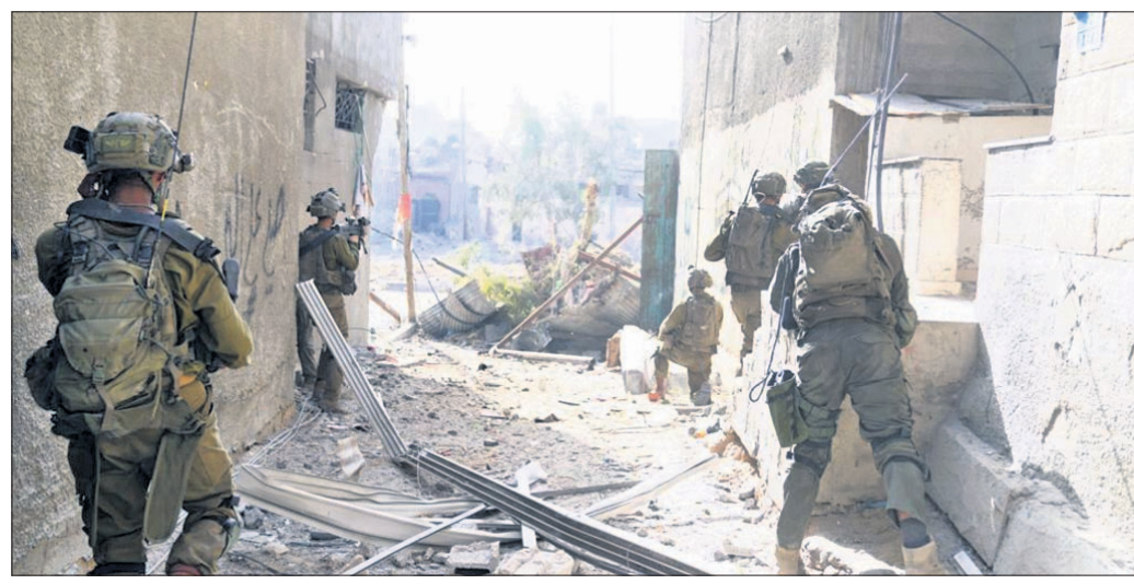
ଗାଜା ସିଟିର ଅଲ୍ ଶିଫା ହସ୍ତିଚାଳରେ ଇସ୍ରାଏଲୀ ଡିଫେନ୍ସ ଫୋର୍ସେସ୍ (ଆଇଡିଏଫ୍)ର ୧୬୨ତମ ଡିଭିଜନ୍ ସୈନ୍ୟମାନେ ।

କାନାଡାରେ ଦୀପାବଳି ବେଳେ ଖଲିସ୍ତାନୀ ସମର୍ଥକଙ୍କ ଟେକାମାଡ଼