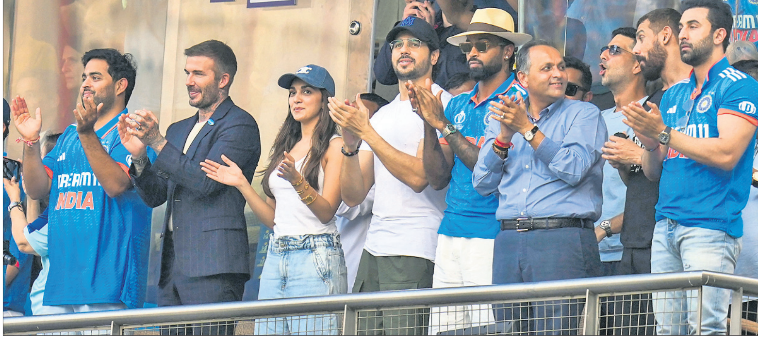
ଭାରତ-ପୁଞ୍ଜାବ ସେମିଫାଇନାଲ ଅବସରରେ ପୂର୍ବତନ ଇଂଲଣ୍ଡ ଯୁଗବଳର ତେଜବେକ୍ ହାସିକ ପାଣ୍ଡା...