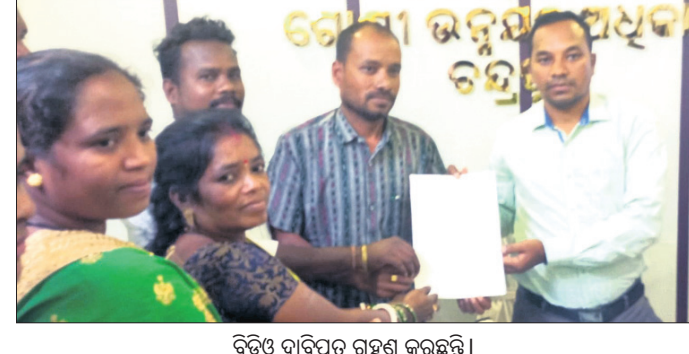
ବିତିଓ ଦାବିପତ୍ର ଗ୍ରହଣ କରୁଛନ୍ତି।