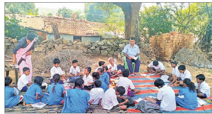
ଗଛତଳେ ଛାତ୍ରଛାତ୍ରୀମାନେ ପାଠ ପଢୁଛନ୍ତି।

ଦେଖିବାକୁ ମିଳୁଛି। ସରକାରଙ୍କ ୫-ଟି ଅଧୀନରେ ବିଭିନ୍ନ ସ୍କୁଲ ମରାମତି ସାଧନକୁ ନୂତନ କୋଠା ନିର୍ମାଣ କରାଯାଇଥିବା ବେଳେ କୁସାରଗୁଡ଼ା ସ୍କୁଲ ସରକାରଙ୍କ ନକର ଆଡ଼ୁଆଳରେ ରହିଯାଇଛି। ସ୍କୁଲ ଘର ମରାମତି ପାଇଁ ବହୁବାର ଗ୍ରାମବାସୀ ବୁକ୍ ପ୍ରଶ୍ନାବନ ନିକଟରେ ଅଭିଯୋଗ କରିଥିଲେ ମଧ୍ୟ ତାହାର କୌଣସି ସୁଚଳ ମିଳିନାହିଁ। ଗୁମାଲଗୁଡ଼ା ସ୍କୁଲକୁ ସରକାର ସମ୍ପୂର୍ଣ୍ଣ ବନ୍ଦକରି ଦେଇ କୁସାରଗୁଡ଼ା ସ୍କୁଲ ସହ ମିଶାଇ ଦେଇଛନ୍ତି। ଏହି ବିଦ୍ୟାଳୟରେ ପିଲାଙ୍କ ପାଇଁ କୌଣସି ସୁବିଧା ନାହିଁ। ଟଏଲେଟ୍, ପାଣି, ପିଲାଙ୍କ ଖେଳିବା ନେଇ ସୁବିଧା କିଛି ନାହିଁ। ପ୍ରଶ୍ନାବନ ଏ ଦିଗରେ ପଦକ୍ଷେପ ନେବାକୁ ସାଧାରଣରେ ଦାବି ହେଉଛି।