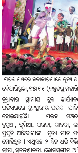
ପରବ ମଞ୍ଚରେ କଳାକାରମାନେ ନୃତ୍ୟ ପରିବେଷଣ କରୁଛନ୍ତି।

ପରବ ମଞ୍ଚରେ କଳାକାରମାନେ ନୃତ୍ୟ ପରିବେଷଣ କରୁଛନ୍ତି। ଦୈବପିରୁଡ଼ା, ୧୫୧୧୧ (କଳ୍ପତରୁ ମହାନ୍ତି) ରୁଧିରାପନା ବ୍ଲକ୍‌ର ଗୁମ୍ଫାମାୟ ବୁକ୍ କାର୍ଯ୍ୟାଳୟ ପରିସରରେ ବୁକ୍‌ସପ୍ଟର ପରବ ପାଳିତ ହୋଇଯାଇଛି। ପରବ ମଞ୍ଚରେ ପରବ ମଞ୍ଚରେ କଳାକାରମାନେ ନୃତ୍ୟ ପରିବେଷଣ କରୁଛନ୍ତି। ଦୈବପିରୁଡ଼ା, ୧୫୧୧୧ (କଳ୍ପତରୁ ମହାନ୍ତି) ରୁଧିରାପନା ବ୍ଲକ୍‌ର ଗୁମ୍ଫାମାୟ ବୁକ୍ କାର୍ଯ୍ୟାଳୟ ପରିସରରେ ବୁକ୍‌ସପ୍ଟର ପରବ ପାଳିତ ହୋଇଯାଇଛି। ପରବ ମଞ୍ଚରେ ପରବ ମଞ୍ଚରେ କଳାକାରମାନେ ନୃତ୍ୟ ପରିବେଷଣ କରୁଛନ୍ତି।