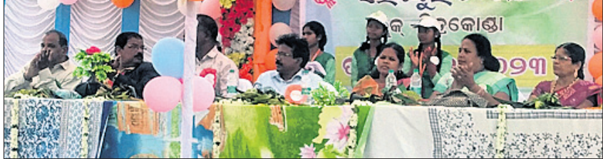
ବୁକ୍ସପୁରାୟ ସର୍ବିୟୁଲ କାର୍ଯ୍ୟକ୍ରମରେ ଉପସ୍ଥିତ ଅତିଥିମାନେ ।