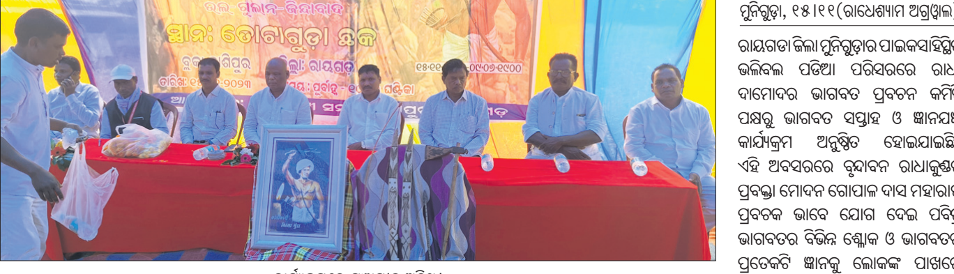
କାର୍ଯ୍ୟକ୍ରମରେ ମହାସଂଘର ଅତିଥି।

ରାୟଗଡ଼ା ଜିଲାର କାଶୀପୁର ରୁକ୍ମପୁର ପଞ୍ଚାୟତରାଜର କାଶୀପୁର ଗ୍ରାମରେ ରାୟଗଡ଼ା ଆଦିବାସୀ ମହାସଂଘର ପ୍ରଥମ ସଭା ଯାତ୍ରା ଆୟତ୍ତ ହୋଇଛି। ସଭାରେ ବିର୍ସା ମୁଖାଙ୍କ ପ୍ରତିମୂର୍ତ୍ତିର ଉଦ୍ଘାଟନ କରାଯାଇଥିଲା। ସଭାରେ ବିର୍ସା ମୁଖାଙ୍କ ଇତିହାସ ଓ ସେମାନଙ୍କର ସଂଗ୍ରହ ଉପରେ ଆଲୋଚନା କରାଯାଇଥିଲା। ସଭାରେ ବିର୍ସା ମୁଖାଙ୍କ ଇତିହାସ ଓ ସେମାନଙ୍କର ସଂଗ୍ରହ ଉପରେ ଆଲୋଚନା କରାଯାଇଥିଲା।