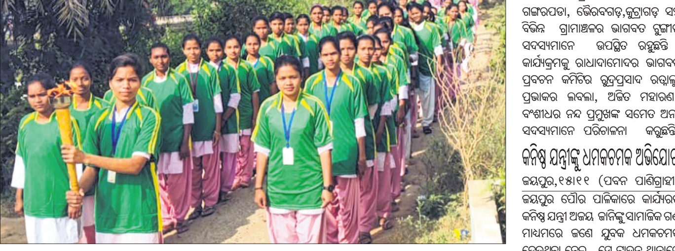
ଛାତ୍ରୀମାନଙ୍କ ବାହାରିଥିବା ମଣ୍ଡଳ ଶୋଭାଯାତ୍ରା।

ରାୟଗଡ଼ା ଜିଲାର ଗୁଣ୍ଡୁପୁର ପଞ୍ଚାୟତରାଜର ଗୁଣ୍ଡୁପୁର ଗ୍ରାମରେ ମହାବିଦ୍ୟାଳୟର ଉଦ୍ଘାଟନ କରାଯାଇଛି। ଉଦ୍ଘାଟନ କାର୍ଯ୍ୟକ୍ରମରେ ବିକାଶ କାର୍ଯ୍ୟକ୍ରମର ଉଦ୍ଘାଟନ କରାଯାଇଛି। ଉଦ୍ଘାଟନ କାର୍ଯ୍ୟକ୍ରମରେ ବିକାଶ କାର୍ଯ୍ୟକ୍ରମର ଉଦ୍ଘାଟନ କରାଯାଇଛି।