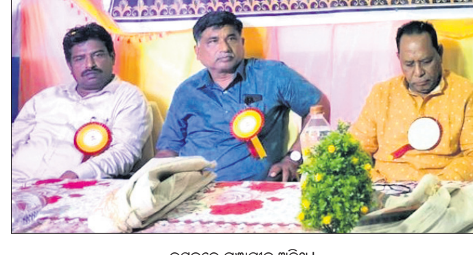
ଉତ୍ସବରେ ମହାସଂଘର ଅତିଥି।