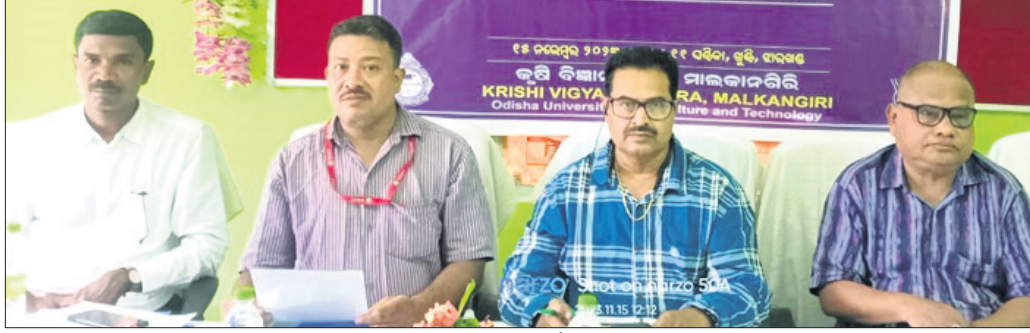
ପ୍ରଧାନମନ୍ତ୍ରୀ କିଷାନ ବିକାଶ ଯୋଜନା ବୈଠକରେ ବରିଷ୍ଠ ବୈଜ୍ଞାନିକ ସିଦ୍ଧାନ୍ତ କର ଓ ଅନ୍ୟମାନେ ଆଲୋଚନା କରୁଛନ୍ତି ।