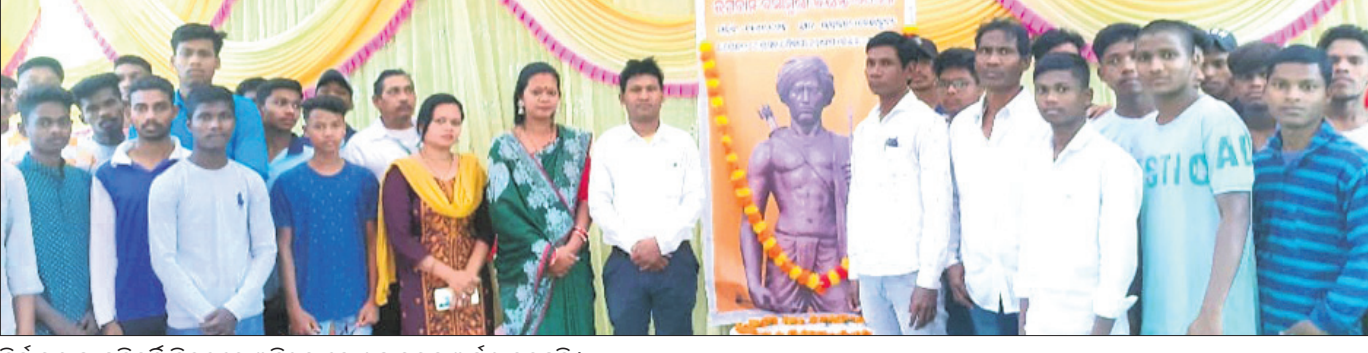
ବିର୍ସାମୁଖାଙ୍କ ପ୍ରତିମୂର୍ତ୍ତି ନିକଟରେ ଅତିଥିମାନେ ଶ୍ରଦ୍ଧାଘୃଣ ଅର୍ପଣ କରୁଛନ୍ତି।