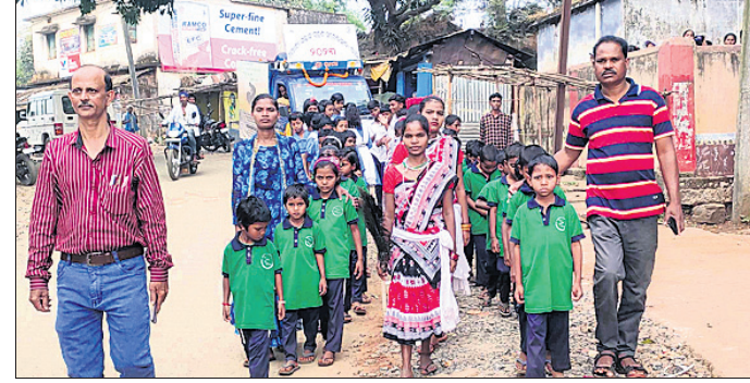
ଦଶରଥପୁରରେ ସଚେତନ ଉପର ଅତିଥିମାନେ ଶୁଭାରମ୍ଭ କରୁଛନ୍ତି।