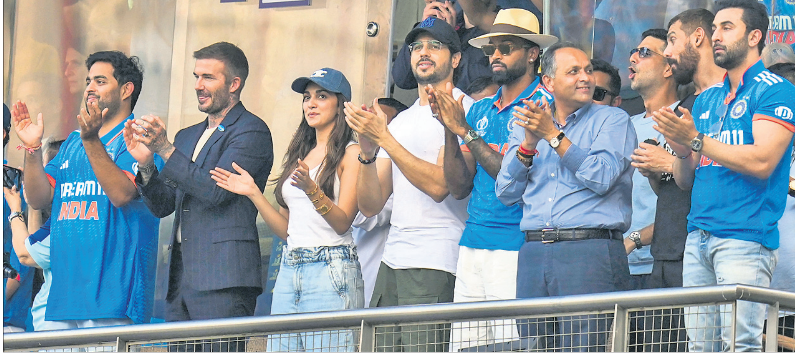
ଭାରତ-ପୁରୁଷୋତ୍ତମ ସେନାପତିଙ୍କ ନେତୃତ୍ୱରେ ପୂର୍ବତନ ଇଂଲଣ୍ଡ ଯୁଗ୍ମକ୍ରୀଡ଼ା ଦଳର ଉପସ୍ଥାପନା...