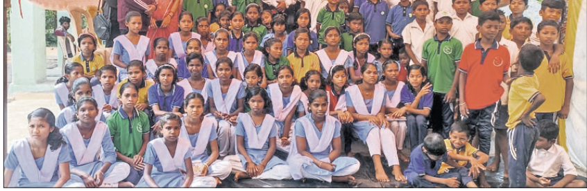
କାର୍ଯ୍ୟକ୍ରମରେ ଅତିଥିଙ୍କ ସହ ଛାତ୍ରୀଛାତ୍ରୀମାନେ ।