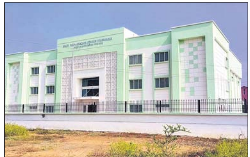
ନବ ନିର୍ମିତ ଇନିଟୋର ଷ୍ଟାଡ଼ିୟମ ବନ୍ଦ ପଡ଼ିଛି ।