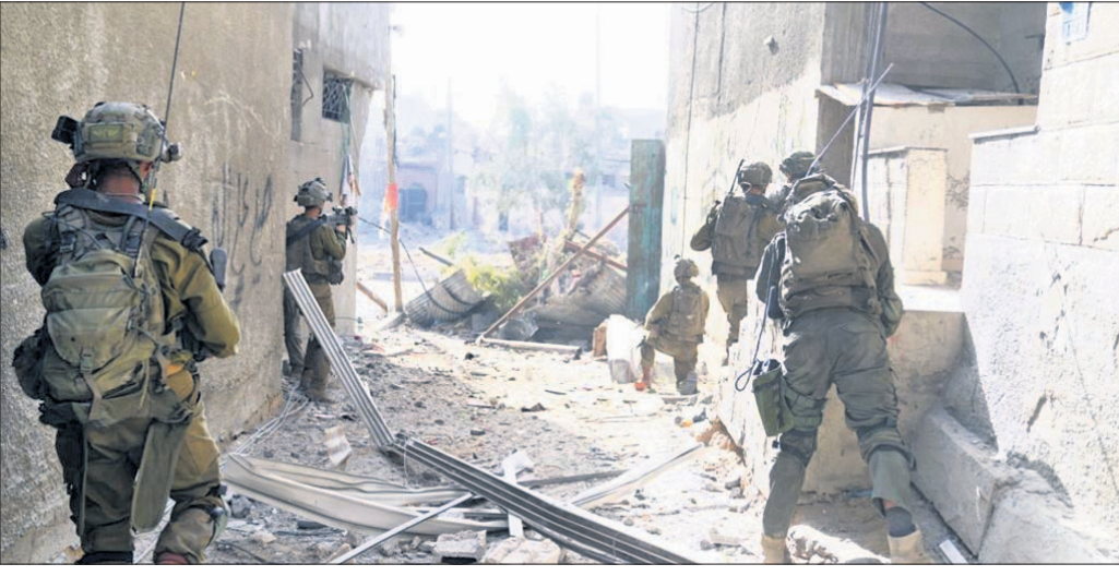
ଗାଜା ସିଟିର ଅଲ୍ ଶିଫା ହସ୍ତିଚାଳରେ ଇସ୍ରାଏଲୀ ଡିଫେନ୍ସ ଫୋର୍ସେସ୍ (ଆଇଡିଏଫ୍)ର ୧୬୨ତମ ଡିଭିଜନ୍ ସୈନ୍ୟମାନେ ।

କାନାଡାରେ ଦୀପାବଳି ବେଳେ ଖଲିସ୍ତାନୀ ସମର୍ଥକଙ୍କ ଟେକାମାଡ଼