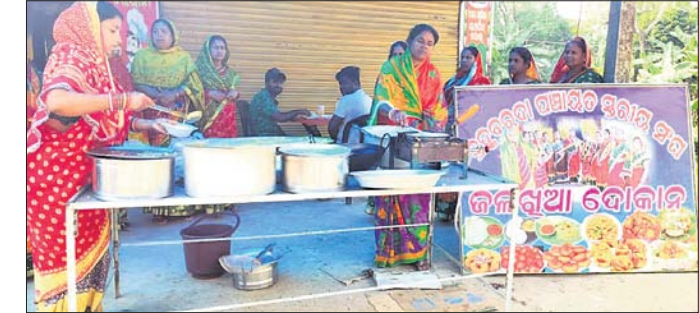
ମହିଳାମାନେ ଜଳଖିଆ ବିକ୍ରି କରୁଛନ୍ତି ।