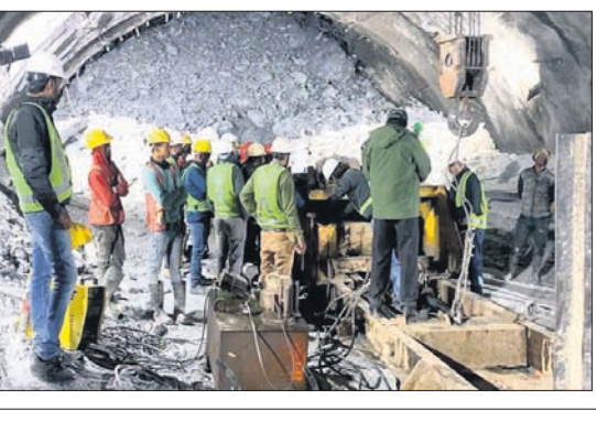
ଉଦ୍ଧାର କାର୍ଯ୍ୟରେ ଲାଗିବେ ଆଇଲାଣ୍ଡ ଗୁମାସ୍ତା ପିଲାଙ୍କୁ କାଢ଼ିଥିବା ଚିମ୍