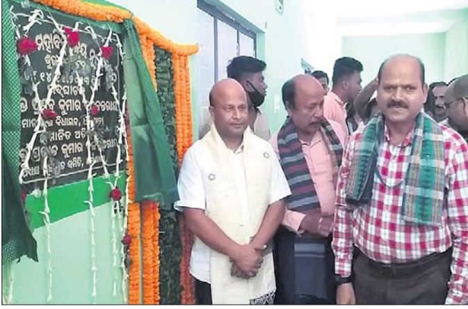
ମହାବିଦ୍ୟାଳୟ ଲାଭ ଗୃହକୁ ବିଧାୟକ ଉଦ୍ଘାଟନ କରୁଛନ୍ତି ।

ଧର୍ମଶାଳା ମହାବିଦ୍ୟାଳୟର ନୂତନ ଲାଭ ଗୃହ ଉଦ୍ଘାଟିତ ହୋଇଯାଇଛି । ବିଧାୟକ ପ୍ରଣବ କୁମାର ବଳବତ୍ତରାୟ ପୁଞ୍ଜି ଅତିଥି ଭାବେ ଯୋଗଦେଇ ଏହି ଲାଭ ଗୃହକୁ ଉଦ୍ଘାଟନ କରିଛନ୍ତି । ୭୦ ଲକ୍ଷ ଟଙ୍କାରେ ଏହା ନିର୍ମାଣ କରାଯାଇଛି । ଉକ୍ତ ଶିକ୍ଷା ବିଭାଗ ପକ୍ଷରୁ ଉକ୍ତ ଟଙ୍କା ପ୍ରଦାନ କରାଯାଇଥିଲା । ଏହି ଅବସରରେ ବିଧାୟକ କହିଥିଲେ, ଧର୍ମଶାଳା ମହାବିଦ୍ୟାଳୟ ୫-ଟିରେ ଅବସ୍ଥିତ ହୋଇଛି । ଏହାର ଭିତ୍ତିଭୂମି ସୁଦୃଢ଼ କରିବା ପାଇଁ ପୁଞ୍ଜିମାନଙ୍କୁ ନବୀନ ପଟ୍ଟନାୟକ ଓ ୫-ଟି ଅଧ୍ୟକ୍ଷ ଭିକ୍ଷା ପାଞ୍ଚାୟନଙ୍କ ଉଦ୍ୟମ ପ୍ରଶଂସନୀୟ । କାର୍ଯ୍ୟକ୍ରମରେ ମହାବିଦ୍ୟାଳୟ ଅଧ୍ୟକ୍ଷ ପ୍ରଫେସର ତପନ କୁମାର ମିଶ୍ର,