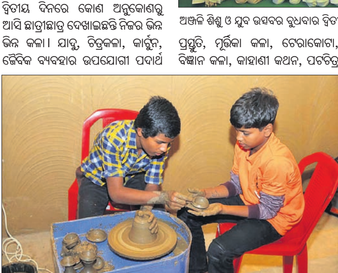
ଦୁଇ ଶିଶୁ ମାଟିରେ କଳା ପ୍ରଦର୍ଶନ କରୁଛନ୍ତି ।

ଭୁବନେଶ୍ୱର, ୧୫.୧୧ (ଶର୍ମିଷ୍ଠା ପାଣିଗ୍ରାହୀ) ମାଟିରେ ନିର୍ମିତ ହୋଇଥିବା ପ୍ରତିଭା ଦେଖାଇଲେ ଦିବ୍ୟାଙ୍କା ଛାତ୍ରୀଛାତ୍ର । ଏଥିରେ ୨୭୦୯ ସଂସ୍କୃତିକ ଦଳକୁ ୯ ଜିଲ୍ଲାରୁ ବିତରଣ କରାଯାଇଛି । ଏଥିରେ ୨୭୦୯ ସଂସ୍କୃତିକ ଦଳକୁ ୯ ଜିଲ୍ଲାରୁ ବିତରଣ କରାଯାଇଛି । ଏଥିରେ ୨୭୦୯ ସଂସ୍କୃତିକ ଦଳକୁ ୯ ଜିଲ୍ଲାରୁ ବିତରଣ କରାଯାଇଛି । ଏଥିରେ ୨୭୦୯ ସଂସ୍କୃତିକ ଦଳକୁ ୯ ଜିଲ୍ଲାରୁ ବିତରଣ କରାଯାଇଛି ।