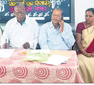
କଳାପଥର ଧଳାପଥର ଉଚ୍ଚ ବାଳକ ବିଦ୍ୟାଳୟ ପରିସରରେ ଅନୁଷ୍ଠିତ ଶିଶୁ ଦିବସ କାର୍ଯ୍ୟକ୍ରମରେ ଉପସ୍ଥିତ ଅତିଥି ।