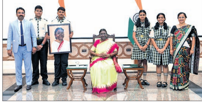
ରାଷ୍ଟ୍ରପତି ଶ୍ରୀମତୀ ଦ୍ରୌପଦୀ ମୁର୍ମୁଙ୍କ ସହ ସେଣ୍ଟ ଜାଭିୟର୍ସ ସ୍କୁଲ ଛାତ୍ରୀଛାତ୍ର ଓ ଅନ୍ୟମାନେ।