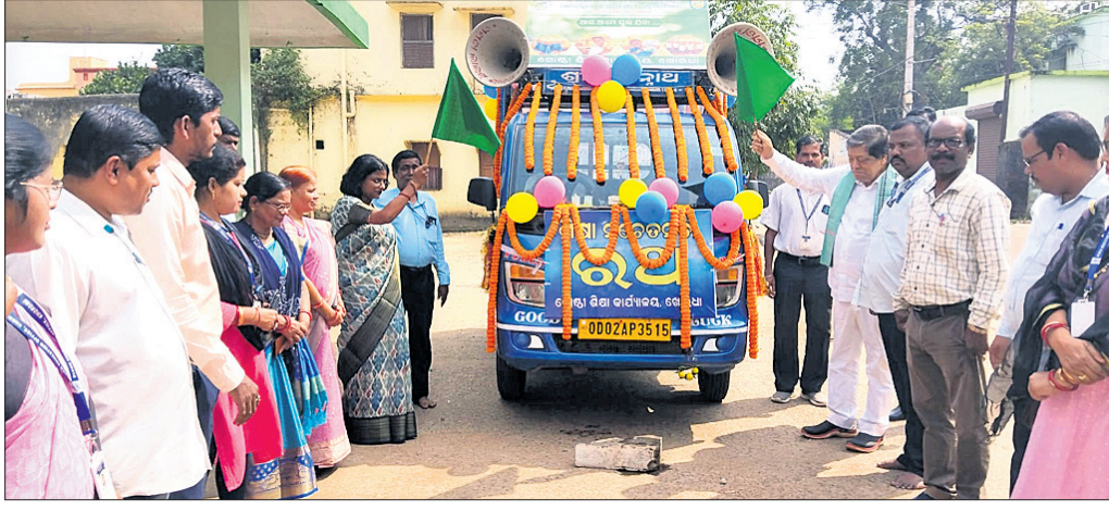
ସଚେତନତା ରଥର ଶୁଭାରମ୍ଭ ଅବସରରେ ଉପସ୍ଥିତ ଅତିଥି ଏବଂ ଅନ୍ୟମାନେ।