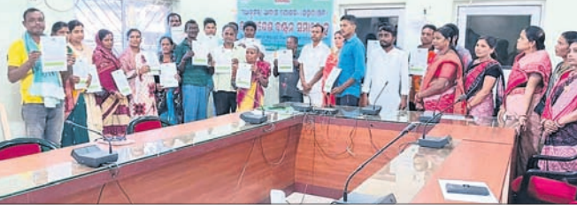
ଏନଏସିର ସଦ୍‌ଭାବନା ଗୃହରେ ଅନୁଷ୍ଠିତ କାର୍ଯ୍ୟାଦେଶ ବଣ୍ଟନ ସମାରୋହ ।