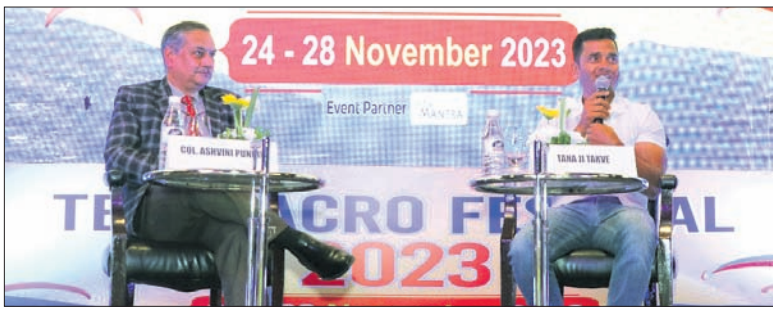
ଭୁବନେଶ୍ୱର, ୧୭.୧୧

ଉତ୍ତରାଖଣ୍ଡ ତୁରିଜମ୍ ତେଜଲମେଣ୍ଟ ବୋର୍ଡ (ଡୁଇଟିଭି) ପକ୍ଷରୁ ଏକ ୫ ଦିନିଆ 'ଆକ୍ରୋଫାଟିକ ଶୋ' ତଥା ତେହରି ଆକ୍ରୋ ଫେଷ୍ଟିଭାଲର ଶୁଭାରମ୍ଭ ସମ୍ପର୍କରେ ଯୋଷଣା କରାଯାଇଛି।