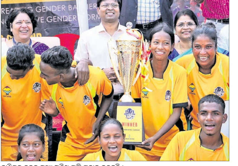
ଚାମ୍ପିୟନ ଦଳକୁ ପୁରୁଷ ଅଭିଧାନ ଟ୍ରଫି ପ୍ରଦାନ କରୁଛନ୍ତି ।