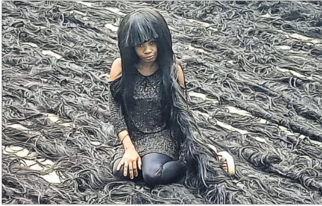
ତାଙ୍କ ପରିବାର ଓ ପ୍ରିୟଜନଙ୍କ ଉପାଦେୟତା ଯୋଗୁଁ ସେ ପୁଣି କାମରେ ଲାଗିପଡ଼ିଥିଲେ, ଯାହାର ଫଳସ୍ୱରୂପ ସେ ଏହି ଦୀର୍ଘତମ ଓର ନିର୍ମାଣ କରିବାରେ ସଫଳ ହୋଇଥିଲେ। ତେବେ ସେ ସପ୍ତାହକୁ ୫୦ରୁ ୩ ଶହ ହେୟାରପେସ ହାରରେ ହଜାରେ ଓର ଉତ୍ପାଦନ କରିଥାନ୍ତି।