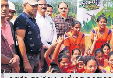
ସମ୍ବିତ ମୁର ବିକାଶ କାର୍ଯ୍ୟକ୍ରମ ଉଦ୍‌ଘାଟନା ପୂର୍ବରୁ ।