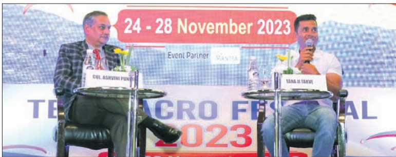
ଭୁବନେଶ୍ୱର, ୧୭.୧୧

ଉତ୍ତରାଖଣ୍ଡ ଡିଜିଟାଲ ଟେକ୍ନୋଲୋଜି ବୋର୍ଡ (ଡିଜିଟିସି) ପକ୍ଷରୁ ଏକ ୫ ଦିନିଆ 'ଆକ୍ରୋ ଫେଷ୍ଟିଭାଲ' ଡେହରି ଆକ୍ରୋ ଫେଷ୍ଟିଭାଲର ଶୁଭାରମ୍ଭ ସମ୍ପର୍କରେ ଘୋଷଣା କରାଯାଇଛି।