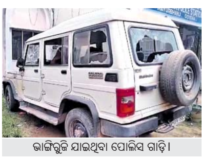
ଭାଙ୍ଗିଚୁରି ଯାଇଥିବା ପୋଲିସ୍ ଗଡ଼ି।