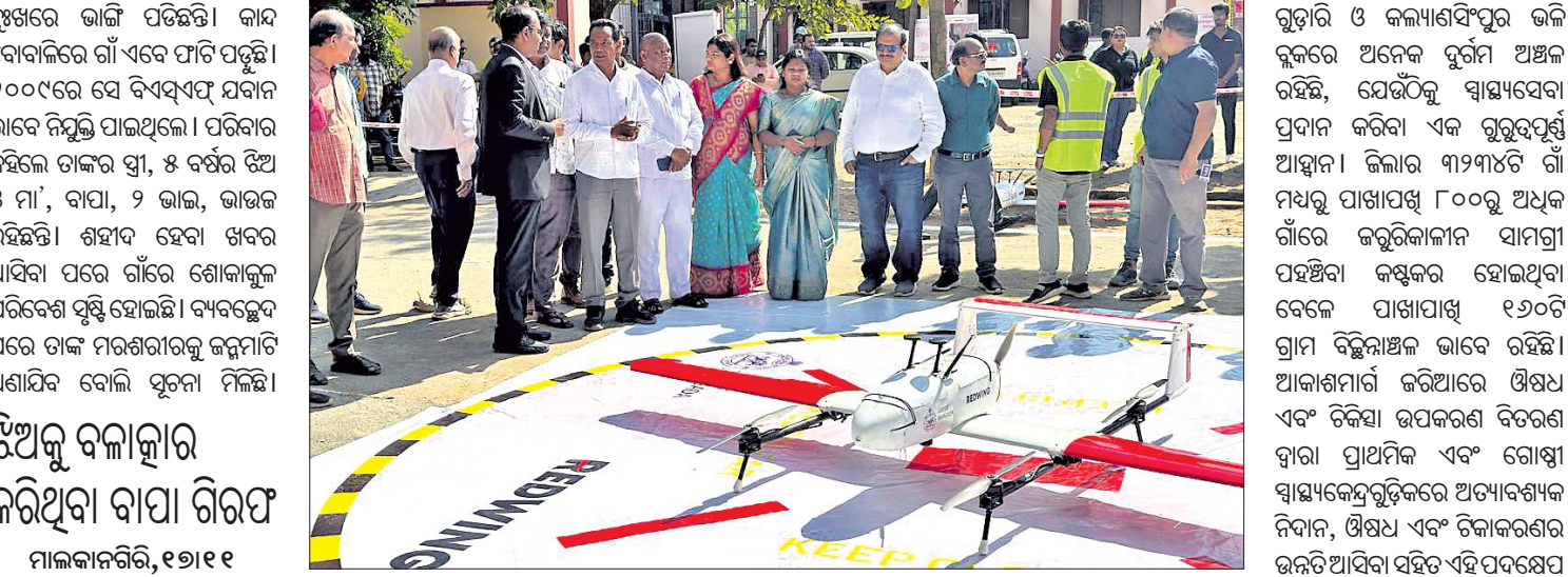
ରାୟଗଡ଼ା ବାରିଶୋଲାସ୍ଥିତ ଜିଲ୍ଲା ମୁଖ୍ୟ ଚିକିତ୍ସା ଏବଂ ଜନସ୍ୱାସ୍ଥ୍ୟ ଅଧିକାରୀଙ୍କ କାର୍ଯ୍ୟାଳୟ ପରିସରରେ ଶୁକ୍ରବାର ସ୍ୱାସ୍ଥ୍ୟସେବା ଡ୍ରୋନ୍ ବିତରଣ ନେତୃତ୍ୱର ଶୁଭାରମ୍ଭ କରାଯାଇଛି।

ରାୟଗଡ଼ାରେ ସ୍ୱାସ୍ଥ୍ୟସେବା ଡ୍ରୋନ୍ ବିତରଣ ନେତୃତ୍ୱର ଶୁଭାରମ୍ଭ