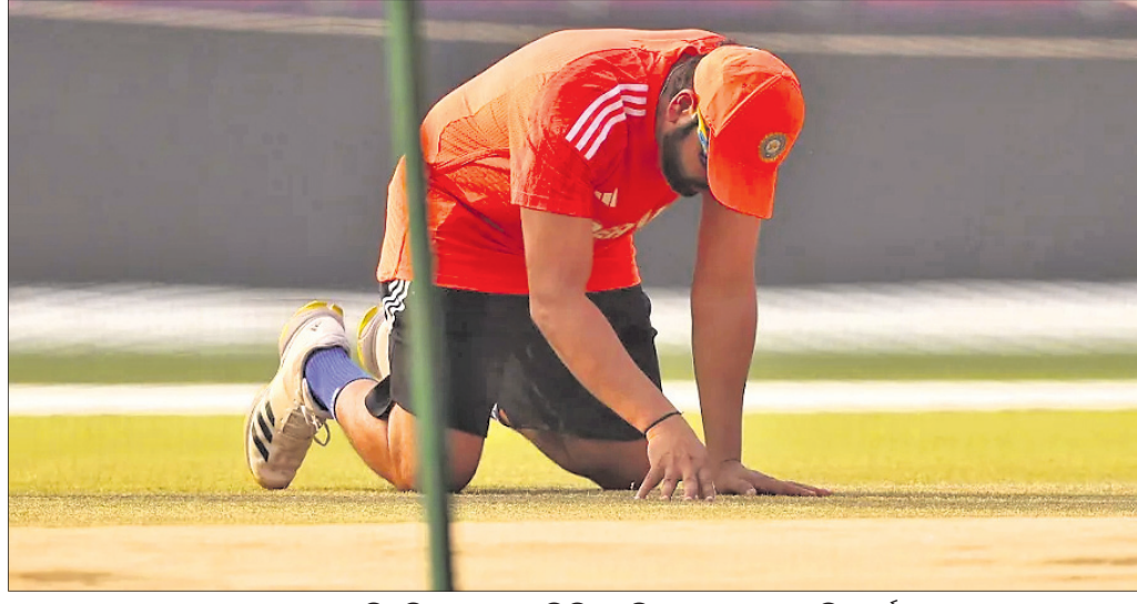
ଅହମଦାବାଦ ପିଠି ନିରୀକ୍ଷଣ କରୁଛନ୍ତି ଟିମ୍ ଇଞ୍ଜିନିୟର ଅଧିନାୟକ ରୋହିତ ଶର୍ମା।

୨୦୨୩ ବିଶ୍ୱକପରେ ଭାରତ ଅଷ୍ଟ୍ରେଲିଆ ବିପକ୍ଷରୁ ହିଁ ଅଭିଯାନ ଆରମ୍ଭ କରିଥିଲା।