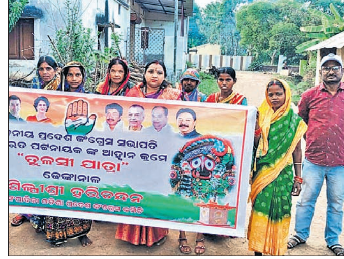
ତୁଳସୀ ଯାତ୍ରା ଅବସରରେ କଂଗ୍ରେସ ନେତା ଓ କର୍ମୀମାନେ।

ସରୋଜ ପଟ୍ଟନାୟକଙ୍କ ଚତୁର୍ଥାଧିକାରୀଙ୍କୁ ଦେଢ଼ାମାଲ ଜିଲ୍ଲାରେ ତୁଳସୀ ଯାତ୍ରା ଅନୁଷ୍ଠିତ ହେଉଛି।