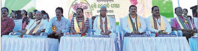
କାମାକ୍ଷାନଗର, ୧୭୧୧ (ସୁଧାଂଶୁ ପରିଡ଼ା) କାମାକ୍ଷାନଗର ଉପଖଣ୍ଡସ୍ତରୀୟ କୃଷି ଯନ୍ତ୍ରପାତି ମେଳା ସାମଗ୍ରୀର ଷ୍ଟାଲ୍‌ରେ ପରିସରରେ ଉଦ୍‌ଘାଟିତ ହୋଇଯାଇଛି।

ଡେଜାନାଲ ଜିଲ୍ଲା କାମାକ୍ଷାନଗର ଅତିରୋଡ଼ିଆ ପରିସରରେ ଶୁକ୍ରବାର ବିଜେଡି କାର୍ଯ୍ୟକ୍ରମ ଉଦ୍‌ଘାଟିତ ହୋଇଛି। ମୁଖ୍ୟ ଅତିଥି ଭାବେ ଶ୍ରୀମତୀ କାମାକ୍ଷାନଗର ଉପଖଣ୍ଡ ରିଜିଷ୍ଟ୍ରାର ଉପସ୍ଥିତ ଥିଲେ।