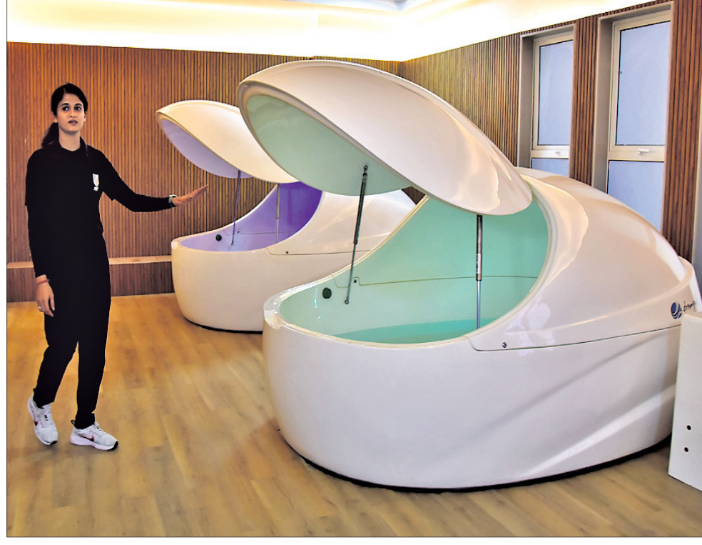
ସ୍ମାର୍ଟ ସାଇକ୍ଲ ସେଣ୍ଟର।

ବିଶିଷ୍ଟ ଏକ ଅତିଗୋପିୟମ ରହିଛି। ସେହିପରି କ୍ରିଡ଼ାସ୍ଥଳ ସେଣ୍ଟରରେ ୨୫୦ ଦର୍ଶକମାନଙ୍କ ଲାଗି ବ୍ୟବସ୍ଥା ରହିଛି।