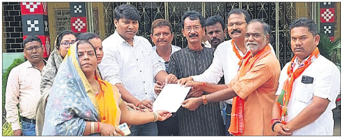
ପରଜଙ୍ଗ ଭାଙ୍ଗି ପକାଇବା ପ୍ରଦର୍ଶନ କରାଯାଇଛି।

ଅନୁଗୋଳ ଲୁକ୍ତ କାର୍ଯ୍ୟାଳୟ ସମ୍ମୁଖରେ ଭାଙ୍ଗି ପକାଇବା ପ୍ରଦର୍ଶନ କରାଯାଇଛି। ଲୁକ୍ତରେ ହେଉଥିବା ବ୍ୟାପକ ଦୁର୍ନୀତି, ଅଗଣତାନ୍ତ୍ରିକ ବ୍ୟବସ୍ଥା ବିରୋଧରେ ଏହି ଜନଆନ୍ତୋଳ୍ନ ଲୁକ୍ତ ଘେରାଉ କାର୍ଯ୍ୟକୁ ଅନୁଷ୍ଠିତ ହୋଇଥିଲା।