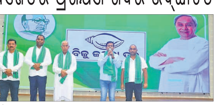
କାର୍ଯ୍ୟକ୍ରମରେ ମୁଖ୍ୟ ଅତିଥିଙ୍କ ସହ ଅନ୍ୟମାନେ।