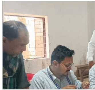
କାମାକ୍ଷାନଗର, ୧୭୧୧ (ଅମଳାକାନ୍ତ ସାହୁ)

ଡେଜାନାଲ ଜିଲ୍ଲା କାମାକ୍ଷାନଗର ଉପଖଣ୍ଡ କଳକୋଣାର ଉପଖଣ୍ଡସ୍ତରୀୟ ଭୀମଭୋଇ ଭିନ୍ନକ୍ଷମ ସାମର୍ଥ୍ୟ ଶିବିର ଅନୁଷ୍ଠିତ ହୋଇଥିଲା।