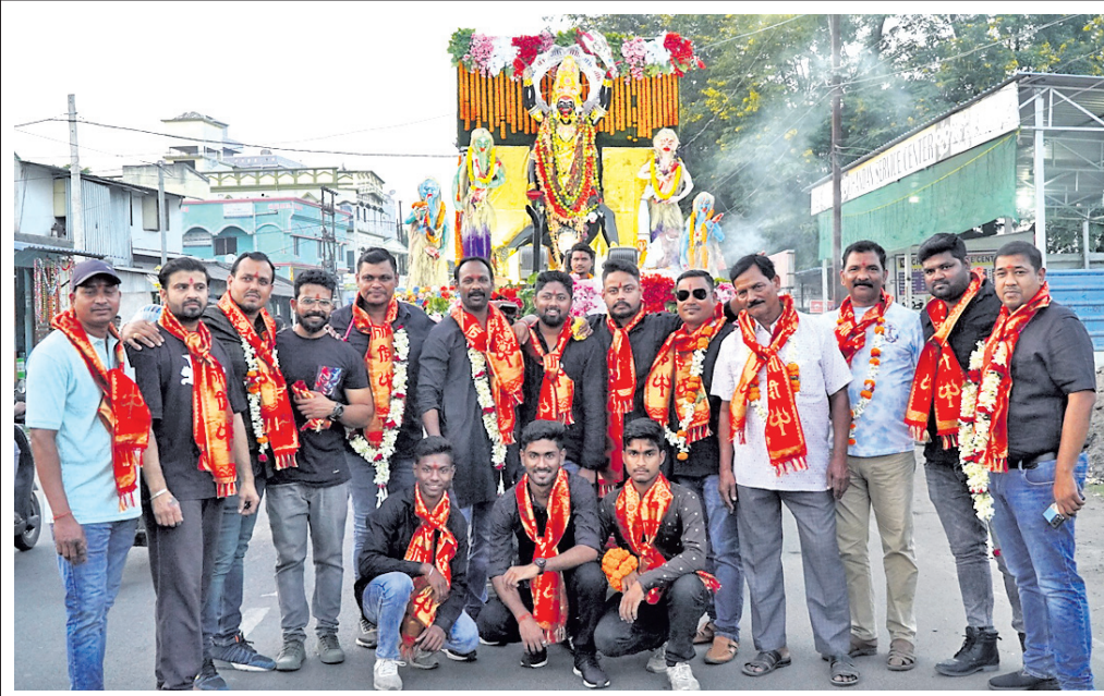
ଅନୁଗୋଳ ହେମପୁରପଡ଼ା କାଳୀ ପୂଜାର ଭବାଣୀ ଶୋଭାଯାତ୍ରା ଅବସରରେ କର୍ମକର୍ମୀମାନେ।

ଦେଢ଼ାମାଲ, ୧୭।୧୧ (ରତନ ନାୟକ) ଦେଢ଼ାମାଲ ସହର ଗଣେଶ ବଜାରଠାରୁ ଶୁକ୍ରବାର ଅପରାହ୍ଣ ସମୟରେ ଏକ