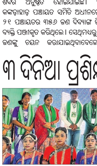
ଉଦ୍‌ଘାଟନା ଅବସରରେ ବିଧାୟକ, ସ୍ୱାମୀଜୀ ଓ ଅନ୍ୟମାନେ ମଞ୍ଚାସୀନ ଅଛନ୍ତି।

ପାଲଲହଡ଼ା, ୧୭୧୧ (ବିନୟକାନ୍ତ ଦାଶ) ପାଲଲହଡ଼ା ଶରତ ଚନ୍ଦ୍ର କୁଳଠାରେ ବିଜୁ ଜନତା ଦଳ ପକ୍ଷରୁ ୩ ଦିନିଆ ନିର୍ବାଚନମଣ୍ଡଳୀସ୍ତରୀୟ ପ୍ରଶିକ୍ଷଣ ଶିବିର ଉଦ୍‌ଘାଟିତ ହୋଇଥିଲା।