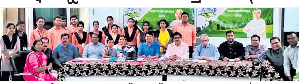
ଅନୁଗୋଳ, ୧୭।୧୧ (ଅମିତ କୁମାର ସାମଲ)

ଓଡ଼ିଶା ସରକାରଙ୍କ ଚତୁର୍ଥାଧିକାରୀଙ୍କୁ ଅନୁଗୋଳ ସରକାରୀ ସ୍ୱୟଂଶାସିତ ମହାବିଦ୍ୟାଳୟ ପରିସରରେ 'ନୂଆ