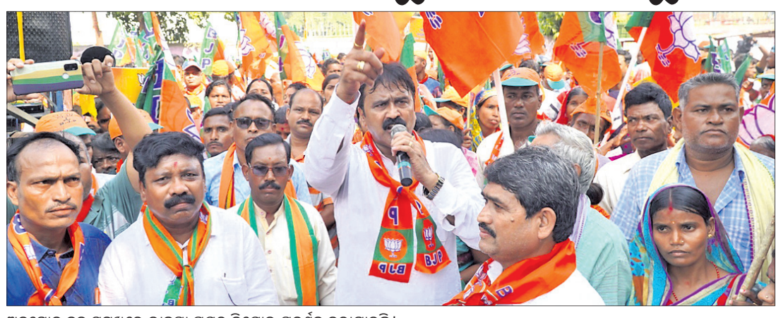
ଅନୁଗୋଳ ଲୁକ୍ତ ସମ୍ମୁଖରେ ଭାଙ୍ଗି ପକାଇବା ପ୍ରଦର୍ଶନ କରାଯାଇଛି।