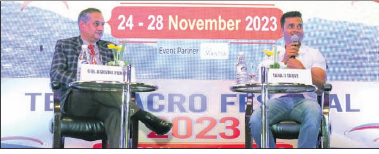
ଭୁବନେଶ୍ୱର, ୧୭.୧୧ (ଅଭୟ ଦାଶ)

ଉତ୍ତରାଖଣ୍ଡ ତୁରିଜମ୍ ଟେକ୍ସଟିଲ ଲିମିଟେଡ୍ ବୋର୍ଡ (ଡୁଇଟିଭି) ପକ୍ଷରୁ ଏକ ୫ ଦିନିଆ 'ଆକ୍ରୋ ଫେଷ୍ଟିଭାଲ' ଚଳାଉଛି।