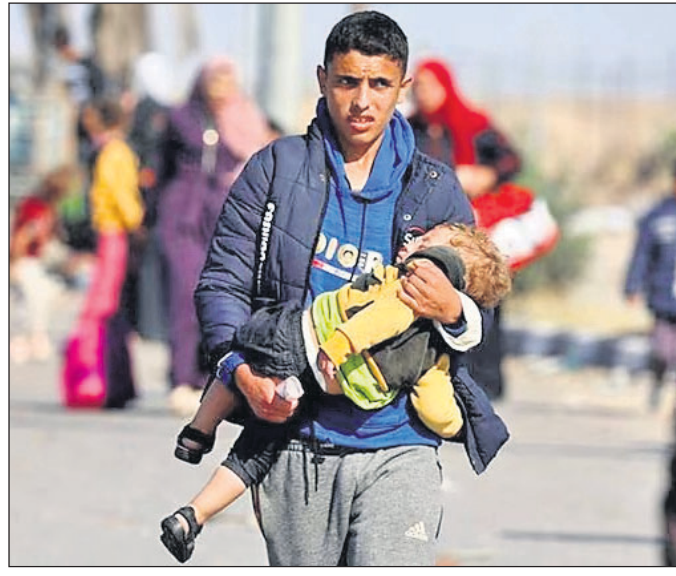
ଜଣେ ପାଲେଷ୍ଟିନୀୟ ତାଙ୍କ ଶିଶୁକୁ ଧରି ଉତ୍ତର ଗାଜାକୁ ଦକ୍ଷିଣକୁ ପଳାୟନ କରୁଛନ୍ତି।

ଇସ୍ରାଏଲ ସୈନ୍ୟଙ୍କ ଦଖଲରେ ଥିବା ଗାଜାରେ ସର୍ବବୃହତ୍ ହସ୍ତିତାଲ ଅଲ୍-ଶିଫା ରୋଗୀ, ମେଡିକାଲ କର୍ମଚାରୀ ଓ ସେଠାରେ ଆଶ୍ରୟ ନେଇଥିବା ଲୋକମାନେ ପଳାୟନ କରିଛନ୍ତି। ଦଶଏ ମଧ୍ୟରେ ହସ୍ତିତାଲ ଖାଲି କରିବାକୁ ଇସ୍ରାଏଲ ସେନା ପକ୍ଷରୁ କୁହାଯାଇଥିଲା ବୋଲି ପାଲେଷ୍ଟିନୀୟ ଅଧିକାରୀମାନେ କହୁଥିବାବେଳେ ଏହାକୁ ଜେରୁଜେଲମ୍ ଖଣ୍ଡନ କରିଛି। ଶନିବାର ସକାଳେ ଇସ୍ରାଏଲ ସେନା ହସ୍ତିତାଲ ଖାଲି କରିବାକୁ ନିର୍ଦ୍ଦେଶନାମା ଜାରି କରିଥିଲା ବୋଲି ସ୍ୱାସ୍ଥ୍ୟ ଅଧିକାରୀମାନେ କହିଛନ୍ତି। ତେବେ ସେଇଠାରେ ହସ୍ତିତାଲ ଛାଡ଼ିବାକୁ ଆଶା କରୁଥିବା ସେମାନଙ୍କୁ ନିରାପଦରେ ପଳାୟନ ପାଇଁ ସୁଯୋଗ ଦିଆଯାଇଥିଲା ବୋଲି ସେନା କହିଛି। ସେଠାରେ ସୁରୁତର ରୋଗୀଙ୍କଠାରୁ ଆରମ୍ଭ କରି ହଜାର ହଜାର ଲୋକ ରହିଥିଲେ। ଗାଜା ଷ୍ଟିପ୍ରେରେ ଦୀର୍ଘଦିନ ଚେଲି ଯୋଗାଯୋଗ ବନ୍ଦ ରହିବା ପରେ ଶନିବାର ଇଷ୍ଟରନେଟ୍ ଓ ଫୋନ୍ ସେବା ଆଂଶିକ କାର୍ଯ୍ୟକ୍ଷମ ହୋଇଛି। ଯୋଗାଯୋଗ ବିଚ୍ଛିନ୍ନ ହୋଇଯିବାକୁ ଗାଜାକୁ ମାନବୀୟ ସହାୟତା ପହଞ୍ଚାଇବା ବନ୍ଦ ହୋଇଯାଇଥିଲା। ପୂର୍ବରୁ ଗାଜାର ସାଧାରଣ ନାଗରିକମାନଙ୍କୁ ଉତ୍ତର ଗାଜା ଛାଡ଼ି ପଳାୟନକୁ