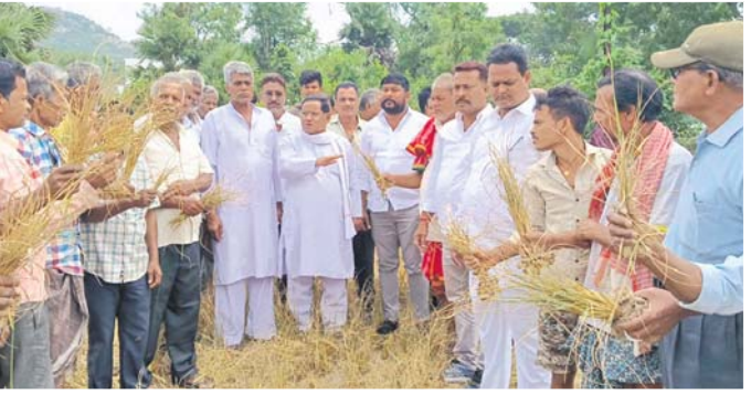
କ୍ଷତିଗ୍ରସ୍ତ ଫସଲ ଅନୁଧ୍ୟାନ କରୁଛନ୍ତି କିଷାନ କଂଗ୍ରେସ ଚିମ

ସ୍ୱଳ୍ପ ବୃଷ୍ଟି ଯୋଗୁ ଚଳିତ ବର୍ଷ ଗଞ୍ଜାମ ଜିଲାରେ ଖରିଫ ଧାନ ଫସଲ ସମ୍ପୂର୍ଣ୍ଣ ଉତୁଡ଼ି ଯାଇଛି। ୨୨ଟି ଯାକ କୁଳ ଅଞ୍ଚଳରେ ମରୁଡ଼ି ସ୍ଥିତି ଭୟଙ୍କର ହୋଇଛି। ଫଳରେ ଲକ୍ଷାଧିକ ଗଞ୍ଜାମ ଚିକା ବଢ଼ିଯାଇଛି। ଅଧିକାଂଶ ଜମିରେ ଗୋରୁଚାଲ ପଶି ଚଳୁଛନ୍ତି। କୃଷି ବନ୍ଧୁ ଏହି ଜିଲାରେ ଚେତାବନା ପ୍ରତି ସରକାର ଆଖିବୁଜି ଦେଇଥିବା ଏହାର ମୂଳ କାରଣ ହୋଇଛି। ଗଞ୍ଜାମକୁ ମରୁଡ଼ି ଘୋଷଣା ସହ କ୍ଷତିଗ୍ରସ୍ତ ଗଞ୍ଜାମ ସରକାର ତୁରନ୍ତ ଆର୍ଥିକ ସହାୟତା ଦେବାକୁ କଂଗ୍ରେସ ପକ୍ଷରୁ ଦାବି କରାଯାଇଛି। ଦ୍ୱିତୀୟ ପଦକ୍ଷେପ ନିଆନଗଲେ ଗଞ୍ଜାମୁ ମେଳିକରି ଜିଲା ବ୍ୟାପୀ ଆନ୍ଦୋଳନ କରାଯିବାର ଚେତାବନା ଦିଆଯାଇଛି।