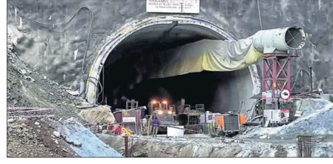
ଆମେରିକା ନିର୍ମିତ ଏଠାରେ ମେଶିନରେ ତ୍ରୁଟି ଦେଖାଦେବାକୁ କାମ ଚାଲିଥିବାବେଳେ ଉଦ୍ଧାର କାର୍ଯ୍ୟରେ ନିୟୋଜିତ ଥିବା

ଉତ୍ତରାଖଣ୍ଡର ଉତ୍ତରକାଶୀରେ ଥିବା ସିଲ୍‌କ୍ୟାମା ସୁଡ଼ଙ୍ଗ ତ୍ରୁଟି ଏହା ତଳେ ୪୧ ଶ୍ରମିକ ୬ ଦିନ ହେଲା ପର୍ଯ୍ୟନ୍ତ ରହିଥିବାବେଳେ ଉଦ୍ଧାର କାର୍ଯ୍ୟ ବିଶେଷ ଅଗ୍ରଗତି କରିପାରୁ ନାହିଁ। ଫଳରେ ଶ୍ରମିକ ପରିବାର ଓ ଗ୍ଲାନାୟ ଲୋକଙ୍କ ମଧ୍ୟରେ ଉଦ୍ଧାରକାରୀ ଦେଖାଦେଇଛି। ଶୁକ୍ରବାର ଉଦ୍ଧାର କାର୍ଯ୍ୟରେ ନିୟୋଜିତ ଥିବା କର୍ମଚାରୀମାନେ ପ୍ରତ୍ୟେକ ଶିବ ଶୁଣିବାକୁ କାମ ବନ୍ଦ କରିଥିଲେ। ଖନନ କାର୍ଯ୍ୟରେ ନିୟୋଜିତ ଥିବା ସୁଡ଼ଙ୍ଗରେ ତ୍ରୁଟି ସୂଚକ ସୂଚକ ମାଧ୍ୟମରେ ଉଦ୍ଧାର କାର୍ଯ୍ୟରେ ନିୟୋଜିତ ଥିବା ବିଲ୍‌କ୍ୟାମା ସୁଡ଼ଙ୍ଗ ତ୍ରୁଟି ଏହା ତଳେ ୪୧ ଶ୍ରମିକ ୬ ଦିନ ହେଲା ପର୍ଯ୍ୟନ୍ତ ରହିଥିବାବେଳେ ଉଦ୍ଧାର କାର୍ଯ୍ୟ ବିଶେଷ ଅଗ୍ରଗତି କରିପାରୁ ନାହିଁ। ଫଳରେ ଶ୍ରମିକ ପରିବାର ଓ ଗ୍ଲାନାୟ ଲୋକଙ୍କ ମଧ୍ୟରେ ଉଦ୍ଧାରକାରୀ ଦେଖାଦେଇଛି। ଶୁକ୍ରବାର ଉଦ୍ଧାର କାର୍ଯ୍ୟରେ ନିୟୋଜିତ ଥିବା କର୍ମଚାରୀମାନେ ପ୍ରତ୍ୟେକ ଶିବ ଶୁଣିବାକୁ କାମ ବନ୍ଦ କରିଥିଲେ। ଖନନ କାର୍ଯ୍ୟରେ ନିୟୋଜିତ ଥିବା