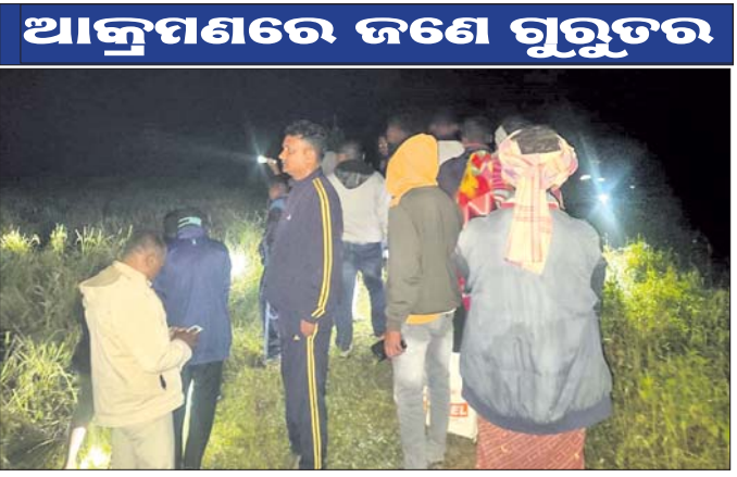
ବାଲିଗୁଡ଼ା ଅନାଗୁଳ ସଂରକ୍ଷିତ ଜଙ୍ଗଲରେ ହାତୀପଲଙ୍କୁ ଲୋକେ ଘରଡ଼ାଉଛନ୍ତି। ମେଡିକାଲକୁ ସ୍ଥାନାନ୍ତର କରାଯାଇଛି। ବୁଝା ଓ ଜଗନ୍ନାଥପ୍ରସାଦ ବନାଞ୍ଚଳର

ଜଗନ୍ନାଥପ୍ରସାଦ/ଫୁଲବାଣୀ, ୧୮୧୧୧ (ବିଜୁ ପ୍ରସାଦ ପଞ୍ଚନାୟକ/ରାଜେଶ ରାଉତ)