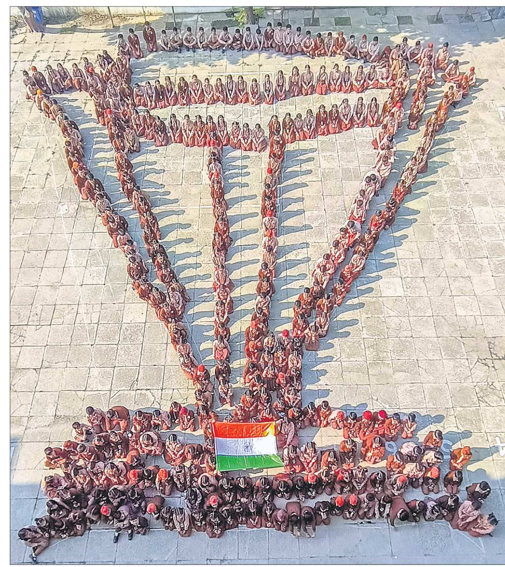
ମୋରାବାଦର ଏକ ସ୍କୁଲରେ ପିଲାମାନେ ଆଇସିସି ବିଶ୍ୱକପ ଟ୍ରଫି ଆକୃତିରେ ସଜେଇ ହୋଇଛନ୍ତି।