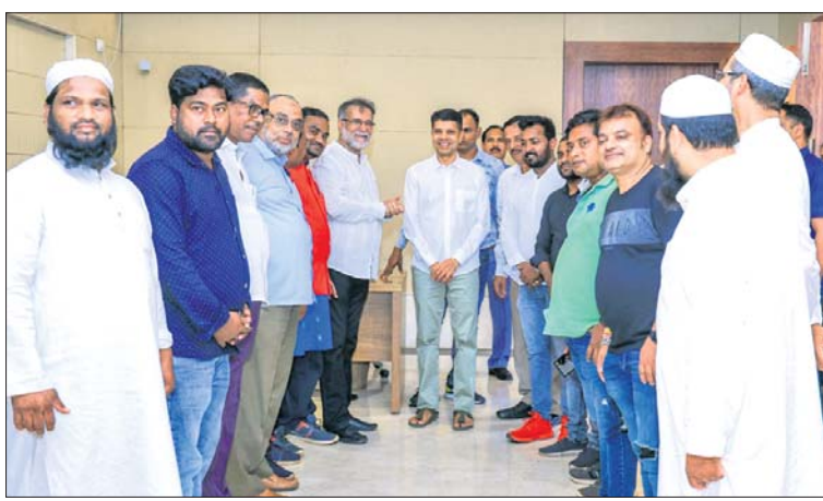
ଭୁବନେଶ୍ୱରସ୍ଥିତ ନବୀନ ନିବାସରେ ଶନିବାର ୫-ଟି ଏବଂ ନବୀନ ଓଡ଼ିଶା ଅଧକ୍ଷ ଡି.କେ. ପାଠିଆନଙ୍କୁ ବିଭିନ୍ନ ସଙ୍ଗଠନର ସଦସ୍ୟମାନେ ଭେଟୁଛନ୍ତି।