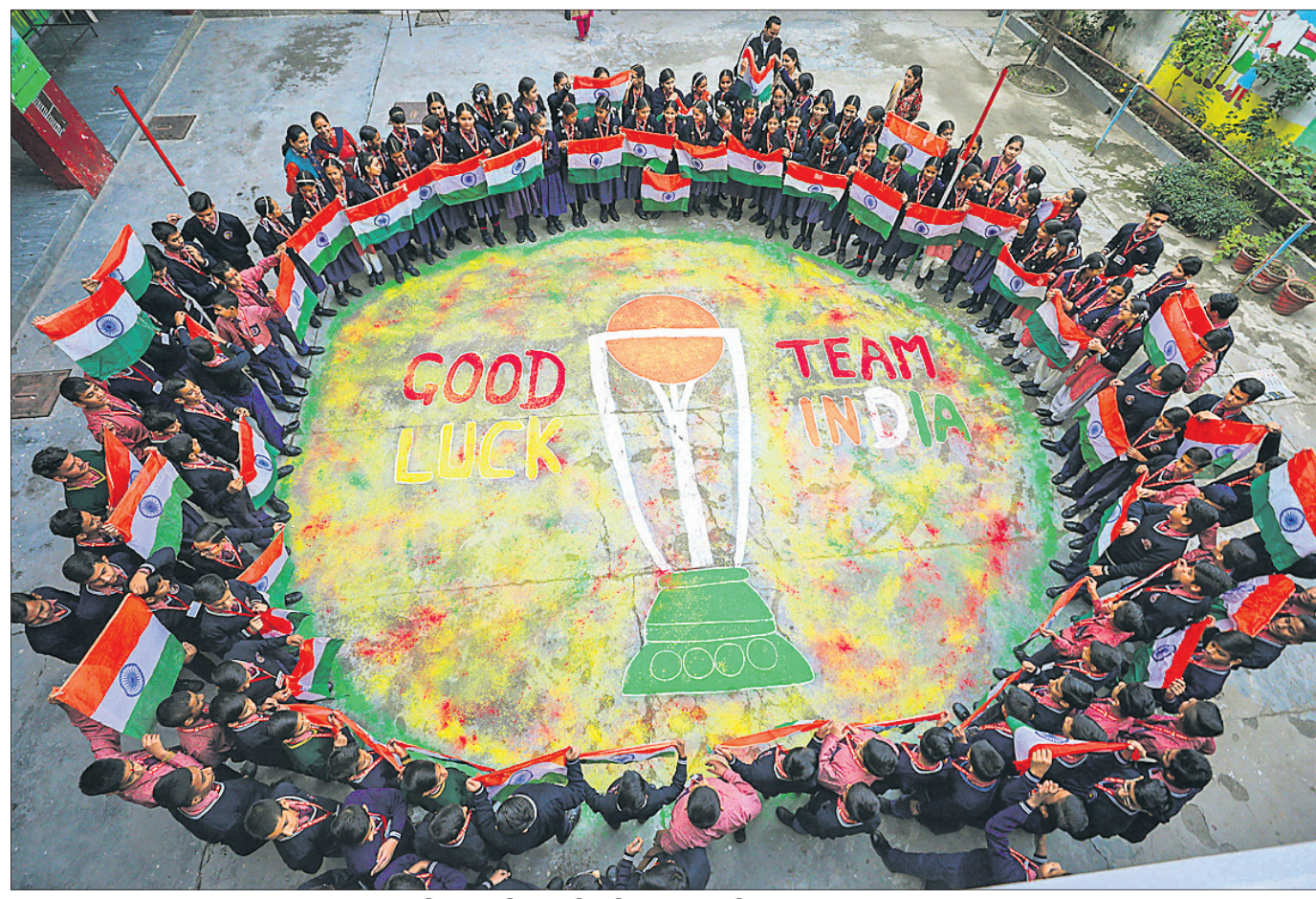
କଲ୍ଚୁରେ ବିଶ୍ୱକପ ଟ୍ରଫି ଉଲ୍ଲେଖି ଚାରିପାଖରେ ସ୍କୁଲ ପିଲାମାନେ କାତାୟ ପତାକା ସଜା।

ବିଚାର ହାତକା ଚଳେ ଗାଡ଼େଟ୍ରେ ଏକ ରୋମାଞ୍ଚକ ସେମିପାଇନାଲରେ ଦକ୍ଷିଣ ଆଫ୍ରିକାକୁ ପରାସ୍ତ କରିବା ପରେ ଅଷ୍ଟ୍ରେଲିଆ ଶୁଣ୍ଠି ଥର ବିଶ୍ୱକପ ଚାଲିବ।