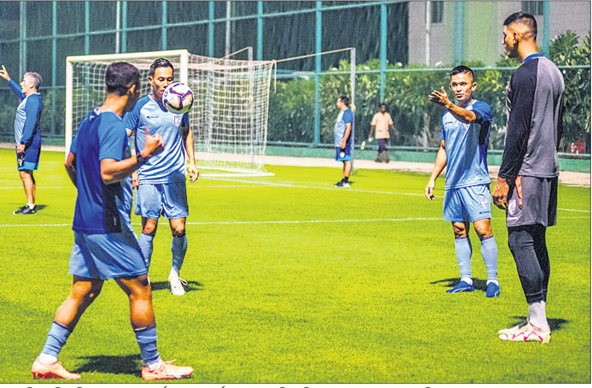
କାତାର ବିପକ୍ଷ ଫିଫା ବିଶ୍ୱକପ ଯୋଗ୍ୟତା ପର୍ଯ୍ୟାୟ ମ୍ୟାଚ ପୂର୍ବରୁ ଭୁବନେଶ୍ୱରସ୍ଥିତ ଓଡ଼ିଶା ଯୁବକଲ ଟ୍ରାଣିଂ ସେଣ୍ଟରରେ ଖିଲିକାର ଭାରତୀୟ ଯୁବକଲ ଦଳର ଅଭ୍ୟାସ ।