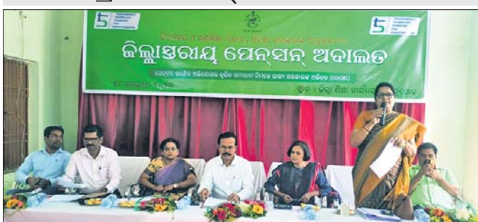
ରାଜ୍ୟର ଜିଲ୍ଲାସ୍ତରୀୟ ପ୍ରଥମ ପେନ୍ସନ ଅଦାଲତରେ ମଞ୍ଚାସୀନ ଅଧିକାରୀମାନେ।