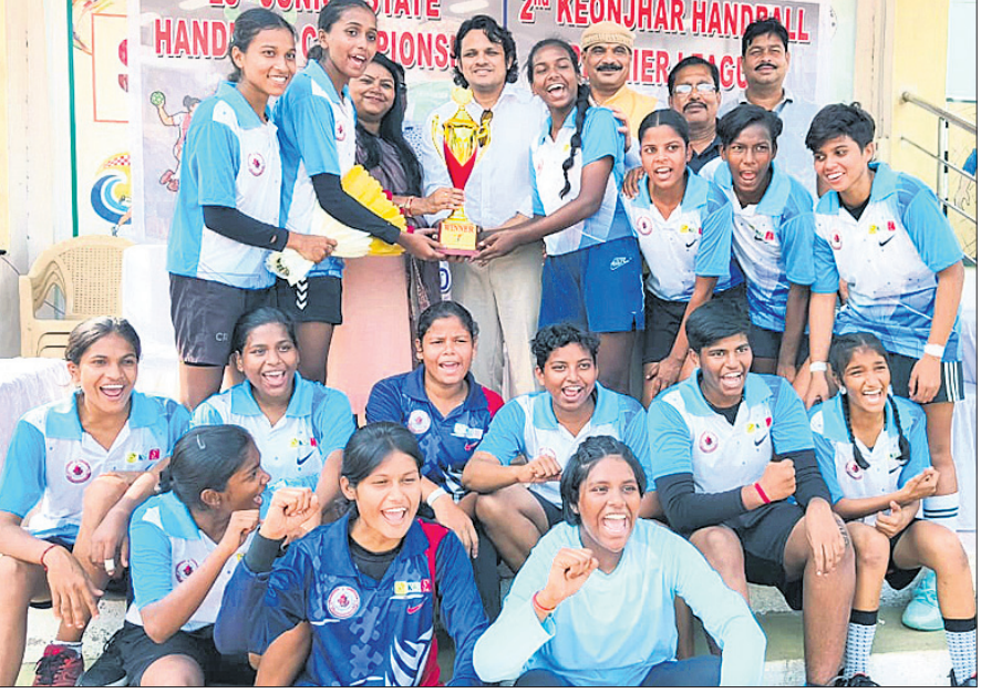
ଅତିଥିକଠାରୁ ପୁରସ୍କାର ଗ୍ରହଣ ଅବସରରେ ଚାମ୍ପିୟନ ଗଞ୍ଜାମ ଦଳର ଖେଳାଳି ।