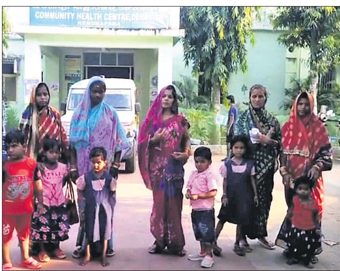
ଡାକ୍ତରଖାନାକୁ ଚିକିତ୍ସିତ ହୋଇ ଫେରୁଥିବା ପିଲାମାନେ।

୩ରୁ ୬ ବର୍ଷ ଯାଏ ଶିଶୁଙ୍କ ପାଇଁ ପୁଷ୍ଟିକର ଖାଦ୍ୟ ପ୍ରଦାନ ସହିତ ଖେଳକୋଡ଼ିତ ମାଧ୍ୟମରେ ଶିକ୍ଷାଦାନ ପାଇଁ ସରକାରଙ୍କ ପକ୍ଷରୁ ପ୍ରତ୍ୟେକ ଗ୍ରାମରେ ଅଙ୍ଗନୱାଡ଼ି କେନ୍ଦ୍ର ଖୋଲାଯାଇଛି। ପିଲାଙ୍କ ଯତ୍ନ ପାଇଁ କେନ୍ଦ୍ରରେ ଅବସ୍ଥାପିତ ଥିବା ଅଙ୍ଗନୱାଡ଼ି କର୍ମୀ ଓ ସହାୟିକା ସମ୍ପୂର୍ଣ୍ଣ ଭାବେ ତତ୍ପର ରହିଥାନ୍ତି। ଏଥିପାଇଁ ପ୍ରତ୍ୟେକ ପିଲାଙ୍କୁ ଶିକ୍ଷାଦାନ ସହ ମଧ୍ୟାହ୍ନ ଭୋଜନ ବ୍ୟବସ୍ଥା କରାଯାଇଛି। ତେବେ ମଧ୍ୟାହ୍ନ ଭୋଜନରେ ଝିଟିପିଟି ବାହାରିବା ଓ ସେହି ଖାଦ୍ୟ ଖାଇ ୧୧ ଜଣ ପିଲାଙ୍କୁ ଅସୁସ୍ଥ ହେବା ଘଟଣା ଶନିବାର କେନ୍ଦ୍ରପଡ଼ା ଜିଲ୍ଲା ଡେରାବିଶ ବ୍ଲକ୍ ଅଞ୍ଚଳରେ ଆଲୋଡ଼ନ ସୃଷ୍ଟି କରିଛି। ସୂଚନା ଅନୁଯାୟୀ, ଡେରାବିଶ ବ୍ଲକ୍ ଅଧୀନ ନରସିଂହପୁର ଅଞ୍ଚଳରେ ପୁଣିଲୋ ଗ୍ରାମରେ ୧୨ଟି ଅଙ୍ଗନୱାଡ଼ି କେନ୍ଦ୍ରରେ ଶନିବାର ୧୨ ଜଣ ପିଲାଙ୍କ ଉପସ୍ଥାନ ଥିଲା। ସେମାନଙ୍କ ମଧ୍ୟାହ୍ନ ଭୋଜନ ପାଇଁ ଭାତ ତାଳମା ପ୍ରସ୍ତୁତ ହୋଇଥିଲା। ନିର୍ଦ୍ଧାରିତ ସମୟରେ ପିଲାମାନେ ଖାଇବା ପାଇଁ ବସିଥିଲେ। ହେଲେ ଖାଇବା ସମୟରେ