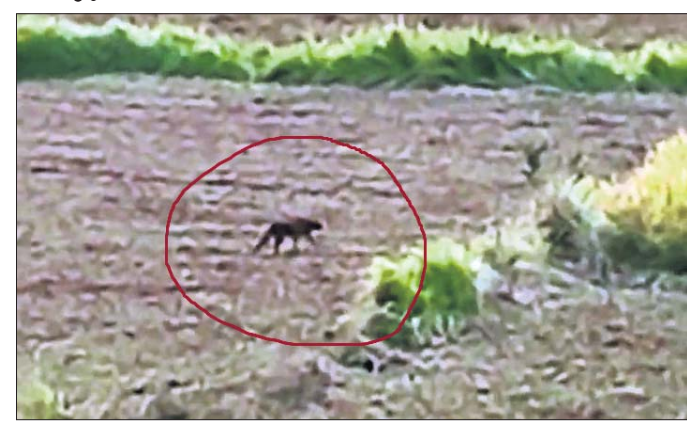
ବିଲରେ ବୁଲୁଥିବା ବାଘ।