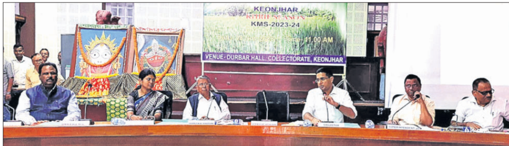
ଜନ ପ୍ରତିନିଧି ଓ ପ୍ରଶାସନିକ ଅଧିକାରୀମାନେ।