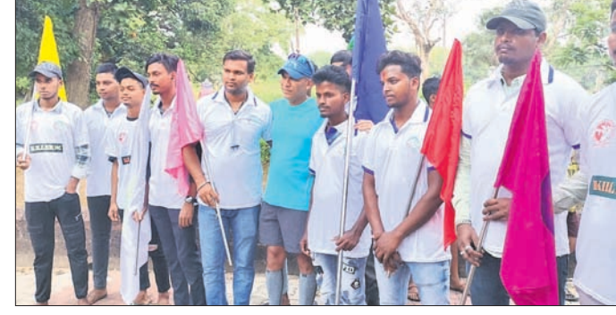
କୁପାରୀ ଶୂନ୍ୟମଣ୍ଡପରୁ ବାହାରିଥିବା ରାଲି।