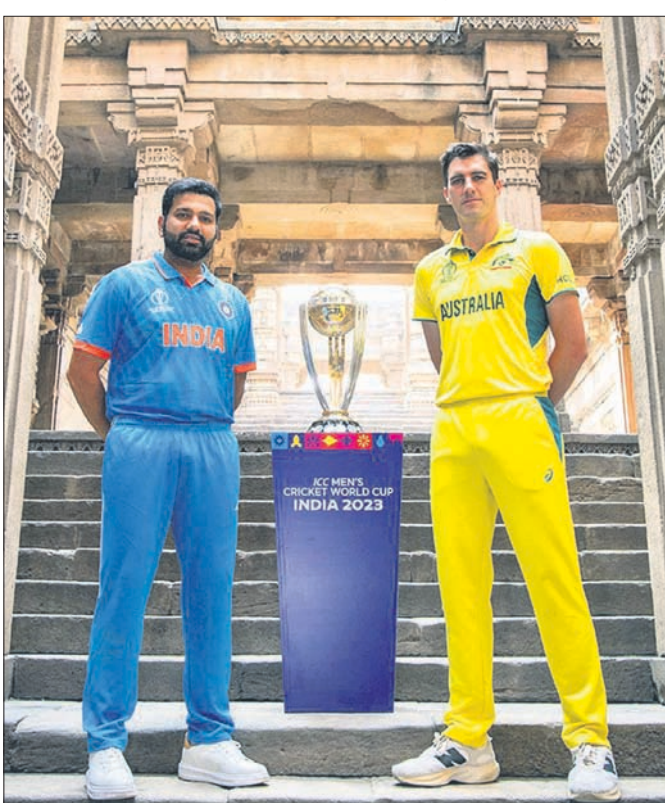
ଦିନିକିଆ କ୍ରିକେଟ୍ ବିଶ୍ୱକପ୍ ଫାଇନାଲ ପୂର୍ବରୁ ଅହମଦାବାଦରେ ଶନିବାର ଗ୍ରୁପ୍ ନିକଟରେ ଦୁଇ ଦଳର ଅଧିନାୟକ ରୋହିତ ଶର୍ମା ଓ ପ୍ୟାଟ୍ କୁମିନ୍ସ ।

ରବିବାର ଅହମଦାବାଦର ନରେନ୍ଦ୍ର ମୋଦି କ୍ରିକେଟ୍ ଷ୍ଟାଡ଼ିୟମରେ ଖେଳାଯିବ ଦିନିକିଆ କ୍ରିକେଟ୍ ବିଶ୍ୱକପ୍ ଫାଇନାଲ । ସୁପର ସର୍ବୋତ୍ତମ ଭାରତ ଓ ଅଷ୍ଟ୍ରେଲିଆ ମଧ୍ୟରେ ହେବ ମହାମୁକାବିଲା । ୫ ଥର ବିଶ୍ୱ ଚାମ୍ପିୟନ ଅଷ୍ଟ୍ରେଲିଆ ନିଜର ପୂର୍ବ ଐତିହ୍ୟ ପାଇଁ ଲଢେଇ କରୁଥିବା ବେଳେ ୨୦୦୩ ଦିନିକିଆ ବିଶ୍ୱକପ୍ ଫାଇନାଲ ପରାକ୍ରମ ପ୍ରତିଶୋଧ ପାଇଁ ପଡ଼ିଆକୁ ଓହ୍ଲାଇବ ଭାରତ । ଅଷ୍ଟ୍ରେଲିଆ ଅଷ୍ଟମ ଥର ପାଇଁ ବିଶ୍ୱକପ୍ ଫାଇନାଲରେ ପ୍ରବେଶ କରିଥିବା ବେଳେ ଭାରତର ଏହା ଚତୁର୍ଥ ପ୍ରୟାସ । ଭାରତୀୟ ଦଳରେ ଥିବା ବିରାଟ କୋହଲି ଓ ରବିନ୍ଦ୍ରନ ଅଶ୍ୱିନ ପୂର୍ବରୁ ବିଶ୍ୱକପ୍ ଜିତି ସାରିଛନ୍ତି । ଅନ୍ୟ ସମସ୍ତ ଖେଳାଳିଙ୍କ ପାଇଁ ଏହା ଏକ ନୂତନ ଅଭିଜ୍ଞତା ହେବ । ଅନ୍ୟପକ୍ଷରେ ଅଧିନାୟକ ରୋହିତ ଶର୍ମା ଚି୨୦ ବିଶ୍ୱକପ୍ ବିଜୟୀ ଦଳର ସଦସ୍ୟ ରହିଥିଲେ ମଧ୍ୟ ଦିନିକିଆ ବିଶ୍ୱକପ୍ରେ ଏହା ତାଙ୍କର ପ୍ରଥମ ଫାଇନାଲ । ତେଣୁ ରବିବାର ଏକ ଚମତ୍କାର ଲଢେଇ ଦେଖିବାକୁ ମିଳିବ । ବାହ୍ୟ ଖବର ଦ୍ୱାରା ଭାରତୀୟ ଦଳ ପ୍ରଭାବିତ ହେଉ ନ ଥିବା ନେଇ