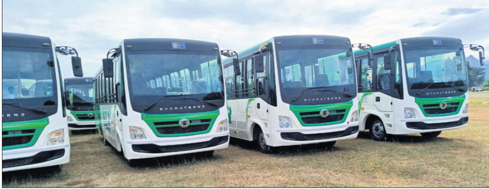
କେକେପୁରର ବିଭିନ୍ନ ପୋଲିସ୍ ଠାନୁରେ ଛିଡ଼ା ହୋଇଥିବା ଲକ୍ଷ୍ମୀ ବସ୍ ।

ସହର ଓ ଗ୍ରାମାଞ୍ଚଳ ମଧ୍ୟରେ ଯାତାୟତ ସୁବିଧା କରିବାକୁ ରାଜ୍ୟ ସରକାର ଏକ ନୂଆ ପଦକ୍ଷେପ ନେଇଛନ୍ତି । ରାୟଗଡ଼ା ଜିଲ୍ଲାରେ ଆଗାମୀ ୨୫ ତାରିଖରୁ ଲକ୍ଷ୍ମୀ ବସ୍ ସେବା ଆରମ୍ଭ ହେବ । ଗ୍ରାମୀଣ ଜିଲ୍ଲା ଖେଳପଡ଼ିଆଠାରୁ ଏହାର ଉଦ୍‌ଘାଟନ ପରେ ୩୯ଟି ରୁଟ୍‌ରେ ପଞ୍ଚାୟତରୁ ବୁକ୍‌କୁ ଯୋଡ଼ି ହେବ ଲକ୍ଷ୍ମୀ ବସ୍ । ଏଥିପାଇଁ ସମସ୍ତ ପ୍ରସ୍ତୁତି ଶେଷ ହୋଇଛି । ଏହି କ୍ରମରେ ରାୟଗଡ଼ା ଜିଲ୍ଲାକୁ ପ୍ରଥମ ପର୍ଯ୍ୟାୟରେ ୪୧ଟି ବସ୍ ଆସିଛି । ଏବେ କେକେପୁରର ବିଭିନ୍ନ ପୋଲିସ୍ ଠାନୁରେ ସମସ୍ତ ବସ୍ ରହିଥିବା ଜଣାପଡ଼ିଛି । ବସ୍ ରହିବା ପାଇଁ ପଞ୍ଚାୟତ ରୁଟ୍‌କରେ ଅସ୍ଥାୟୀ ଭାବେ ପାର୍କିଙ୍ଗ୍ ପ୍ରଦାନ କରାଯିବ ।