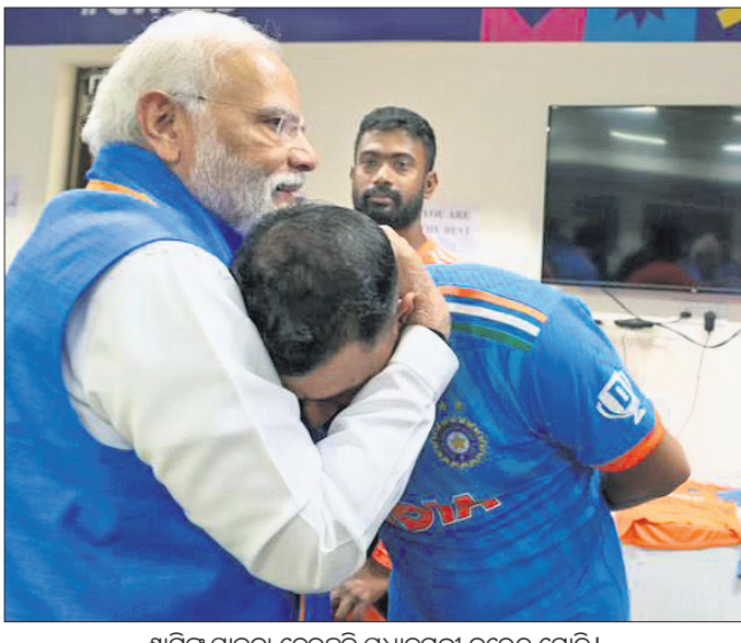
ଶାମିଙ୍କୁ ସାହୁବା ଦେଉଛନ୍ତି ପ୍ରଧାନମନ୍ତ୍ରୀ ନରେନ୍ଦ୍ର ମୋଦି।

ବୋଲି ଅନ୍ତର୍ଜାତୀୟ କ୍ରିକେଟ ପରିଷଦ ଦଳ ଅଧିକ ଲିଗ୍ ପର୍ଯ୍ୟାୟରେ ଏବଂ (ଆଇସିସି)ର ଫ୍ରେନ୍ଦ୍ ସାଇଟ୍ରେ ଏହା ପ୍ରକାଶ ପାଇଛି। ଭାରତର ମୁଖ୍ୟ ପେସ୍ ବୋଲର ଯଶପ୍ରୀତ ବୁମ୍ରା ୨୦୨୩ ବିଶ୍ୱକପ୍ରେ ୪ର୍ଥ ସଫଟ୍ ବୋଲର ବିବେଚିତ ହୋଇଛନ୍ତି। ସେ ୧୧ଟି ମ୍ୟାଚରେ ୧୮.୬୫ ଆଇରେଜରେ ୨୦ ଉଇକେଟ ନେଇଛନ୍ତି। ଗୋଟିଏ ମ୍ୟାଚରେ ତାଙ୍କର ଇକୋନୋମି ରେଟ୍ ୪.୦୬ ରହିଥିଲା। ତାଙ୍କୁ ମଧ୍ୟ ଆଇସିସି ଏକାଦଶରେ ଗ୍ଲାନ ମିଳିଛି। ଦଳରେ ଅଲରାଉଣ୍ଡର ଖେଳାଳି ହିସାବରେ ଅଷ୍ଟ୍ରେଲିଆର ଭେରେନାନ୍ ଗ୍ଲେନ ମାକ୍ଗ୍ରୋଲିଙ୍କ ସହ ରବୀନ୍ଦ୍ର ଜାଡେଜା ଗ୍ଲାନ ପାଇଛନ୍ତି। ଭାରତର ସ୍ପିନ୍ ବୋଲି ଅଲରାଉଣ୍ଡର ଟୁର୍ନାମେଣ୍ଟରେ ସ୍ଥିର ପ୍ରଦର୍ଶନ କରିବା ସହ ମିଚେଲ ଓଜରଗୁଡ଼ିକର ଗୁରୁତ୍ୱପୂର୍ଣ୍ଣ ଉଇକେଟ ଅଣ୍ଟିଆର କରିଥିଲେ। ପ୍ରତିଯୋଗିତାରେ ଯେଉଁ ଦୁଇ ଜଣ ଓପନର ୪ ଶତକ ହାସଲ କରିଛନ୍ତି ତନ୍ମଧ୍ୟରେ ଏହି ବିଶ୍ୱକପ୍ ସହ ଅନ୍ତର୍ଜାତୀୟ ଦିନିକିଆରୁ ଅଧିକ ରେକର୍ଡ୍ ହାସଲ କରିଛନ୍ତି କ୍ରିଷ୍ଣ ଟିକ୍ ଅନ୍ୟତମ। ତାଙ୍କୁ ଆଇସିସି ଦଳରେ ଅନ୍ୟତମ ଓପନର ଭାବେ ନିଆଯାଇଛି। ଦଳର ୪ ନମ୍ବର ଗ୍ଲାନ ମୁକ୍ତିଲାଭରେ ତେଲି ମିଚେଲଙ୍କୁ ମିଳିଛି। ମୁକ୍ତିଲାଭରେ ସେ ଜଣେ ମାତ୍ର ବ୍ୟାଟର ଯିଏକି ଭାରତୀୟ ବୋଲରମାନଙ୍କ ବିପକ୍ଷରେ ପ୍ରଭାବୀ ରହିଥିଲେ। ଦୁଇ