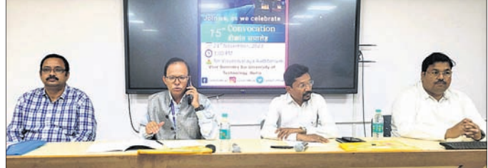
ଭୁବନେଶ୍ୱର, ୨୦୧୧