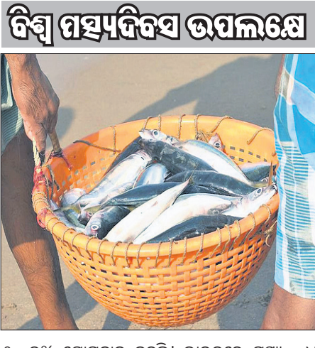
ବିଶ୍ୱ ମହ୍ୟଦିବସ ଉପଲକ୍ଷେ

ପୃଥିବୀରେ ଜୀବନ ସର୍ଜନା ଆରମ୍ଭରୁ ମହ୍ୟ ସମ୍ପଦର ଉପସ୍ଥିତି ଉଭୟ ଜୀବ ବିଜ୍ଞାନୀ ଓ ଭଗବତ୍‌ବିଶ୍ୱାସୀମାନେ ଗ୍ରହଣ କରନ୍ତି । ମାଛ ଏକ ପୁଷ୍ଟିକ, ପୁଷ୍ଟିକର, ସହଜ ଉପଲବ୍ଧ ଓ ସ୍ୱାଦମୂଳକ ହୋଇଥିବାରୁ ଏବେ ବିଶ୍ୱରେ ମାଛ ଖାଉଥିବା ଲୋକଙ୍କ ସଂଖ୍ୟା ପ୍ରାୟ ୩ ଶହ କୋଟି ଓ ବାର୍ଷିକ ପ୍ରାୟ ୧୫୦ ନିୟୁଟ ଟନ୍ ମାଛ ଖାଦ୍ୟ ଭାବେ ବ୍ୟବହୃତ ହୁଏ । ବିଶ୍ୱରେ ଆବଶ୍ୟକ ପଦ୍ମୁଥିବା ପ୍ରାଣୀଙ୍କ ପ୍ରୋଟିନର ଶତକଡ଼ା ୨୫ ଭାଗ କେବଳ ମାଛ ହିଁ ଭରଣା କରିଥାଏ । କୋଟି କୋଟି ବିଶ୍ୱବାସୀଙ୍କୁ ଖାଦ୍ୟ ଯୋଗାଇଥିବା ଏକ ବିଶାଳ ଉପ ସମୁଦ୍ର ଗୁରୁତ୍ୱ ଉପକଳ୍ପିତ କରିବା ତଥା ମାଛଧରା କାର୍ଯ୍ୟକ୍ରମର ପୋଷଣା ପରିଚାଳନା କେତେଦୂର କାର୍ଯ୍ୟକାରୀ ହୋଇଛି ଓ ଭବିଷ୍ୟତ ପାଇଁ କାର୍ଯ୍ୟ ଖସଡ଼ା ପ୍ରସ୍ତୁତ କରିବା ହିଁ ଏହି ଦିବସ ପାଳନର ମୁଖ୍ୟ ଲକ୍ଷ୍ୟ । ବିଶ୍ୱ ଅର୍ଥନୀତି, ପୁଷ୍ଟିକର ଖାଦ୍ୟ, ନିୟୁଜ୍ ଓ ସର୍ବୋପରି ପରିବେଶ ପ୍ରତି ମହ୍ୟ ସମ୍ପଦର ଅବଦାନ ଓ ଏହାର ଗୁରୁତ୍ୱ ନିଦର୍ଶନ ପାଇଁ ଏହି ଦିବସର ପାଳନ ଏକ ଯଥାର୍ଥ ପଦକ୍ଷେପ । ବିଶ୍ୱ ମହ୍ୟ ଦିବସ ପାଳନର ମୁଖ୍ୟ ଉଦ୍ଦେଶ୍ୟ ହେଉଛି ଯେ ବିଶ୍ୱରେ ଥିବା ପ୍ରାକୃତିକ ଜଳଉପଯୋଗୀ ସମୁଦ୍ର, ମଧୁର ଜଳ ଓ ଖାରିଜଳରେ ଥିବା ମହ୍ୟ ସମ୍ପଦର ଅଭିବୃଦ୍ଧିକୁ ସୁନିଶ୍ଚିତ କରିବା । ବ୍ୟାପକ ମହ୍ୟ ଗଣ ସତ୍ତ୍ୱେ ବି ପ୍ରାକୃତିକ ଜଳଉପଯୋଗୀ ମାଛ ଧରାଯାଇ ଚାହିଁବା ପୂର୍ବରୁ କରାଯାଉଥିବା ପ୍ରାକୃତିକ ଜଳଉପଯୋଗିକର ପୋଷଣା ପରିଚାଳନାର ଆବଶ୍ୟକତା ରହିଛି । ସମୁଦ୍ର, ନଦୀ, ହ୍ରଦ, ନଦୀମୁହାଣ, ଆର୍ଦ୍ର ଭୂମି, କୋରାଲ ରିଫ୍ ଉପରେ ଆଗାମୀ ଦିନରେ ଅଧିକ ଚାପ ରହିବ । ଏହା ଉପରେ ହିଁ ଅନେକ ନିୟୁତ ସ୍ୱଳ୍ପ ଆୟକାରୀ ମହ୍ୟଜୀବୀ ପରିବାରଙ୍କ ଜୀବନ ଓ ଜୀବିକା ନିର୍ଭର କରିଥାଏ । ଏହି ପ୍ରାକୃତିକ ଜଳଉପଯୋଗୀ ନ୍ୟାୟସଙ୍ଗତ ଓ ପୋଷଣା ପରିଚାଳନା ସହ ସ୍ୱଳ୍ପ ଆୟକାରୀ ମହ୍ୟଜୀବୀ ପରିବାରଙ୍କ ଜୀବନ ଓ ଜୀବିକା ବିଚାର କରିବାକୁ ପଡ଼ିଥାଏ ।