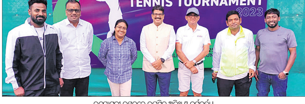
ଉଦ୍ଘାଟନା ଉତ୍ସବରେ ଉପସ୍ଥିତ ଅତିଥି ଓ କର୍ମଚାରୀ।

ଭୁବନେଶ୍ୱର, ୨୦୧୧ (ବିଜୟ ରଣା) ସର୍ବଭାରତୀୟ ୧୪ ବର୍ଷରୁ କମ୍ ଜୁନିୟର ଚେନିସ୍ ଟୁର୍ନାମେଣ୍ଟ (ଆଲ୍ ଇଣ୍ଡିଆ ଚେନିସ୍ ଆସୋସିଏଶନ) ଓ ଓଡ଼ିଶା ଚେନିସ୍ ଆସୋସିଏଶନ) ଦ୍ୱାରା ଆୟତ୍ତା ୧୪ ବର୍ଷରୁ କମ୍ ଜୁନିୟର ଚେନିସ୍ ଟୁର୍ନାମେଣ୍ଟ ଆରମ୍ଭ ହୋଇଛି। ଏଥିରେ ୧୧ଟି ରାଜ୍ୟରୁ ପ୍ରାୟ ୭୦୦ଜଣ ଖେଳାଳି ଅଂଶଗ୍ରହଣ କରିଛନ୍ତି। ଏହା ଆୟତ୍ତା ୨୫ ତାରିଖ ପର୍ଯ୍ୟନ୍ତ ଚାଲିବ। ଆଇଟା ତରଫରୁ ଗାଡ଼ିକା ପଲ୍ ମ୍ୟାଚ୍ ରେଫରି ଦାୟିତ୍ୱ ତୁଲାଉଛନ୍ତି।