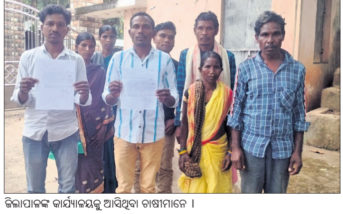
ଜିଲ୍ଲାପାଳଙ୍କ କାର୍ଯ୍ୟାଳୟକୁ ଆସିଥିବା ଚାଷୀମାନେ ।

କାଶୀପୁର ବ୍ଲକ୍ ସିପିପାଳ ପଞ୍ଚାୟତର ସିକପାଳ ଗ୍ରାମର ପ୍ରାୟ ୧୫୦ରୁ ଊର୍ଦ୍ଧ୍ୱ ଚାଷୀ ଧାନ ଚାଷ କରି ନିଜ ପରିବାର ପ୍ରତିପୋଷଣ କରିପାରି ନାହାନ୍ତି । ଚଳିତ ବର୍ଷ ପାଣି ଅଭାବରୁ ଧାନ ଫସଲ ନଷ୍ଟ ହେବାକୁ ବସିଥିବାବେଳେ ମରୁଡ଼ି ପରିସ୍ଥିତି ସୃଷ୍ଟି ହୋଇଛି । ଏହାର ପ୍ରତିବନ୍ଧରେ କାଶୀପୁର ବ୍ଲକ୍ ସିପିପାଳ ପଞ୍ଚାୟତର ସିକପାଳ ଗ୍ରାମ ଚାଷୀମାନେ