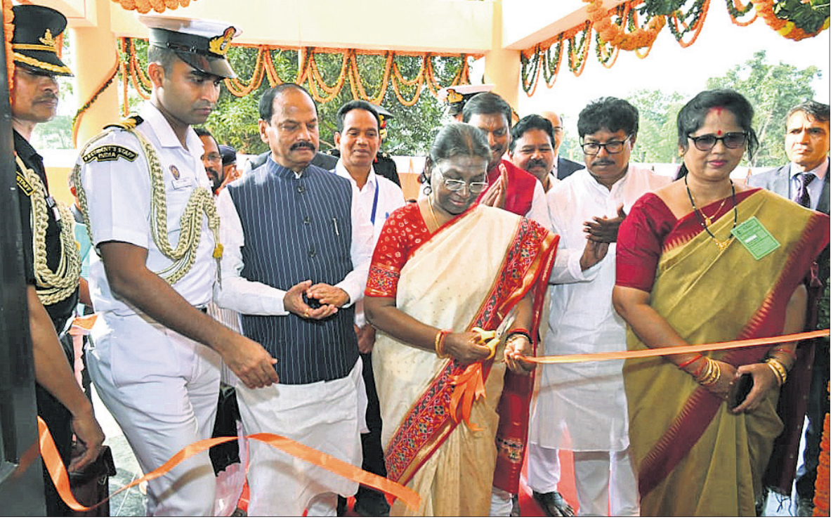
କୃଷି ଅଣା ବୁକ୍ ପାଣିଜିଆସ୍ଥିତ ଏକଲବ୍ୟ ଆବାସିକ ବିଦ୍ୟାଳୟ ଶୁଭାରମ୍ଭ କରୁଛନ୍ତି ରାଷ୍ଟ୍ରପତି ।