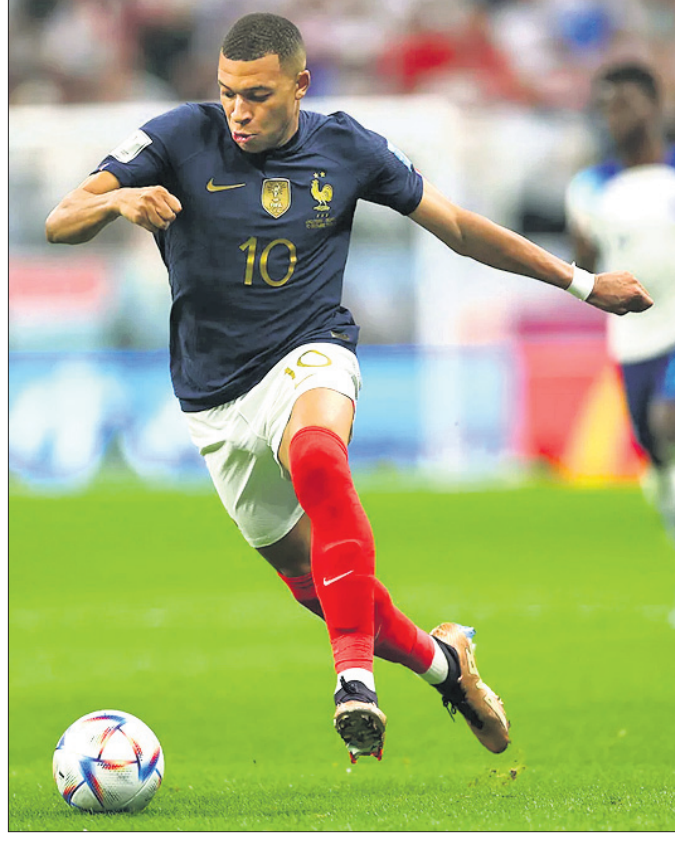
କିଲିଆନ୍ ଏମ୍ବାପେ ମେସିଙ୍କୁ ପଛରେ ପକାଇଲେ।

ପ୍ୟାରିସ୍, ୨୦୧୧ (ପି.ଟି.) ବିଶ୍ୱ ଯୁବକଲର ଭବିଷ୍ୟତର ତାରକା କିଲିଆନ୍ ଏମ୍ବାପେ ଆଉ ଏକ ରେକର୍ଡ୍ ନିଜ ନାମରେ କରିଛନ୍ତି। ସୁପରଷ୍ଟାର ଲିଓନେଲ ମେସି ଓ କ୍ରିଷ୍ଟିଆନୋ ରୋନାଲ୍ଡୋଙ୍କୁ ସେ ପଛରେ ଛାଡ଼ିଛନ୍ତି। ବିଶ୍ୱର ଦ୍ରୁତତମ ଖେଳାଳି ଭାବରେ ଏମ୍ବାପେ ୩୦୦ କ୍ୟାରିୟର ଗୋଲ୍ ସ୍କୋର କରିଛନ୍ତି। ମାତ୍ର ୨୪ବର୍ଷ ୩୩ ଦିନରେ ଏମ୍ବାପେ ଏହି ମାଇଲଖୁଣ୍ଟ ହାସଲ କରିଥିବା ବେଳେ ଯୁବକଲ୍ ଜିତିବାପରେ ଦୁଇ କିମ୍ବଦନ୍ତୀ ଲିଓନେଲ ମେସି ଓ କ୍ରିଷ୍ଟିଆନୋ ରୋନାଲ୍ଡୋଙ୍କୁ ଅତିକ୍ରମ କରିଛନ୍ତି। ସର୍ବନିମ୍ନ ଖେଳାଳି ଭାବରେ ସେ ଏହି ମାଇଲଖୁଣ୍ଟ ହାସଲ କରିଛନ୍ତି। ଏହା ସହିତ ଫ୍ରାନ୍ସର ଥିଏରୀ ହେନରୀଙ୍କୁ ମଧ୍ୟ ଏମ୍ବାପେ ପଛରେ ଛାଡ଼ିଛନ୍ତି। ବର୍ତ୍ତମାନ ଫ୍ରାନ୍ସ ୨୧ ବର୍ଷରୁ କମ୍ ଦଳର କୋର୍ ରହିଥିବା ହେନରୀ ମଧ୍ୟ ଏମ୍ବାପେଙ୍କୁ ପ୍ରଶଂସା କରିଛନ୍ତି। ଏମ୍ବାପେ ଯେଉଁଭଳି ପ୍ରଦର୍ଶନ କରୁଛନ୍ତି ତାହା ଅବିଶ୍ୱାସନୀୟ ଏବଂ ସେ ଏକ ଭିନ୍ନ ଗ୍ରହକୁ ଆସିବା ଭଳି ଲାଗୁଛି ବୋଲି ହେନରୀ କହିଛନ୍ତି। ଉଭୟ ଏମ୍ବାପେ ଓ ହେନରୀ ମୋନାକୋରୁ କ୍ୟାରିୟର ଆରମ୍ଭ କରିଥିବା ବେଳେ ଲେଫ୍ଟ୍ ଫୁଲର ରହିଥିଲେ। ଉଭୟ ଖେଳାଳି ନିଜର ପଦାର୍ପଣରେ ବିଶ୍ୱକପ୍ ଜିତିବାର