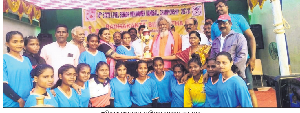
ଅତିଥିଙ୍କ ଗହଣରେ ଚାମ୍ପିୟନ ଭୁବନେଶ୍ୱର ଦଳ।