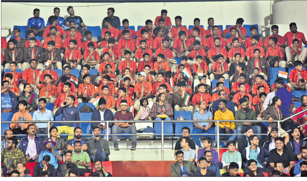
କଳିଙ୍ଗ ଷ୍ଟାଡିୟମରେ ମଙ୍ଗଳବାର ଭାରତ-କାତାର ପୁରବଳ ମ୍ୟାଚକୁ ଖୁଲ୍ ପିଲାମାନେ ଉପଭୋଗ କରୁଛନ୍ତି।

ମାର୍କସ୍ ଷ୍ଟୋଇନିସ୍ ଓ ଆତମ ଜାମ୍ପା ଦଳ ସହିତ ରହିଛନ୍ତି। ଅଷ୍ଟ୍ରେଲିଆ ଦଳ: ମାଥ୍ୟୁ ଫ୍ରେଡ୍(ଅଧିନାୟକ), ଆରୋନ ହାର୍ଡି, ଜାସନ୍ ବେହେନ୍ଡ୍ରାଫ୍, ନ୍ ଆବୋର୍, ଟ୍ରେଭିସ୍ ହେଡ୍, ଜୋଶ ଇଲିଶ, ରୋବ୍ ମ୍ୟାକ୍ଗ୍ରୋ, ଷ୍ଟିଭ୍ ବ୍ଲିଥ୍, ଆତମ ଜାମ୍ପା, ଟିମ୍ ଡେଭିଡ୍, ନାଥାନ ସ୍କିଲିସ୍, ଡେଭିଡ୍ ସାଂସା, ମ୍ୟାକ୍ ଶର୍ଟ, କେନ୍ ରିଚାର୍ଡସନ୍।