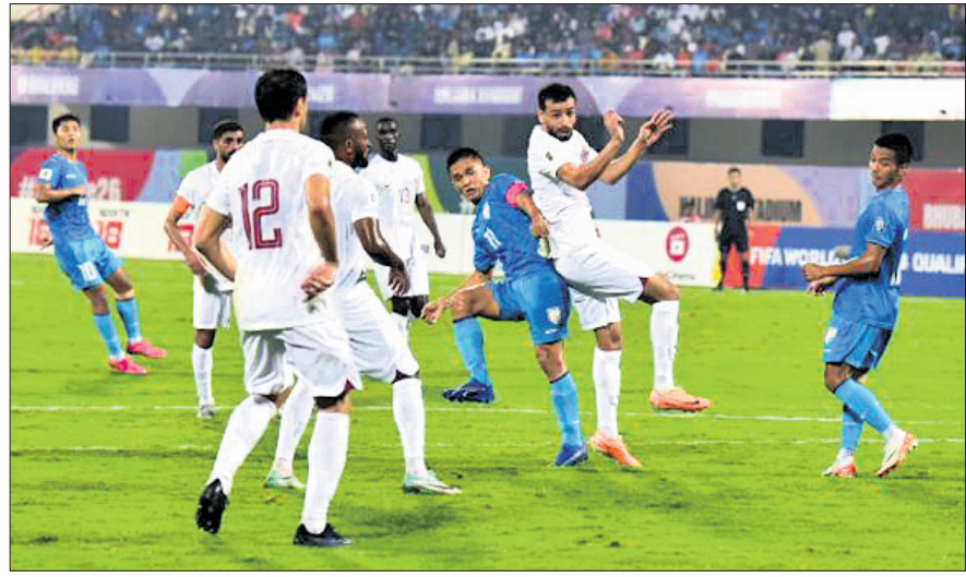
ଭାରତ-କାତାର ମ୍ୟାଚର ଏକ ସଂଘର୍ଷପୂର୍ଣ୍ଣ ମୁହୂର୍ତ୍ତ।

ଭୁବନେଶ୍ୱର, ୨୧।୧୧ (ତପନ ସ୍ୱାଇଁ) କଳିଙ୍ଗ ଷ୍ଟାଡିୟମରେ ମଙ୍ଗଳବାର ଅନୁଷ୍ଠିତ ଫିଫା ବିଶ୍ୱକପ ୨୦୨୨ ଓ ଏସପିସି ଏସିଆନ କପ ୨୦୨୨ କ୍ୱାଲିଫାୟର୍ ମ୍ୟାଚରେ ଭାରତ ୦-୩ ଗୋଲରେ କାତାରଠାରୁ ହାରି ଯାଇଛି। ଗୁରୁତ୍ୱପୂର୍ଣ୍ଣ ଫିଫା ବିଶ୍ୱକପ ୨୦୨୨ ଓ ଏସପିସି ଏସିଆନ କପ ୨୦୨୨ କ୍ୱାଲିଫାୟର୍ ମ୍ୟାଚରେ ଭାରତ ୦-୩ ଗୋଲରେ କାତାରଠାରୁ ହାରି ଯାଇଛି। ଗୁରୁତ୍ୱପୂର୍ଣ୍ଣ ଫିଫା ବିଶ୍ୱକପ ୨୦୨୨ ଓ ଏସପିସି ଏସିଆନ କପ ୨୦୨୨ କ୍ୱାଲିଫାୟର୍ ମ୍ୟାଚରେ ଭାରତ ୦-୩ ଗୋଲରେ କାତାରଠାରୁ ହାରି ଯାଇଛି।