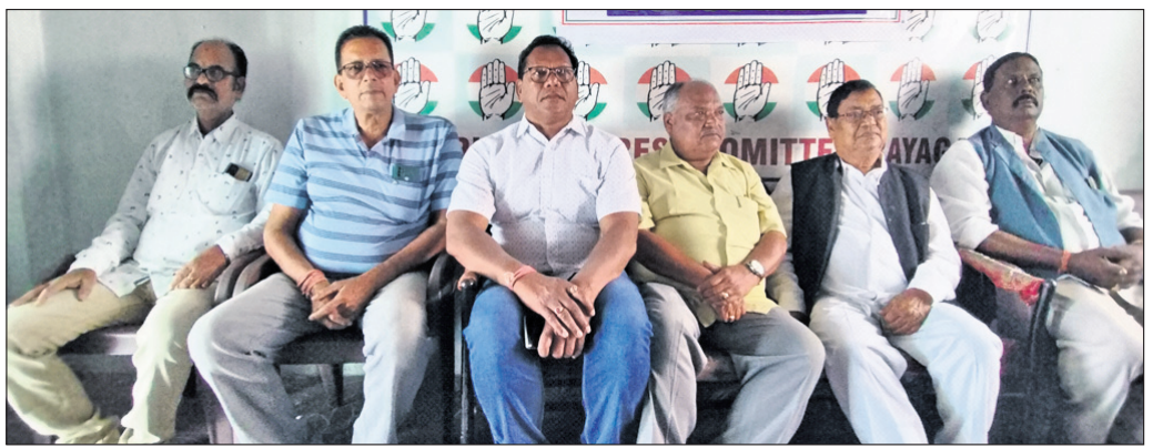
ଖବରଦାତା ସମ୍ମିଳନୀରେ କଂଗ୍ରେସ ନେତା ପୁରୀଙ୍କୁ ଦେଖିବା।

ଚଳିତ କରି ଏକ ଅର୍ଥ କମିଟି ଚଳିତ-୨୦୨୩ର ସମସ୍ତ ଲି.ଏବ. ଭାଗରେ କୁଳ ସଂଖ୍ୟାକୁ ଅନୁପାଳନ କରିବାକୁ ହେବ। ଏଥିପାଇଁ ଭୁବନ ଏକ ଯୋଜନା ଏବଂ ଖର୍ଚ୍ଚ କରାଯାଇଥିଲା।