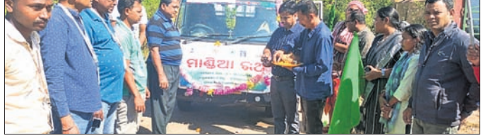
ତଥ୍ୟ ବିଷୟରେ ସାଧାରଣ ଲୋକଙ୍କୁ ଅବଗତ କରାଇ। ଏଥିରେ ମାଣିଆ ଆଣି ମଣିଆରେ ବିକ୍ରି କରି ସରକାରଙ୍କ ଦ୍ୱାରା ନିର୍ଦ୍ଧାରିତ ମୂଲ୍ୟ ପାଇପାରିବେ ସେ ବିଷୟରେ ଲୋକଙ୍କୁ

ପୂର୍ଣ୍ଣଚନ୍ଦ୍ର ଲୁଚିଥିବା କୃଷି ଜିଲା ଅଧିକାରୀଙ୍କ କାର୍ଯ୍ୟାଳୟରେ ମଙ୍ଗଳବାର ମାଣିଆ ପ୍ରଚାର ରଥର ଶୁଭାରମ୍ଭ ହୋଇଛି।