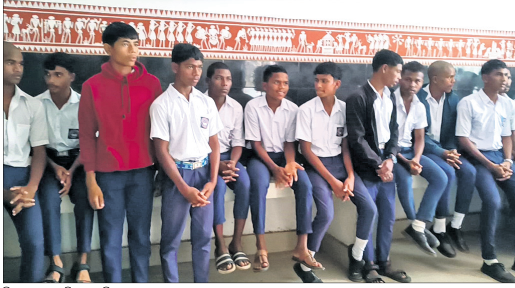
ଜିଲାପାଳଙ୍କୁ କେଟିବାକୁ ଆସିଥିବା ଛାତ୍ରମାନେ।

ରାୟଗଡ଼ା ଭଳି ଆଦିବାସୀ ଅଧିକ ଅଞ୍ଚଳରେ ଛାତ୍ରାଛାତ୍ରୀଙ୍କୁ ଚିକିତ୍ସା ଦେବା ପାଇଁ ସରକାର ବିଭିନ୍ନ ଯୋଜନା କାର୍ଯ୍ୟକାରୀ କରିଛନ୍ତି।