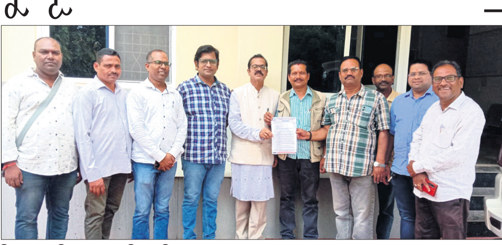
ଜିଲାପାଳଙ୍କୁ ଦାବିପତ୍ର ଦେବାକୁ ଆସିଥିବା ବୁଦ୍ଧିଜୀବୀମାନେ।

ରାୟଗଡ଼ା ଜିଲାର ଲୋକ ମହୋତ୍ସବ ଚଳିତ ବର୍ଷ ପୂରୀରୁ ରୂପେ ପରିଚାଳନା ପାଇଁ ଜିଲାର ବୁଦ୍ଧିଜୀବୀ, ବିଶ୍ୱ ବିଭାଗ ଓ ଖବରଦାତାଙ୍କ ପକ୍ଷରୁ ଜିଲାପାଳ ଓ ଏସ୍ପିଙ୍କୁ ଦାବିପତ୍ର ପ୍ରଦାନ କରାଯାଇଛି।