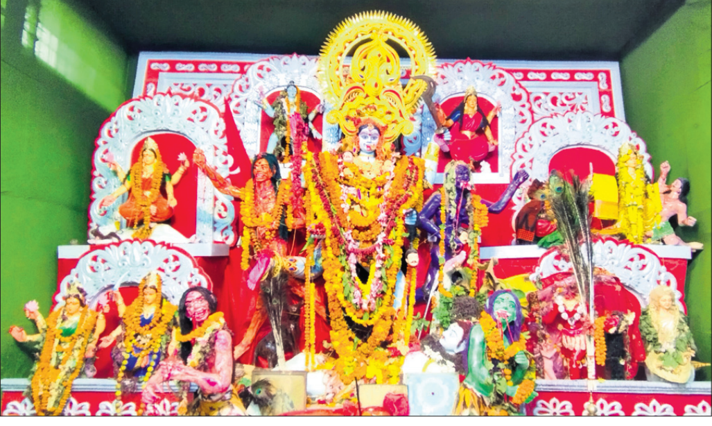
ରାୟଗଡ଼ା କାଳୀ ମନ୍ଦିରରେ ମଙ୍ଗଳବାର ମା' କଳାପାତାଳା ରୂପରେ ପୂଜା ପାଉଛନ୍ତି ମା' କାଳୀ।

ରହିଥିବା ବେଳେ ହସ୍ତେଲଟି ଜିଲା ମଙ୍ଗଳ ବିଭାଗ ଦାୟିତ୍ୱରେ ରହିଛି।