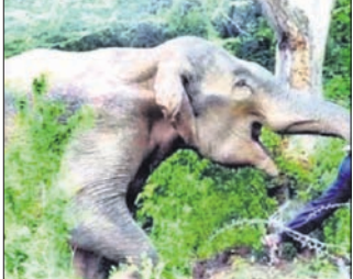
କେନ୍ଦୁଝର, ୨୨୧୧ (ନରେଶ ଚନ୍ଦ୍ର ପଟ୍ଟନାୟକ)

ଗ୍ରହଣ କରିଛି। ମାତ୍ର ବନ କର୍ମଚାରୀଙ୍କ ବିରୋଧରେ କୌଣସି କାର୍ଯ୍ୟାନୁଷ୍ଠାନ ଗ୍ରହଣ କରାଯାଇନାହିଁ। ଫଳରେ ଏହାକୁ ନେଇ ପରିବେଶବିତ୍‌ମାନେ ଅସନ୍ତୋଷ ବ୍ୟକ୍ତ କରୁଛନ୍ତି। ତଥ୍ୟ ମୁତାବକ, ୨୦୧୭-୧୮ ବର୍ଷରେ ୨ ହାତୀ ମୃତ୍ୟୁ ହୋଇଥିବା ବେଳେ ୨୦୧୮-୧୯ରେ ୩, ୨୦୧୯-୨୦ରେ ୬, ୨୦୨୦-୨୧ରେ ୬, ୨୦୨୧-୨୨ରେ ୬, ୨୦୨୨-୨୩ରେ ୧୧ ହାତୀ ମୃତ୍ୟୁ ହୋଇଛି।