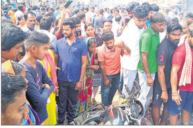
ଘଟଣାସ୍ଥଳରେ ଲୋକଙ୍କ ଭିଡ଼ ଜମିଛି।