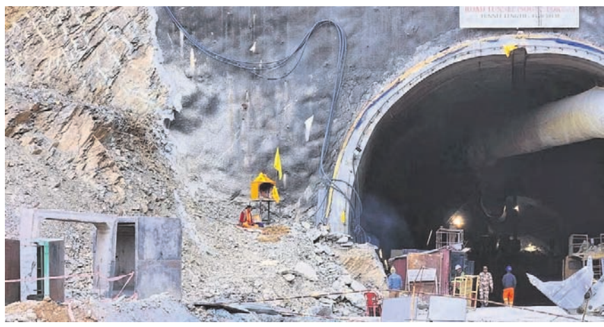
ଉତ୍ତରାଖଣ୍ଡ/ ନୂଆଦିଲ୍ଲୀ, ୨୨।୧୧

ଉତ୍ତରାଖଣ୍ଡ ସୁଡ଼ଙ୍ଗରେ ୧୧ ଦିନ ହେଲା ଫସି ରହିଛନ୍ତି