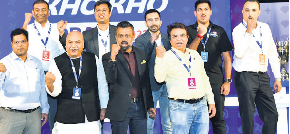
ଅଲଟିମେଟ ଖୋ ଖୋ ଲିଗର ଦ୍ୱିତୀୟ ସଂସ୍କରଣ ପାଇଁ ବୁଧବାର ଭୁବନେଶ୍ୱରରେ ଅନୁଷ୍ଠିତ ଯୁଦ୍ଧ ଭାଙ୍ଗିଲେ ୧୪୪ ଖେଳାଳି ଚୟନ କାର୍ଯ୍ୟକ୍ରମରେ ଉପସ୍ଥିତ ବିଭିନ୍ନ ପ୍ରାଞ୍ଚାଳକ ମାଲିକ ଓ କର୍ମଚାରୀ।

ତୃତୀୟ ସ୍ଥାନକୁ ଉଠିଲେ କୋହଲି ଭୁବନ, ୨୨/୧୧ (ପି.ଟି.) ବୁଧବାର ଆଇସିସି ପକ୍ଷରୁ ବିନିଜିଆ କ୍ରିକେଟ୍ ଚାମ୍ପିୟନ୍ସ ପ୍ରକାଶ ପାଇଛି। ଭାରତୀୟ ଯୁଦ୍ଧ ବ୍ୟାଟର ଶୁଭମନ ବିଲ୍ ପ୍ରଥମ ସ୍ଥାନ ବଜାୟ ରଖିଥିବା ବେଳେ ତୃତୀୟ ସ୍ଥାନକୁ ଉନ୍ନତ ହୋଇଛନ୍ତି ବିରାଟ କୋହଲି। ବିନିଜିଆ କ୍ରିକେଟ୍ ବିଶ୍ୱକପରେ ନିଜର ପ୍ରାଥମ ଫର୍ମରେ ନଜର ଆଣିଥିବା କୋହଲି ୭୬୫ ରନ୍ ସଂଗ୍ରହ କରିଥିଲେ। କୋହଲି ୭୯୧ ରେଟିଂ ପଏଣ୍ଟ ସହିତ ତୃତୀୟ ସ୍ଥାନକୁ ଉନ୍ନତ ହୋଇଛନ୍ତି। କେବଳ ବିରାଟ କୋହଲି ନୁହଁନ୍ତି ଶରତୀୟ ଅଧିନାୟକ ହୋଇଥିବା ସମସ୍ତ ମଧ୍ୟମ ଓଡ଼ିଆ ଖେଳାଳିଙ୍କୁ ୨୦୧୯ରେ ଓପେନିଂ ପଏଣ୍ଟ ସହିତ ତୃତୀୟ ସ୍ଥାନକୁ ଉନ୍ନତ ହୋଇଛନ୍ତି।