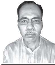
ଉପା ଶିଳ୍ପ ପ୍ରସାଦ