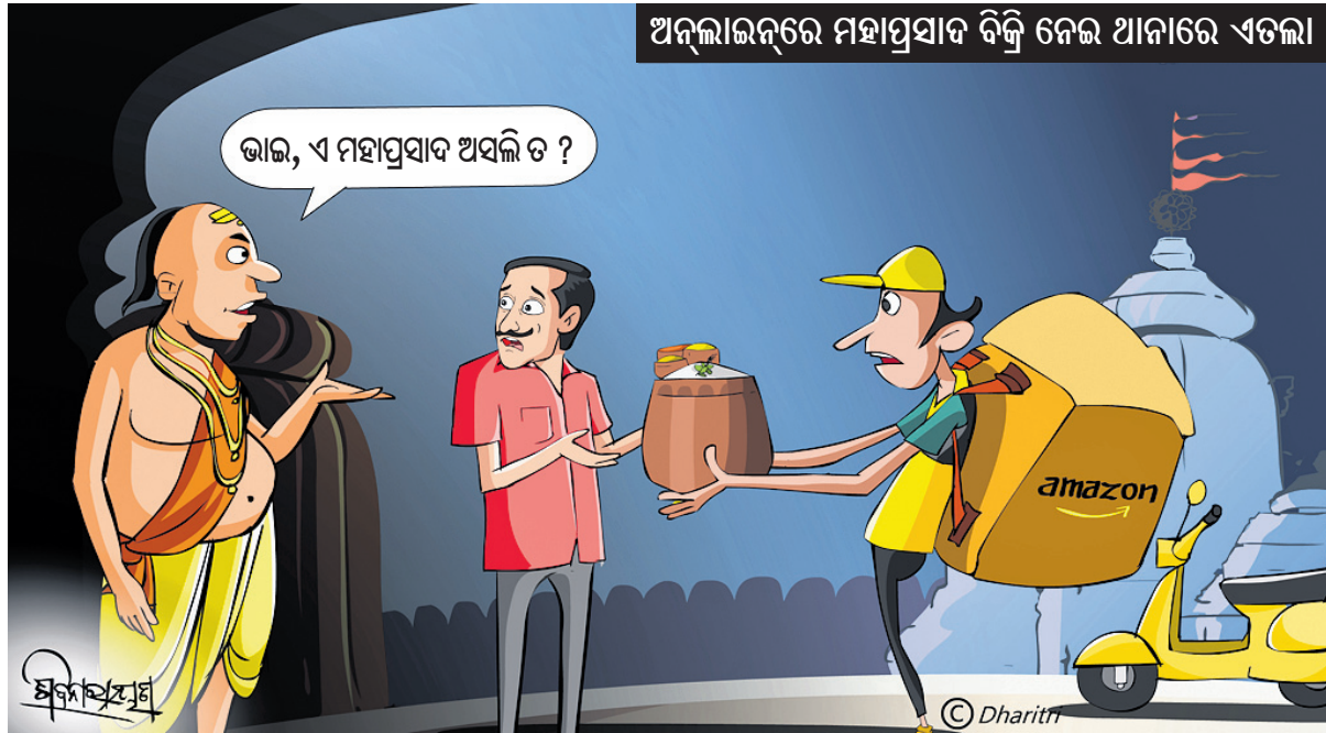
ଅନ୍ଧାରରେ ମହାପ୍ରସାଦ ବିକ୍ରି ନେଇ ଥାନାରେ ଏଡ଼ିଲା

ନିର୍ଗତିତ ଜଗତମାନ, ପ୍ରବାସ, ପ୍ରବଚନ ଓ ଅନ୍ୟାନ୍ୟ - ପ୍ରାଚୀ ସାହିତ୍ୟ ପ୍ରତିଷ୍ଠାନ