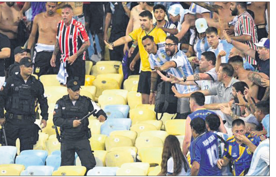
ଫୁଟ୍‌ବଲ୍ ଖେଳ ହିଁସା ସମୟରେ ପୋଲିସର କାର୍ଯ୍ୟାନୁଷ୍ଠାନ।

ଷ୍ଟାଡ଼ିଓ ଓଭେରସ୍ ପ୍ରଦାନ କରିଥିଲେ। ମ୍ୟାଚ୍‌ର ପ୍ରଥମାର୍ଦ୍ଧ ଗୋଲ ଶୂନ୍ୟ ରହିଥିଲା। ତେବେ ଦ୍ୱିତୀୟାର୍ଦ୍ଧ ୬୩ ଟମ ମିନିଟ୍‌ରେ ନିକୋଲାସ୍ ଓଷ୍ଟାଲେଟ୍ ଏକ ଗୋଲ ଦେଇ ଦଳକୁ ଆଗୁଆ କରିଥିଲେ। ମେସି ୬୮ ଟମ ମିନିଟ୍‌ରେ ପଡ଼ିଆ ଛାଡ଼ିବା ବେଳକୁ ଷ୍ଟାଡ଼ିୟମ ବାସ୍‌ଭୋନା ଓ ଇଣ୍ଡିଆ ମାୟାମି କର୍ସିରେ ଭର୍ତ୍ତି ହେବା ପରି ଦୃଶ୍ୟମାନ ହୋଇଥିଲା। ୮୧ ଟମ ମିନିଟ୍‌ରେ ବ୍ରାଜିଲ ମିଡ଼ଫିଲ୍ଡର କୋଏଲିଣ୍ଟନ ଆର୍ଜେଣ୍ଟିନାର ରୋଡ୍ରିଗୋ ତେ ପଲ୍‌ଙ୍କୁ ଫାଉଲ୍ ମାରିବାରୁ ରେଡ୍‌କାର୍ଡ୍ ପାଇଥିଲେ। ଫଳରେ ୧୦ ଜଣିଆ ବ୍ରାଜିଲ ରକ୍ଷଣାତ୍ମକ ଭଙ୍ଗରେ ଖେଳିଥିଲା। ଅନ୍ୟ ମ୍ୟାଚ୍‌ରେ କଲମ୍‌ଥା ୧-୦ରେ ପାରାଗୁଏ, ଉରୁଗୁଏ ୩-୦ରେ ବଲିଭିଆ ଓ ଇକ୍ୱାଡର ୧-୦ରେ ଚିଲିକୁ ପରାସ୍ତ କରିଥିଲା।