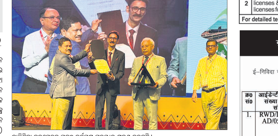
ବାଲିଡିହା ଜଳସେଚନ ପ୍ରକଳ୍ପ କର୍ତ୍ତୃପକ୍ଷ ପୁରସ୍କାର ଗ୍ରହଣ କରୁଛନ୍ତି।

ମୟୂରଭଞ୍ଜ ଜିଲାର ବାଲିଡିହା ଜଳସେଚନ ପ୍ରକଳ୍ପକୁ ଅନ୍ତର୍ଜାତୀୟ ସ୍ୱୀକୃତି ମିଳିଛି। ରାଜ୍ୟର ୨ ଜଳସେଚନ ପ୍ରକଳ୍ପକୁ ୨୦୨୩ ମସିହା ପାଇଁ ସମ୍ମାନଜନକ ବିଶ୍ୱ ଐତିହ୍ୟ ଜଳସେଚନ ପ୍ରକଳ୍ପ ସମ୍ମାନ ପ୍ରଦାନ କରାଯାଇଥିବା ବେଳେ ସେଥିରେ ବାଲିଡିହା ଜଳସେଚନ ପ୍ରକଳ୍ପ ରହିଛି।