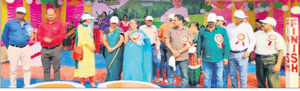
ବାର୍ଷିକ ଜ୍ରୀଡ଼ା ଉଦ୍‌ଘାଟନା ଉତ୍ସବରେ ଉପସ୍ଥିତ ଅତିଥି।