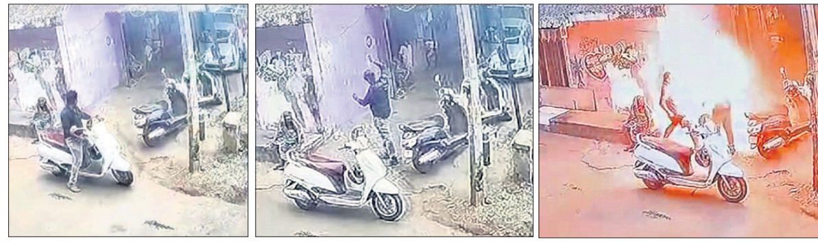
ଯୁବକ ନିଜ ଦେହରେ ପେଟ୍ରୋଲ ଢାଳି ନିଆଁ ଲଗାଇ ଆତ୍ମହତ୍ୟା କରିବା ବେଳର ସିଦ୍ଧିଚିତ୍ର ଦୃଶ୍ୟ।