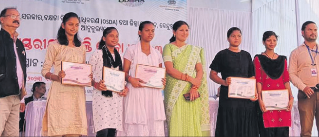
କେନ୍ଦୁଝର, ୨୨୧୧ (ବାପକ ମିଶ୍ର)

କିମ୍ବା ପ୍ରଶାସନ, କେନ୍ଦୁଝର ଏବଂ ଓଡ଼ିଶା ସରକାରଙ୍କ ଦକ୍ଷତା ବିକାଶ ପ୍ରାଧିକାରଣ କମିଶନ ଆନୁଷ୍ଠାନିକ ଭାବେ କେନ୍ଦୁଝର ନିୟୁତ ୬୫୨ ଆଶାୟୀଙ୍କ ଅଂଶଗ୍ରହଣ କରୁଥିଲେ।