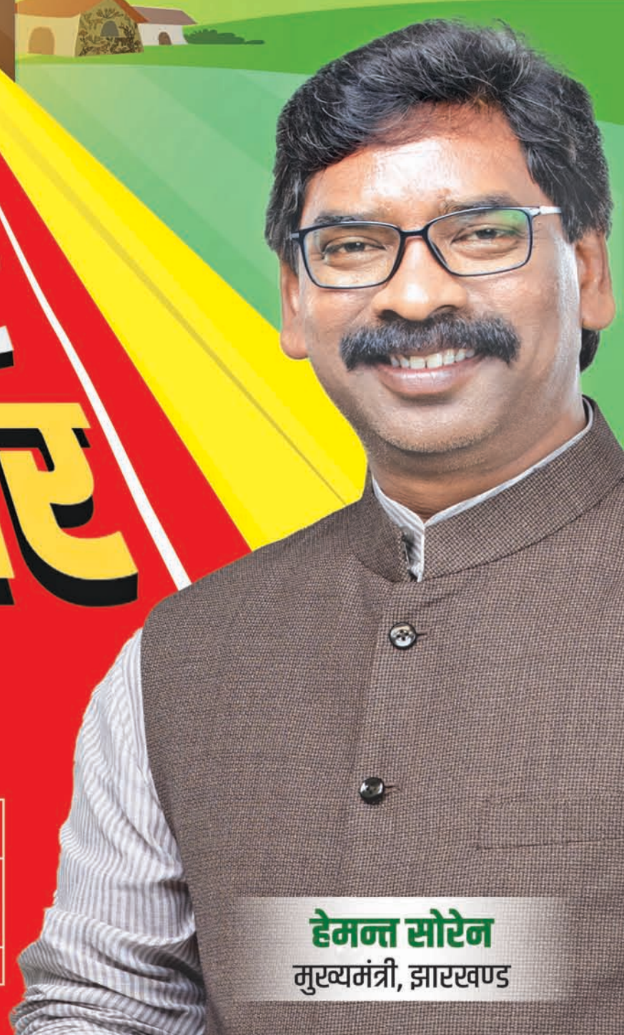
हेमन्त सोरेन मुख्यमंत्री, झारखण्ड

24 नवम्बर से 26 दिसम्बर तक राज्य के सभी जिलों में लगेगा शिविर