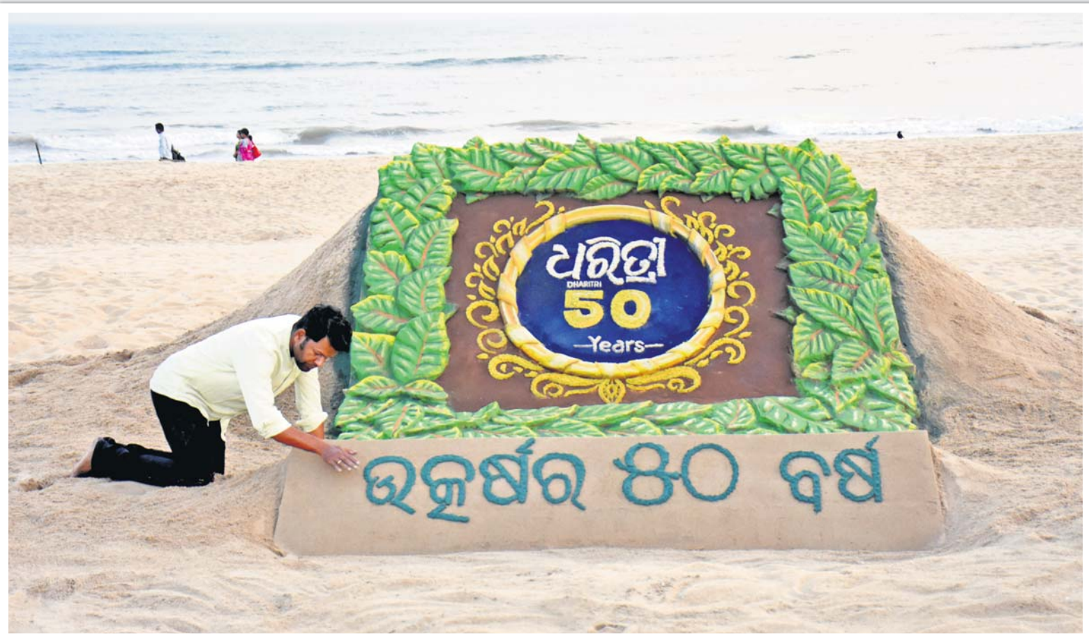
'ଧରିତ୍ରୀ' ୫୦ ବର୍ଷରେ ପଦାର୍ପଣ କରିବା ଅବସରରେ ପଦ୍ମଶ୍ରୀ ସୁଦର୍ଶନ ପଟ୍ଟନାୟକ ପୁରୀ ବେଳାଭୂମିରେ ନିଆରା ବାଲୁକାକଳା ମାଧ୍ୟମରେ ଶୁଭେଚ୍ଛା ଜଣାଉଛନ୍ତି। ଏହି ବାଲୁକାକଳା ଧରିତ୍ରୀର '୫୦ ତମ ଜନ୍ମଦିନ ବିଶେଷାଙ୍କ' ପ୍ରଚ୍ଛଦରେ ସ୍ଥାନିତ ହୋଇଛି।