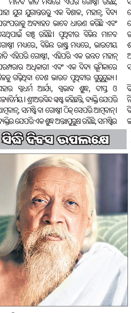
ବିକଳ ଦିବସ ଉପଲକ୍ଷେ

୧୯୨୬, ନଭେମ୍ବର ୨୪ ତାରିଖ। ମହାଯୋଗୀ ଶ୍ରୀଅରବିନ୍ଦଙ୍କ ଯୋଗ ସାଧନାମୟ ଜୀବନରେ ମହାସିଦ୍ଧି ବିକଳ ବାର୍ତ୍ତା ଉଦ୍‌ଘୋଷିତ ହେଲା। “ଏକ ଭାରତରେ ମହାମାନବର ସାଗରତୀରେ”।