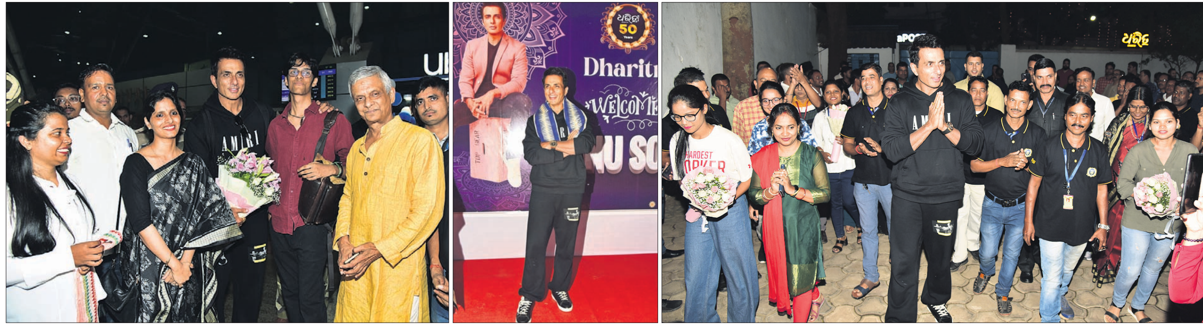
‘ଧରିତ୍ରୀ’ ଯୁଥ କନ୍ଫରେନ୍ସ -୨୦୨୩ରେ ଅତିଥିଭାବେ ଯୋଗଦେବାକୁ ଆସିଥିବା ଅଭିନେତା ତଥା ଯୁଥ ଆଇକନ୍ ସୋନୁ ସୁଦ୍ଧଙ୍କ ଗୁରୁବାର ଭୁବନେଶ୍ୱର ବିମାନ ବନ୍ଦରରେ ଧରିତ୍ରୀ ପରିବାର ପକ୍ଷରୁ ସ୍ୱାଗତ କରାଯାଇଛି। (ବାମରୁ) ଭୁବନେଶ୍ୱରସ୍ଥିତ ଧରିତ୍ରୀର ମୁଖ୍ୟ କାର୍ଯ୍ୟାଳୟ ପରିସରରେ ସୋନୁ ସୁଦ୍ଧ। ଧରିତ୍ରୀ କର୍ମଚାରୀଙ୍କ ଗହଣରେ ସୋନୁ ସୁଦ୍ଧ।