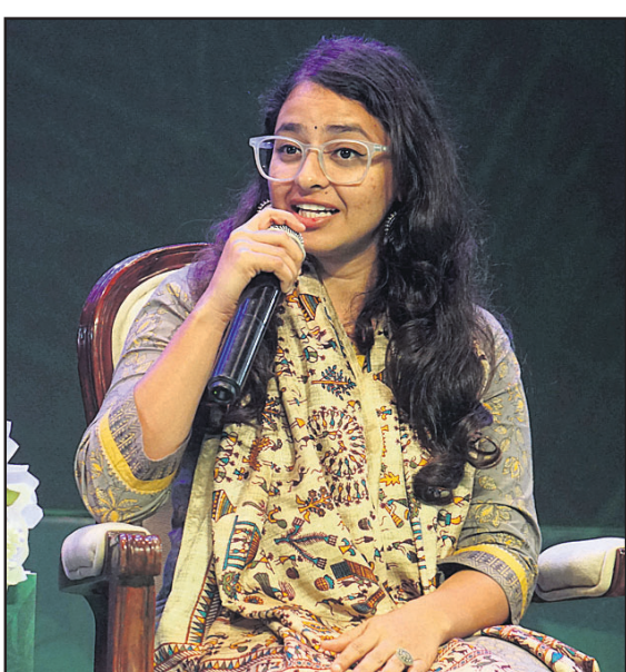
ୟୁଭ ପରିବେଶବିତ୍ ସ୍ନେହା ସାହି।