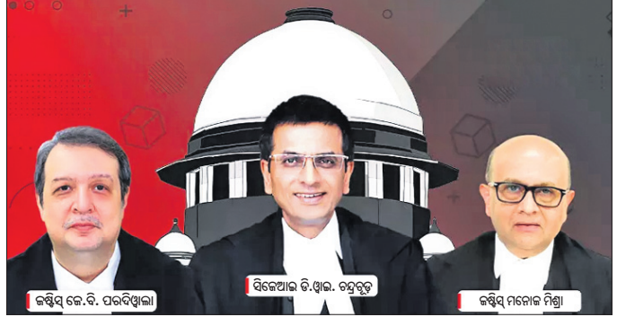
କର୍ମକ୍ଷେତ୍ରରେ କାର୍ଯ୍ୟକାରୀତାରେ ବସୁତଃ ଭେଟେ ଲଗାଇଦେବ। ଏଭଳି କାର୍ଯ୍ୟ ସଂସଦୀୟ ସରକାର ବ୍ୟବସ୍ଥାଭିତ୍ତିକ ସାମ୍ବିଧାନିକ ଗଣତନ୍ତ୍ର ମୌଳିକ ସିଦ୍ଧାନ୍ତଗୁଡ଼ିକର ବିରୁଦ୍ଧରେ କରାଯାଇଥିବା ଆପୀତକାରୀକୁ ଯାଉଛି ଚାହା ମଧ୍ୟ ଯୋଗ୍ୟ କରିବା ଉଚିତ୍ ପଞ୍ଚାବ ରାଜ୍ୟପାଳ ବନଫ୍‌ଗାଲାଇ ପୁରୋହିତଙ୍କ ବିରୋଧରେ ରାଜ୍ୟର ଆମ୍ ଆର୍ଡ଼ମ୍ ଆର୍ଡ଼ି (ଏଏପି) ସରକାର ଦାଖଲ କରିଥିବା ପ୍ରତିଶ୍ଵର ଏହି ରାୟ ନଭେମ୍ବର ୧୦ରେ ଆସିଥିଲା। ଗୁରୁବାର ଉକ୍ତ ରାୟର ବିଷୟ ବିବରଣୀକୁ ୩ ଜଣିଆ ଖଣ୍ଡପୀଠ ସର୍ବଶେଷ କରିଛନ୍ତି। କେନ୍ଦ୍ର ଓ ତାମିଲନାଡୁ ସରକାର ମଧ୍ୟ ନିଜ ନିଜ ରାଜ୍ୟପାଳଙ୍କ ବିରୋଧରେ ଅନୁପ୍ର ପ୍ରତିଶ୍ଵର ଦାଖଲ କରିଥିଲେ।

ନୂଆଦିଲ୍ଲୀ, ୨୫.୧୧.୨୩: ରାଜ୍ୟପାଳମାନେ ବିଲ୍ ଉପରେ କୌଣସି ପଦକ୍ଷେପ ନ ନେଇ ତାକୁ ଅନିର୍ଦ୍ଦିଷ୍ଟ କାଳ ପର୍ଯ୍ୟନ୍ତ ପକାଇ ରଖିପାରିବେ ନାହିଁ ବୋଲି ସୁପ୍ରିମକୋର୍ଟ ତେଜାଜି ଦେଇଛନ୍ତି। ରାଜ୍ୟର ପ୍ରତୀକାତ୍ମକ ମୁଖ୍ୟ ହିସାବରେ ରାଜ୍ୟପାଳଙ୍କ ହାତରେ ସାମ୍ବିଧାନିକ କ୍ଷମତା ରହିଥିଲେ ମଧ୍ୟ ସେ ବିଧାନସଭାର ଆଇନ ପ୍ରଣୟନରେ ବାଧା ସୃଷ୍ଟି ଉଦ୍ଦେଶ୍ୟରେ ତାକୁ ବ୍ୟବହାର କରିପାରିବେ ନାହିଁ ବୋଲି ସର୍ବୋଚ୍ଚ ଆଦାଲତ ତେଜାଜି ଦେଇଛନ୍ତି। ସିକ୍ସଆଇ ଡି.ଏଲ୍. ଚନ୍ଦ୍ରଚୂଡ଼ଙ୍କ ଅଧିକାରରେ ତଥା ଇଣ୍ଡିୟ ଜେ.ବି. ପରଦିଫାଲ୍ ଏବଂ ମନୋଜ ମିଶ୍ରାଙ୍କୁ ନେଇ ଗଠିତ ଖଣ୍ଡପୀଠ କହିଛନ୍ତି, ରାଜ୍ୟପାଳ ହେଉଛନ୍ତି ରାଜ୍ୟର ଅନିର୍ଦ୍ଦିଷ୍ଟ ମୁଖ୍ୟ, ଯାହାଙ୍କ ପାଖରେ କେତେକ ସାମ୍ବିଧାନିକ