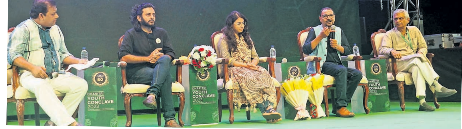
ଯୁଥ କନ୍ଫେରନ୍ସ-୨୦୨୩ରେ ଉପସ୍ଥିତ ପ୍ୟାନେଲିଷ୍ଟ।