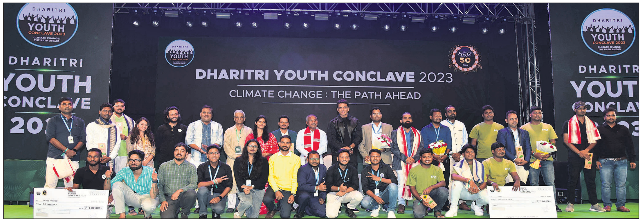
'ଧରିତ୍ରୀ କ୍ଲାଇମେଟ୍ ଗ୍ରାଣ୍ଟ' ପାଇଥିବା ସଂସ୍ଥା ଓ ବ୍ୟକ୍ତିଗଣେଶ।