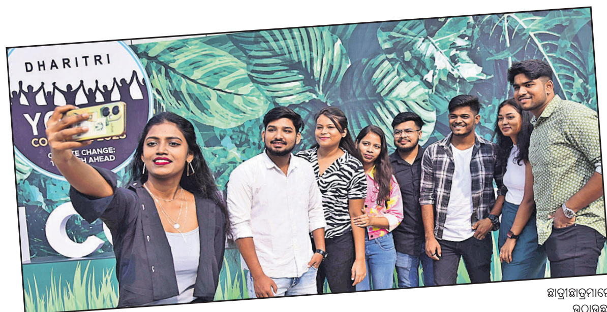
ଛାତ୍ରାଛାତ୍ରୀମାନେ ସେଲଫି ଉଠାଉଛନ୍ତି।