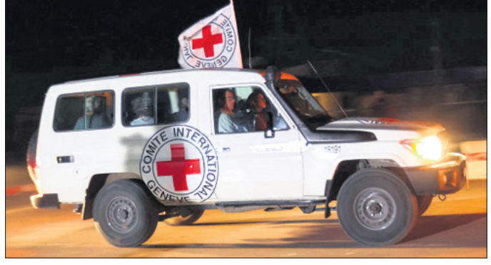
ଇସ୍ତ୍ରାଏଲ୍ ପଣବନ୍ଦୀମାନଙ୍କୁ ହମାସ୍ ମୁକ୍ତ କରିବା ପରେ ସେମାନଙ୍କୁ ନେବା ପାଇଁ ପହଞ୍ଚିଥିବା ରେଡ୍ କ୍ରସ୍ ବ୍ୟାନ୍।