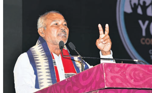
ଯାତକ ପାୟୋଜ ଉଦ୍ଘାଟନ ଦେଉଛନ୍ତି।