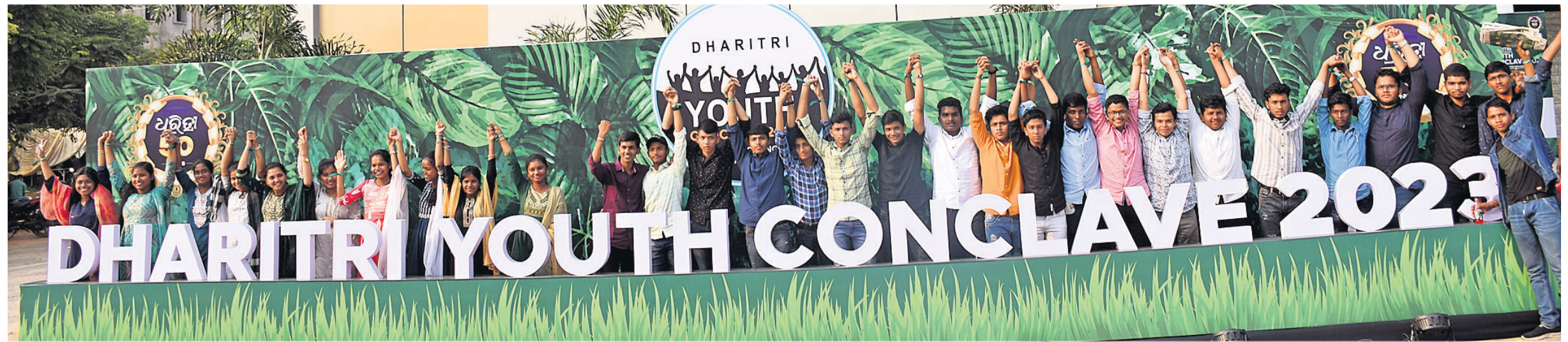
ଭୁବନେଶ୍ୱରସ୍ଥିତ ରେଳ ଅତିଗୋରିୟାମୁଖରେ ଶୁକ୍ରବାର ଆୟୋଜିତ 'ଧରିତ୍ରୀ ଯୁଥ୍ କନ୍କ୍ଲେଭ୍-୨୦୨୩'ରେ ଯୋଗଦେଇଥିବା କଲେଜ ଛାତ୍ରାଛାତ୍ରୀମାନେ ଫଟୋ ଉଠାଇ ଖୁସି ମନାଉଛନ୍ତି।