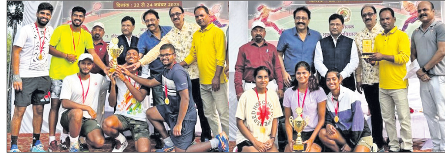
ଅତିଥିକ ଗହଣରେ ଚାମ୍ପିୟନ କିର୍ ପୁରୁଷ ଓ ମହିଳା ଟେନିସ୍ ଦଳ।