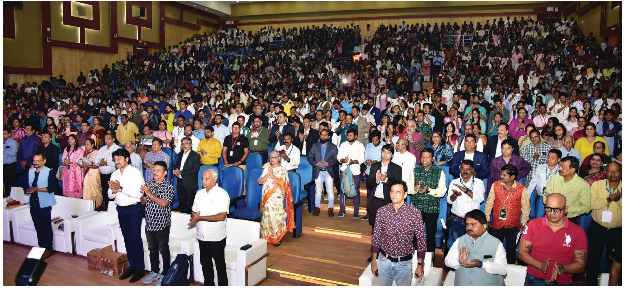
‘ଧରିତ୍ରୀ ଯୁଥ କନ୍ଫେରନ୍ସ-୨୦୨୩’ରେ ଉପସ୍ଥିତ ଅତିଥି ଏବଂ କଲେଜ ଛାତ୍ରାଛାତ୍ରୀ।