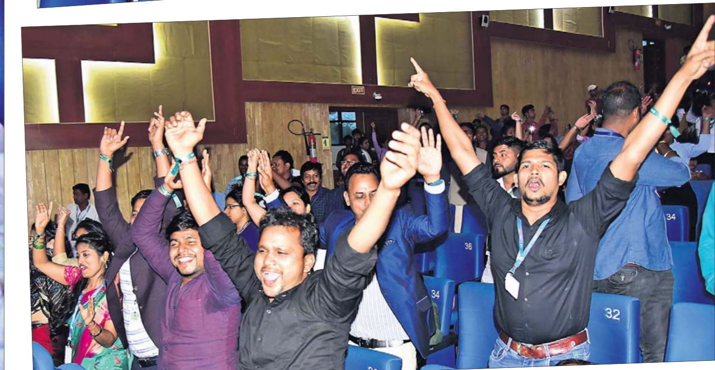
ଧରିତ୍ରୀ ଯୁଥ୍ କନ୍ଫେରେନ୍ସରେ ପରିବେଷିତ ଭିଜି କେନ୍ଦ୍ର ଆର୍ଷଶ୍ରୀୟା ସମ୍ପାଦକ ଚାନ୍ଦେ ଚାନ୍ଦେ ସୁବିଚାରଣା ସହ