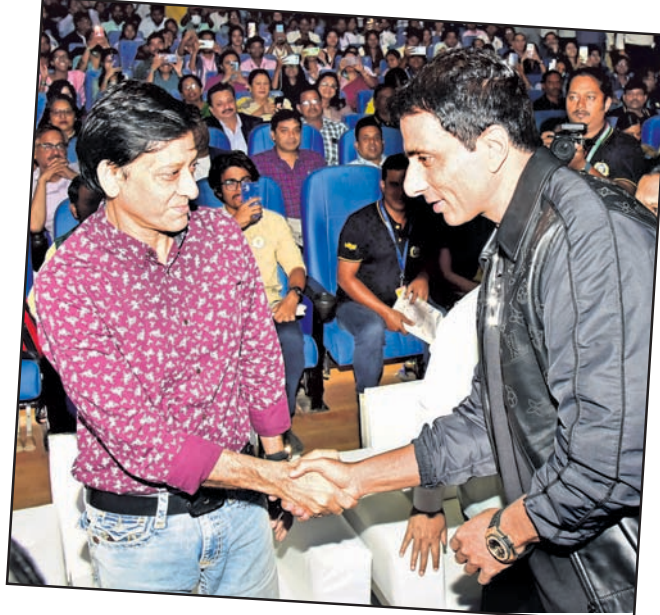
ସୋନୁ ସୁଦଙ୍କ ସହ ଓଡ଼ିଆ ଅଭିନେତା ସିଦ୍ଧାନ୍ତ ମହାପାତ୍ର।