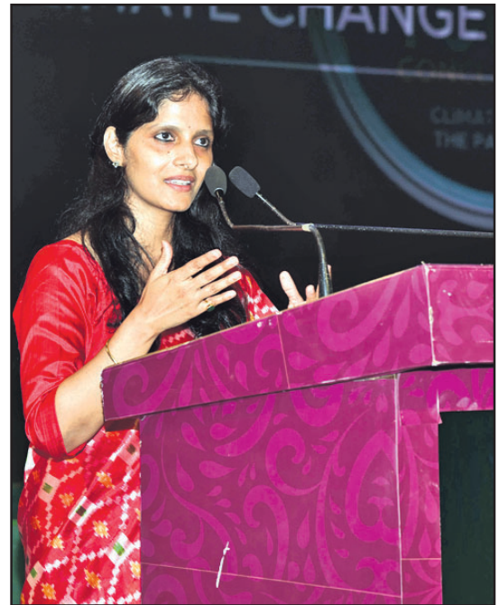
ଧରିତ୍ରୀ ମୁଖ୍ୟ କାର୍ଯ୍ୟନିର୍ବାହୀ ଆଦ୍ୟାକ୍ଷା ସତପଥୀ ଉଦ୍‌ବୋଧନ ଦେଉଛନ୍ତି।