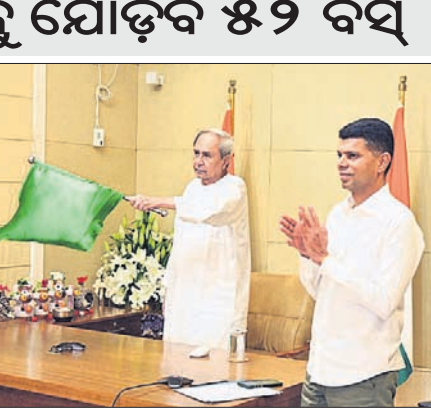
ପୁଣ୍ୟମନ୍ତ୍ରୀ ନବୀନ ପଟ୍ଟନାୟକ ଲକ୍ଷ୍ମୀ ବସ ଯୋଜନାର ଶୁଭାରମ୍ଭ କରୁଛନ୍ତି। ନିକଟରେ ୫-ଟି ଏବଂ ନବୀନ ଓଡ଼ିଶା ଅଧ୍ୟକ୍ଷ ଭି.କେ.ପାଣ୍ଡିଆନ୍ ଉପସ୍ଥିତ।