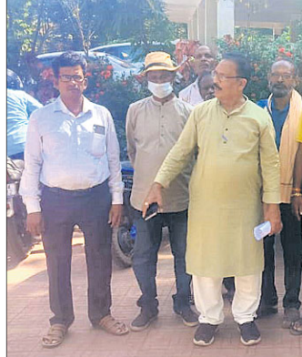
ଅତିରିକ୍ତ ଜିଲ୍ଲାପାଳଙ୍କ ନିକଟକୁ ଆସିଥିବା ସଂଗ୍ରାମ ସମିତି କର୍ମକର୍ତ୍ତା ଓ ଗ୍ରାମବାସୀ।

କୋରେଇ ବ୍ଲକ୍ ଅଧୀନ ଜହ୍ନା ପଞ୍ଚାୟତ ତାଲୁକା ଗ୍ରାମ ରାସ୍ତା ଗ୍ରାମ୍ୟ ଉନ୍ନୟନ ବିଭାଗ ଅଧୀନକୁ ଯିବ। ପରେ ଏହାର ମରାମତି କରାଯିବ ବୋଲି ପ୍ରତିଶ୍ରୁତି ଦିଆଯାଇଛି। ଏହି ରାସ୍ତାକୁ ନେଇ ଗ୍ରାମବାସୀ ଗତ ୨ ତାରିଖରେ ଆନ୍ଦୋଳନ କରିଥିଲେ। ପରେ କୋରେଇ ସଂଗ୍ରାମ ସମିତି ପକ୍ଷରୁ ଏନେଇ ଜିଲ୍ଲାପାଳଙ୍କୁ ୪୮ଟା ଦାବିପତ୍ର ପ୍ରଦାନ କରାଯାଇଥିଲା। ଜାତୀୟ ରାଜପଥ ୨୦କୁ ସଂଯୋଗ କରୁଥିବା ଏହି ରାସ୍ତାଟି ବିପର୍ଯ୍ୟୟ ହୋଇ ପଡ଼ିଛି।