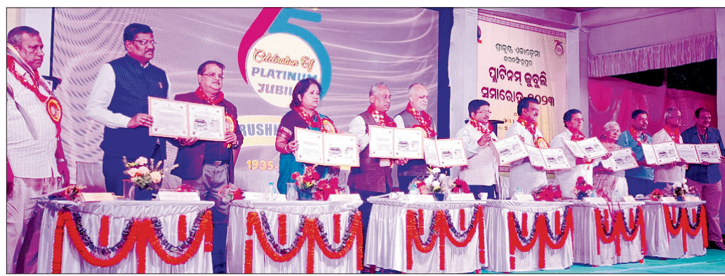
ଅତିଥିମାନେ ସ୍ୱତନ୍ତ୍ର ଡାକ ଚିତ୍ରେକ୍ତ ଓ ମୁଖପତ୍ର ଅଙ୍କନା ଉନ୍ମୋଚନ କରୁଛନ୍ତି ।