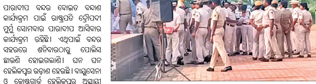
ରାସ୍ତ୍ରରେ ବାରିକେଡ୍ କରାଯାଇଛି । ରାସ୍ତ୍ରରେ ରଙ୍ଗରେ ସଜାଯାଇଛି । ରାଷ୍ଟ୍ରପତିଙ୍କ ସୁରକ୍ଷା ପାଇଁ ଆଇଜିକ୍