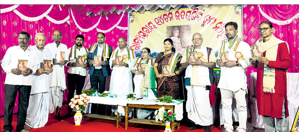
ଉଦ୍‌ଯଗିରି ବୁଦ୍ଧ ମହୋତ୍ସବ ଉଦ୍‌ଯାପନା ଉତ୍ସବରେ ଯୋଗଦେଇଥିବା ଅତିଥି ପ୍ରତିନିଧି ଉଦ୍‌ଯଗିରି ବୁଦ୍ଧ ମହୋତ୍ସବ କରୁଛନ୍ତି ।

ଉଦ୍‌ଯଗିରି ବୁଦ୍ଧ ମହୋତ୍ସବ ଉଦ୍‌ଯାପନା ଉତ୍ସବରେ ଯୋଗଦେଇଥିବା ଅତିଥି ପ୍ରତିନିଧି ଉଦ୍‌ଯଗିରି ବୁଦ୍ଧ ମହୋତ୍ସବ କରୁଛନ୍ତି । ଉଦ୍‌ଯଗିରି ବୁଦ୍ଧ ମହୋତ୍ସବ ଉଦ୍‌ଯାପନା ଉତ୍ସବରେ ଯୋଗଦେଇଥିବା ଅତିଥି ପ୍ରତିନିଧି ଉଦ୍‌ଯଗିରି ବୁଦ୍ଧ ମହୋତ୍ସବ କରୁଛନ୍ତି । ଉଦ୍‌ଯଗିରି ବୁଦ୍ଧ ମହୋତ୍ସବ ଉଦ୍‌ଯାପନା ଉତ୍ସବରେ ଯୋଗଦେଇଥିବା ଅତିଥି ପ୍ରତିନିଧି ଉଦ୍‌ଯଗିରି ବୁଦ୍ଧ ମହୋତ୍ସବ କରୁଛନ୍ତି ।