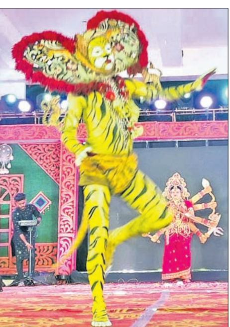
ଜଣେ କଳାକାର ପାଣିମୁଖା ନୃତ୍ୟ ପ୍ରଦର୍ଶନ କରୁଛନ୍ତି ।