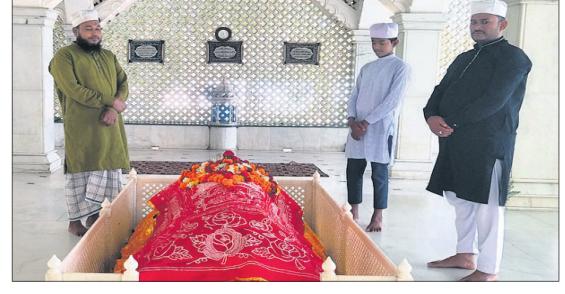
ଶ୍ରଦ୍ଧାଳୁମାନେ ପାରବାବାଙ୍କ ଆରଧନା କରୁଛନ୍ତି । ଏଠାକୁ ଯୋଗଦେବାକୁ ଆସିଥାନ୍ତି । କୌଣସି ବ୍ୟକ୍ତିର ଚୋରି କିମ୍ବା ଜିନିଷପତ୍ର ହରାଇଲେ ସେମାନେ ପାରବାବାଙ୍କ ପୀଠକୁ ଆସି ଯାଇ ବାନ୍ଧି ଦରଖାସ୍ତ କଲେ