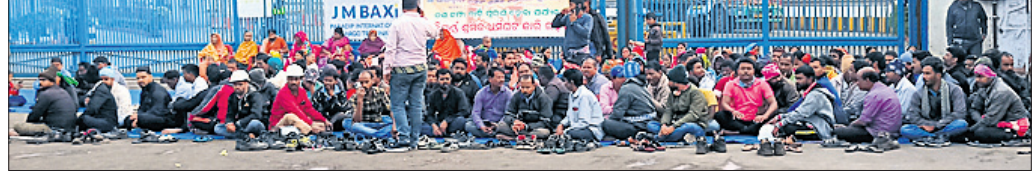
କମ୍ପାନୀ ଫାଟକ ଆଗରେ ଶ୍ରମିକମାନେ ପରିବାର ସହ ବସିଛନ୍ତି ।