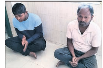
ଗିରଫ ହୋଇଥିବା ଶାଳକ, ଭିଣୋଇ ।

ଏହି ବକେଟ୍‌ରେ ରଖାଯାଇଥିଲା ଶାଳକ, ଭିଣୋଇ ଗିରଫ