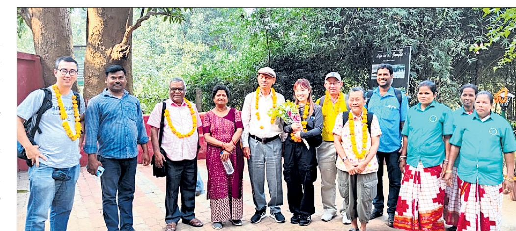
ସାତକୋଶିଆ ସ୍ୟାଣ୍ଡ ରିସୋର୍ଟକୁ ଆସିଥିବା ବିଦେଶୀ ପର୍ଯ୍ୟଟକଙ୍କୁ ସ୍ଵାଗତ କରାଯାଇଛି ।

ରାଜ୍ୟର ପ୍ରମୁଖ ପ୍ରାକୃତିକ ପର୍ଯ୍ୟଟନ କେନ୍ଦ୍ରଗୁଡ଼ିକ ମଧ୍ୟରେ ନୟାଗଡ଼ ଜିଲ୍ଲା ଗଣିଆ ବ୍ଲକ୍ ସାଉଥ ବଟଗୁଡ଼ ମଙ୍ଗଳାସାଠାରେ ଥିବା ସାତକୋଶିଆ ସ୍ୟାଣ୍ଡ ରିସୋର୍ଟ ଅନ୍ୟତମ । ଏହି ପ୍ରାକୃତିକ ପର୍ଯ୍ୟଟନ କେନ୍ଦ୍ର ଦେଶ ଓ ବିଦେଶୀ ପର୍ଯ୍ୟଟକଙ୍କୁ ବେଶ୍ ଆକୃଷ୍ଟ କରିଛି । ପ୍ରତିବର୍ଷ ଭଳି ଚଳିତ ବର୍ଷ ମଧ୍ୟ ଏଠାକୁ ବିଭିନ୍ନ ଦେଶରୁ ପର୍ଯ୍ୟଟକମାନେ ଆସିବାରେ ଲାଗିଛନ୍ତି । ଗୁରୁବାର ଏହି ସ୍ୟାଣ୍ଡ ରିସୋର୍ଟକୁ ପ୍ରାନ୍ତସ୍ତର ମାଲ୍‌କୋଟିପି କୋଟପିକନ୍, ହୁଭଲିୟର ଆଦି-ଏ ଡାକିବା, ଜାପାନର ଇଷାକ୍ ସିମ୍ପଲ, ଯାନୋ ସାହୋ, ଆଲକାଶ୍ଵର ରୁଦ୍ରପୁରି ଆକରନ୍ତ କାଖାଇକିପ୍ପାଠ ଓ ବ୍ୟାଙ୍କର ସାନସାନି ରୁଆଇଓ ପ୍ରମୁଖ ପର୍ଯ୍ୟଟକ