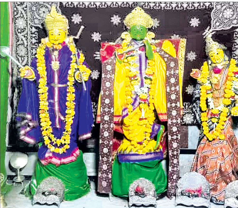
ପଞ୍ଚକ ଅବସରରେ ଶନିବାର ଓଡ଼ିଶା ଶ୍ରୀରାମମନ୍ଦିର ଶ୍ରୀରାମକରାମ ବେଶ ।

କାରଣରୁ ପ୍ରଦୂଷଣ ବନ୍ଦରେ ନୟାଗଡ଼ ଜିଲ୍ଲା ରହିଥିବା ଅଭିଯୋଗ ହୋଇ ଆସୁଛି । ଜିଲ୍ଲାରେ ଚୋଙ୍ଗାପାଳି ଓ ବନ ସୁରକ୍ଷା ସମିତି ମାଧ୍ୟମରେ ଜଙ୍ଗଲର ସୁରକ୍ଷା କରାଯାଉଥିଲେ ହେଁ ଜିଲାର ୩୦ ପ୍ରତିଶତ ଜଙ୍ଗଲ ସୁରକ୍ଷିତ ନୁହେଁ । ବିକାଶ ନୀତିରେ ବିନାଶ ଚାଲିଥିବାକୁ କେବଳ ସ୍ଥଳ କି ଆକାଶ ନୁହେଁ କଳ ବି ପ୍ରଦୂଷିତ ହୋଇ ଚାଲିଛି । ପରିବେଶର ସୁରକ୍ଷା ସମସ୍ତଙ୍କୁ ଯାଚିଥିଲେ ମଧ୍ୟ ପ୍ରତିକାର କରାଯାଇନାହିଁ । ସମୟ ଆସିଛି ପରିବେଶକୁ ସୁରକ୍ଷା କଲେ ଆମେ ଓ ଆମର ବଂଶଧର ସୁରକ୍ଷିତ ରହିବେ, ନ ହେଲେ ସବୁ ବିଗିଡ଼ି ଚାଲିବ । ଶେଷରେ ଜୀବଜଗତ ସଙ୍କଟରେ ପଡ଼ିବେ ବୋଲି କହିଛନ୍ତି ।