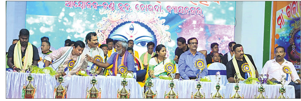
ମଞ୍ଚରେ ଉପସ୍ଥିତ ଅତିଥି, ପୂଜା କମିଟିର ସଭାପତି ଓ ସମ୍ପାଦକ ।

ଯାଜପୁରରୋଡ଼, ୨୫।୧୧(ପବିତ୍ର ରଞ୍ଜନ ମହାନ୍ତି): ବ୍ୟାସନଗର ସହରରେ ଚଳିତ ବର୍ଷ କାଳୀପୂଜା ଭସାଣି ଓ ମେଳଣ ଉତ୍ସବରେ ୨ ଲକ୍ଷରୁ ଊର୍ଦ୍ଧ୍ୱ ଲୋକଙ୍କ ଜନସମାଗମ ହୋଇଛି । ରୁଧିର ଅନୁଷ୍ଠିତ ଭସାଣିରେ ରାଜ୍ୟ ଓ ରାଜ୍ୟ ବାହାରର ବିଭିନ୍ନ ପାରମ୍ପରିକ ବାଦ୍ୟନୃତ୍ୟ ଯଥା; ଓଡ଼ିଶା, ଗୋଟିପୁଅ, ଆଦିବାସୀ ମହିଳାଙ୍କ କଳସ, ଆଦିବାସୀ ନୃତ୍ୟ, ପୂଜା ବୈଦିକାଳପୁରର ଘଣ୍ଟୁଆ, କାର୍ତ୍ତିକ, ସିଂହାକା ସହ ପଞ୍ଚାବୀ ବ୍ୟାଞ୍ଜ ପାର୍ଟି, ଏନାକୁଲମ ନୃତ୍ୟ, ବେଙ୍ଗଲୀ ମାଠିଆ ନୃତ୍ୟ, ହରିୟାଶାଳ ଆୟୋଗୀ ଓ ଶିବ ଚାଣ୍ଡବ ପ୍ରମୁଖ ବିଭିନ୍ନ ପୂଜା କମିଟି ପକ୍ଷରୁ ପ୍ରଦର୍ଶନ କରାଯାଇଥିଲା । ଏହାବର୍ତ୍ତକ ମନମୁଗ୍ଧ କରିଥିଲା । ଅପରାହ୍ଣ ଶାନ୍ତି ମେଳଣରେ ଗୋପବନ୍ଧୁ ଛକଠାରୁ ଶୋଭାଯାତ୍ରାରେ ବାହାରି ଗୋରାବା ବାଲପାସ ହୋଇ ରାତି