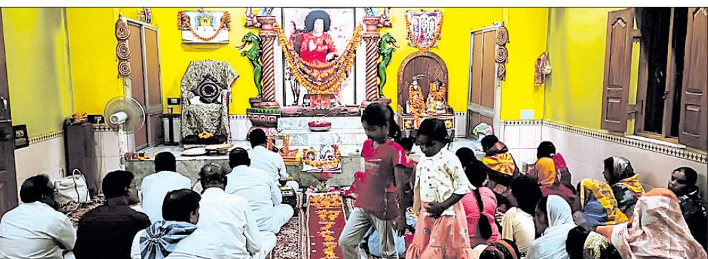
ସତ୍ୟସାଇଙ୍କ ଜୟନ୍ତୀ ଉତ୍ସବରେ ଯୋଗଦେଇଥିବା ଶ୍ରଦ୍ଧାଳୁ ।