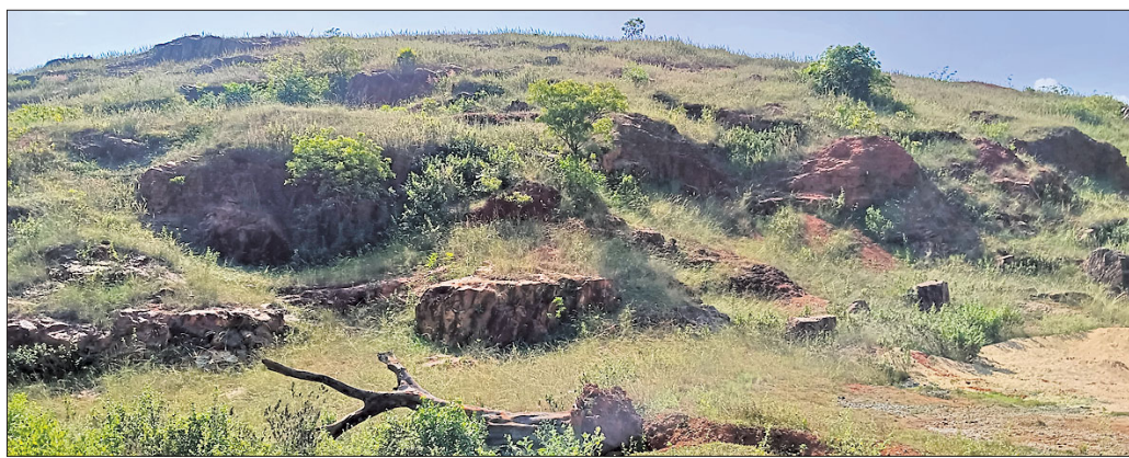
କାଏମା ପାହାଡ଼ ।

ଐତିହାସିକ ହାତିଆଶୁଣା ପ୍ରତି ପ୍ରଶାସନର ନଜର ପଡ଼ୁଛି