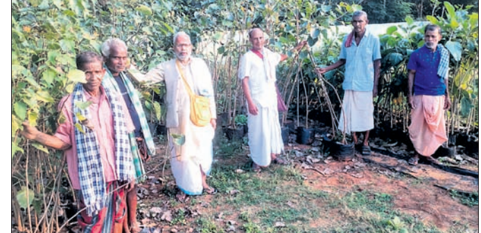
ଶ୍ରୀହରି ଆଧ୍ୟାତ୍ମିକ ପକ୍ଷରୁ ଚାରାରୋପଣ କରାଯାଇଛି ।