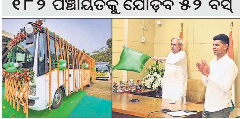
ପୁଖ୍ୟମନ୍ତ୍ରୀ ନବୀନ ପଟ୍ଟନାୟକ ଲକ୍ଷ୍ମୀ ବସ୍ ଯୋଜନାର ଶୁଭାରମ୍ଭ କରୁଛନ୍ତି। ନିକଟରେ ୫-ଟି ଏବଂ ନବୀନ ଓଡ଼ିଶା ଅଧ୍ୟକ୍ଷ ଭି.କେ.ପାଣ୍ଡେଆର୍ ଉପସ୍ଥିତ।