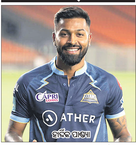
ନଭେମ୍ବର ୨୬ରେ ପ୍ରାଣ୍ଡାଲ୍ ଇଣ୍ଡିଆନ୍ସ ପାଇଁ ଖେଳାଳି ରିଟେନ ଚାଲିବା ପ୍ରକାଶ କରିବାକୁ ଶେଷ ଚାରିଖ ଧାର୍ଯ୍ୟ କରାଯାଇଥିଲା। ତଦନୁସାରେ ପ୍ରାଣ୍ଡାଲ୍ ଇଣ୍ଡିଆନ୍ସରେ ଅନେକ

ନାମା ଖେଳାଳିଙ୍କୁ ଦଳକୁ ରିଲିଜ୍ କରିଥିବା ଜଣାଯାଇଛି। ମୁମ୍ବାଇ ଇଣ୍ଡିଆନ୍ସ ଆହତ ସମସ୍ୟାକୁ ସମ୍ପୂର୍ଣ୍ଣ ମୁକ୍ତି ନ ଥିବା ଛୋଟା ଆର୍ଡରକୁ ରିଲିଜ୍ କରିଛି। ସେହିପରି ଚାଇଟାନ୍ସ ସିଜନରେ ଥିବା ରୟାଲ ଚ୍ୟାଲେଞ୍ଜର୍ସ ବାଙ୍ଗାଲୋର ଫ୍ଲିନିୟୁ ହସରାଜା, ହର୍ଶଲ ପଟେଲ ଏବଂ କୋଶ୍ଵ ହାଇଲାଇଟ୍ ପରି ଖେଳାଳିଙ୍କୁ ରିଲିଜ୍ କରିଦେଇଛି। ଫଳରେ ଦ୍ରୁତ ବୋଲର ମିଚେଲ ଷ୍ଟାର୍କ ପରି ଖେଳାଳିଙ୍କୁ ଆଣିବା ପଥ ପରିଷ୍କାର ହୋଇଛି। କୋଲକାତା ନାଇଟ ରାଇଡର୍ସ ଶାର୍ଦ୍ଦୂଳ ଠାକୁରଙ୍କ ସମେତ ୧୨ ଖେଳାଳିଙ୍କୁ ରିଲିଜ୍ କରିଛି।