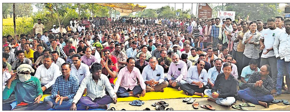
ଲୁଚ୍ଚପାଟ ପ୍ରତିବାଦରେ ବରଗଡ଼-ଭେଜେନ ରାସ୍ତାର ମାଲିପାଲି ଛକରେ ରାସ୍ତାରୋକ୍ଷ କରାଯାଇଛି ।

ବରଗଡ଼, ୨୬/୧୧ (ପ୍ରେମାନନ୍ଦ ଖମ୍ବାରୀ) ବରଗଡ଼ ଜିଲ୍ଲାର ଆଇନ ଶୁଖିଲା ପରିସ୍ଥିତି ବିପର୍ଯ୍ୟୟ ହୋଇ ପଡ଼ିଛି। ଦିନ ବୁଝୁଛନ୍ତି ରାସ୍ତାଘାଟରେ ଲୁଚ୍ଚପାଟ, ହତ୍ୟା ଭଳି ଅପରାଧ ବଢ଼ି ଚାଲିଛି।