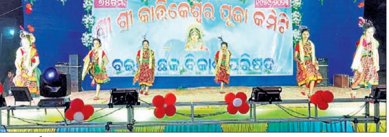
ବଜୟା କାର୍ତ୍ତିକେଶ୍ୱର ପୂଜା ମଣ୍ଡପ।