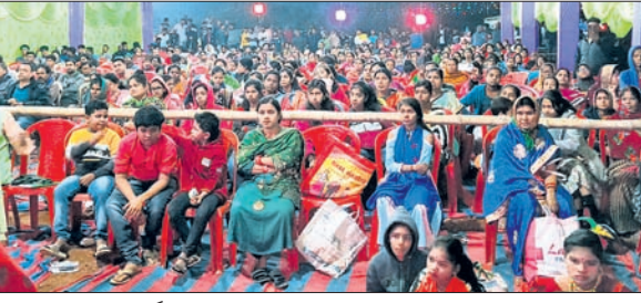
ସାଂସ୍କୃତିକ କାର୍ଯ୍ୟକ୍ରମକୁ ଲୋକେ ଉପଭୋଗ କରୁଛନ୍ତି।

ବଜୟା, ୨୬.୧୧ (ପରିକ୍ଷିତ ସାହୁ) ଗ୍ରାମାଞ୍ଚଳର ଶିଶୁଙ୍କ ଠାରେ ପ୍ରତିଭାର ଅଭାବ ନାହିଁ। ସେହି ଲୁଚାଯିତ ପ୍ରତିଭାର ପରିପ୍ରକାଶ କରୁଣା। ଏହା ଠିକଣା ଭାବେ କରାଯାଇ ପାରିଲେ ଗାଁର ପିଲା ଦେଶ ବିଦେଶରେ ନିଜର ପରିଚୟ ସୃଷ୍ଟି କରିପାରିବେ। ଗାଁକୁ ମଧ୍ୟ ପରିଚିତ କରାଇପାରିବେ। କିଶୋରନଗର ବ୍ଲକ୍ ବଜୟା କାର୍ତ୍ତିକେଶ୍ୱର ପୂଜା ମଣ୍ଡପ