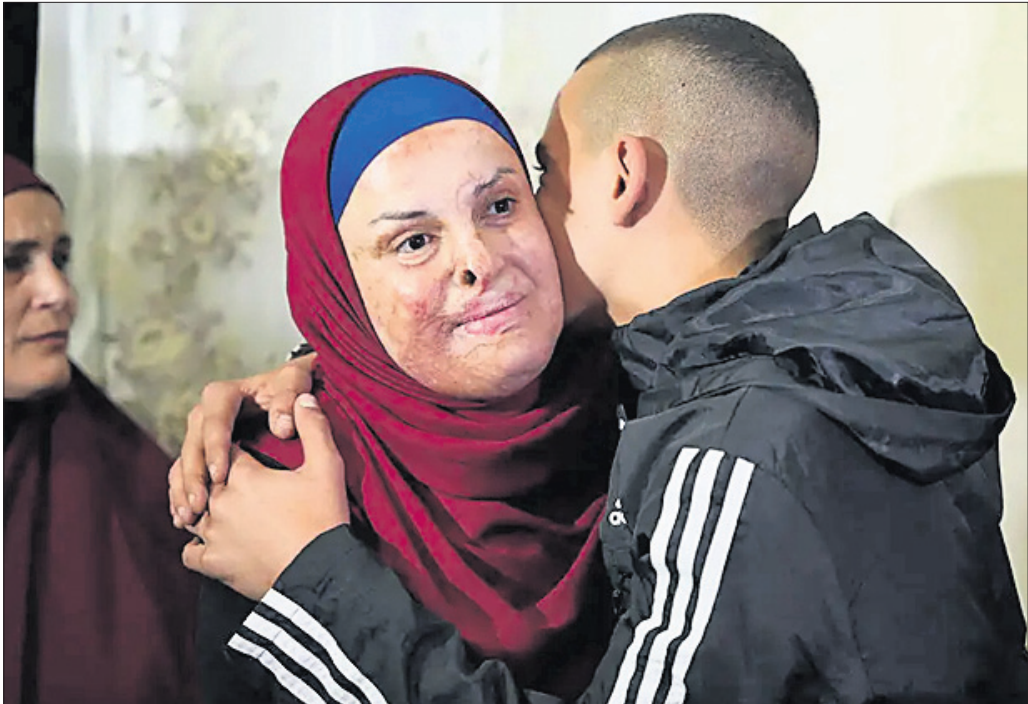
ଇସ୍ରାଏଲୀ ସୈନ୍ୟଙ୍କୁ ରବିବାର ଭୋଗ ସମୟରେ କେରୁକେଲମ୍ ବାସଭବନରେ ପରିବାର ଲୋକେ ସ୍ୱାଗତ କରୁଛନ୍ତି।

ଘଣ୍ଟାପାଳ-ହମାୟ ମୁକ୍ତବିରତି ରବିବାର ତୃତୀୟ ଦିନରେ ପହଞ୍ଚିଥିବାବେଳେ ଗାଳା ଆତଙ୍କବାଦୀମାନେ ପଶବନ୍ଦୀ କରି ରଖିଥିବା ଆଉ ୧୪ ଘଣ୍ଟାପାଳୀ ଓ ୩ ବିଦେଶୀ ନାଗରିକଙ୍କୁ ମୁକ୍ତ କରିଛନ୍ତି। ଅନ୍ୟ ଏକ ଘଟଣାକ୍ରମରେ ହମାୟର ଏକ ବରିଷ୍ଠ କମାଣ୍ଡରଙ୍କୁ ଘଣ୍ଟାପାଳୀ ସୈନ୍ୟ ହତ୍ୟା କରିଛନ୍ତି। ଘଣ୍ଟାପାଳ ମୁକ୍ତବିରତି ସହିର ସର୍ଭ ଉଲ୍ଲଂଘନ କରୁଥିବା ନେଇ ହମାୟ ଅଭିଯୋଗ ଆଣିବା ପରେ ଶନିବାର ତୃତୀୟ ଦିନର ବନ୍ଦୀ ବିନିମୟ ବିଳମ୍ବିତ ହୋଇଥିଲା। ପରେ ହମାୟ ୧୩ ଘଣ୍ଟାପାଳୀ ଓ ୪ ଆଇଲୁ ମୁକ୍ତ କରିଥିଲା।