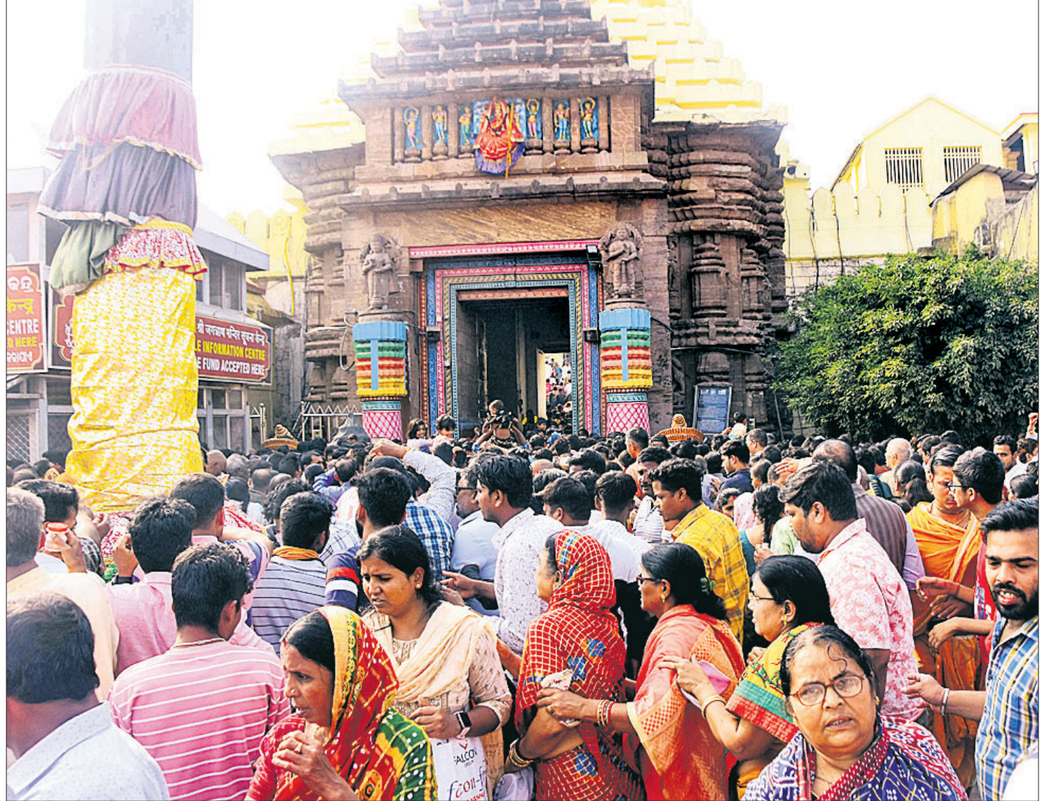
ପବିତ୍ର ପଞ୍ଚକ ତଥା ଘୋମବାର କାର୍ତ୍ତିକ ପୂର୍ଣ୍ଣିମା ଉପଲକ୍ଷେ ଶ୍ରୀକ୍ଷେତ୍ରରେ ରବିବାର ମହାପ୍ରଭୁଙ୍କ ଦର୍ଶନ ପାଇଁ ଭକ୍ତଙ୍କ ଗହଳ।