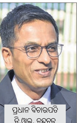
ପ୍ରଧାନ ବିଚାରପତି ଡି.ଓ.ଇ. ଚନ୍ଦ୍ରଚୂଡ଼

ଖାନ୍ନା, ଆଇନମନ୍ତ୍ରୀ ଅର୍ଜୁନ ରାମ ମେଘାଓଲ ଓ ଅନ୍ୟମାନେ ଯୋଗଦେଇଥିଲେ। ସିଜେଆଇ କହିଥିଲେ, ବିଗତ ୭ ଦଶନ୍ଧି ହେଲା ସର୍ବୋଚ୍ଚ ଅଦାଲତ ଲୋକଙ୍କ ଅଦାଲତ ଭାବେ କାର୍ଯ୍ୟ କରିଆସୁଛି। ଏହି ଅନୁଷ୍ଠାନ ଜରିଆରେ ନ୍ୟାୟ ମିଳିବ ବୋଲି ଜନସାଧାରଣଙ୍କର ଭରସା ରହିଥିବାରୁ ହଜାର ହଜାର ନାଗରିକ ସେଠାରେ ପହଞ୍ଚିଛନ୍ତି। ଏହାର ଗାୟ ବଳରେ ଜନସାଧାରଣ ନ୍ୟାୟ ପାଇଛନ୍ତି। ଅଦାଲତର ପ୍ରଶାସନିକ ପ୍ରକ୍ରିୟାକୁ ନାଗରିକ କୈତ୍ତିକ କରିବା ପାଇଁ ସୁପ୍ରିମକୋର୍ଟ କ୍ରମାଗତ ପ୍ରୟାସ ଜାରି ରଖିଛନ୍ତି, ଯେପରି କୋର୍ଟ କାର୍ଯ୍ୟ ସହ ଲୋକେ ସମ୍ପୃକ୍ତ ଥିବା ଅନୁଭବ କରିବେ। ଜେଲକୁ ଗହଳି କମାଇବା ଲାଗି ବିଭିନ୍ନ ପଦକ୍ଷେପ ଉପରେ କାର୍ଯ୍ୟ କରାଯାଉଛି। ଏହାଦ୍ୱାରା ନ୍ୟାୟପାଳିକା ଲୋକଙ୍କ ପାଇଁ କାମ କରୁଛି ବୋଲି ସେମାନେ ଅନୁଭବ କରିପାରିବେ। ଏବେ କୋର୍ଟ ଶୁଣାଣୀ ଏବଂ