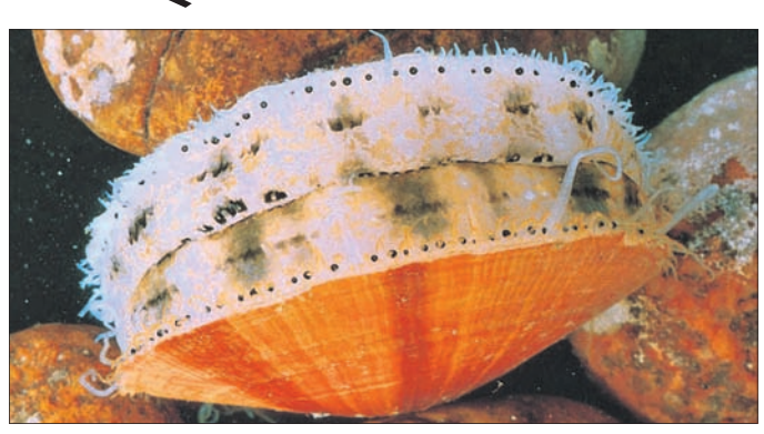
ଶାମୁକା ଦୁନିଆର ଅଜ୍ଞାତ ଜୀବନୀ। ଯୁଦ୍ଧରେ ଭୋଗି ଯୁଦ୍ଧରେ କେତେକ ମହିଳାଙ୍କୁ ବିବାହ ଆୟୋଜନ କରିବାକୁ ପରାମର୍ଶ ଦିଆଯାଇଛି।