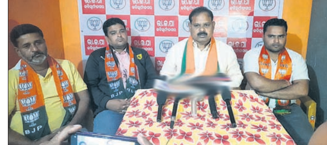
ଖବରଦାତା ସମ୍ମିଳନୀରେ ଭାଜପାର ନେତୃବୃନ୍ଦ।