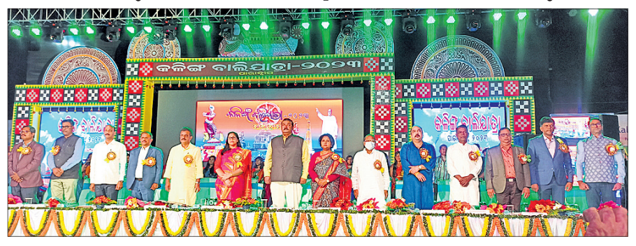
କଳିଙ୍ଗ ବାଲିଯାତ୍ରା ମହୋତ୍ସବର ଉଦ୍ଘାଟନା କାର୍ଯ୍ୟକ୍ରମରେ ଯୋଗଦେଇଥିବା ଅତିଥିମାନେ।

ପାରାଦୀପର ବେଳାକୂଳରେ ରବିବାର ସନ୍ଧ୍ୟାରେ କଳିଙ୍ଗ ବାଲିଯାତ୍ରା ମହୋତ୍ସବ ୨୦୨୩ ଉଦ୍ଘାଟିତ ହୋଇଯାଇଛି। ମୁଖ୍ୟ ଅତିଥିଭାବେ ଶକ୍ତି, ଶିଳ୍ପ, ଅଣୁ ଯୁଦ୍ଧ ଓ ମଧ୍ୟ ଉଦ୍ୟୋଗ ମନ୍ତ୍ରୀ ପ୍ରତାପ କେଶରୀ ଦେବ ଯୋଗଦେଇ ଏହାକୁ ଉଦ୍ଘାଟନ କରିଥିଲେ। ଏହି ଅବସରରେ ସେ କହିଥିଲେ, ପ୍ରବାଦ ପୁରୁଷ ବିକ୍ର ପଟ୍ଟନାୟକ ଏହି ବାଲିଯାତ୍ରା ଆରମ୍ଭ କରିଥିଲେ। ପାରାଦୀପ ବନ୍ଦର ମଧ୍ୟ ଏହି ମହାନ ବ୍ୟକ୍ତି ପ୍ରତିଷ୍ଠା କରିଥିଲେ। ତାଙ୍କ ଯୋଗୁ ପାରାଦୀପ ଆଜି ଦେଶର ୧ ନମ୍ବର ବନ୍ଦର ହୋଇପାରିଛି। ସେହିପରି କଟକ ପରେ ପାରାଦୀପର କଳିଙ୍ଗ ବାଲିଯାତ୍ରା ଦ୍ୱିତୀୟ ବୃହତ୍ ବାଣିଜ୍ୟ ମେଳା ଭାବେ ପରିଚିତ ହୋଇଛି ବୋଲି