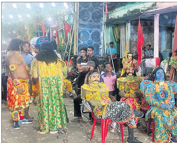
ଯାତ୍ରାରେ ରବିବାର ସନ୍ଧ୍ୟାରେ ଅନୁଷ୍ଠିତ ନାଚକ।