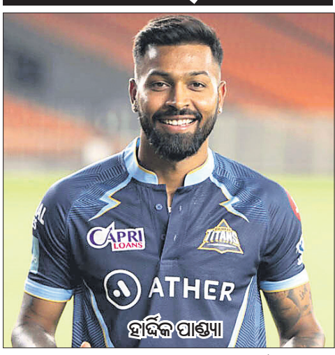
ନଭେମ୍ବର ୨୬ରେ ପ୍ରାଥମିକତା ପାଇଁ ଖେଳାଳି ରିଟେନ ଚାଲିବା ପ୍ରକାଶ କରିବାକୁ ଶେଷ ଚାରିଖ ଧାର୍ଯ୍ୟ କରାଯାଇଥିଲା। ତଦନୁସାରେ ପ୍ରାଥମିକତାରେ ଅନେକ

ନାମା ଖେଳାଳିଙ୍କୁ ଦଳକୁ ରିଲିଜ୍ କରିଥିବା ଜଣାଯାଇଛି। ମୁମ୍ବାଇ ଇଣ୍ଡିଆନ୍ସ ଆହତ ସମସ୍ୟାକୁ ସମ୍ପୂର୍ଣ୍ଣ ମୁକ୍ତି ନ ଥିବା କୋଚ୍ଚା ଆର୍ଡରକୁ ରିଲିଜ୍ କରିଛନ୍ତି। ସେହିପରି ଟାଇଟାନ୍ସ ସିଜନରେ ଥିବା ରୟାଲ ଚ୍ୟାଲେଞ୍ଜର୍ସ ବାଙ୍ଗାଲୋର ଫ୍ଲିନିୟୁ ହସରାଜା, ହର୍ଶଲ ପଟେଲ ଏବଂ କୋଶି ହାଜେଲଉଡ୍ଙ୍କ ପରି ଖେଳାଳିଙ୍କୁ ରିଲିଜ୍ କରିଦେଇଛନ୍ତି। ଫଳରେ ଦ୍ରୁତ ବୋଲର ମିଚେଲ ଷ୍ଟାର୍କଙ୍କ ପରି ଖେଳାଳିଙ୍କୁ ଆଣିବା ପଥ ପରିଷ୍କାର ହୋଇଛି। କୋଲକାତା ନାଇଟ ରାଇଡର୍ସ ଶାର୍ଦ୍ଦୂଳ ଠାକୁରଙ୍କ ସମେତ ୧୨ ଖେଳାଳିଙ୍କୁ ରିଲିଜ୍ କରିଛନ୍ତି।