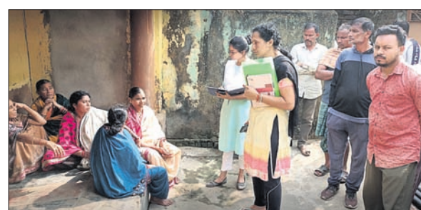
ପୋଲିସ ଓ ସାଇଟିଫିକ୍ ଟିମ୍ ଘଟଣାସ୍ଥଳରେ ତଦନ୍ତ କରୁଛି। କୁନୁର ସାଇଟିଫିକ୍ ଟିମ୍ ପହଞ୍ଚି ତଦନ୍ତ କରି ଫେରିଛନ୍ତି। ପାରିପାର୍ଶ୍ଵିକ ସ୍ଥିତିକୁ ଦେଖିଲେ ଏହା ହତ୍ୟାକାଣ୍ଡ ବୋଲି ଜଣାପଡ଼ିଛି। ହେଲେ କୁନାଗଡ଼ ପୋଲିସ ଏକ ଅପମୃତ୍ୟୁ ମାମଲା

ଏହି ହତ୍ୟାକାଣ୍ଡ ହୋଇଥିବା ସେ ସନ୍ଦେହ କରୁଛନ୍ତି। ମୃତ ମହିଳାଙ୍କ ଘର କବାଟ ଆଗ ପଟରେ ତାଲା ଛୁଲୁଥିବା ଓ ଘର ଭିତରେ ତାଙ୍କ ପୋଡ଼ା ମୃତଦେହ ବାହାରିବା ଘଟଣା ସାଧାରଣତଃ ଚର୍ଚ୍ଚାର ବିଷୟ ହୋଇଛି। ଖବର ପାଇ ଘଟଣାସ୍ଥଳରେ କୁନାଗଡ଼ ପୋଲିସ ସହ ସହାୟତା