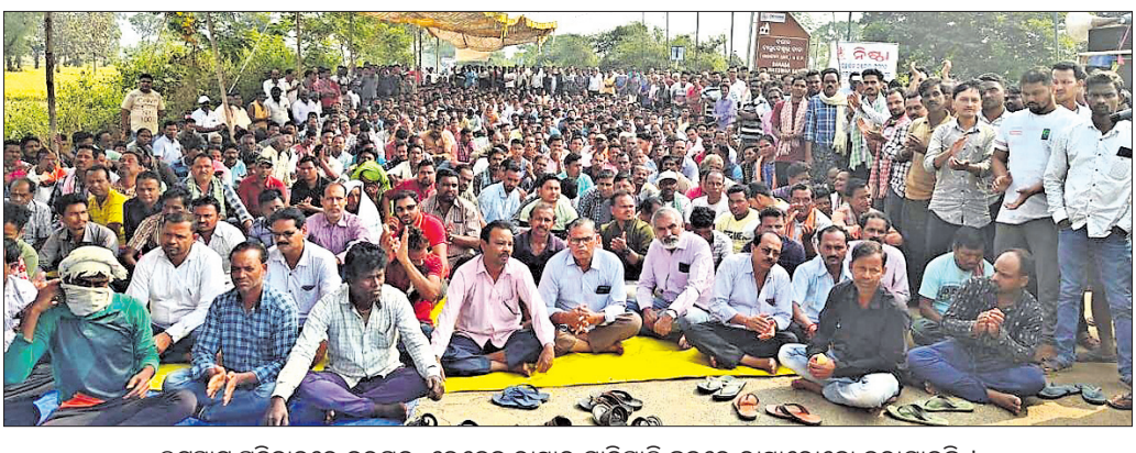
ଲୁଚ୍ଚାପ୍ରତିବାଦରେ ବରଗଡ଼-ଭେତେନ ରାସ୍ତାର ମାଲିପାଲି ଛକରେ ରାସ୍ତାରୋକ୍ କରାଯାଇଛି ।

ବରଗଡ଼, ୨୬/୧୧ (ପ୍ରେମାନନ୍ଦ ଖମ୍ବାରୀ) ବରଗଡ଼ ଜିଲ୍ଲାର ଆଇନ ଶୁଖିଲା ପରିସ୍ଥିତି ବିପର୍ଯ୍ୟୟ ହୋଇ ପଡ଼ିଛି। ଦିନ ବୁଝିପୁରରେ ରାସ୍ତାଘାଟରେ ଲୁଚ୍ଚାପ୍ରତିବାଦ, ହତ୍ୟା ଭଳି ଅପରାଧ ବଢ଼ି ଚାଲିଛି।