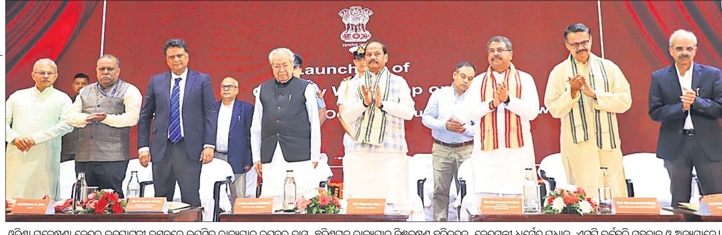
ଓଡ଼ିଶା ଗବେଷଣା କେନ୍ଦ୍ରର ଉପାଧ୍ୟକ୍ଷ ଉପସ୍ଥିତ ରାଜ୍ୟପାଳ ରଘୁବର ଦାସ, ଛତିଶଗଡ଼ ରାଜ୍ୟପାଳ ବିଶ୍ୱକୃଷ୍ଣା ହରିଚନ୍ଦନ, କେନ୍ଦ୍ରମନ୍ତ୍ରୀ ଧର୍ମେନ୍ଦ୍ର ପ୍ରଧାନ, ଏମ୍ପି ଭକ୍ତହରି ମହାପାତ୍ର ଓ ଅନ୍ୟମାନେ।

କୋରାପୁଟ ଉପଖଣ୍ଡ ଅଧୀନସ୍ଥ ସମସ୍ତ କୃଷକ ଓ ବ୍ୟବସାୟୀ ଭାଇ ଭଉଣୀମାନଙ୍କୁ ଧରିତ୍ରୀର ୫୦ତମ ସ୍ୱନକ୍ଷତ୍ର ଦିବସ ଉପଲକ୍ଷେ ନିୟନ୍ତ୍ରିତ ବଜାର କମିଟି କୋରାପୁଟ ତରଫରୁ ହାର୍ଦ୍ଦିକ ଅଭିନନ୍ଦନ ଓ ଶୁଭେଚ୍ଛା। କୃଷକ ଭାଇ ଭଉଣୀମାନଙ୍କ କୃଷିଜାତ ତ୍ରୁଟ୍ୟ on-line ମାଧ୍ୟମରେ ବିକ୍ରି କରିବା ପାଇଁ କୁହୁଲିଠାରେ Electronics-National Agricultural Market (e-NAM) ସ୍ଥାପନ କରାଯାଇଅଛି। ସେଠାରେ ସିମେଣ୍ଟ ପିଣ୍ଡ, ନିଲମାଗୁଡ଼ି, ଆଶୁଗୁଣ୍ଡଳୀ, ପାନୀୟ ଜଳ, ଗୋଦାମ ଗୁଡ଼ି, ବିଦ୍ୟୁତ୍ ଆଲୋକ ପ୍ରଭୃତିର ବ୍ୟବସ୍ଥା କରାଯାଇଅଛି। e-NAM ମାଧ୍ୟମରେ କୃଷକମାନଙ୍କର କୃଷିଜାତ ତ୍ରୁଟ୍ୟ ନିୟନ୍ତ୍ରିତ ବଜାର କମିଟି କର୍ମଚାରୀମାନଙ୍କ ଦ୍ୱାରା ବିକ୍ରି କରାଯାଉଅଛି। ଏଣୁ ସମସ୍ତ କୃଷକ ଭାଇ ଭଉଣୀମାନଙ୍କୁ ଅନୁରୋଧ, ସେମାନେ ସେମାନଙ୍କ କୃଷିଜାତ ତ୍ରୁଟ୍ୟ ଇ-ନାମରେ ଅନୁଲୋଚନା ମାଧ୍ୟମରେ ବିକ୍ରୟ କରି ଅଧିକ ଲାଭବାନ ହୁଅନ୍ତୁ।