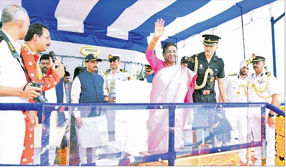
ବନ୍ଦର ଦିବସ, ବୋଇତ ବନ୍ଦାଣ ଉତ୍ସବରେ ରାଷ୍ଟ୍ରପତି ଦ୍ରୌପଦୀ ମୂର୍ମୂ ଓ ରାଜ୍ୟପାଳ ରଘୁବର ଦାସ।

ଭାରତ ଏବେ ବିକାଶ ପଥରେ ଆଗେଇ ଚାଲିଛି। ମହାକାଶକୁ ଯାଇପାରିବ। ସେହିପରି ସମୁଦ୍ର ଭିତରେ ଥିବା ଜୀବଜଗତ ଓ ଗଭୀରତାକୁ ଆବିଷ୍କାର କରିବା ପାଇଁ ସମୁଦ୍ରଯାନ ମିଶନ ଆରମ୍ଭ କରିଛି। ୬ ହଜାର ମିଟର ସମୁଦ୍ର ଗର୍ଭରେ ଏହି ମିଶନ ଆରମ୍ଭ ହୋଇଛି ବୋଲି ଭାରତର ରାଷ୍ଟ୍ରପତି ଦ୍ରୌପଦୀ ମୂର୍ମୂ କହିଛନ୍ତି। ପାରାଦୀପ ବନ୍ଦର ଖେଟବେସିନଠାରେ ଆୟୋଜିତ ବନ୍ଦର ଦିବସ ଓ ବୋଇତ ବନ୍ଦାଣ ଉତ୍ସବ କାର୍ଯ୍ୟକ୍ରମରେ ପୁଖ୍ୟ ଅତିଥି ଭାବେ ଯୋଗ ଦେଇ ରାଷ୍ଟ୍ରପତି ମୂର୍ମୂ ଏହା କହିଥିଲେ। ସେ ଜୟ ଜଗନ୍ନାଥ କହି ବକ୍ତବ୍ୟ ଆରମ୍ଭ କରିବା ସହ କାର୍ତ୍ତିକ ପୂର୍ଣ୍ଣିମା ଉତ୍ସବ ନୌବାଣିଜ୍ୟ ପରମ୍ପରା ଅବସରରେ ଦେଶବାସୀଙ୍କୁ ଶୁଭେଚ୍ଛା ଜଣାଇଥିଲେ। ଏହି ଅବସରରେ ସେ ସାଧବାଣୀ ସାଧବପୁଅ କିପରି ବୋଇତ ଯୋଗେ ସୁଦୂର ବାଲି, ମୁମ୍ବାଡ଼ା ଯାତ୍ରା କରି ବେପାର କରୁଥିଲେ ସେ ସମ୍ପର୍କରେ ଆଲୋଚନା କରିଥିଲେ। ପ୍ରତ୍ୟେକ ଓଡ଼ିଆ କାର୍ତ୍ତିକ ପୂର୍ଣ୍ଣିମା ଅବସରରେ ନଦୀ ପୋଖରୀ ସମୁଦ୍ରରେ ପ୍ରତୀକାତ୍ମକ ତଜା ଭସାଇଥାନ୍ତି। ମୂର୍ମୂ ମଧ୍ୟ ଅନେକ ଥର ଏପରି ତଜା ଭସାଇଛନ୍ତି। ଓଡ଼ିଶାରେ ବାର ମାସରେ ତେରପର୍ବ ପାଳନ ହୁଏ। ସେଥିରେ କିଛି ଧାର୍ମିକ ଓ କିଛି କୃଷିଭିତ୍ତିକ ପର୍ବ ରହିଛି। କିନ୍ତୁ ଉତ୍କଳୀୟ ନୌବାଣିଜ୍ୟ ପରମ୍ପରା ଭିତ୍ତିକ ପର୍ବ ବାଲିଯାତ୍ରା ସମ୍ପୂର୍ଣ୍ଣ ନିଆରା ବୋଲି କହିଥିଲେ। ଓଡ଼ିଆ କବି ଉପେନ୍ଦ୍ର ଭଞ୍ଜଙ୍କଠାରୁ