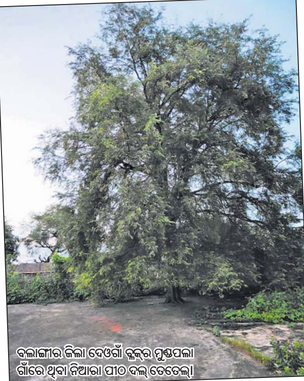
ବଲାଙ୍ଗୀର ଜିଲ୍ଲା ଦେଓଗାଁ ବ୍ଲକ୍ କୁଳତାପଡ଼ା ଗାଁରେ ଥିବା ନିଆରା ପୀଠ ଦଲ୍ ତେତେଲ୍।

ଆଦିବାସୀଙ୍କ ପାଇଁ ଏହା ଏକ ପବିତ୍ର ସ୍ଥାନ। ଏଇ ଗଛତଳେ କେଉଁ ଆଦିବାସୀ କାଳରୁ ଶୁଳିଆ ଅଞ୍ଚଳର କଣ ଆଦିବାସୀ ସମ୍ପ୍ରଦାୟର ଝାଙ୍କର, ଦେହେରିଆମାନେ ଚୁରୁଦ୍ୱାର୍ଯ୍ୟ ବୈଠକ କରନ୍ତି। ପ୍ରଥା ରହିଛି ଯେ, ପ୍ରତିବର୍ଷ ନୂଆଖାଇ (ରଷି ପଞ୍ଚମୀ) ଏବଂ ପ୍ରସିଦ୍ଧ ଶୁଳିଆ ଯାତ୍ରା(ପୌଷମାସ ଶୁକ୍ଳପକ୍ଷ ପ୍ରଥମ ମଙ୍ଗଳବାର)ର ୧୦ ଦିନ ପୂର୍ବରୁ ଏହି ଦଲ୍ ତେତେଲ୍ ଗଛ ଶୁଳିଆ ଅଞ୍ଚଳରେ ପରିଗଣିତ ବଲାଙ୍ଗୀର, ସୁବର୍ଣ୍ଣପୁର, ବୌଦ୍ଧ ଏବଂ କଳାହାଣ୍ଡି ଜିଲ୍ଲାର ୧୫ ଗ୍ରାମପଞ୍ଚାୟତ ଅଧୀନ ୬୫ ଖଣ୍ଡ ଗାଁର ଗ୍ରାମ ଦେବଦେବୀଙ୍କ ପୂଜକ ଝାଙ୍କର ଏବଂ ଦେହେରିଆଙ୍କ ବୈଠକ ବସିଥାଏ। ଏହି ବୈଠକରେ ନୂଆଖାଇ ଏବଂ ଶୁଳିଆ ଯାତ୍ରା ପରିଚାଳନା ବିଷୟରେ ଆଲୋଚନା ହୋଇଥାଏ। ଏହା ବ୍ୟତୀତ ପ୍ରତ୍ୟେକ ଗାଁ ତଥା ଅଞ୍ଚଳର ଝାଙ୍କର ଓ ଦେହେରିଆଙ୍କ ଧାର୍ମିକ ଏବଂ ସାମାଜିକ ନୀତିନିଷ୍ଠ, ସେମାନଙ୍କ ଶୁଦ୍ଧପୂଜା ଜୀବନଯାପନ ଏବଂ ପ୍ରଥା ପରମ୍ପରା ବିଷୟରେ ଚୁରୁଦ୍ୱାର୍ଯ୍ୟ ଆଲୋଚନା ହୋଇଥାଏ। ଆଦିବାସୀଙ୍କ ଧର୍ମଧାରା, ସାମାଜିକ ପରମ୍ପରାରେ କିଛି ତ୍ରୁଟିବିଚାର ନ ହେବ; ସମସ୍ତେ କିଛି ଏକ ଅନୁଶାସନ ଏବଂ ଶୁଣକରେ ବାଧିହୋଇ ନୀତିନିଷ୍ଠ ହେବେ ସେ ଦିଗରେ ଦଲ୍ ତେତେଲ୍ ଗଛ ବର୍ତ୍ତୁଳ ବୃକ୍ଷର ବୈଠକ ବସା। ଝାଙ୍କର ଓ ଦେହେରିଆମାନେ ନିଜ ଅଞ୍ଚଳର ବିଭିନ୍ନ ଘଟଣାବଳୀ, ପ୍ରଥା, ପରମ୍ପରା, ଧାର୍ମିକ ମହତ୍ତ୍ୱ ଏବଂ ସାମାଜିକ ଛତି ସମ୍ପର୍କରେ ସେଠାରେ ଆଲୋଚନା କରନ୍ତି। ଘଟଣାଗୁଡ଼ିକୁ ବିଶ୍ଳେଷଣ କରି ଗାଁର ସମାଧାନ ପଛା ଏବଂ ନିଷ୍ପତ୍ତିର ସାମାଜିକ ପ୍ରଭାବ ଆକଳନ କରନ୍ତି। ଏହି ଆଲୋଚନା ପର୍ଯ୍ୟାଲୋଚନା ଭିତରେ କେବଳ ଗୋଟିଏ ନିୟମ କାର୍ଯ୍ୟକାରୀ ହୁଏ, ତାହା ହେଲା କୌଣସି ପରିସ୍ଥିତିରେ କେହି ମିଛ କହିପାରିବେ ନାହିଁ। ପରିସ୍ଥିତି ଯାହା ହେଉ ପଛେ ଝାଙ୍କର, ଦେହେରିଆମାନଙ୍କୁ ସତ କହିବାକୁ ପଡ଼ିବ। ମିଛ ବାତୀ ଧର୍ମ, ସମାଜ ଏବଂ ପୃଥିବୀ ପରିଚାଳନା ସମ୍ଭବ ନୁହେଁ। ମିଛ କହିବା ମାନେ ପ୍ରକୃତର ନିୟମକୁ ଉଲ୍ଲଙ୍ଘନ କରିବା। ଆଦିବାସୀମାନେ ପ୍ରକୃତର ଉପାସକ। ଅନ୍ୟ ଅର୍ଥରେ କହିଲେ, ସେମାନେ