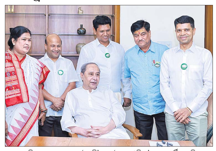
ନବୀନ ନିବାସରେ ଯୋଗଦାନ '୫-ଟି' ଏବଂ 'ନବୀନ ଓଡ଼ିଶା' ଅଧ୍ୟକ୍ଷ କାର୍ତ୍ତିକ ପାଣ୍ଡିଆନ୍ ମୁଖ୍ୟମନ୍ତ୍ରୀ ନବୀନ ପଟ୍ଟନାୟକଙ୍କ ଉପସ୍ଥିତିରେ ବିଜେଡିରେ ଯୋଗଦେବା ଅବସରରେ।

ବିଭିନ୍ନ ମହଲରେ ଦାବି ହୋଇଥିଲା। ଏକ ଉଚ୍ଚସ୍ତରୀୟ ଚିନ୍ତା ଗଠନ କରିବାକୁ ହାଇକୋର୍ଟ ନିର୍ଦ୍ଦେଶ ଦେଇଥିଲେ। ନିର୍ଦ୍ଦେଶର କିଛି ମାସ ପରେ ଗତ ୪ ତାରିଖରେ ଶ୍ରୀମନ୍ଦିର ମୁଖ୍ୟ ପ୍ରଶାସକଙ୍କ ଅଧିକାରୀଙ୍କୁ ଏକ ବୈଠକ ଅନୁଷ୍ଠିତ ହୋଇଥିଲା। ଉକ୍ତ ବୈଠକର ନିଷ୍ପତ୍ତି ଅନୁସାରେ, ନଭେମ୍ବର ୨୮ରେ ବାହାର ରତ୍ନଭଣ୍ଡାରର ଲେଜର ସ୍ଥାନି କରାଯିବାକୁ ନିଷ୍ପତ୍ତି ହେବା ସହ ଏଏସଆଇକୁ ଏନଏସି ପ୍ରଦାନ କରାଯାଇଥିଲା। ଶ୍ରୀମନ୍ଦିର ପ୍ରଶାସନର ନିଷ୍ପତ୍ତି ଅନୁଯାୟୀ ମଙ୍ଗଳବାର ଲେଜର ସ୍ଥାନି କରାଯିବ ବୋଲି ଜଣାପଡ଼ିଛି। ଏନେଇ ଶ୍ରୀମନ୍ଦିର ମୁଖ୍ୟ ପୁଷ୍ପା-୨