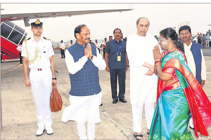
ଭୁବନେଶ୍ୱର ବିମାନବନ୍ଦରରେ ରାଷ୍ଟ୍ରପତି ଦ୍ରୌପଦୀ ମୂର୍ମୂଙ୍କୁ ରାଜ୍ୟପାଳ ରଘୁବର ଦାସ, ପୁଖ୍ୟମନ୍ତ୍ରୀ ନବୀନ ପଟ୍ଟନାୟକ ବିଦାୟ ଦେଉଛନ୍ତି।

କାରକେତ୍ର ରାସ୍ତାର ବୁଲ ପାର୍ଶ୍ୱରେ ସ୍କୁଲ ଛାତ୍ରାଛାତ୍ରୀ ଓ ସାଧାରଣ ଜନତା ଉପସ୍ଥିତ ରହି ତାଙ୍କୁ ସ୍ୱାଗତ କରିଥିଲେ। ରାଷ୍ଟ୍ରପତି ମୂର୍ମୂ ଯିବାବେଳେ ଗାଡ଼ିରୁ ଓହ୍ଲାଇ ରାସ୍ତାରେ ପ୍ରାୟ ୧୦୦ ମିଟର ପର୍ଯ୍ୟନ୍ତ ଚାଲି ଚାଲି ପିଲାଙ୍କ ସହ ମିଶିଥିଲେ। ବୋଇତ ବନ୍ଦାଣ କାର୍ଯ୍ୟକ୍ରମ ପରେ ନେହେରୁ ବଙ୍ଗଳା ଜବାହର ଅତିଥି ଭବନରେ ମଧ୍ୟାହ୍ନ ଭୋଜନ କରିଥିଲେ। ସେଠାରେ କେତେକ ପାରମ୍ପରିକ ମହାଜୀବାଙ୍କ ସହ ଆଲୋଚନା କରିଥିଲେ। ଅପରାହ୍ନ ୪ଟା ବେଳେ ହେଲିକପ୍ଟର ଯୋଗେ ଭୁବନେଶ୍ୱର ବିମାନବନ୍ଦର ଓ ସନ୍ଧ୍ୟାରେ ଦିଲ୍ଲୀ ଫେରିଯାଇଛନ୍ତି।