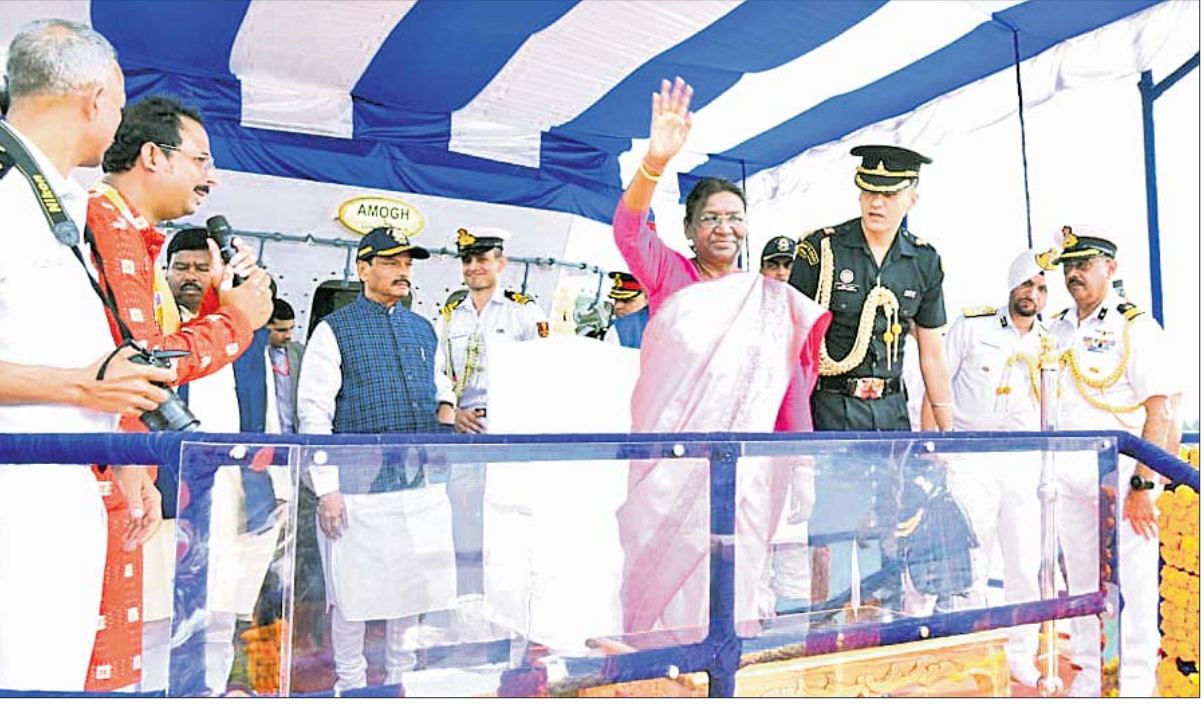
ବନ୍ଦର ଦିବସ, ବୋଇତ ବନ୍ଦାଣ ଉତ୍ସବରେ ରାଷ୍ଟ୍ରପତି ଦ୍ରୌପଦୀ ମୂର୍ମୁ ଓ ରାଜ୍ୟପାଳ ରଘୁବର ଦାସ।

ଭାରତ ଏବେ ବିକାଶ ପଥରେ ଆଗେଇ ଚାଲିଛି। ମହାକାଶକୁ ଯାଇପାରିଛି। ସେହିପରି ସମୁଦ୍ର ଭିତରେ ଥିବା ଜୀବଜଗତ ଓ ଗଭୀରତାକୁ ଆବିଷ୍କାର କରିବା ପାଇଁ ସମୁଦ୍ରମାନ ମିଶନ ଆରମ୍ଭ କରିଛି। ୬ ହଜାର ମିଟର ସମୁଦ୍ର ଗର୍ଭରେ ଏହି ମିଶନ ଆରମ୍ଭ ହୋଇଛି ବୋଲି ଭାରତର ରାଷ୍ଟ୍ରପତି ଦ୍ରୌପଦୀ ମୂର୍ମୁ କହିଛନ୍ତି। ପାରାଦୀପ ବନ୍ଦର ଷ୍ଟେଡିଓରେ ଆୟୋଜିତ ବନ୍ଦର ଦିବସ ଓ ବୋଇତ ବନ୍ଦାଣ ଉତ୍ସବ କାର୍ଯ୍ୟକ୍ରମରେ ପୁଷ୍ପ ଅଭିଭୂତ ଭାବେ ଯୋଗ ଦେଇ ରାଷ୍ଟ୍ରପତି ମୂର୍ମୁ ଏହା କହିଥିଲେ। ସେ ଜୟ ଜଗନ୍ନାଥ କହି ବକ୍ତବ୍ୟ ଆରମ୍ଭ କରିବା ସହ କାର୍ତ୍ତିକ ପୂର୍ଣ୍ଣିମା ଉତ୍ସବ ନୌବାଣିକ୍ୟ ପରମ୍ପରା ଅବସରରେ ଦେଶବାସୀଙ୍କୁ ଶୁଭେଚ୍ଛା ଜଣାଇଥିଲେ। ଏହି ଅବସରରେ ସେ ସାଧବାଣୀ ସାଧବପୁଅ କିପରି ବୋଇତ ଯୋଗେ ସୁଦୂର ବାଲି, ମୁମ୍ବାଡା ଯାତ୍ରା କରି ବେପାର କରୁଥିଲେ ସେ ସମ୍ପର୍କରେ ଆଲୋଚନା କରିଥିଲେ। ପ୍ରତ୍ୟେକ ଓଡ଼ିଆ କାର୍ତ୍ତିକ ପୂର୍ଣ୍ଣିମା ଅବସରରେ ନଦୀ ପୋଖରୀ ସମୁଦ୍ରରେ ପ୍ରତୀକାତ୍ମକ ତଳା ଭସାଇଥାନ୍ତି। ମୂ ମଧ୍ୟ ଅନେକ ଥର ଏପରି ତଳା ଭସାଇଛି। ଓଡ଼ିଶାରେ ବାର ମାସରେ ତେରପର୍ବ ପାଳନ ହୁଏ। ସେଥିରେ କିଛି ଧାର୍ମିକ ଓ କିଛି କୃଷିଭିତ୍ତିକ ପର୍ବ ରହିଛି। କିନ୍ତୁ ଉତ୍କଳୀୟ ନୌବାଣିକ୍ୟ ପରମ୍ପରା ଭିତ୍ତିକ ପର୍ବ ବାଲିଯାତ୍ରା ସମ୍ପୂର୍ଣ୍ଣ ନିଆରା ବୋଲି କହିଥିଲେ। ଓଡ଼ିଆ କବି ଉପେନ୍ଦ୍ର ଭଞ୍ଜଙ୍କଠାରୁ