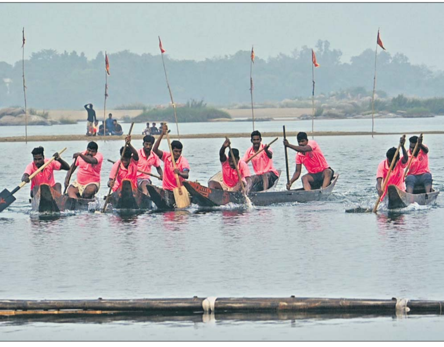
ସୋନପୁର ନିକଟସ୍ଥ ମହାନଦୀର କଳେଷ୍ୱରୀ ଗଣ୍ଡରେ ଆୟୋଜିତ ନୌକାଚଳନା ପ୍ରତିଯୋଗିତା ।

ସୋନପୁର, ୨୭।୧୧ (ମୁଖ୍ୟମନ୍ତ୍ରୀ ଶତପଥୀ) ସ୍ୱଳ୍ପ, ପୁସ୍ତକ ଓ ସବୁଜ ମହାନଦୀ ବାର୍ତ୍ତା ନେଇ ପ୍ରତିବର୍ଷ ଭଳି ଚଳିତ ଥର ସୋନପୁର ସହର ଚେନ୍ନୁଲିକାଟ୍‌ସ୍ଥିତ ଭାଗବତ ପାଠାଗାର ପକ୍ଷରୁ ରାଜ୍ୟସ୍ତରୀୟ ନୌକାଚଳନା ପ୍ରତିଯୋଗିତା ଯୋଜନା କରାଯାଇଥିଲା।