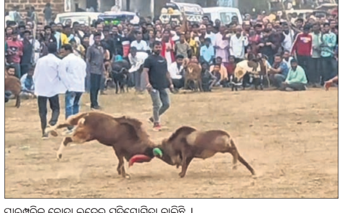
ପାରମ୍ପରିକ ବୋଦା ଲଢ଼େଇ ପ୍ରତିଯୋଗିତା ଚାଲିଛି ।