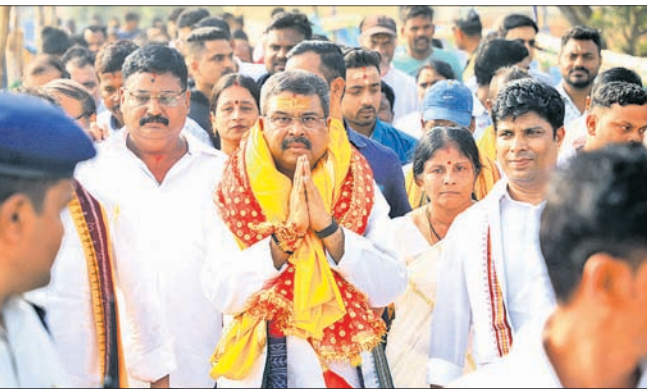
କାର୍ତ୍ତିକ ପୂର୍ଣ୍ଣିମା ଅବସରରେ ଧରଣେଶ୍ୱରକ ଦର୍ଶନ ସାରି ଫେରୁଛନ୍ତି କେନ୍ଦ୍ରମନ୍ତ୍ରୀ ଧର୍ମେନ୍ଦ୍ର ପ୍ରଧାନ।