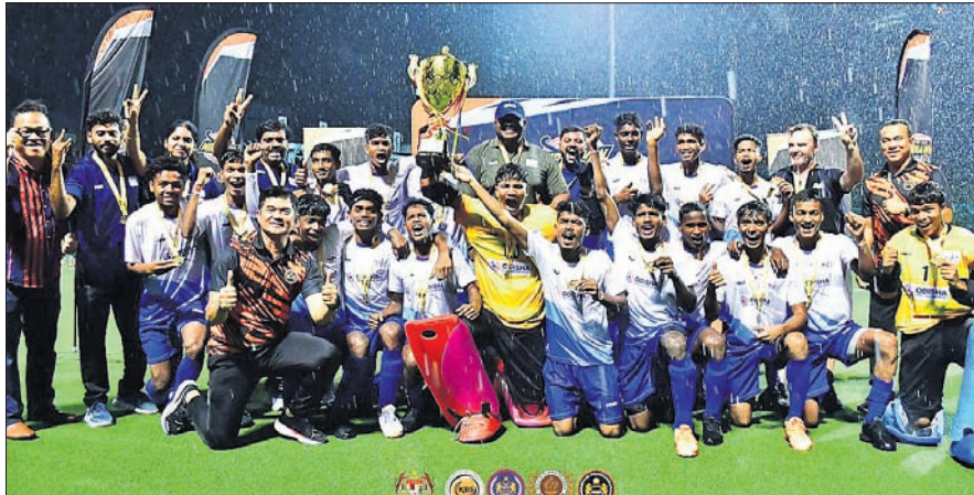
୧୭ ବର୍ଷରୁ କମ୍ ମିନିଓଲ୍ କପ୍ ହକି ଚୁନାମେଣ୍ଟରେ ସ୍ୱର୍ଣ୍ଣପଦକ ବିଜୟୀ ଓଡ଼ିଶା ବାଳକ ଦଳ।

ତେବେ ପଦକ ସହ ପ୍ରତ୍ୟାବର୍ତ୍ତନ ଆମକୁ ଖୁସି ଦେଇଛି ବୋଲି ସେ କହିଛନ୍ତି। ୨୦୨୪ ଖେଳୋ ଇଣ୍ଡିଆ ମୁକ୍ତ ଗେପ୍ ଚେନାଇରେ ହେବ। ତା' ପୂର୍ବରୁ ଏହି ଚୁନାମେଣ୍ଟ ପିଲାମାନଙ୍କୁ ଭଲ ଅଭ୍ୟାସ ଦେଇଛି ବୋଲି ସେ କହିଛନ୍ତି। ମିନିଓଲ୍ କପ୍ ମାଲେସିଆ ନ୍ୟାଶନାଲ ହକି ଚେନାଇମେଣ୍ଟ ପ୍ରୋଗ୍ରାମର ଏକ ଅଂଶବିଶେଷ। ଆମକ୍ରିଡ୍ ଦଳଭାବେ ଓଡ଼ିଶା ଏହି ପ୍ରତିଯୋଗିତାରେ ଅଂଶଗ୍ରହଣ କରିଥିଲା। କୁଆଲାଲମ୍ପୁରରେ କେପିଏମ୍ ଷ୍ଟାଡ଼ିୟମରେ ଚୁନାମେଣ୍ଟ ଗତ ୧୮ରୁ ୨୬ ପର୍ଯ୍ୟନ୍ତ ଅନୁଷ୍ଠିତ ହୋଇଥିଲା। ୫ ଦେଶର ୧୧ ଦଳ ଏଥିରେ ଅଂଶଗ୍ରହଣ କରିଥିଲେ।