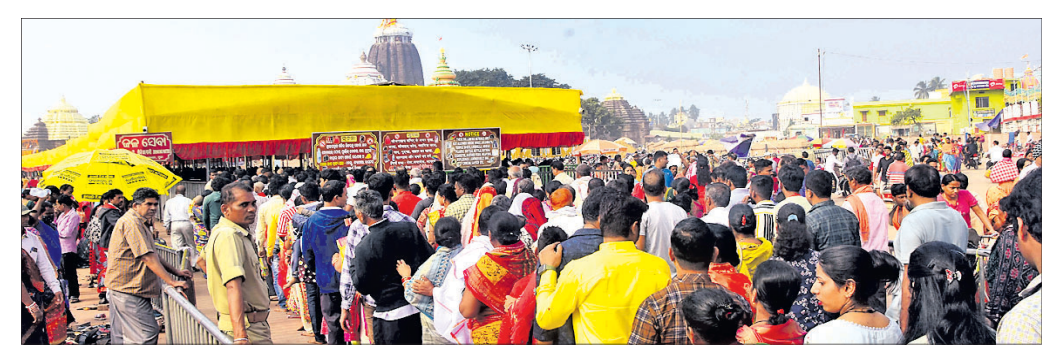
ସୁନା, ୨୭।୧୧ (ଅଜିତ ମହାନ୍ତି)

ପବିତ୍ର କାର୍ତ୍ତିକ ପୂର୍ଣ୍ଣିମାରେ ସୋମବାର ଶ୍ରୀମନ୍ଦିର ରତ୍ନସିଂହାସନରେ ତିନି ଠାକୁରଙ୍କ ରାଜରାଜେଶ୍ୱର ବେଶ ବା ସୁନାବେଶ ଅନୁଷ୍ଠିତ ହୋଇଛି। ମହାପ୍ରଭୁଙ୍କ ସୁନାବେଶ ଦର୍ଶନ କରିବା ପାଇଁ ଭକ୍ତଙ୍କ ପ୍ରବଳ ଗହଳ ଦେଖିବାକୁ ମିଳିଥିଲା। ମଙ୍ଗଳ ଆଳତି, ମଇଲମ, ତଡ଼ପଲାରୀ, ଅବକାଶ ନାଟି ସମ୍ପନ୍ନ ପରେ ପୂଷ୍ପାଳକ ସେବକମାନେ ବିଭିନ୍ନ ରତ୍ନଅଳଙ୍କାର ଓ ପାଦବସ୍ତ୍ରରେ ଶ୍ରୀବିଗ୍ରହମାନଙ୍କୁ ରାଜବେଶରେ ସୁସଜ୍ଜିତ କରିଥିଲେ। ଏହି ବେଶରେ ଠାକୁରମାନେ ଶ୍ରୀକୂଳ, କିରୀଟ, ଶ୍ରୀପଦ୍ମ, ଓଡ଼ିଆଶା, ଚନ୍ଦ୍ରସୂର୍ଯ୍ୟ, କୁଞ୍ଜଳ, ଚିତା, ଚନ୍ଦ୍ରିକା, ଶଙ୍ଖ, ଚକ୍ର, ହଳ, ମୂଷଳ, ତ୍ରିଶାଖା, ଅଳକା, ତଡ଼ପି, ଶ୍ରୀମୁଖ ପଦ୍ମ, ଘାଗଡ଼ା ମାଳି, କଦମ୍ବ ମାଳି, ହରିଡ଼ା କଦମ୍ବ ମାଳି,