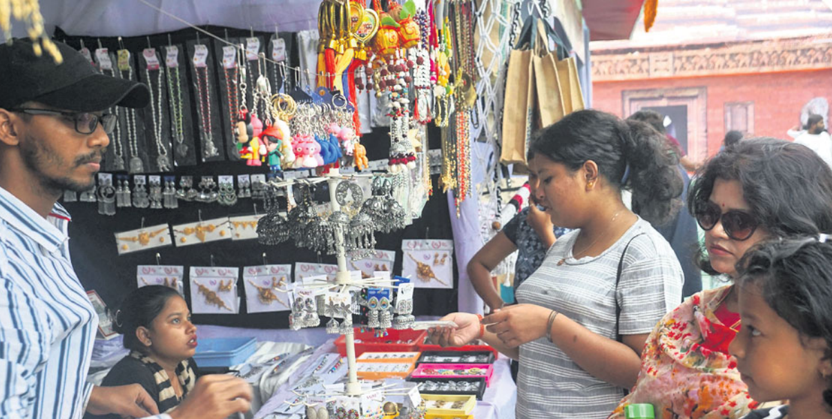
ବାଲିଯାତ୍ରା ଚଳପଡ଼ିଆରେ ଖୋଲିଥିବା ପଲିଗ୍ରୀ ମେଳା ଖୁଲକୁ ମହିଳାମାନେ ବୁଲି ଦେଖୁଛନ୍ତି।