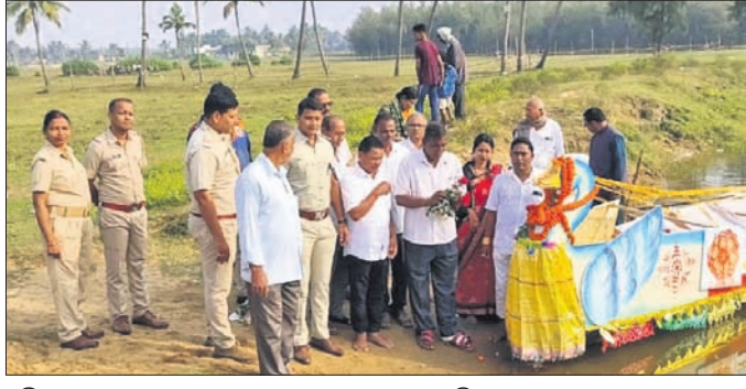
ଅତିଥିମାନେ ବୋଇତ ବନ୍ଦାଣ ଉତ୍ସବର ଶୁଭାରମ୍ଭ କରୁଛନ୍ତି ।