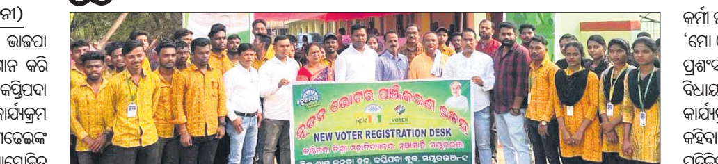
ଅଧାନ କହିପଦା କଲେଜରେ ଛାତ୍ରଛାତ୍ରୀଙ୍କ ନାମ ନୂତନ ଭୋଟର ତାଲିକାରେ ପଞ୍ଜୀକରଣ କରାଯିବା କାର୍ଯ୍ୟକ୍ରମ ଚାଲିଥିଲା।

ମୟୂରଭଞ୍ଜ ଜିଲ୍ଲା ଉଦଳା ନିର୍ବାଚନ ମଣ୍ଡଳୀ ଭାଜପା ବିଧାୟକ ଭାଷ୍ୟ ମଡେଲ ବିଜେଡିର ଗୁଣଗାନ କରି ଚର୍ଚ୍ଚାକୁ ଆସିଛନ୍ତି।