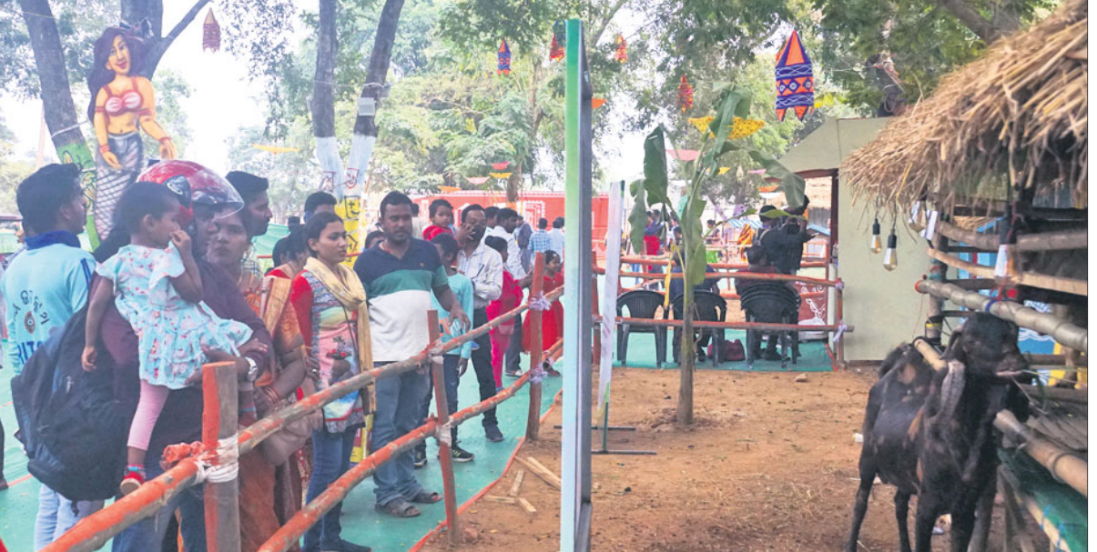
ବାଲିଯାତ୍ରା ଚଳପଡ଼ିଆରେ ଗ୍ରାମୀଣ ପରିବେଶ ମଧ୍ୟରେ ଥିବା ଭଜନ କିସମର ଛେକିକୁ ଲୋକେ ଦେଖୁଛନ୍ତି।