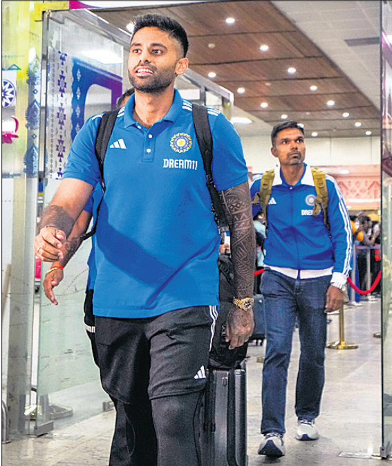
ତୃତୀୟ ୮୨୦ ଖେଳିବା ପାଇଁ ଗୁଆହାଟୀରେ ସୁପରମ୍ୟାଚର ଯାଦବ।

ଅଷ୍ଟ୍ରେଲିଆ ବିପକ୍ଷ ୮୨୦ ସିରିଜ୍ ପ୍ରଥମ ଦୁଇ ମ୍ୟାଚକୁ ଜିତିବା ପରେ ମଙ୍ଗଳବାର ଗୁଆହାଟୀରେ ତୃତୀୟ ମ୍ୟାଚ ଖେଳିବା ଭାରତ। ଏହି ମ୍ୟାଚକୁ ଜିତିବା ସହ ଦୁଇ ମ୍ୟାଚରୁ ଉପରେ କର୍ତ୍ତା କରିବାକୁ ଚାହିଁବ ସୁପରମ୍ୟାଚର ଯାଦବଙ୍କ ଦଳ। ଏହା ସହିତ ଭାରତୀୟ ମଧ୍ୟକ୍ରମ ବ୍ୟାଟର ତିନକ ବର୍ତ୍ତା କିଛି ଭାବିତ ବ୍ୟାଟିଂ ଗାଜ୍‌ମ ପିଠ୍ରେ ଅତିବାହିତ କରିବାକୁ ଚାହିଁବେ। ବିଶ୍ୱ କପ୍ ପରେ ଶ୍ରେୟ ଆୟରକୁ ୧ ସପ୍ତାହର ବିଗ୍ରାମ ଦିଆଯାଇଥିବା ବେଳେ ରାୟଚୁରରେ ଖେଳା ଯିବାକୁ ଥିବା ମ୍ୟାଚରେ ସେ ପ୍ରତ୍ୟାବର୍ତ୍ତନ କରିବେ। ଅନ୍ତିମ ଦୁଇ ମ୍ୟାଚ୍ ପାଇଁ ଆୟରକୁ ଉପ ଅଧିନାୟକ ଚୟନ କରାଯାଇଥିବା ବେଳେ ସେ ତୃତୀୟ ବକାଦଶରେ ସାମିଲ ହେବାର ସମ୍ଭାବନା ଅଧିକ। ତେଣୁ ଆୟର ସାମିଲ ହେଲେ ତିନକ ବର୍ତ୍ତା ହିଁ ଏକମାତ୍ର ଖେଳାଳି ଭାବେ ବାଦ୍ ପଡ଼ିବାର ସମ୍ଭାବନା ରହିଛି। ପ୍ରଥମ ଦୁଇ ମ୍ୟାଚରେ ଭାରତ ଏହାର ବ୍ୟାଟିଂ ପ୍ରଦର୍ଶନ ବଳରେ ବିଜୟୀ ହୋଇଛି। ସମାନ