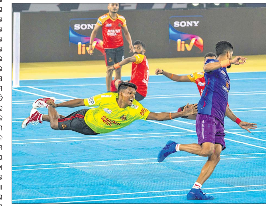
ପୁଣେରେ ଅନୁଷ୍ଠିତ ସିଜନ-୧ ଅବସରରେ ଓଡ଼ିଶା ଜଗରନନ୍ତ୍ର ଓ ଗୁଜରାଟ ଜାଏଣ୍ଟ ମଧ୍ୟରେ ପୁନାବିଳା।

କଟକର ଜବାହରଲାଲ ନେହେରୁ ଇନ୍‌ଡୋର ଷ୍ଟାଡ଼ିୟମରେ ଆୟୋଜନ ହେବ ଓ ଡିସେମ୍ବର ୨୪ରେ ଆରମ୍ଭ, ୨୦୨୪ ଜାନୁୟାରୀ ୧୩ରେ ଶେଷ