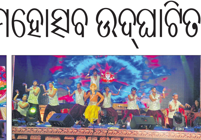
ପ୍ରତି ୩୩ମୁ ପ୍ରତି ପକ୍ଷରୁ ସାମ୍ବନ୍ଧିକ କାର୍ଯ୍ୟକ୍ରମ ପରିବେଷଣ କରାଯାଇଛି ।

ବ୍ୟବସ୍ଥାକୁ ପ୍ରତିଦିନ ବନ୍ଦାଣ ରଖିବା ଲାଗି ଅନେକ ଭକ୍ତଙ୍କୁ ଫିଡ଼ିବାକୁ ଆସିଥିବା ପୋଲିସ ପ୍ରଶାସନ ପକ୍ଷରୁ ସୂଚନା ଦିଆଯାଇଛି । ସେହିପରି ପୋଲିସ ଓ ମୁଗ୍‌ଶାହି ୨୪ ଘଣ୍ଟା ପ୍ରତିଦିନ ଦୈନିକ ନାଗରିକଙ୍କୁ ରକ୍ଷଣାବେତ୍ତ କରିବା ଲାଗି ମହାପ୍ରଭୁଙ୍କ ଦର୍ଶନ କରାଯାଇ ପୁଣି ତାଙ୍କୁ ସୁରକ୍ଷିତ ଭାବେ ଛାଡ଼ିଥିଲେ । ଶୁକ୍ଳାନିତ ଭାବେ ଦର୍ଶନ ନିମନ୍ତେ ପୋଲିସ ପ୍ରଶାସନ ପକ୍ଷରୁ ସେବାୟତ, ଜିଲ୍ଲା ପ୍ରଶାସନ, ମନ୍ଦିର ପ୍ରଶାସନ, ଲାଳନ ବିଭାଗ, ପୁରୀବାସୀ ଏବଂ ଜଗନ୍ନାଥପ୍ରେମୀଙ୍କୁ ଧନ୍ୟବାଦ ଜଣାଇ ଦିଆଯାଇଛି ।