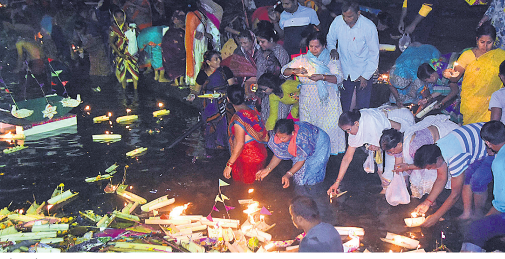
କାର୍ତ୍ତକ ପୂର୍ଣ୍ଣମାରେ ଯୋଗ୍ୟତା ହରିଷିଆଳିମାନେ ପୁରୀ ସମୁଦ୍ରରେ ତଜା ଭସାଇଛନ୍ତି ।

ସକାଳୁ ଭଞ୍ଜ ନରେନ୍ଦ୍ର ପୁଷ୍କରିଣୀରେ ଗାଧୋଇ ତର୍କା ପୂଜା କରୁଥିଲେ । ପ୍ରଶାନ୍ତ ପକ୍ଷରୁ କରାଯାଇଥିବା ଗାଡ଼ିରେ ଶ୍ରୀମନ୍ଦିର ଯାଇ ମହାପ୍ରଭୁଙ୍କ ଦର୍ଶନ କରି ମହାପ୍ରସାଦ ସେବନ କରୁଥିଲେ । କାର୍ତ୍ତକ ଆଦି କାର୍ତ୍ତକ ବ୍ରତ ପାଳନ କରିଥିଲେ । ରାଜ୍ୟ ସରକାର କରିଥିବା ଶିବିରରେ ରାଜ୍ୟର ବିଭିନ୍ନ ସ୍ଥାନରୁ ହରିଷିଆଳିମାନେ ଆସି ରହି ହରିଷି କରିଥିଲେ । ବ୍ରତରେ ଶେଷ ଦିନରେ ଶିବରତ୍ନିକରେ ଭାବ ବିହ୍ୱଳ ପରିବେଶ ଦେଖିବାକୁ ମିଳିଥିଲା । ଦୀର୍ଘ ଏକମାସ ଧରି ଏକାଠି ରହି ଆସୁଥିବା ହରିଷିଆଳିଙ୍କ ମଧ୍ୟରେ ଏକ ସମ୍ପର୍କ ସୃଷ୍ଟି ଗଢ଼ିଉଠିଥିଲା । ଫଳରେ ପରସ୍ପରଠାରୁ ବିଦାୟ ନେବା ସମୟରେ ସମସ୍ତଙ୍କୁ ଆଖିରେ ଲୁହ ସଖାରେ ମିଳିଥିଲା । ବହୁଥିଲେ ପୁଣି ଆରବର୍ଷକୁ ଦେଖା ହେବାର ଆଶା ନେଇ ହରିଷିଆଳିମାନେ ବିଦାୟ ନେଇଥିଲେ । ଜଣେ ହରିଷିଆଳି କହିଛନ୍ତି, ଦୀର୍ଘ ଏକମାସ ଧରି ଏକାଠି ହୋଇ ରହିଥିଲୁ । ପ୍ରଶାନ୍ତ ପକ୍ଷରୁ କରାଯାଇଥିବା ଗାଡ଼ିରେ ଶ୍ରୀମନ୍ଦିର ଯାଇ ମହାପ୍ରଭୁଙ୍କ ଦର୍ଶନ କରି ମହାପ୍ରସାଦ ସେବନ କରୁଥିଲୁ । କାର୍ତ୍ତକ ଆଦି କାର୍ତ୍ତକ ବ୍ରତ ପାଳନ କରିଥିଲୁ । ରାଜ୍ୟ ସରକାର କରିଥିବା ଶିବିରରେ ରାଜ୍ୟର ବିଭିନ୍ନ ସ୍ଥାନରୁ ହରିଷିଆଳିମାନେ ଆସି ରହି ହରିଷି କରିଥିଲେ । ବ୍ରତରେ ଶେଷ ଦିନରେ ଶିବରତ୍ନିକରେ ଭାବ ବିହ୍ୱଳ ପରିବେଶ ଦେଖିବାକୁ ମିଳିଥିଲା । ଦୀର୍ଘ ଏକମାସ ଧରି ଏକାଠି ରହି ଆସୁଥିବା ହରିଷିଆଳିଙ୍କ ମଧ୍ୟରେ ଏକ ସମ୍ପର୍କ ସୃଷ୍ଟି ଗଢ଼ିଉଠିଥିଲା । ଫଳରେ ପରସ୍ପରଠାରୁ ବିଦାୟ ନେବା ସମୟରେ ସମସ୍ତଙ୍କୁ ଆଖିରେ ଲୁହ ସଖାରେ ମିଳିଥିଲା । ବହୁଥିଲେ ପୁଣି ଆରବର୍ଷକୁ ଦେଖା ହେବାର ଆଶା ନେଇ ହରିଷିଆଳିମାନେ ବିଦାୟ ନେଇଥିଲେ । ଜଣେ ହରିଷିଆଳି କହିଛନ୍ତି, ଦୀର୍ଘ ଏକମାସ ଧରି ଏକାଠି ହୋଇ ରହିଥିଲୁ ।