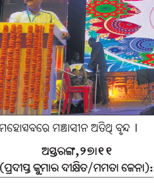
ମହୋତ୍ସବରେ ମହାସାଧନ ଅତିଥି ବୃନ୍ଦ ।

ଅସ୍ତରଙ୍ଗ, ୨୭।୧୧ (ପ୍ରମୋଦ କୁମାର ବାରିକ/ମମତା ଜେନା) :