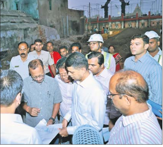
୫-ଟି ଓ ନବୀନ ଓଡ଼ିଶା ଅଧ୍ୟକ୍ଷ ଭି.କେ. ପାଣିଆନ୍ ସୋମବାର ସକାଳେ ପୁରୀ ଶ୍ରୀମନ୍ଦିର ପରିକ୍ରମା ପ୍ରକଳ୍ପ ସମାକ୍ଷା କରୁଛନ୍ତି (ବାମ)। ଗଞ୍ଜାମ ତାରାତାରିଣୀ ମନ୍ଦିରରେ ପାଣିଆନ୍ଙ୍କ ପୂଜାର୍ଚ୍ଚନା।

ପାଣିଆନ୍ଙ୍କ ରୁଚ୍ଛୁବର୍ତ୍ତୀ ଭୂମିକା ରହିଛି। ଜିଲ୍ଲାସ୍ତରରେ ଲୋକମାନଙ୍କର ଅଭିଯୋଗ ଶୁଣାଣି କରି, ସେମାନଙ୍କ ଦୁଆରକୁ ଯାଇ ସେମାନଙ୍କର ଅଭିଯୋଗ ସଂଗ୍ରହ କରିବା ଓ ଗହୀର ସମାଧାନ କ୍ଷେତ୍ରରେ ପାଣିଆନ୍ଙ୍କର ଉଦ୍ୟମ ସରକାରଙ୍କର ଜନସାଧାରଣଙ୍କ ପ୍ରତି ଥିବା ପ୍ରତିବନ୍ଧକକୁ ଦର୍ଶାଇଛି। ରାଜ୍ୟକୁ ଅନ୍ତର୍ଜାତୀୟ ସ୍ତରରେ ଏକ କ୍ରୀଡ଼ା ହବ୍ରେ ପରିଣତ କରିବା କ୍ଷେତ୍ରରେ ପାଣିଆନ୍ଙ୍କର ଅତୁଳନୀୟ ଭୂମିକା ରହିଛି। ବିଜେଡିରେ କାର୍ତ୍ତିକ ପାଣିଆନ୍ଙ୍କ ଯୋଗଦାନ ପରେ ସୋସିଆଲ୍ ମିଡ଼ିଆରେ