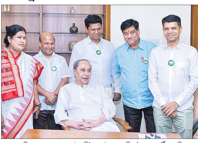
ନବୀନ ନିବାସରେ ଯୋଗଦାନ '୫-ଟି' ଏବଂ 'ନବୀନ ଓଡ଼ିଶା' ଅଧକ୍ଷ କାର୍ତ୍ତିକ ପାଣ୍ଡିଆନ୍ ମୁଖ୍ୟମନ୍ତ୍ରୀ ନବୀନ ପଟ୍ଟନାୟକଙ୍କ ଉପସ୍ଥିତିରେ ବିଜେଡିରେ ଯୋଗଦେବା ଅବସରରେ।

ବିଭିନ୍ନ ମହଲରେ ଦାବି ହୋଇଥିଲା। ଏକ ଉଚ୍ଚପ୍ରୋଫାଇଲ୍ ଚିନ୍ତା ଗଠନ କରିବାକୁ ହାଇକୋର୍ଟ ନିର୍ଦ୍ଦେଶ ଦେଇଥିଲେ। ନିର୍ଦ୍ଦେଶର କିଛି ମାସ ପରେ ଗତ ୪ ତାରିଖରେ ଶ୍ରୀମନ୍ଦିର ମୁଖ୍ୟ ପ୍ରଶାସକଙ୍କ ଅଧିକାରୀଙ୍କୁ ଏକ ବୈଠକ ଅନୁଷ୍ଠିତ ହୋଇଥିଲା। ଉକ୍ତ ବୈଠକର ନିଷ୍ପତ୍ତି ଅନୁସାରେ, ନଭେମ୍ବର ୨୮ରେ ବାହାର ରତ୍ନଭଣ୍ଡାରର ଲେଜର ସ୍ଥାନି କରାଯିବାକୁ ନିଷ୍ପତ୍ତି ହେବା ସହ ଏଏସଆଇକୁ ଏନ୍ୱେସି ପ୍ରଦାନ କରାଯାଇଥିଲା। ଶ୍ରୀମନ୍ଦିର ପ୍ରଶାସନର ନିଷ୍ପତ୍ତି ଅନୁଯାୟୀ ମଙ୍ଗଳବାର ଲେଜର ସ୍ଥାନି କରାଯିବ ବୋଲି ଜଣାପଡ଼ିଛି। ଏନେଇ ଶ୍ରୀମନ୍ଦିର ମୁଖ୍ୟ ପୁଷ୍ପା-୨