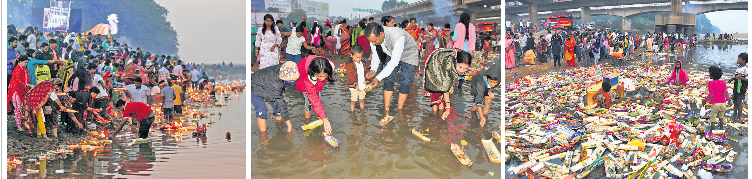
କାର୍ତ୍ତିକ ପୂର୍ଣ୍ଣିମା ସୋମବାର ସକାଳେ ଦୟାନଦୀ ଓ କୁଆଖାଇ ନଦୀରେ ଲୋକମାନେ ତିଆରି ଭାସାଇବାକୁ ଭିଡ଼ ଲାଗାଇଛନ୍ତି । କୁଆଖାଇ ନଦୀରେ ଲୋକେ ଭାସାଉଥିବା ତିଆରି ପିଲାମାନେ ପାଣିରେ ପଶି ଟକା ସଂଗ୍ରହ କରୁଛନ୍ତି ।