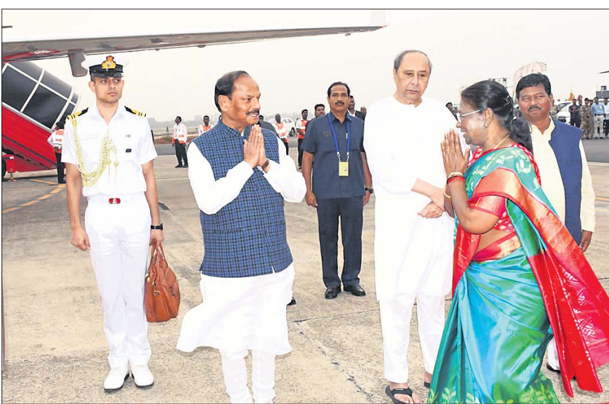
ଭୁବନେଶ୍ୱର ବିମାନବନ୍ଦରରେ ରାଷ୍ଟ୍ରପତି ଦ୍ରୌପଦୀ ମୂର୍ମୁଙ୍କୁ ରାଜ୍ୟପାଳ ରଘୁବର ଦାସ, ପୁଷ୍ପମନ୍ତ୍ରୀ ନବୀନ ପଟ୍ଟନାୟକ ବିଦାୟ ଦେଉଛନ୍ତି।

କାରକେତ୍ର ରାସ୍ତାର ବୁଲ ପାର୍ଶ୍ୱରେ ସ୍କୁଲ ଛାତ୍ରାଛାତ୍ରୀ ଓ ସାଧାରଣ ଜନତା ଉପସ୍ଥିତ ରହି ତାଙ୍କୁ ସ୍ୱାଗତ କରିଥିଲେ। ରାଷ୍ଟ୍ରପତି ମୂର୍ମୁ ଯିବାବେଳେ ଗାଡ଼ିରୁ ଓହ୍ଲାଇ ରାସ୍ତାରେ ପ୍ରାୟ ୧୦୦ ମିଟର ପର୍ଯ୍ୟନ୍ତ ଚାଲି ଚାଲି ପିଲାଙ୍କ ସହ ମିଶିଥିଲେ। ବୋଇତ ବନ୍ଦାଣ କାର୍ଯ୍ୟକ୍ରମ ପରେ ନେହେରୁ ବଙ୍ଗଳା ଜବାହର ଅଭିଭୂତ ଭବନରେ ମଧ୍ୟାହ୍ନ ଭୋଜନ କରିଥିଲେ। ସେଠାରେ କେତେକ ପାରମ୍ପରିକ ମହାଜୀବାଙ୍କ ସହ ଆଲୋଚନା କରିଥିଲେ। ଅପରାହ୍ନ ୪ଟା ବେଳେ ହେଲିକପ୍ଟର ଯୋଗେ ଭୁବନେଶ୍ୱର ବିମାନବନ୍ଦର ଓ ସନ୍ଧ୍ୟାରେ ଦିଲ୍ଲୀ ଫେରିଯାଇଛନ୍ତି।