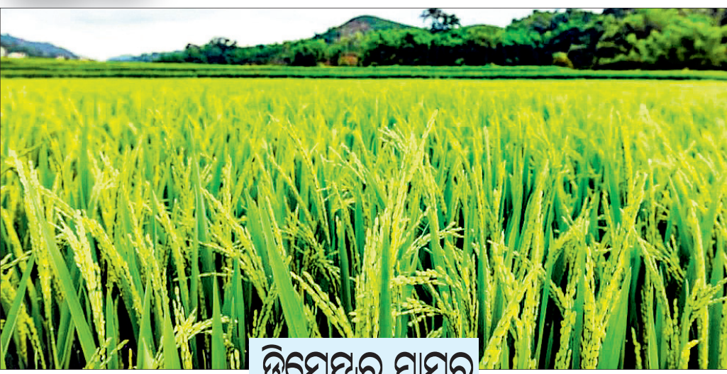
ଡିସେମ୍ବର ମାସର କୃଷି ସୂଚନା

ଡାଳୁଆ ଧାନ ବିହନକୁ ୨୪ ଘଣ୍ଟା ପାଣିରେ ଭିଜାଇ, ଗଣାକରି ଗାଲି ଫିଟିବା ପରେ କାହୁଆ ଡଳିପତ୍ତରେ ବୁଣାନ୍ତୁ । ତଳପଟିର ଓସାର ୩-୪ ଫୁଟ ରଖନ୍ତୁ । ପ୍ରତି ପଟି ପରେ ୧୫ଟି ଡାଳି ରଖନ୍ତୁ । ତଳଘରା ପାଇଁ ୧୦ ଡେସିମିଲି ଡଳିପତ୍ତରେ ୪୦ ଝୁଡ଼ି ଶକ୍ତା ଗୋବରଖତ, ୧୨ କି.ଗ୍ରା. ସିଲିକା ସୁପର ଫସ୍ଫେଟ୍ ଓ ୨ କି.ଗ୍ରା. ପ୍ୟୁରେଟ ଅର୍ଥ ପତ୍ରାସ ସାର ଶେଷତୁ ଚାଷ ସମୟରେ ମାଟିରେ ମିଶାଇ ଦିଅନ୍ତୁ । ବିହନକୁ କଣ୍ଠା ଓ ଅଗାଡ଼ି ବାହାରକରିବା ପାଇଁ ଲୁଗାପାଣି ଉପଚାର କରନ୍ତୁ । ଡାଳୁଆ ଧାନର ସହକ କିସମ ମଧ୍ୟରେ ରହିଛି ପାରିଜାତ, ଖଣ୍ଡଗିରି, ଯୋଗେଶ, ସିଦ୍ଧାନ୍ତ, ମହାକିନୀ, ପଥରା, କୋର୍ପାୟା । ମଧ୍ୟମ କିସମଗୁଡ଼ିକ ହେଲେ ଲଲଗା, ଡପ୍ଫିନୀ, ଡେକ୍ଫିନୀ, ମନସିନୀ, ନବୀନ, ଏସ୍.ସି.୧୦୦୧ । ଏହି ମାସ ଶେଷପୂର୍ବୀ ଡାଳୁଆ ଧାନ ପାଇଁ ଡଳି ପକାଇବା କାମ ଶେଷ କରନ୍ତୁ ।