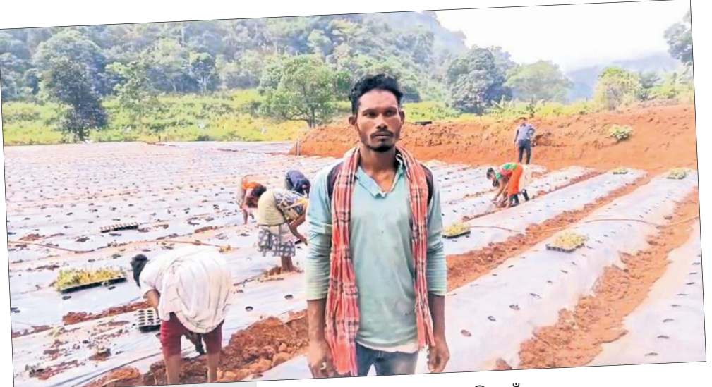
■ ପ୍ରଥମ ଥର ପାଇଁ ଚାଷ କରିଛନ୍ତି ତରଫରୁ ଆମ୍ବ କୃଷି ଉନ୍ନୟନ ସଂସ୍ଥା

୨୦ ହକାର ସୁବେରି ଗଛ ଲଗାଇଛନ୍ତି। ଗଛ ଲାଗିବାର ପ୍ରାୟ ୪୫ ଦିନ ପରେ ଫଳ ହେବ। ୨ ମାସ ପର୍ଯ୍ୟନ୍ତ ଫଳ ଫଳିବ। ଆନୁମାନିକ ୬୦ କୁଇଣ୍ଟାଲ ଉତ୍ପାଦନ ହେବ ବୋଲି ଚାଷୀ ଲାଗୁରୁ ଆଶା ରଖିଛନ୍ତି। ଯାହାର ମୂଲ୍ୟ ବଜାର ଦରରେ ଅତିକମରେ ୧୦ରୁ ୧୨ ଲକ୍ଷ ଟଙ୍କା ହେବ ବୋଲି ଜଣାପଡିଛି। ୧ ଏକର ପଛା ଚାମା, ସାର, ବୁଦା ଜଳସେଚନ, ଶ୍ରମ ବାବଦକୁ ସବୁ ମିଶି ଅତି ବେଶାରେ ୫ ଲକ୍ଷ ଟଙ୍କା ଖର୍ଚ୍ଚ ହୋଇଛି। ସୁବେରି ଚାଷ ପାଇଁ ଓପିଲିପି ଏବଂ ଚାରିକଣା କୃଷି ଉନ୍ନୟନ ସଂସ୍ଥା ପକ୍ଷରୁ ସହାୟତା ଯୋଗାଇ ଦେଇଥିବା ଚାଷୀ ଲାଗୁରୁ ଯାକେଶିକା କହିଛନ୍ତି। ଏହି ଚାଷ ଫଳପ୍ରଦ ହେଲେ ଆଗରୁ ସେ ଆହୁରି ଅଧିକ ଜମିରେ ସୁବେରି ଚାଷ କରିବେ ବୋଲି କହିଛନ୍ତି।