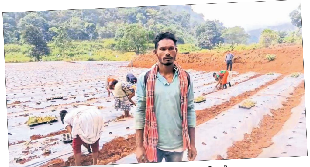
ରାୟଗଡ଼ାର ଥଣ୍ଡା ଜଳବାୟୁ ସୁବେରୀ ପାଇଁ ବେଶ୍ ଉପଯୋଗୀ। ପରାମ୍ପରାଗୁଳକ ଭାବେ ଜଣେ ତଳଗିଆଙ୍କୁ ନେଇ ଏହି ଚାଷ କରାଯାଉଛି। ଏହା ଫଳପ୍ରଦ ହେଲେ ଆହୁରି ଅଧିକ ତଳଗିଆଙ୍କୁ ଏଥିରେ ସାମିଲ କରାଯିବାର ଲକ୍ଷ୍ୟ ଥିବା ଓପିଲିପି ତଥା କନ୍ଧ ଭଲଭଲ ସଂସ୍ଥାର ପ୍ରକଳ୍ପ ପରିଚାଳକ ସୁବର୍ଣ୍ଣନ ପାଢ଼ୀ । ଏହା ସହ ତ୍ରିପ ସିଷ୍ଟମ ପାଇଁ ଉଦ୍ୟାନ ବିଭାଗର ସହଯୋଗ ରହିଥିବା ସେ କହିଛନ୍ତି। - ରିପୋର୍ଟ: ଭାଗ୍ୟଶ୍ରୀ ମିଶ୍ର, ରାୟଗଡ଼ା