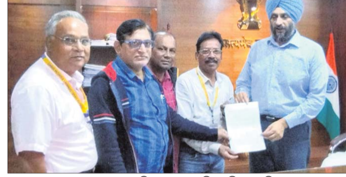
ଫୋରମ ପକ୍ଷରୁ ଡିଆରଏମ୍ ଧାର୍ଯ୍ୟ ଦିଆଯାଇଛି।