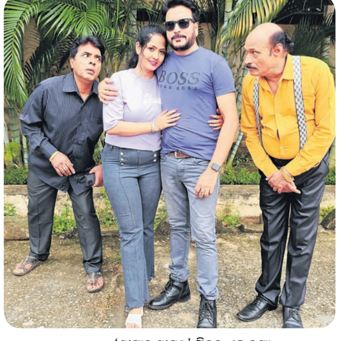
‘ଶ୍ରୀମାନ୍ ଶ୍ରୀଯୁକ୍ତ’ ଫିଲ୍ମର ଏକ ଦୃଶ୍ୟ