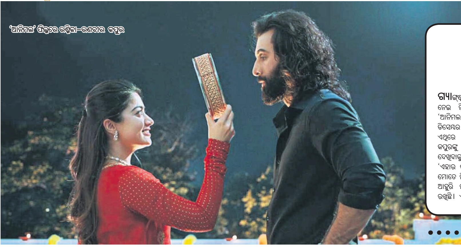
‘ଅନିମାଲ’ ଫିଲ୍ମରେ ରଶ୍ମିକା-ରଶ୍ମୀର କପୁର