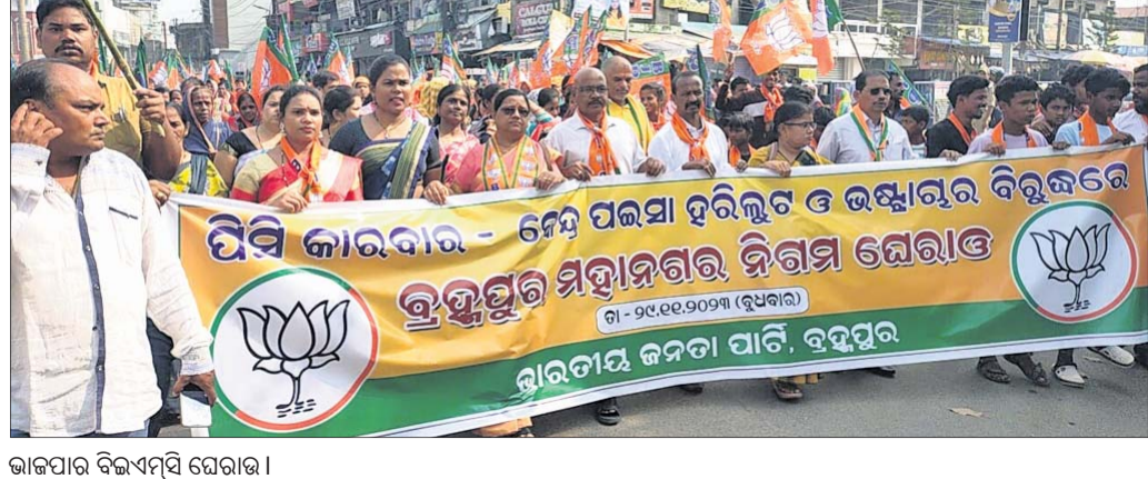
ଭାରତୀୟ ବିଲଏମ୍ସି ଘେରାଉ।