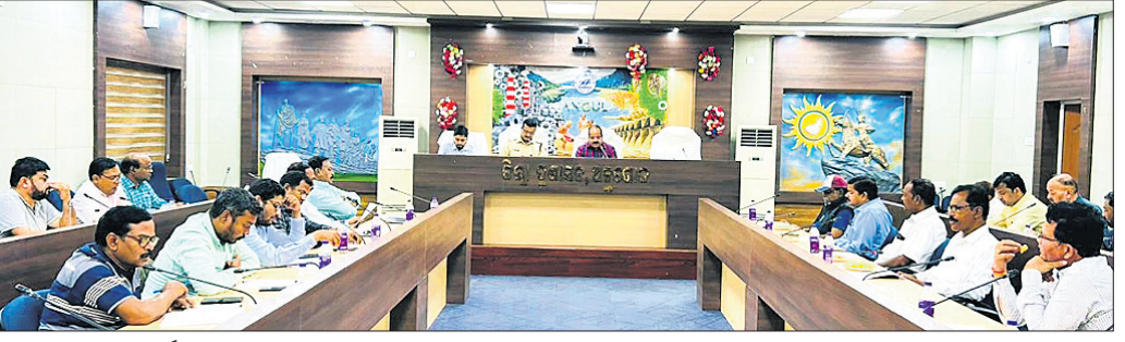
ଅନୁଗୋଳ ଲିମ୍ବା କାର୍ଯ୍ୟାଳୟ ସମ୍ମିଳନୀ କକ୍ଷରେ ଲିମ୍ବା ସଡ଼କ ସୁରକ୍ଷା କମିଟି ବୈଠକରେ ଉପସ୍ଥିତ ଅଧିକାରୀମାନେ।