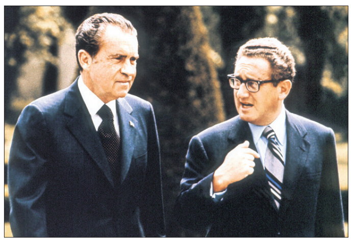
ଆମେରିକାର ପୂର୍ବତନ ରାଷ୍ଟ୍ରପତି ରିଚାର୍ଡ ନିକ୍ସନ୍‌ଙ୍କ ସହ ପୂର୍ବତନ ପରରାଷ୍ଟ୍ର ସଚିବ ହେନ୍ରି କିସିଙ୍ଗର (ଡାହାଣ)।

ଓଶିଂଟନ, ୩୦ ଡିସେମ୍ବର ଆମେରିକାର ପୂର୍ବତନ ପରରାଷ୍ଟ୍ର ସଚିବ ତଥା ବରିଷ୍ଠ କୂଟନୀତିଜ୍ଞ ହେନ୍ରି କିସିଙ୍ଗରଙ୍କର ରୁଧିରାଘାତ ପରଲୋକ ହୋଇଯାଇଛି। ତାଙ୍କୁ ୧୦୦ ବର୍ଷ ହୋଇଥିଲା। ୧୯୭୦ ଦଶକରେ ଭାରତର ନେତୃତ୍ୱ ସେ ତିରଞ୍ଚାର କରିଥିଲେ। ଏପରିକି ତତ୍କାଳୀନ ପ୍ରଧାନମନ୍ତ୍ରୀ ଇନ୍ଦିରା ଗାନ୍ଧୀଙ୍କ ପ୍ରତି ସେ କାଟିଆଣା ଏବଂ ଘୃଣ୍ୟ ଶବ୍ଦ ବ୍ୟବହାର କରିଥିଲେ। ୧୯୭୪ ଅକ୍ଟୋବର ଏବଂ ୨୦୧୨ ମାର୍ଚ୍ଚରେ ଭାରତ ଗସ୍ତରେ ଆସିଥିବା କିସିଙ୍ଗରଙ୍କୁ ଅନେକେ ରାଷ୍ଟ୍ରନେତା ବିବେଚନା କରିଥାନ୍ତି। ଭାରତ-ଆମେରିକା ସମ୍ପର୍କକୁ ମଜବୁତ କରାଇବାରେ ସେ ପ୍ରତିଷ୍ଠିତବଦ୍ଧ ଥିଲେ। ରାଷ୍ଟ୍ରପତି ରିଚାର୍ଡ ନିକ୍ସନ୍ ଏବଂ ରେଭାଲୁ ଫୋର୍ଟଙ୍କ ସମୟରେ କିସିଙ୍ଗର ପରରାଷ୍ଟ୍ର ସଚିବ ଏବଂ ଜାତୀୟ ସୁରକ୍ଷା ପରାମର୍ଶଦାତା ଭାବେ କାର୍ଯ୍ୟ କରିଥିଲେ। ସେ ବୈଶ୍ୱିକ ବ୍ୟାପାରକୁ ଅସାଧାରଣ ଭାବେ ପ୍ରଭାବିତ କରିଥିଲେ। ୧୯୭୩ରେ ତାଙ୍କୁ ନୋବେଲ ଶାନ୍ତି ପୁରସ୍କାର ମିଳିଥିଲା। ତାଙ୍କର ଦୀର୍ଘବୟସ ବିଦେଶ ନୀତି ଉପରେ ଏବେ ମଧ୍ୟ ଭାବପୂର୍ଣ୍ଣ ବିତର୍କ ହୋଇଥାଏ। ଇନ୍ଦୁୟା ଶରଣାଥୀ କିସିଙ୍ଗର ୧୯୩୮ରେ ତାଙ୍କ ପରିବାର ସହ ନାଜି ଜର୍ମାନୀରୁ ପଳାଇଆସିଥିଲେ। ଫ୍ରେଞ୍ଚିସ୍କା-୧୧