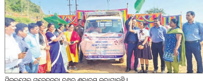
ସିକଲସେଲ୍ ସଚେତନତା ରଥର ଶୁଭାରମ୍ଭ କରାଯାଇଛି ।

ରହିଛି । ରାସ୍ତା ମରାମତି ପାଇଁ ରାୟଗଡ଼ା ଜନସାଧାରଣଙ୍କଠାରୁ ଆରମ୍ଭକରି ପ୍ରମୁଖ ରାଜନୈତିକ ଦଳରେ ନେତା, ମନ୍ତ୍ରୀ ଏବଂ ଖୋଦ୍ ଜିଲାପାଳ ମଧ୍ୟ ଜାତୀୟ ରାଜପଥ ବିଭାଗକୁ ଅବଗତ କରିଥିଲେ ମଧ୍ୟ କୌଣସି ପଦକ୍ଷେପ ନିଆଯାଇ ନ ଥିବା ଅଭିଯୋଗ ହୋଇଛି । ରାସ୍ତା ମରାମତି ସମ୍ପର୍କରେ ପଚାରିଲେ ରାସ୍ତା କାମ ପାଇଁ ଟେଣ୍ଡର ହୋଇଛି, ଖୁବ୍ ଶୀଘ୍ର ରାସ୍ତା କାମ ଆରମ୍ଭ ହେବ ବୋଲି ଶୁଣିବାକୁ ମିଳିଛି । ହେଲେ କାମ ପାଇଁ ସବୁ ନାକେଦମ୍ ହେବାକୁ ପଡୁଥିବା ପାଇଁ ଅଧିକାରୀ କହିଛନ୍ତି । ପ୍ରକାଶ ଅଭାବ, ରାୟଗଡ଼ା ସହର ସମେତ କୋଲକତା, କେକେପୁର ଓ କଟାପେଟା ସମସ୍ତ ସ୍ଥାନରେ ରାସ୍ତା ସମ୍ପୂର୍ଣ୍ଣ ଶୋଚନୀୟ ହୋଇପଡ଼ିଛି । ପ୍ରତିଦିନ ବ୍ୟବଧାନରେ ଶତାଧିକ ଗର୍ଭ