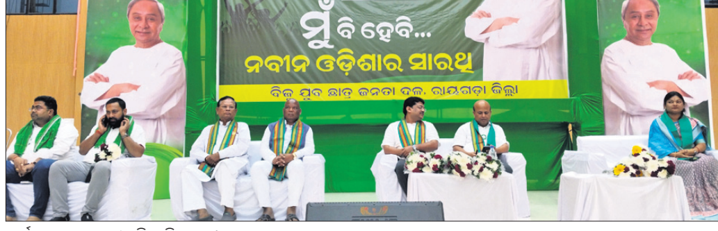
କାର୍ଯ୍ୟକ୍ରମରେ ମଞ୍ଚାସୀନ ବିଜେଡି ନେତା ।