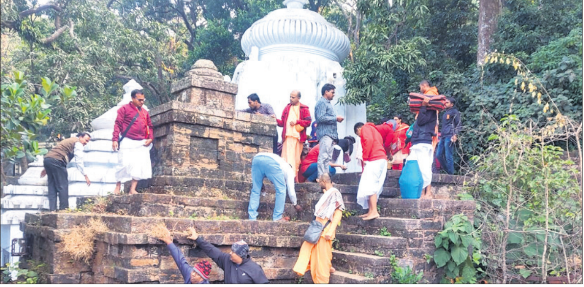
କପିଳାସ ପୀଠ ପରିସରରେ ଥିବା ଭାଗବତ ଚିକାକାର ଶ୍ରୀଧର ସ୍ୱାମୀଙ୍କ ସମାଧି ସ୍ଥଳ ।

ପରିତ୍ୟକ୍ତ ଅବସ୍ଥାରେ ଭାଗବତ ଚିକାକାର ଶ୍ରୀଧର ସ୍ୱାମୀଙ୍କ ସମାଧି