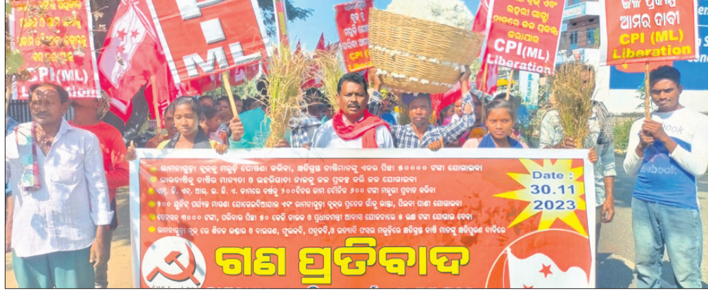
ରାମନାଗୁଡ଼ା ତହସିଲ ଅର୍ପିତ୍ ସମ୍ମୁଖରେ ବିକ୍ଷୋଭ ପ୍ରଦର୍ଶନ କରାଯାଇଛି ।

ପ୍ରତ୍ୟାହାର ପାଇଁ ଦାବି କରାଯାଇଥିଲା । ସେହିପରି କେନ୍ଦ୍ର ସରକାରଙ୍କ ଦ୍ୱାରା ଜଙ୍ଗଲ ଅଧିକାର ଆଇନ ୨୦୦୬ ଓ ଗ୍ରାମସଭାକୁ ଅଧିକାରୀ କରିଦେଇଥିବା ଟକ୍ସାକ୍ତ ବନ୍ଦ କରିବା, ଆଦିବାସୀଙ୍କ ଭୋଗ ଦଖଲରେ ରହିଥିବା ସରକାରୀ କର୍ମ, ଜଙ୍ଗଲ କମିଟି ଟିକ୍ସ କରିବା ପାଇଁ ଆର.ଆଇ. ଓ ଅଧିନୀୟ ମାସିକ ୧୫ ଦିନ ପାଇଁ ନିର୍ଦ୍ଦେଶ ଦେବା, ଶୀତଳ ଭଣ୍ଡାର ଓ ଡ୍ରେପାଗୁଡ଼ା ତ୍ୟାମରୁ ଗଞ୍ଜା ଉତ୍ପାଦନ ଯୋଗାଇବା ଓ ଗୁଳୁକ୍ଷି ପଞ୍ଚାୟତରେ ନାମରେ ହୋଇଥିବା ମିଥ୍ୟା କେ୍