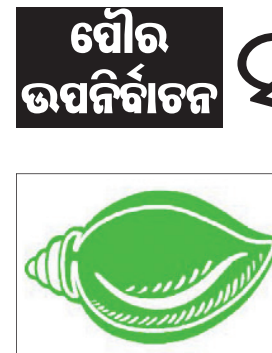
ପୁରୀ ଜିଲ୍ଲା ବିଜୁ ମୁବ ଜନତା ଦଳ କମିଟି ଗଠିତ ହୋଇଛି ।

ପୁରୀ ଜିଲ୍ଲା ବିଜୁ ମୁବ ଜନତା ଦଳ କମିଟି ଗଠିତ ହୋଇଛି । ପୁରୀ ଜିଲ୍ଲା ବିଜୁ ମୁବ ଜନତା ଦଳ କମିଟି ଗଠନ କରାଯାଇଛି । ଏହି କମିଟିରେ ୬ ଉପସଭାପତି, ୬ ସାଧାରଣ ସମ୍ପାଦକ, ୨୦ ସମ୍ପାଦକ, ଜଣେ ଜିଲ୍ଲା ଆଇଡି ସଂଯୋଜକ, ୬ ଜିଲ୍ଲା ନିର୍ବାଚନମଣ୍ଡଳୀ ସଭାପତି ଏବଂ ୧୫ଜଣଙ୍କୁ ଜିଲ୍ଲାର ସଭାପତି, ୧୫ଜଣଙ୍କୁ ଜିଲ୍ଲାର ସଭାପତି, ୧୫ଜଣଙ୍କୁ ଜିଲ୍ଲାର ସଭାପତି ଭାବେ ନିର୍ବାଚନ କରାଯାଇଛି ।