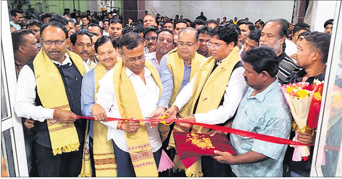
ଉଦ୍ଘାଟନା ଉତ୍ସବରେ ଯୋଗଦେଇଥିବା ଅତିଥି ।