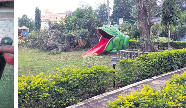
ପିଲାଙ୍କ ଖେଳିବାକୁ ଥିବା ଉପକରଣ ଉପରେ ଘାସ, ଲତା ମାଡ଼ିଯାଇଛି ।