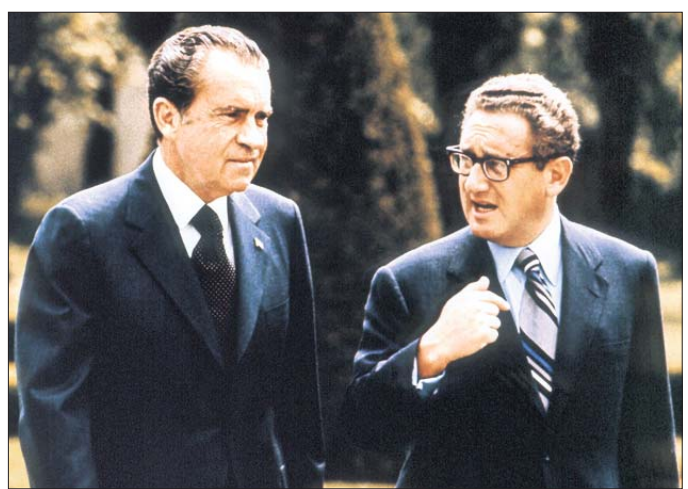
ଆମେରିକାର ପୂର୍ବତନ ରାଷ୍ଟ୍ରପତି ରିଚାର୍ଡ ନିକ୍ସନ୍ଙ୍କ ସହ ପୂର୍ବତନ ପରରାଷ୍ଟ୍ର ସଚିବ ହେନ୍ରି କିସିଙ୍ଗର(ବାହାଣ)।

ଝାଗିଠନ, ୩୦୧୧ ଆମେରିକାର ପୂର୍ବତନ ପରରାଷ୍ଟ୍ର ସଚିବ ତଥା ବରିଷ୍ଠ କୃତନୀତିଜ୍ଞ ହେନ୍ରି କିସିଙ୍ଗରଙ୍କର ରୁଧିରୀ ପରଲୋକ ହୋଇଯାଇଛି। ତାଙ୍କୁ ୧୦୦ ବର୍ଷ ହୋଇଥିଲା। ୧୯୭୦ ଦଶକରେ ଭାରତର ନେତୃତ୍ୱ ସେ ତିରଞ୍ଚାର କରିଥିଲେ। ଆମେରିକାରେ ଶିକ୍ଷାଗ୍ରହଣ କରିବା ଏପରିକି ତତ୍କାଳୀନ ପ୍ରଧାନମନ୍ତ୍ରୀ ଇନ୍ଦିରା ଗାନ୍ଧୀଙ୍କ ପ୍ରତି ସେ କାଟିଆଣ ଏବଂ ଘୃଣ୍ୟ ଅନୁମାନ କରାଯାଇଛି। ବାତ୍ୟା ଯୋଗୁ ଉପକୂଳରେ ୫୦ରୁ ୬୦ କି.ମି. ବେଗରେ ପବନ ବହିବା ସମ୍ଭାବନା ରହିଛି। ଲଗୁତାପ ପ୍ରଭାବରେ ଡିସେମ୍ବର ୧ ତାରିଖରୁ କେନ୍ଦ୍ରୀୟ ବଙ୍ଗୋପ ସାଗର ଓ ଏହା ସଂଲଗ୍ନ ଅଞ୍ଚଳରେ ଘଣ୍ଟା ପ୍ରତି ୪୦ରୁ ୫୦ କିମି ବେଗରେ ଫୁସ୍ଫା-୧୧