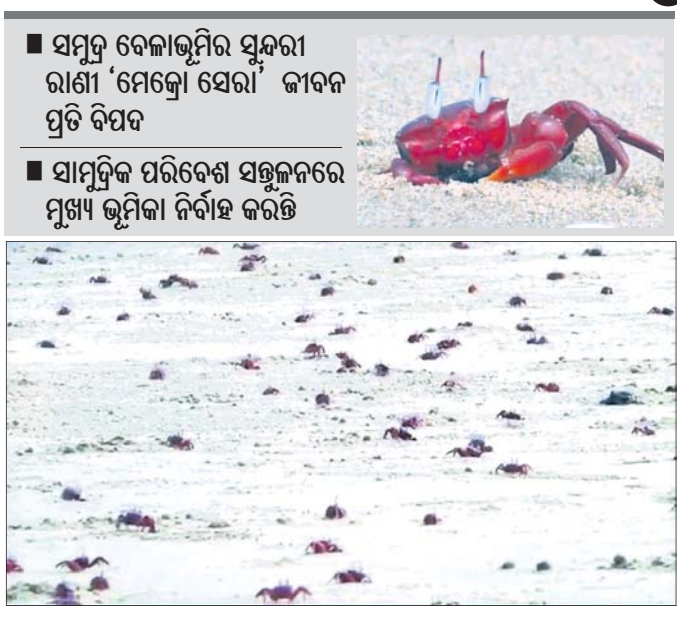
ରହାରମଥା ସମୁଦ୍ର ବେଳାକୁ ବାଲୁକା ଶଯ୍ୟାରେ ଲାଲ କଙ୍କଡ଼ା ମେଳି ।

ଲାଲ କଙ୍କଡ଼ା, ଛେବ ବିଧିପତା ସାମୁଦ୍ରିକ ପରିବେଶ ସହଜରେ ରକ୍ଷା କରିବାରେ ଲାଲ କଙ୍କଡ଼ା ପୁଖ୍ୟ ଭୂମିକା ନିର୍ବାହ କରିଥାନ୍ତି । ଏବେ ସେମାନଙ୍କ ପାଇଁ ବର୍ଜ୍ୟବସ୍ତୁ କାଳ ସାଜିଛି । ଏହି ବିରଳ ପ୍ରଜାତିର ଲାଲ ରଙ୍ଗର କଙ୍କଡ଼ାକୁ ବିଶେଷ କରି ଅଣ୍ଟେଲିଆ ଓ ଶ୍ରୀଲଙ୍କା ଉପକୂଳ ଅଞ୍ଚଳରେ ପ୍ରଚୁର ପରିମାଣରେ ଦେଖିବାକୁ ମିଳନ୍ତି । ଏହି ବିରଳ ପ୍ରଜାତିର କଙ୍କଡ଼ା ବୁଲୁଥିବା ସମୟରେ ପର୍ଯ୍ୟଟକମାନଙ୍କ ଗାତ ଖୋଲି ବାସସ୍ଥାନ ବନେଇଥାନ୍ତି । ମୃତ ଶୈବାଳ, ମାଛ ମାଛ ଓ ଛୋଟ ଛୋଟ ସାମୁଦ୍ରିକ ଜୀବମାନଙ୍କୁ ଆହାର ରୂପେ ଗ୍ରହଣ କରିଥାନ୍ତି । ଏହି କଙ୍କଡ଼ାଙ୍କ ଲମ୍ବ ଦୁଇ ଇଞ୍ଚ ହୋଇଥିବା ବେଳେ ୨ ବର୍ଷ ପର୍ଯ୍ୟନ୍ତ ବଞ୍ଚୁଥାନ୍ତି । ଏମାନେ ସଂଯତକ ଭାବେ ବସବାସ କରିବା ପାଇଁ ପସନ୍ଦ କରନ୍ତି । ପ୍ରାକୃତିକ ବିପର୍ଯ୍ୟୟ ଆସିବାର ଡେଇଁ ପୂର୍ବରୁ ଏମାନେ ଆସୁଆ ସୂଚନା ପାଇ ପାରନ୍ତି । ଶତ୍ରୁକୁ ଦେଖିବା ମାତ୍ରେ ଅତି ଶିଘ୍ର ଗତିରେ ନିଜ ବାସସ୍ଥାନ ଗାତ କିମ୍ବା ସମୁଦ୍ର ଜଳକୁ ଚାଲିଯାଆନ୍ତି । ନବେ ଦଶକରେ ଏମାନଙ୍କ ସଂଖ୍ୟା ଡେଇଁ ଅଧିକ ଥିଲା । ଜଳବାୟୁ ପରିବର୍ତ୍ତନ, ସାମୁଦ୍ରିକ ଝଡ଼ ବାତ୍ୟା ଓ