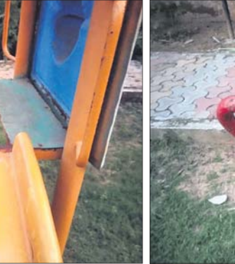
ବ୍ୟାୟାମ ପାଇଁ ଥିବା ସାମଗ୍ରୀ ଜଳ ଲାଗି ଯାଇଛି ।