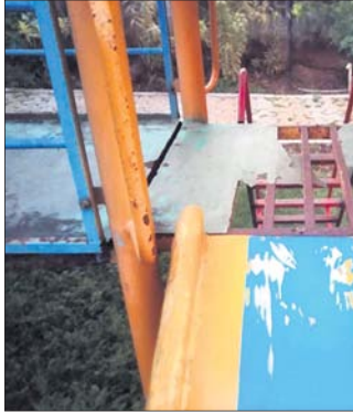
ଶିଶୁ ଉଦ୍ୟାନରେ ପିଲାଙ୍କ ଖେଳ ପାଇଁ ଥିବା ଖସଡ଼ା ଭାଙ୍ଗି ପଡ଼ିଛି ।