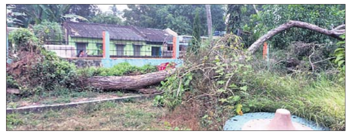
ଶିଶୁ ଉଦ୍ୟାନ ଭିତରେ ଶୋଇ ପଡ଼ିଥିବା ଶିଶୁ ଗଛ ।

କେନ୍ଦ୍ରାପଡ଼ା ଜିଲ୍ଲା ପଟ୍ଟାପୁର ବ୍ଲକ କଲୋନିରେ ଥିବା ପୌରପରିଷଦ ଶିଶୁଉଦ୍ୟାନ ରକ୍ଷଣାବେକ୍ଷଣ ଅଭାବରୁ ପରିତ୍ୟକ୍ତ ଓ ସୌନ୍ଦର୍ଯ୍ୟହୀନ ହୋଇ ପଡ଼ିରହିଛି । ପିଲାମାନଙ୍କ ମନୋରଞ୍ଜନ ପାଇଁ କରାଯାଇଥିବା ଶିଶୁ ଉଦ୍ୟାନ ପାଇଁ ଏବେ ସମ୍ପୂର୍ଣ୍ଣ ଅଟକ ହୋଇ ବିପଦ ସଙ୍କୁଳ ଅବସ୍ଥାରେ ରହିଛି । ଶିଶୁଙ୍କ ପାଇଁ ଭବିଷ୍ୟ ଖେଳ ଉପକରଣ ସବୁ ଭାଙ୍ଗି ଯାଇଛି । ଫଳରେ ପିଲାଙ୍କ ଜୀବନ ପ୍ରତି ବିପଦ ଦେଖାଯିବା ନେଇ ଅଭିଭାବକମାନେ ଅଭିଯୋଗ କରିଛନ୍ତି । ଫଳରେ ଯେଉଁ ଭବେଶ୍ୟରେ ଏହା ନିର୍ମାଣ ହୋଇଥିଲା