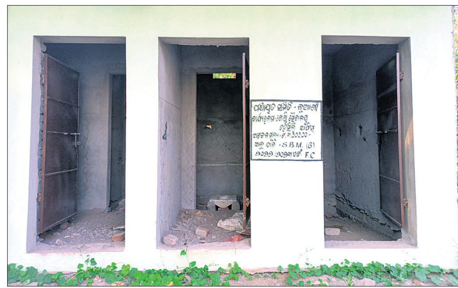
ତହସିଲ କାର୍ଯ୍ୟାଳୟ ପରିସରରେ ଅଧପଡ଼ରିଆ ଶୌଚାଳୟ ।

ନୟାଗଡ଼ ଜିଲା ନୂଆଗାଁ ତହସିଲ କାର୍ଯ୍ୟାଳୟ ଓ ସର୍ବ-ରେଜିଷ୍ଟର କାର୍ଯ୍ୟାଳୟକୁ ଆସୁଥିବା ଲୋକମାନଙ୍କ ସୁବିଧା ପାଇଁ ତହସିଲ କାର୍ଯ୍ୟାଳୟ ପରିସରରେ ନିର୍ମାଣ ହୋଇଥିବା ଶୌଚାଳୟ ଦୀର୍ଘ ମାସ ହେଲା ଅଧପଡ଼ରିଆ ଭାବେ ପଡ଼ି ରହିଛି । ଫଳରେ କୌଣସି କାମରେ ଉକ୍ତ କାର୍ଯ୍ୟାଳୟକୁ ଆସୁଥିବା ଲୋକମାନେ ହଇରାଣ ହେଉଛନ୍ତି । ଏ ନେଇ ବାରମ୍ବାର ଅଭିଯୋଗ କଲେ ମଧ୍ୟ ଉକ୍ତ ଶୌଚାଳୟକୁ ପୂର୍ଣ୍ଣାଙ୍ଗ କରାଯାଉନାହିଁ । ଏହାକୁ ନେଇ ସାଧାରଣରେ ଅସନ୍ତୋଷ ପ୍ରକାଶ ପାଇଛି । ନୂଆଗାଁ ତହସିଲ କାର୍ଯ୍ୟାଳୟ ଓ ସର୍ବ-ରେଜିଷ୍ଟର କାର୍ଯ୍ୟାଳୟକୁ ବିଭିନ୍ନ କାର୍ଯ୍ୟରେ ପ୍ରତିଦିନ ଅନେକ ଲୋକ ଆସୁଛନ୍ତି । ଜମିବନ୍ଦି କିଣାବିକା କରିବା ପାଇଁ ବହୁ ମହିଳା ବି ଅଧିଏ ଆସୁଛନ୍ତି । ସେମାନଙ୍କ ସୁବିଧା ନିମନ୍ତେ ସ୍ୱଳ୍ପ ଭାରତ ମିଶନ (ଗ୍ରାମାଣ) ତରଫରୁ ଗୋଷ୍ଠୀ ଶୌଚାଳୟ ନିର୍ମାଣ