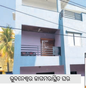
ଭୁବନେଶ୍ୱର ଜାଗମରାସ୍ତିର ଘର