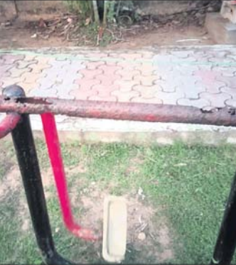
ପିଲାଙ୍କ ଖେଳିବାକୁ ଥିବା ଉପକରଣ ଉପରେ ଘାସ, ଲତା ମାଡ଼ିଯାଇଛି ।