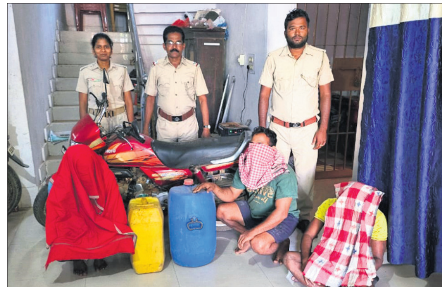
ଜବତ ମଦ ଓ ବାଇକ୍ ସହ ୩ ଅଭିଯୁକ୍ତ ।