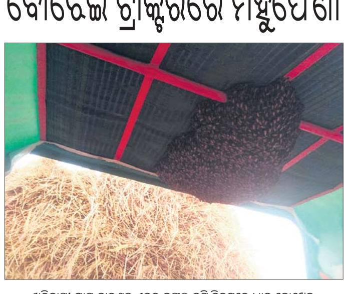
ଖରିନାସୀ ଗ୍ରାମ ବାରଖାସ ଏକର ଜଙ୍ଗଲ ଜମି ନିକଟରେ ଧାନ ବୋଝେଇ ଟ୍ରାକ୍ଟରରେ ଜଙ୍ଗଲୀ ମହୁମାଛି ।