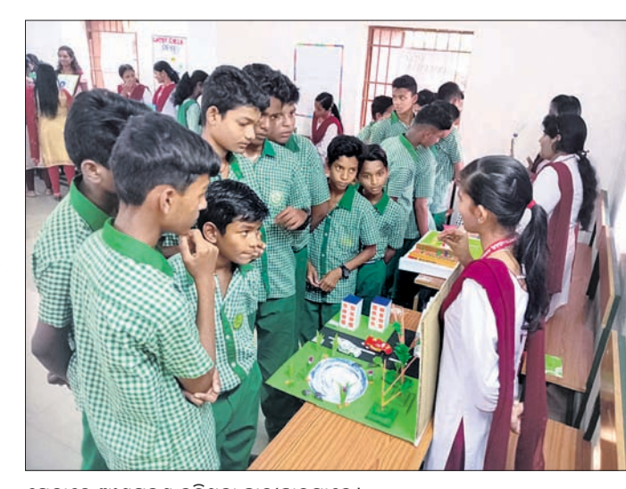
ମେଳାରେ ଅଂଶଗ୍ରହଣ କରିଥିବା ଛାତ୍ରଛାତ୍ରୀମାନେ।