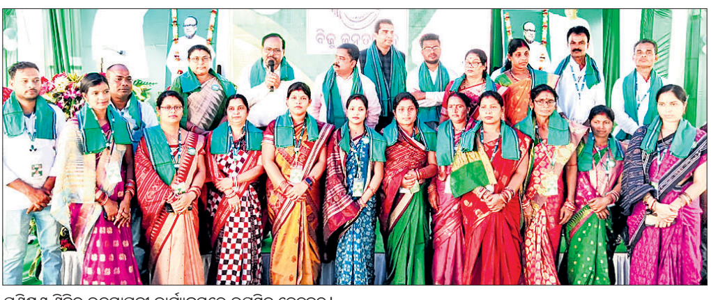
ପ୍ରଶିକ୍ଷଣ ଶିବିର ଉଦ୍ଘାଟନା କାର୍ଯ୍ୟକ୍ରମରେ ଉପସ୍ଥିତ ନେତୃବୃନ୍ଦ।

ବରଷା, ୩୦।୧୧ (ପରିକ୍ଷିତ ସାହୁ) ଗ୍ରାମାଞ୍ଚଳର କିପରି ବିକାଶ ହୋଇପାରିବ ସେ ନେଇ ନବୀନ ସରକାର ଅନେକ ଯୋଜନା କାର୍ଯ୍ୟକାରୀ କରିଛନ୍ତି। ରାସ୍ତା, ପାନୀୟ ଜଳ, ସମସ୍ତ ପରିବାରକୁ ସ୍ୱାସ୍ଥ୍ୟ ସେବା, ବିଦ୍ୟୁତ୍ ଭଳି ମୌଳିକ ସୁବିଧା ଯୋଗାଇ ଦେଇଛନ୍ତି। ମାନବ ବିକାଶ ପାଇଁ ମିଶନ ଶକ୍ତି ମାଧ୍ୟମରେ ବିନା