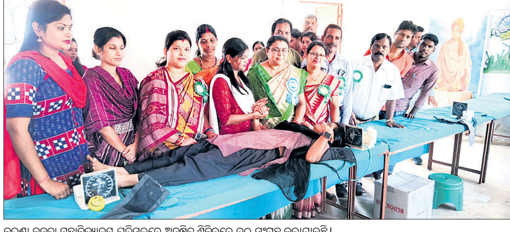
ବରଷା ଜନତା ମହାବିଦ୍ୟାଳୟ ପରିସରରେ ଅନୁଷ୍ଠିତ ଶିବିରରେ ରକ୍ତ ସଂଗ୍ରହ କରାଯାଇଛି।

ପ୍ରମୁଖ ଯୋଗ ଦେଇଥିଲେ। ଏଥିରେ ବଜରା ତଥା ଆଖପାଖ ଅଞ୍ଚଳରୁ ଯୁବକମାନେ ଯୋଗଦେଇ ରକ୍ତଦାନ କରିଥିଲେ। ଏଥିରେ ୫୦ ଯୁନିଟ୍ ରକ୍ତ ସଂଗ୍ରହ ହୋଇଥିଲା। ଅନୁଗୋଳ ବ୍ଲକ ବ୍ୟାଙ୍କର ତାତ୍ତ୍ୱର ସଫଳତା ପାଟଯୋଗୀ ଯୋଗଦେଇ ରକ୍ତଦାନ ଗ୍ରହଣ କରିଥିଲେ। ମହାବିଦ୍ୟାଳୟର କର୍ମଚାରୀମାନେ ସହଯୋଗ କରିଥିଲେ।