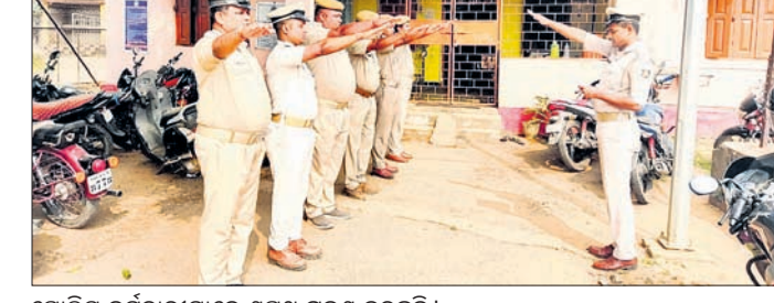
ପୋଲିସ କର୍ମଚାରୀମାନେ ଶପଥ ଗ୍ରହଣ କରୁଛନ୍ତି।