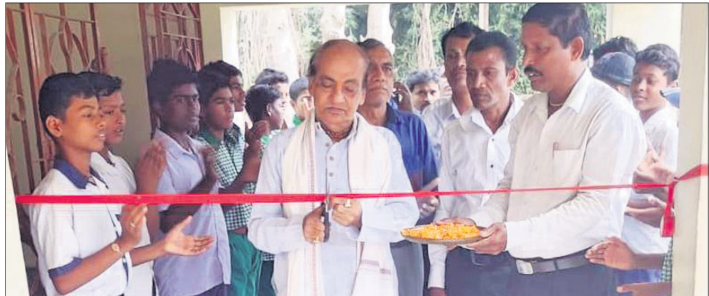
ଅତିଥିଙ୍କ ଦ୍ୱାରା ବିଜ୍ଞାନ ମେଳା ଉଦ୍ଘାଟନ କରାଯାଇଛି।