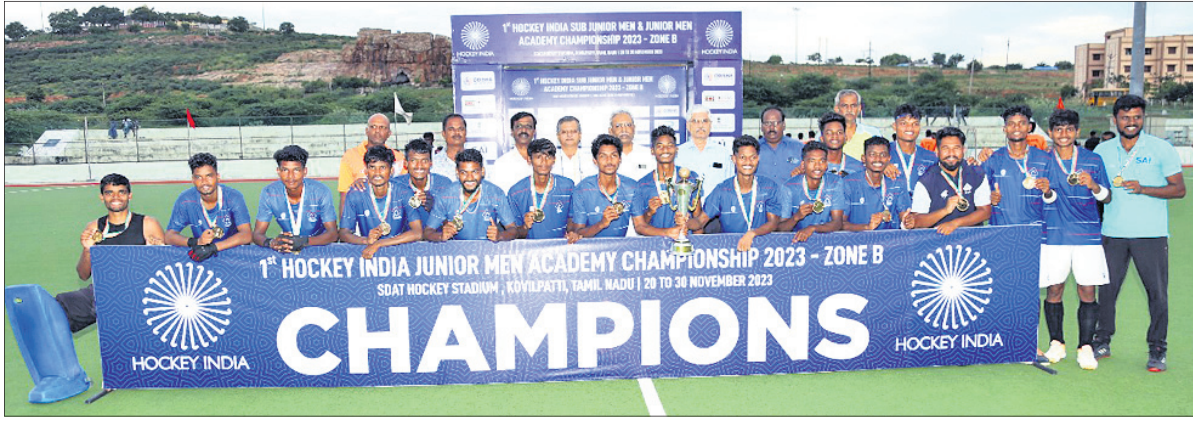
ଚୁନିୟର ବର୍ଗରେ ସର୍ବ ପଦକ ବିଜୟୀ ସେଲ୍ ହକି ଏକାଡେମୀ ଦଳ ଅତିଥିକ ଗହଣରେ।

ଭୁବନେଶ୍ୱର, ୩୦୧୧ (ଚପନ ସାଲ୍) ଚାମ୍ପିୟନସିପ୍ କୋଭିଡ଼ପକ୍ଷରେ ଅନୁଷ୍ଠିତ ସର୍ବପ୍ରଥମ ହକି ଇଣ୍ଡିଆ ଏକାଡେମୀ ଚାମ୍ପିୟନସିପ୍ (ଜୋନ-ବି)ରେ ସେଲ୍ ହକି ଏକାଡେମୀ ଡବଲ ଟାଇଟଲ ହାସଲ କରିଛି। ଏହି