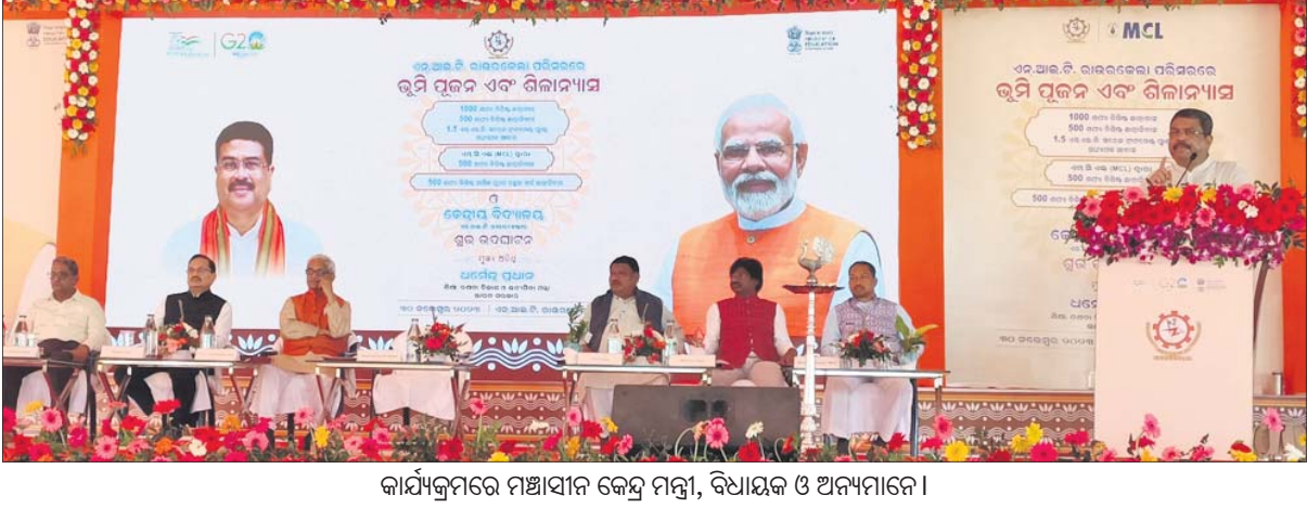
କାର୍ଯ୍ୟକ୍ରମରେ ମହାଧିକାରୀ କେନ୍ଦ୍ର ମନ୍ତ୍ରୀ, ବିଧାୟକ ଓ ଅନ୍ୟମାନେ।