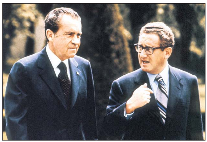
ଆମେରିକାର ପୂର୍ବତନ ରାଷ୍ଟ୍ରପତି ରିଚାର୍ଡ ନିକ୍ସନ୍‌ଙ୍କ ସହ ପୂର୍ବତନ ପରରାଷ୍ଟ୍ର ସଚିବ ହେନ୍ରି କିସିଙ୍ଗର (ଡାହାଣ)।

ଫ୍ରିଜି-ପୂର୍ବ ବଙ୍ଗୋପସାଗର ଏବଂ ଦକ୍ଷିଣ ଆଞ୍ଚଳିକରେ ସୃଷ୍ଟି ହୋଇଥିବା ଲଘୁଚାପ ପଶ୍ଚିମ-ଉତ୍ତର-ପଶ୍ଚିମ ଦିଗକୁ ଗତିକରି ଅବପାତରେ ପରିଣତ ହୋଇଛି। ଏହାପରେ ଅବପାତ ଆହୁରି ଘନୀଭୂତ ହୋଇ ପଶ୍ଚିମ-ଉତ୍ତର-ପଶ୍ଚିମ ଦିଗକୁ ଗତିକରି ଦକ୍ଷିଣ-ପୂର୍ବ ବଙ୍ଗୋପସାଗରରେ ଗଭୀର ଅବପାତରେ ପରିଣତ ହେବ। ଡିସେମ୍ବର ୩ ତାରିଖ ସୁଦ୍ଧା ବଙ୍ଗୋପସାଗରରେ ବାତ୍ୟା ସୃଷ୍ଟି ହେବାର ସମ୍ଭାବନା ରହିଛି। ଠ ତାରିଖ ସକାଳେ ସାମୁଦ୍ରିକ ଝଡ଼ ଉତ୍ତର ତାମିଲନାଡୁ ଓ ଦକ୍ଷିଣ ଆନ୍ଧ୍ର ଉପକୂଳରେ ପହଞ୍ଚିବ ବୋଲି ଭାରତୀୟ ପାଣିପାଗ ବିଭାଗ ପକ୍ଷରୁ ଆକଳନ କରାଯାଇଛି। ଏହାର ପ୍ରଭାବରେ ଝରୁ ୭ ତାରିଖ ଯାଏ ଦକ୍ଷିଣ, ଉପକୂଳ ଏବଂ ଆନ୍ଧ୍ରପ୍ରଦେଶ ଓଡ଼ିଶାରେ ପ୍ରବଳ ବର୍ଷା ହେବ। ବିଶେଷ କରି ମାଲକାନଗିରି, କୋରାପୁଟ, ଗଞ୍ଜାମ, ଗଜପତି, ରାୟଗଡ଼ା, ପୁରୀ, ଖୋର୍ଦ୍ଧା, ଜଗତସିଂହପୁର, କଟକ, କେନ୍ଦ୍ରାପଡ଼ା, ବାଲେଶ୍ୱର ଓ ପୁଷ୍ପା-୧୩