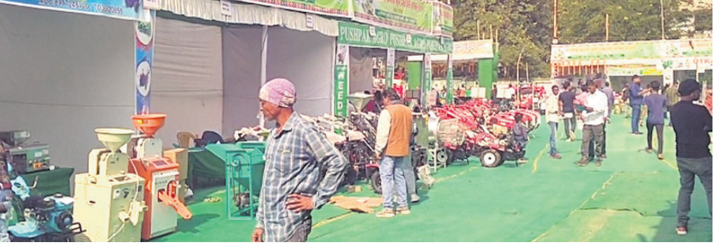
ଗାଷ୍ଟୀ କୃଷି ଯନ୍ତ୍ରପାତି ଷ୍ଟଲ୍ ବୁଲି ଦେଖୁଛନ୍ତି ।

କରାଯିବା ସହ ମାଝିଆ ଗାଷ୍ଟୀରେ ୩ ଜଣ ସମ୍ପଦ ଗାଷ୍ଟୀଙ୍କୁ ଅତିଥିମାନଙ୍କ ଦ୍ୱାରା ସମ୍ମାନିତ କରାଯାଇଥିଲା । ଉଦ୍ଘାଟନା ଉତ୍ସବରେ ପ୍ରାୟ ୫୦୦ ସେ ନେଇ ମତ ରଖିଥିଲେ । ଏହି ପରିପ୍ରେକ୍ଷାରେ ପୂର୍ବରୁ ଅନୁଷ୍ଠିତ ଚିତ୍ରାଙ୍କନ ଓ ସାଧାରଣ ଜ୍ଞାନ ପ୍ରତିଯୋଗିତାର କୃତୀ ପ୍ରତିଯୋଗୀଙ୍କୁ ପୁରସ୍କୃତ କରାଯାଇଥିଲା । ମେଳାରେ ସର୍ବଶ୍ରେଷ୍ଠ ଷ୍ଟଲ୍ ଭାବେ ଅର୍ଜିତା ଏଞ୍ଜରପାଲକେସ, ଉତ୍କଳ ସେଲ୍, ପୁଷ୍ପକ ଆଗ୍ରା ଆଦି ୩ ଷ୍ଟଲ୍‌କୁ ପୁରସ୍କୃତ କରାଯାଇଥିଲା । ଯୋଡ଼ା, ଚଞ୍ଚୁଆ, ଝୁମୁଡ଼ା ବ୍ଲକ୍‌ର ୫ ସମ୍ପଦ ଗାଷ୍ଟୀଙ୍କୁ ସମ୍ମାନିତ