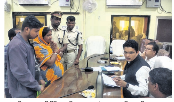
ଯୁବ ଅଭିଯୋଗ ଶୁଣାଣି ଶିବିରରେ ଜିଲ୍ଲାପାଳଙ୍କୁ ମା' ଓ ପୁଅ ରୁହାରି କରୁଛନ୍ତି ।

ନୀଳଗିରି, ୩୦।୧୧(ପ୍ରଶାନ୍ତ ବିଶ୍ୱାଳ) ବାଲେଶ୍ୱର ଜିଲ୍ଲା ନୀଳଗିରି ତହସିଲ୍ ଆଧୀନରେ କୁଲଡ଼ିହା ଇକୋ ସେନସିଟିଭ ଜୋନ୍‌ର ଭିତରେ ଗଡ଼ି ଉଠିଥିବା ଏକାଧିକ ବେଆଇନ ଜଗାଭାଟିକୁ କେନ୍ଦ୍ର କରି ବିବାଦ ଉତ୍ପତ୍ତି ଧାରଣ କରିଛି । ଦିନି ଦିନ ପୂର୍ବରୁ ନୀଳଗିରି ତହସିଲ୍ ଆଧୀନ କୁଲଡ଼ିହା ଇକୋ ସେନସିଟିଭ ଜୋନ୍ ଭିତରେ ଥିବା ୧୫ ଜଗାଭାଟିକୁ ରାଜ୍ୟ ବିଭାଗ ଜମିମାନା କରିଥିଲେ ।