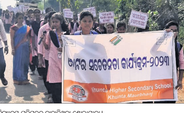
ବିଦ୍ୟାଳୟ ପରିସରକୁ ବାହାରିଥିବା ଶୋଭାଯାତ୍ରା