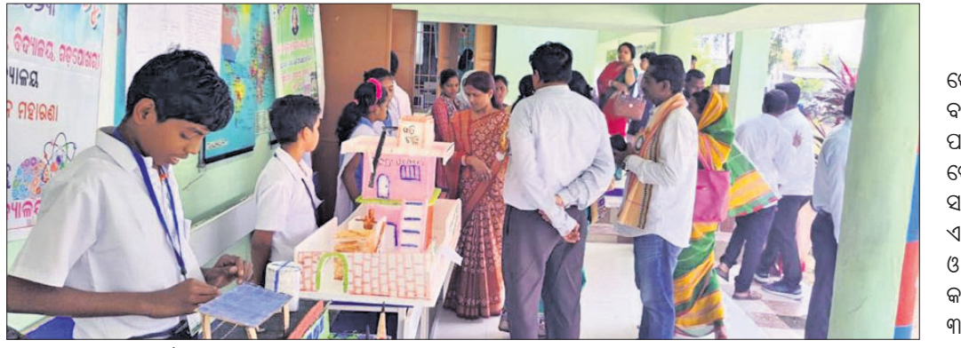
ପିଲାମାନଙ୍କ ଦ୍ୱାରା ପ୍ରଦର୍ଶିତ ପ୍ରକଳ୍ପ