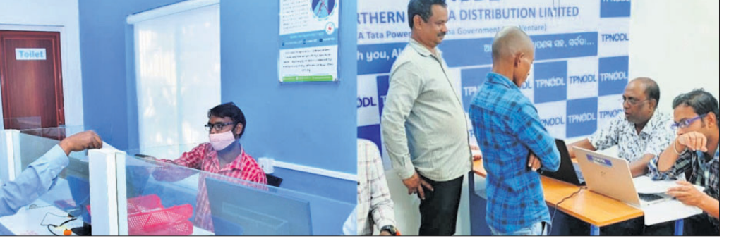
ଟିପିଏନଓଡିଏଲ୍ ପକ୍ଷରୁ ଗ୍ରାହକ ସୁବିଧା କାର୍ଯ୍ୟ

ବାଲେଶ୍ୱର ଜିଲ୍ଲା ରେମୁଣା ଗୋଲେଇସ୍ଥିତ ଟିପି ନର୍ଦ୍ଦନ ଓଡ଼ିଶା ଡିଷ୍ଟ୍ରିବ୍ୟୁଶନ ଲିମିଟେଡ୍ (ଟିପିଏନଓଡିଏଲ୍) ପକ୍ଷରୁ ନିଜର ଉପଭୋକ୍ତାଙ୍କୁ ଶୁଣାମୂଳକ ବିକଳ ସେବା ଯୋଗାଇବା କ୍ଷେତ୍ରରେ ସର୍ବଦା ଗୁରୁତ୍ୱ ଦିଆଯିବା ସହ ସେବା ବିତରଣ ପ୍ରକ୍ରିୟାକୁ ଅଧିକ ସହଜ ଓ ସରଳ କରିବା ପାଇଁ ବିଶେଷ ଧ୍ୟାନ ଦିଆଯାଇଛି। ମୁଖ୍ୟତଃ ଉପଭୋକ୍ତାମାନଙ୍କ ବିଭିନ୍ନ ସମସ୍ୟାର ଭିତ୍ତି ସମାଧାନ ଓ ସେବାନୀୟ ହାତ ପାହାନ୍ତାରେ ସମସ୍ତ ସୁବିଧା ସୁଯୋଗ ପହଞ୍ଚାଇବାକୁ ଗୁରୁତ୍ୱ ଦିଆଯାଉଥିବା ନେଇ ଟିପିଏନଓଡିଏଲ୍ ସିଇଓ ଭାଷ୍ଟର ସରକାର ସୂଚନା ଦେଇଛନ୍ତି। ଉପଭୋକ୍ତାମାନଙ୍କ ବିଦ୍ୟୁତ୍ ସେବା ସମ୍ପର୍କିତ ଯେ କୌଣସି ସମସ୍ୟାର ସମାଧାନ ପାଇଁ ୨୪ ଘଣ୍ଟା ଦେଇ ମୁକ୍ତ ଗ୍ରାହକ ସେବା ନମ୍ବର ୧୮୦୩୮୫୫୭୧୮/୧୯୧୨ ସୁବିଧା କରାଯାଇଛି। ୧୨ଟି ଗ୍ରାହକ ସେବା କେନ୍ଦ୍ର ଓ ୧୩୯ଟି ଅନୁଭବ କେନ୍ଦ୍ର ମଧ୍ୟ ଖୋଲିଛି। ଗ୍ରାହକ ସେବା କେନ୍ଦ୍ରଗୁଡ଼ିକ ଟିପିଏନଓଡିଏଲ୍ ସମସ୍ତ ବିଭିନ୍ନନେଇ ଖୋଲିଥିବା ବେଳେ ଅନୁଭବ କେନ୍ଦ୍ରଗୁଡ଼ିକ ଗ୍ରାମାଞ୍ଚଳର ଉପଭୋକ୍ତାମାନଙ୍କୁ ଉତ୍ତମ ସେବା ଯୋଗାଇବା ପାଇଁ ଖୋଲିଛି। ଏହି କେନ୍ଦ୍ରଗୁଡ଼ିକରେ ଉପଭୋକ୍ତା ବିଦ୍ୟୁତ୍ ସେବା ସମ୍ପର୍କିତ ନିଜର ବ୍ରହ୍ମ ଦୂର କରିବା, ସମସ୍ୟାର ସମାଧାନ କରିବା ସହିତ ବିଲ୍ ପଇଠ ମଧ୍ୟ କରିପାରିବେ। ଗ୍ରାହକ ସେବା