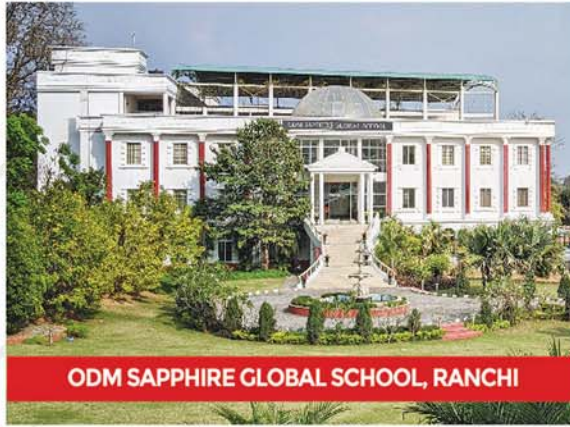
ODM SAPPHIRE GLOBAL SCHOOL, RANCHI