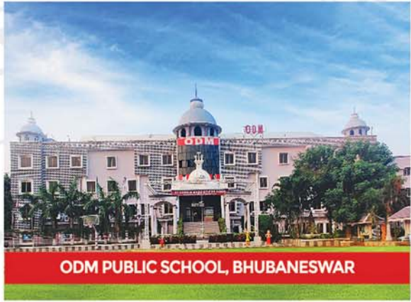
ODM PUBLIC SCHOOL, BHUBANESWAR