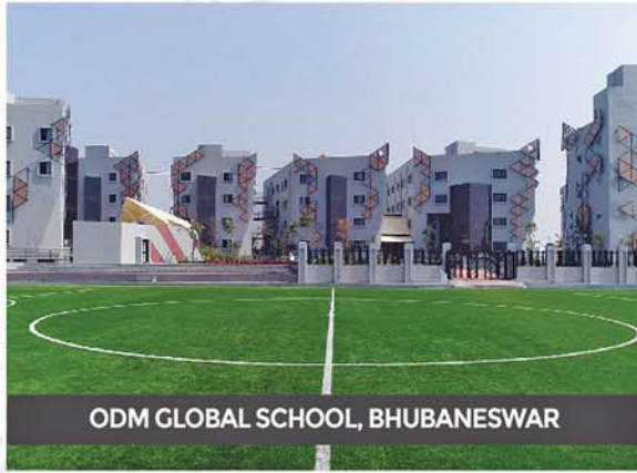
ODM GLOBAL SCHOOL, BHUBANESWAR