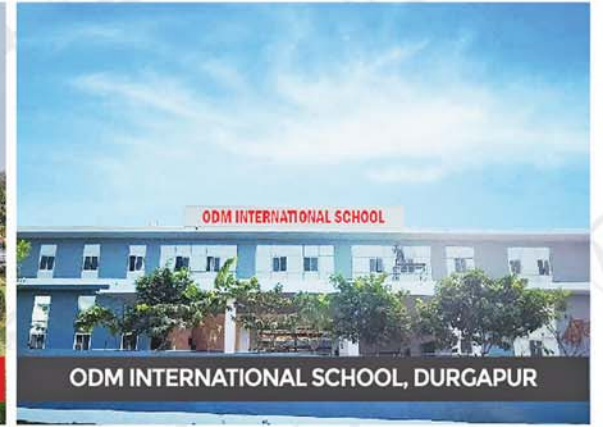
ODM INTERNATIONAL SCHOOL, DURGAPUR