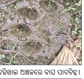
ଦହିଖାଲ ଅଞ୍ଚଳରେ ବାଘ ପାଦଚିହ୍ନ।