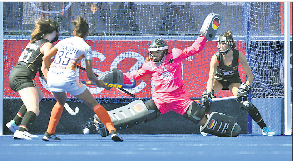
ଭାରତ-ଜର୍ମାନୀ ମ୍ୟାଚର ଏକ ସଂଘର୍ଷପୂର୍ଣ୍ଣ ମୁହୂର୍ତ୍ତ।

ସାହିଆଗୋ, ୧୧୧୨ ଏଠାରେ ଚାଲିଥିବା କୁନିୟର ମହିଳା ହକି ବିଶ୍ୱକପରେ ଭାରତ ଏହାର ଦ୍ୱିତୀୟ ମ୍ୟାଚରେ ଲଡୁଆ ପ୍ରଦର୍ଶନ ସତ୍ତ୍ୱେ ଜର୍ମାନୀଠାରୁ ୩-୪ ଗୋଲରେ ହାରିଯାଇଛି। ପ୍ରଥମ ମ୍ୟାଚରେ କାନାଡା ବିପକ୍ଷରେ ୧୨-୦ ଗୋଲରେ ବିଜୟୀ ହୋଇଥିବା ଭାରତୀୟ ଦଳ ଦ୍ୱିତୀୟ ମ୍ୟାଚରେ ଜର୍ମାନୀକୁ କଡ଼ା ବନ୍ଧର ଦେଇଥିଲା। ମାତ୍ର ଶେଷ ଭାଗରେ ଜର୍ମାନୀ ରକ୍ଷଣାତ୍ମକ ଖେଳି ଭାରତକୁ ବରାବର ସ୍ଥିତିକୁ ଆସିବାରେ