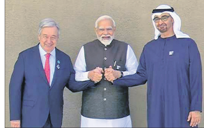
ଦୁବାଇର ଏକ୍ସପୋ ସିଟିରେ କର୍ମାଣୀ ଅବସରରେ ଜାତିସଂଘ ମହାସଚିବ ଆଣ୍ଡୋନିଓ ସ୍ତ୍ରୋରେସ୍ (ବାମରୁ ପ୍ରଥମ) ଏବଂ ସ୍ତ୍ରୋରେସ୍ ମୋହାମେଦ୍ ବିନ୍ କାୟେଦ୍ ଅଲ୍ ନହ୍ୟାନ୍‌ଙ୍କ ସହ ଭାରତର ପ୍ରଧାନମନ୍ତ୍ରୀ ନରେନ୍ଦ୍ର ମୋଦି (ମଝି) ।