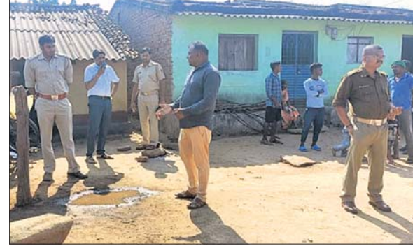
ପୋଲିସ୍ ଗାଁରେ ଚନ୍ଦ୍ର କଚୁରି।

ପାପଡ଼ାହାଣ୍ଡି/ମଇଦପୁର, ୧୧୧୨ (ସ୍ୱପ୍ନାକ୍ଷର ପଟ୍ଟନାୟକ/ସବାଶିବ ଦାସ)