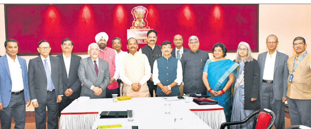
ସମ୍ମିଳନୀରେ ରାଜ୍ୟପାଳ ରଘୁବର ଦାସଙ୍କ ସହ କୁଳପତି ଓ ଅନ୍ୟମାନେ।

ବେଶି ଉପାହାସକରଣ ଶକ୍ତି ଓ ବ୍ୟବସାୟ କ୍ଷମତା ଆବଶ୍ୟକତା ଭିତ୍ତିରେ ନୂତନ ଦକ୍ଷତାସମ୍ପନ୍ନ ମାନବ ସମ୍ପଦ ସୃଷ୍ଟି ହେବା ଦରକାର। ପ୍ରାଥମିକ ପାଠ୍ୟକ୍ରମ ଓ ସମୟର ଆବଶ୍ୟକତା ପୂରଣ ଦିନେ ବିଶ୍ୱବିଦ୍ୟାଳୟକୁ ପ୍ରତ୍ୟେକ ବିଶ୍ୱବିଦ୍ୟାଳୟର ରାଜ୍ୟପାଳ ଆହ୍ୱାନ ମଧ୍ୟ କରୁଛନ୍ତି, ଭାରତକୁ ବିଶ୍ୱରୁ ହେବାର ସମୟ ଆସିଛି। ଭାରତର ମୁକ୍ତିଶ୍ରୀ ଆମର ଅନୁରାଗ ସମ୍ପଦ।