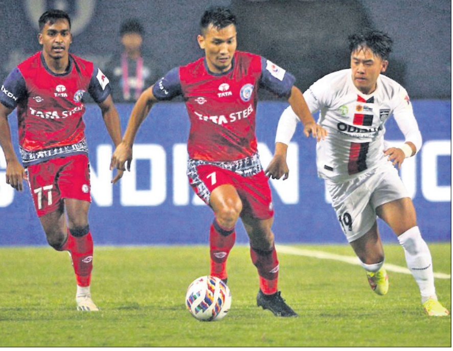
କାମଶେବପୁରରେ ଶୁକ୍ରବାର ଓଡ଼ିଶା ଏସିଏ ଓ କାମଶେବପୁର ଏସିଏ ମଧ୍ୟରେ ଅନୁଷ୍ଠିତ ଆଇସିଏଏଏ ମ୍ୟାଚ।