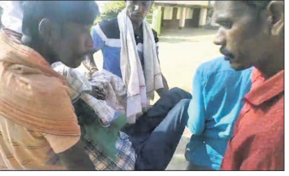
ଗୁରୁତର କର୍ମୀଙ୍କୁ ଭାବୁଛନ୍ତି ନିଆଯାଉଛି।

ଭାଜପାର ରୁକ୍ ଘେରାଉ ବେଳେ ମହୁମାଛି ଆକ୍ରମଣ ■ ୧୦ରୁ ଊର୍ଦ୍ଧ୍ୱ ଗୁରୁତର