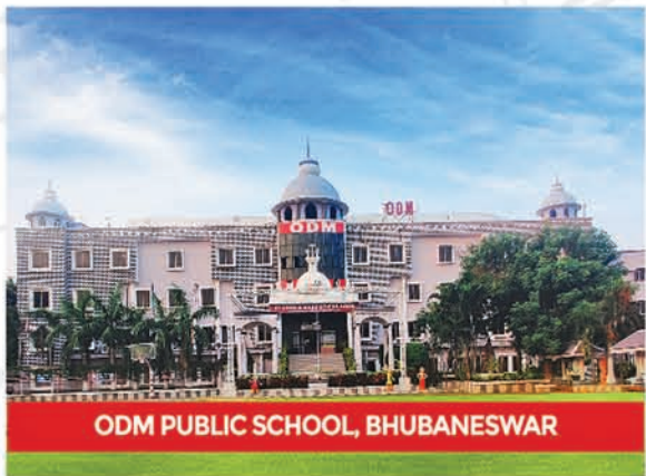
ODM PUBLIC SCHOOL, BHUBANESWAR