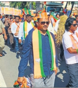
ଭାଜପା କର୍ମଚାରୀମାନେ ବିରୋଧ ପ୍ରଦର୍ଶନ କରି ଶୋଭାଯାତ୍ରାରେ ଯାଉଛନ୍ତି ।

ବିଭିନ୍ନ ଦାବି ନେଇ ଜିଲ୍ଲା ଭାଜପାର ଜନତା ପାର୍ଟି ପକ୍ଷରୁ ଶୁକ୍ରବାର ବିରୋଧ ପ୍ରଦର୍ଶନ କରାଯାଇଛି । ବସ୍ତାଖଣ୍ଡଠାରୁ ଏକ ଶୋଭାଯାତ୍ରାରେ ସହର ପରିକ୍ରମା କରି ମାଲକାନଗିରି ପୌର ପରିଷଦ କାର୍ଯ୍ୟାଳୟରେ ପହଞ୍ଚି କାର୍ଯ୍ୟନିର୍ବାହୀ ଅଧିକାରୀଙ୍କୁ ଏକ ଦାବିପତ୍ର ପ୍ରଦାନ କରାଯାଇଥିଲା । ପରେ ଭାଜପା କର୍ମଚାରୀମାନେ ମାଲକାନଗିରି ବ୍ଲକ୍ କାର୍ଯ୍ୟାଳୟରେ ପହଞ୍ଚି ରାଜ୍ୟ ସରକାରଙ୍କ ଧ୍ୟେୟରେ ବିଭିନ୍ନ ଘୋଷଣା ଦେଇ ୧୦ ଦିନ