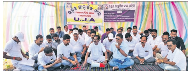
ସାମ୍ବାଦିକମାନେ ଧାରଣାରେ ବସିଛନ୍ତି।

ମାଲକାନଗିରି ଜିଲା ଉତ୍କଳ ସାମ୍ବାଦିକ ସଂଘ ପକ୍ଷରୁ ଶୁକ୍ରବାର ଜିଲାପାଳଙ୍କ କାର୍ଯ୍ୟାଳୟ ସମ୍ମୁଖରେ ଧାରଣା କାର୍ଯ୍ୟକ୍ରମ ଅନୁଷ୍ଠିତ ହୋଇଛି।