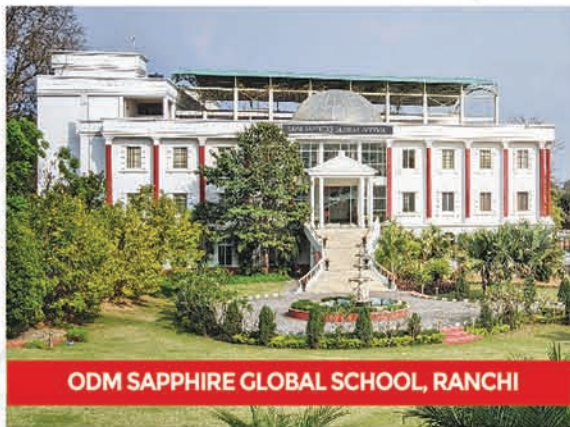
ODM SAPPHIRE GLOBAL SCHOOL, RANCHI