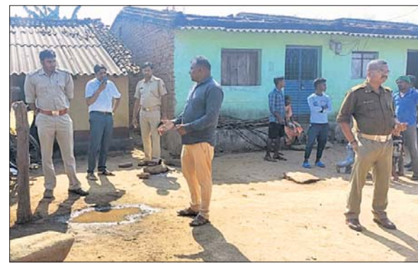
ପୋଲିସ ଗାଁରେ ତଦନ୍ତ କରୁଛି।

ପାପଡ଼ାହାଣ୍ଡି/ମଇଦପୁର, ୧୧୨ (ସ୍ୱପ୍ନକାନ୍ତ ପଟ୍ଟନାୟକ/ସବାଶିବ ଦାସ)