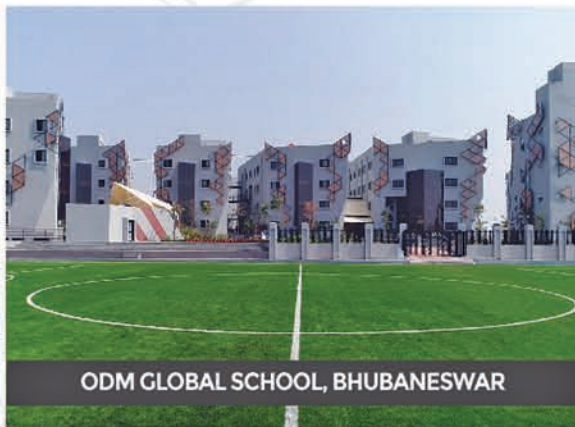
ODM GLOBAL SCHOOL, BHUBANESWAR