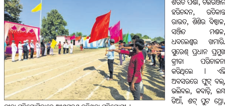
କ୍ରୀଡ଼ା ପ୍ରତିଯୋଗିତାରେ ଅଂଶଗ୍ରହଣ କରିଥିବା ପ୍ରତିଯୋଗୀ।

ମାଲକାନଗିରି ଜିଲା କାଲିନେଳା ବ୍ଲକ୍ ସଦର ଏ.ପି.ଇ.-୯୦ ଗ୍ରାମ ଖେଳ ପଡ଼ିଆରେ ବୁଦ୍ଧପୁରୀର ଆଦିବାସୀ କ୍ରୀଡ଼ା ପ୍ରତିଯୋଗିତା ଶୁକ୍ରବାର ଅନୁଷ୍ଠିତ ହୋଇଯାଇଛି।