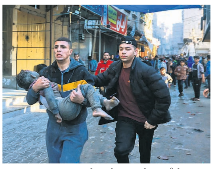
ଇସ୍ରାଏଲ ଆକ୍ରମଣରେ ଆହତ ଜଣେ ଶିଶୁକୁ ଧରି ଦୁଇ ପାଲେଷ୍ଟିନୀୟ ଧାଇଁଛନ୍ତି।

ସପ୍ତାହେ ଧରି ଚାଲିଥିବା ସହି ଶେଷ ହେବା ପରେ ଶୁକ୍ରବାର ଗାଜା ସ୍ଥିତିରେ ହମାସ୍ ସହ ଇସ୍ରାଏଲର ଯୁଦ୍ଧ ପୁଣି ଆରମ୍ଭ ହୋଇଛି। ଇସ୍ରାଏଲର ରକେଟ ମାଡ଼ରେ ଶତାଧିକ ପାଲେଷ୍ଟିନୀୟ ନିହତ ହୋଇଛନ୍ତି। ଯୁଦ୍ଧ ପ୍ରଭାବିତ ଏହି ଭୃଷ୍ଣକୁ କଳାଧିକାରୀ ଫାଇର କେନ୍ଦ୍ରକୁ ନିଆଯାଇଛି। ଫାଇର କେନ୍ଦ୍ରକୁ ଇସ୍ରାଏଲ ଲିଫ୍ଟଲେଟ୍ ହାତକୁ, ଯଦିରେ ଉଲ୍ଲେଖ କରାଯାଇଛି 'ଗାଜା ସିଟି' ଓ ସମ୍ପୂର୍ଣ୍ଣ ଭାଗକୁ ବୁଲେ ଖାଲି କର।' ଇସ୍ରାଏଲରେ ମଧ୍ୟ ଆତଙ୍କବାଦୀଙ୍କ ସମ୍ଭାଷଣ ଆକ୍ରମଣ ପାଇଁ ପ୍ରସ୍ତୁତ ହେବାକୁ ସତର୍କତା ଲାଗି ସାଇରନ୍ ଗଢୁଛି। ସହି ଅବଧି ମଧ୍ୟରେ ହମାସ୍ ଶତାଧିକ ପାଲେଷ୍ଟିନୀୟ ଛାଡ଼ିଦେଇଥିବାବେଳେ ଏବେ ବି ସେମାନଙ୍କ କବଳରେ ୧୪୦