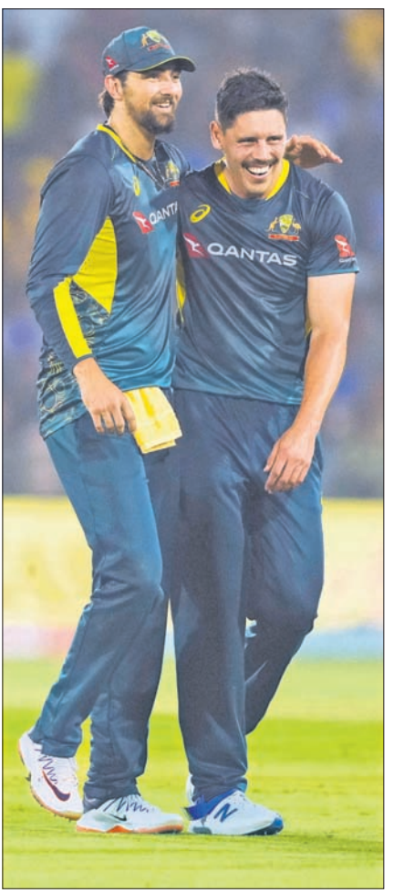
ଶର୍ବ ଖେଳିବା ଅବସରରେ ରିକ୍ସ ସିଂ। ରଜକେଟ ନେବାପରେ ବେନ୍ ଡ୍ୱାରଶୁଭକ୍ତ ସାଥୀ ଖେଳାଳିଙ୍କ ବସେଇ।

ପକ୍ଷରୁ ବନ୍ ଡ୍ୱାରଶୁଭକ୍ତ ସର୍ବାଧିକ ୩୬ ରନ କେବଳ ନେଇଥିଲେ। ଏହି ମ୍ୟାଚ ପାଇଁ ଭାରତୀୟ ଦଳରେ ୪ ପରିବର୍ତ୍ତନ କରାଯାଇଥିଲା। ପ୍ରବନ୍ଧ କ୍ରୀଷ୍ଣା, ଅର୍ଶଦୀପ ସିଂ, ଡିକକ ବର୍ମା ଓ ଜଗନ କିଶନଙ୍କ ସ୍ଥାନରେ ପୂଜେଶ କୁମାର, ଦୀପକ ଚହର, ଶ୍ରେୟସ ଆୟର ଓ ଜାହେଶ ଶର୍ମାଙ୍କୁ ସୁଯୋଗ ମିଳିଥିଲା। ସେହିପରି ୫ ପରିବର୍ତ୍ତନ ସହ ଅଷ୍ଟ୍ରେଲିଆ ପଡ଼ିଆକୁ ଓହ୍ଲାଇଥିଲା। ପୂର୍ବରୁ ଦଳରେ ସାମିଲଥିବା ଷ୍ଟେଭିନସ, ମ୍ୟାକ୍‌ଗ୍ରେଲ, ଇଂଲିଶ୍, ରିଚାର୍ଡ୍‌ସନ ଓ ଏଲିସ୍‌ଙ୍କୁ ବାଦ୍ ଦିଆ ଯାଇଥିଲା। ସେମାନଙ୍କ ସ୍ଥାନରେ କ୍ରିସ୍ ଗ୍ରାନ୍, ବେନ୍ ମ୍ୟାକଡର୍ମିଡ, ବେନ୍ ଡ୍ୱାରଶୁଭକ୍ତ, କୋର୍ଟ୍ ପିଲିପେ ଓ ମାଥ୍ୟୁ ଶର୍ମାଙ୍କୁ ସୁଯୋଗ ମିଳିଥିଲା। ୩୦ ବର୍ଷୀୟ ଅପ୍ ଜିନର କ୍ରିସ୍ ଗ୍ରାନ୍ ଏଠାରେ ପ୍ରଥମ ଅନ୍ତର୍ଜାତୀୟ ଟି୨୦ ପଦାର୍ପଣ କରିଥିଲେ। ସଂକ୍ଷିପ୍ତ ଘୋର ଭାରତ ୨୦ ଓଭରରେ ୧୭୪/୯ (ରିକ୍ସ ସିଂ-୪୬, ଯଶସ୍ୱି ଜୟସାଲ-୩୬, ଜାହେଶ ଶର୍ମା-୩୫, ରଞ୍ଜିତ ରାୟ-୩୨, ବେନ୍ ଡ୍ୱାରଶୁଭକ୍ତ-୩୧/୪୦, ଜାହନ ବେହରା-୨୯/୨୧-୨/୩୨, ତନଭାଉ ସାହା-୨/୩୦, ଆରୋନ ହାର୍ଡି-୧/୨୦)। ଅଷ୍ଟ୍ରେଲିଆ ୨୦ ଓଭରରେ ୧୫୪/୬ (ମାଥ୍ୟୁ ଷ୍ଟେଟ-୩୬, ଗ୍ରାଭିସ ହେଡ୍-୩୧, ଅକ୍ଷୟ ପଟେଲ-୩୧/୧୨, ଦୀପକ ଚହର-୨/୪୪, ରବି ବିଷ୍ଣୋଇ-୧/୧୭, ଆଦେଶ ଖାଁ-୧/୩୩)।