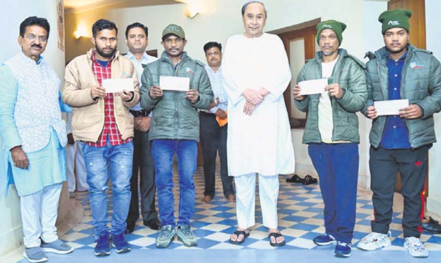
ଭୁବନେଶ୍ୱର, ୧୧୨ (ଅନିଲ ଦାସ)