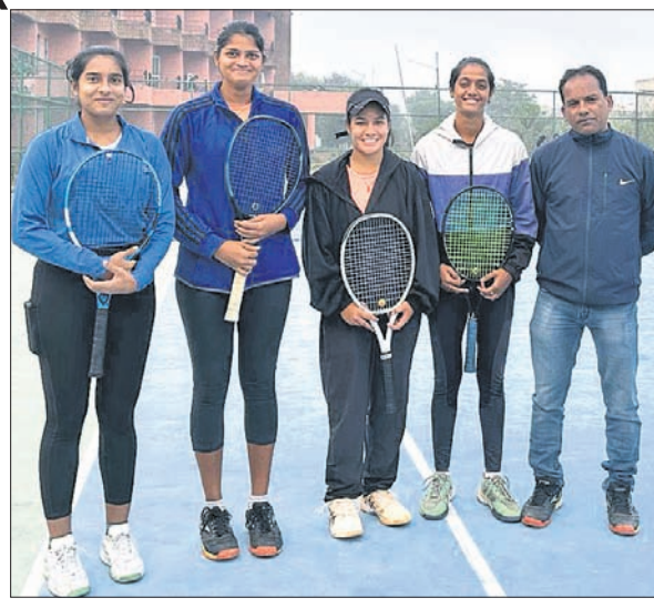
କୋର୍ସ ସହ କିର୍ ବିଶ୍ୱବିଦ୍ୟାଳୟ ମହିଳା ଚେନିସ୍ ଦଳ।