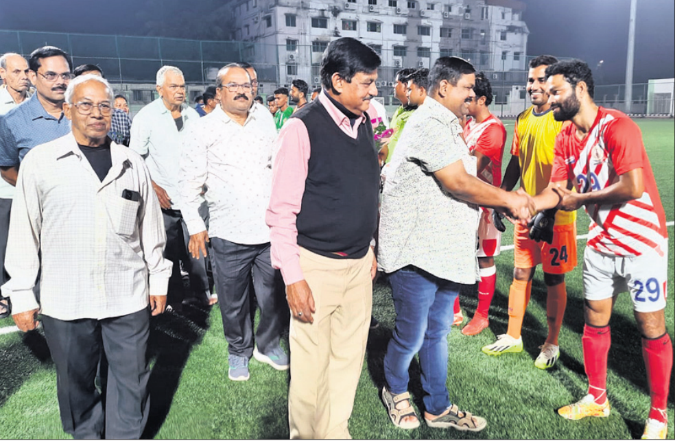
ଉଦ୍‌ଘାଟନା ଉତ୍ସବରେ ଅତିଥିମାନେ ଖେଳାଳିଙ୍କ ସହ ପରିଚିତ ହେଉଛନ୍ତି।