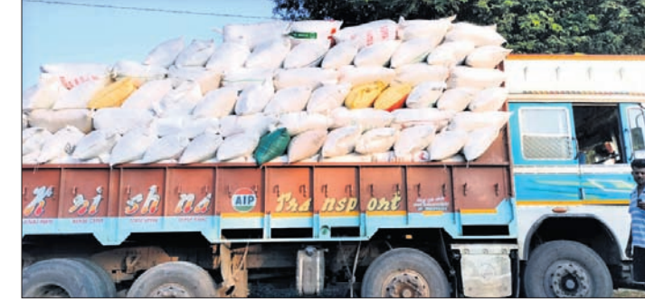
ଆନ୍ଧ୍ରକୁ ଚାଲାଇ ହେଉଥିବା ଧାନ ।

ମାଲକାନଗିରି ଜିଲ୍ଲା ପଡିଆ ବ୍ଲକ୍‌ରେ ଧାନମଣ୍ଡି ଖୋଲି ନ ଥିବା ବେଳେ ପଡିଆ ଆନ୍ଧ୍ରପ୍ରଦେଶ ବ୍ୟବସାୟୀମାନେ ସକ୍ରିୟ ହେଲେଣି । ଗଞ୍ଜାମ ହାତ ପହାନ୍ତରେ ଚଳା ପାଇବା ଆଶାରେ କମ୍ ଦାମରେ ଧାନ ବିକ୍ରି କରି ଶୋଷଣର ଶିକାର ହେଉଥିବା ବେଳେ ଆନ୍ଧ୍ର ବ୍ୟବସାୟୀମାନେ ମାଲକାନଗିରି ହେଉଥିବା ଅଭିଯୋଗ ହେଉଛି । ଆସନ୍ତା ୨୦ରେ ଧାନ ମଣ୍ଡି ଖୋଲିବାକୁ ଥିଲା ବେଳେ ଧାନର ସର୍ବନିମ୍ନ ମୂଲ୍ୟ ୨୧୮୮ଟଙ୍କା ରହିଛି । କିନ୍ତୁ ପଡିଆର ରାଜ୍ୟର ବ୍ୟବସାୟୀମାନେ ୧୮୮୮ଟଙ୍କା ୧୯୮୮ଟଙ୍କାରେ ଗଞ୍ଜାମଠାରୁ ଧାନ କିଣି ନେଉଛନ୍ତି । ଏହାକୁ ନେଇ ଅଞ୍ଚଳର ଗଞ୍ଜାମ ଓ ବରିଷ୍ଠ ନାଗରିକମାନେ ତୀବ୍ର ଅସନ୍ତୋଷ ପ୍ରକାଶ କରିଛନ୍ତି । ଶୁକ୍ରବାର ପଡିଆ ବ୍ଲକ୍ ସଦର ମହକୁମା ଗଲାଗୁଡ଼ା ଗ୍ରାମରେ ୧୪ ଚକିଆ ଟ୍ରକ୍‌ରେ ୫୦୦ରୁ ଊର୍ଦ୍ଧ୍ୱ ଧାନ ବସ୍ତା ବୋହେଇ ହେଉଥିବା ଦେଖିବାକୁ ମିଳିଛି । ଆନ୍ଧ୍ର ଧାନ ବେପାରୀମାନେ ପଡିଆ