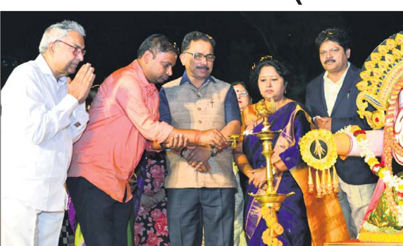
କୋଶାଳ ଉତ୍ସବକୁ ଅତିଥିମାନେ ପ୍ରବାପ ପ୍ରସ୍ତୁତ କରି ଉଦ୍‌ଘାଟନ କରୁଛନ୍ତି।