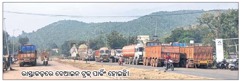
ରାସ୍ତାକଡ଼ରେ ବେଆଇନ ପାର୍କିଂ ହୋଇଛି।

ଦୁର୍ଘଟଣା ରୋକିବା ପାଇଁ ଶୁକ୍ରବାରଠାରୁ ସଡ଼କ ସୁରକ୍ଷା ସପ୍ତାହ ଆରମ୍ଭ ହୋଇଛି। ତେବେ ପ୍ରଥମ ଦିନରେ କେନ୍ଦ୍ରରେ ଲିମା ଘଟଣା ଥାନା ଅଞ୍ଚଳରେ ଏକ ଦୁର୍ଘଟଣାରେ ୮ ଜଣଙ୍କ ମୃତ୍ୟୁ ଘଟିବା ପ୍ରଶ୍ନାସନର ତିକ୍ତା ବଢ଼ାଇଦେଇଛି। କାଟାୟ ରାଜପଥରେ ପାଟ୍ଟୋଲିଂ ପାଇଁ ଏନ୍‌ଏସ୍‌ଆଇ ପକ୍ଷରୁ ବ୍ୟବସ୍ଥା ରହିଥିଲେ ମଧ୍ୟ ଠିକ୍ ଭାବରେ କାର୍ଯ୍ୟକାରୀ କରାଯାଇ ନ ଥିବାରୁ ଲିମା ଦେଇ ଯାଇଥିବା ଏନ୍‌ଏସ୍‌ଆଇ ବିଭିନ୍ନ ସ୍ଥାନରେ ବେଆଇନ ପାର୍କିଂ ହେଉଛି। ଏହାଦ୍ୱାରା ଅନେକ ସମୟରେ ଏଭଳି ଦୁର୍ଘଟଣାମାନ ଘଟୁଛି। ଗୁରୁବାର ପାଟ୍ଟୋଲିଂ କରାଯାଇଥିଲେ ଟ୍ରେକ୍ ଡାଉନ ଗାଡ଼ିକୁ କ୍ରେନ୍ ସହାୟତାରେ ରାସ୍ତାରୁ ସାଫ୍ କରାଯାଇପାରିଥାନ୍ତା। ନଚେତ୍ ବ୍ୟାରିକେଡ୍ ଦେଇ ସଡ଼କ ସୁରକ୍ଷା ଲଗାଯାଇ ଦୁର୍ଘଟଣାରୁ ରୋକାଯାଇପାରିଥାନ୍ତା ବୋଲି ମତପ୍ରକାଶ ପାଇଛି। ପ୍ରକାଶ ଯେ, ଲିମାରେ ସଡ଼କ ଦୁର୍ଘଟଣା ରୋକିବା ପାଇଁ ବ୍ୟାପକ ସଚେତନତା କାର୍ଯ୍ୟକ୍ରମ,