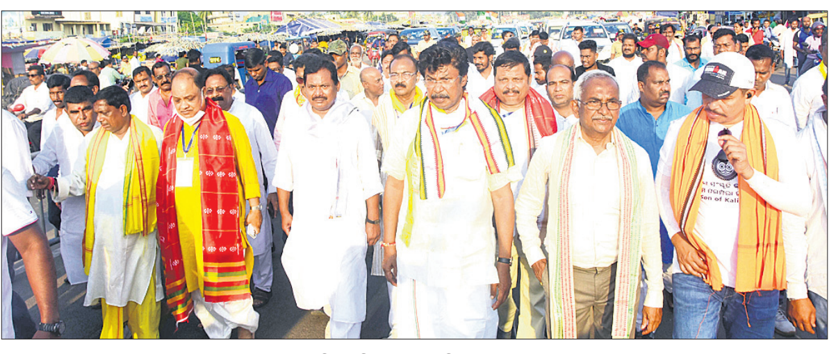
ଭୁଲସୀ ଯାତ୍ରାରେ ପୁରୀ ଶ୍ରୀମନ୍ଦିର ଅଭିମୁଖେ ଯାଉଛନ୍ତି କଂଗ୍ରେସ ନେତୃବୃନ୍ଦ, ଜଗନ୍ନାଥପ୍ରେମୀ।

ପୁରୀ, ୧୧୧୨ (କଂଗ୍ରେସ) ଭୁଲସୀ ପାଇଁ ଶ୍ରୀମନ୍ଦିର ଚାରିପଟେ ଖୋଲିବା, ରତ୍ନକଣ୍ଠା ନିର୍ମାଣ ଓ ଅଲକାର ଗଣିତ ସମେତ ୬୦୦୦ ଟଙ୍କା ଲାଗୁ କଂଗ୍ରେସ ପକ୍ଷରୁ ଶ୍ରୀମନ୍ଦିରକୁ ଭୁଲସୀ ଯାତ୍ରା କରାଯାଇଛି। ଏହି ପରିପ୍ରେକ୍ଷାରେ ରାଜ୍ୟ ସରକାରଙ୍କ କୁଳକର୍ଣ୍ଣ ନିଧା ଭଙ୍ଗ ନିମନ୍ତେ ସାରା ରାଜ୍ୟରୁ ସଂଗୃହୀତ ଭୁଲସୀ ଓ ସକଳ ଭୁଲସୀ ସହ କଂଗ୍ରେସ କର୍ମକର୍ତ୍ତା ଏବଂ ଜଗନ୍ନାଥପ୍ରେମୀମାନେ ଶରଧାଧାରିଣୀମାନେ ଏକାଠି ହୋଇଥିଲେ। ପରେ ଭୁଲସୀ ମନ୍ଦିରଠାରୁ ଏକ ଶୋଭାଯାତ୍ରାରେ ବାହାରି ଶ୍ରୀମନ୍ଦିର ପ୍ରଶାସନ କାର୍ଯ୍ୟାଳୟ ନିକଟରେ ପହଞ୍ଚିଥିଲେ। ସେଠାରେ