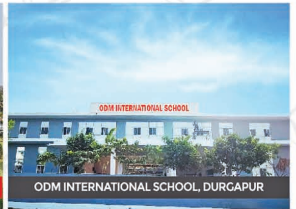
ODM INTERNATIONAL SCHOOL, DURGAPUR