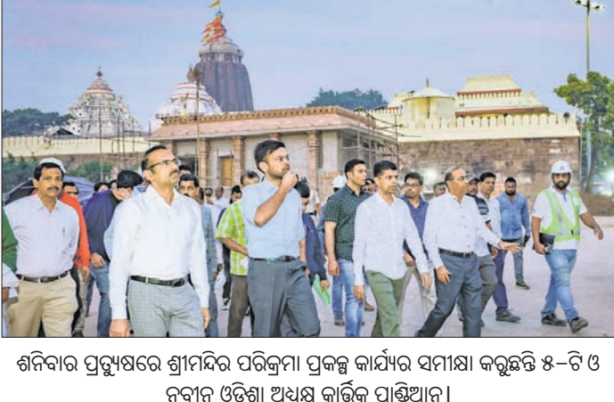
ଶନିବାର ପ୍ରତ୍ୟୁଷରେ ଶ୍ରୀମନ୍ଦିର ପରିକ୍ରମା ପ୍ରକଳ୍ପ କାର୍ଯ୍ୟ ସମାପ୍ତ କରୁଛନ୍ତି ୫-ଟି ଓ ନବୀନ ଓଡ଼ିଶା ଅଧକ୍ଷ କାର୍ତ୍ତିକ ପାଣିଆନ୍।