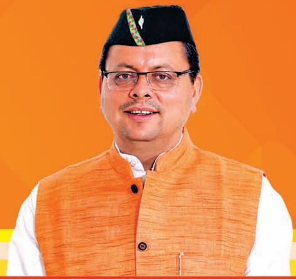
Pushkar Singh Dhama Chief Minister of Uttarakhand, India

8 th - 9 th December, 2023 Dehradun (Uttarakhand) Peace To Prosperity