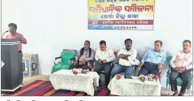
ସାମ୍ପାଦକ ସମ୍ମିଳନୀରେ ଉପସ୍ଥିତ ଅତିଥି।