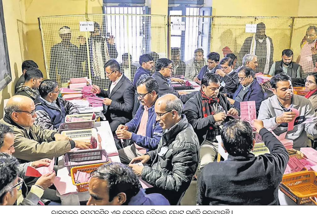
ରାଜସ୍ଥାନର ଜୟଧ୍ୱରଣିତ ଏକ କେନ୍ଦ୍ରରେ ରବିବାର ଭୋଗ ଗଣତି କରାଯାଇଛି ।

ପରାସ୍ତ କରାଯିବ ସେନେକ ବୈଠକରେ ଆଲୋଚନା ହୋଇ ଯୋଜନା ରୂପାନ୍ତ ହେବ । ଉତ୍ତରାଖଣ୍ଡ ଉପରେ ଭାଜପା ଉପରେ ଭାଜପା ପାଇଁ କଂଗ୍ରେସ ୫ ରାଜ୍ୟର ବିଧାନସଭା ନିର୍ବାଚନ ଫଳାଫଳକୁ ଅପେକ୍ଷା କରି ରହିଥିଲା । ପୂର୍ବରୁ ଇଣ୍ଡିଆ କୁ ୨୭ ବିରୋଧୀ ଦଳ ପାଟନା, ବେଙ୍ଗାଲୁରୁ ଓ ମୁମ୍ବାଇରେ ଏକାଠି ହୋଇ ଆଲୋଚନା କରିଥିଲେ । ବିରୋଧୀ ନେତାମାନେ ଏବେଠାରୁ ମିଳିତ ରାଜିତ ଯୋଜନା କରିବା ଆବଶ୍ୟକ ବୋଲି କେତେକ ସୂତ୍ର କହିଛନ୍ତି ।