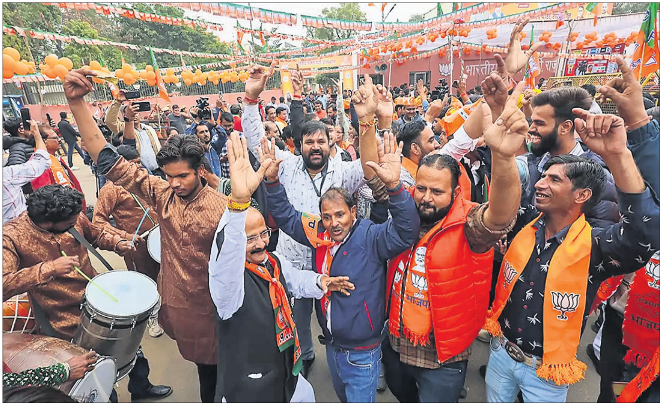
ରାଜସ୍ଥାନରେ ଭାଜପା ବିଜୟ ଖବର ଆସିବା ପରେ ଜୟଧ୍ୱରଣିତ ଦଳୀୟ ମୁଖ୍ୟମନ୍ତ୍ରୀ ବାହାରେ କର୍ମୀ ଓ ସମର୍ଥକମାନେ ଉତ୍ସବ ମନାଉଛନ୍ତି ।