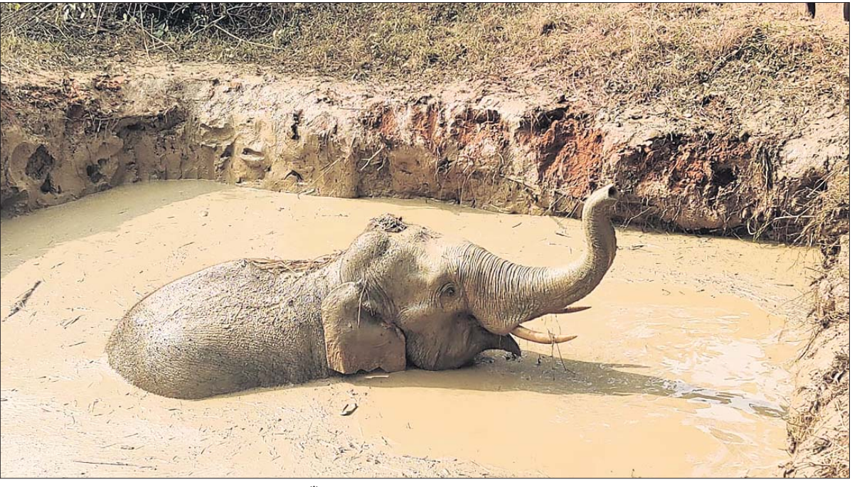
ଭଦ୍ରାପତା ଗାଁପୁଣ୍ଡ ଜଙ୍ଗଲ ପାଖ ପୋଖରୀରେ ହାତୀ ଫସି ରହିଛି।