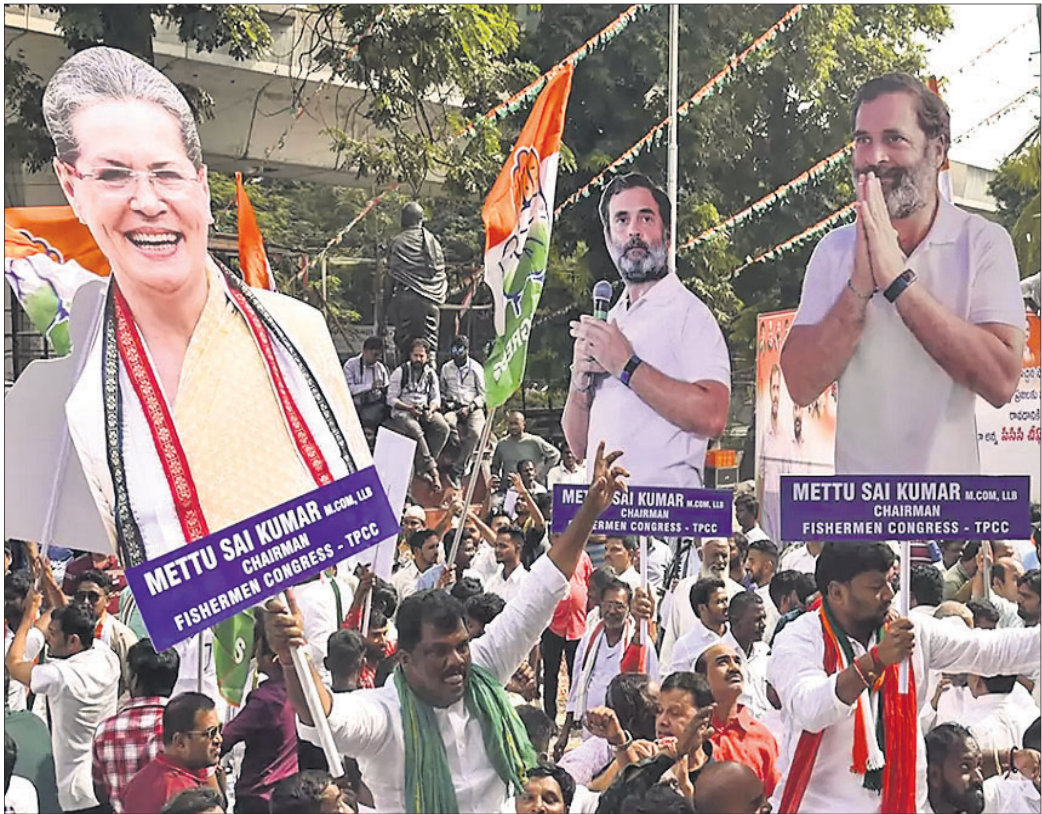
ତେଲଙ୍ଗାନା ନିର୍ବାଚନରେ କଂଗ୍ରେସର ଐତିହାସିକ ବିଜୟ ଖବର ପ୍ରକାଶ ପାଇବା ପରେ ହାଜଡ଼ାବାଦର ଗାନ୍ଧୀଭବନ ବାହାରେ ଦଳୀୟ ନେତା ଓ କର୍ମୀମାନେ ବିଜୟ ଉତ୍ସବ ପାଳନ କରୁଛନ୍ତି ।