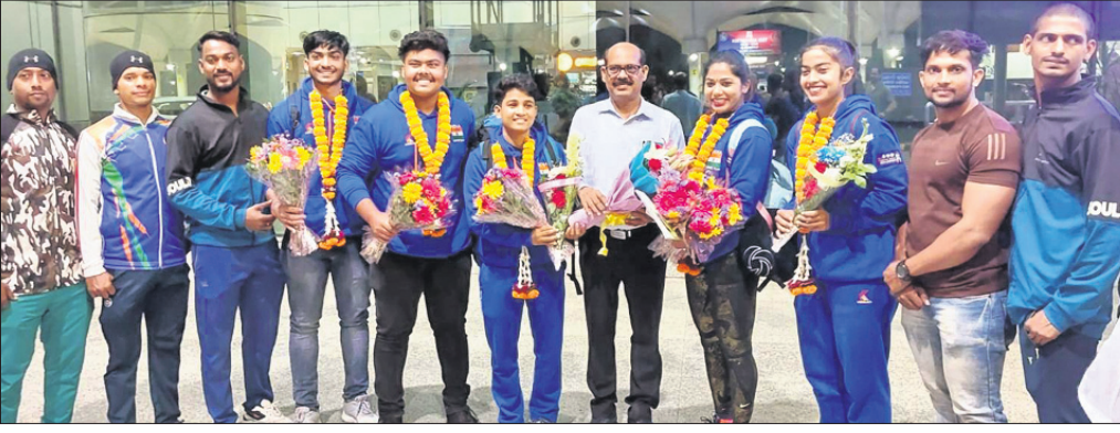
ନେପାଳରେ ଅନୁଷ୍ଠିତ ଦକ୍ଷିଣ ଏସୀୟ ପ୍ରତିଯୋଗିତାରେ ପଦକ ବିଜୟୀ ଓଡ଼ିଶା ପ୍ରତିଯୋଗୀମାନଙ୍କୁ ମଙ୍ଗଳବାର ଭୁବନେଶ୍ୱର ବିମାନ ବନ୍ଦରରେ ରାଜ୍ୟ କ୍ରୀଡ଼ା ବିଭାଗର ଅଧିକାରୀ ଓ ସାଥୀ କର୍ମଚାରୀମାନେ ସ୍ୱାଗତ କରୁଛନ୍ତି।