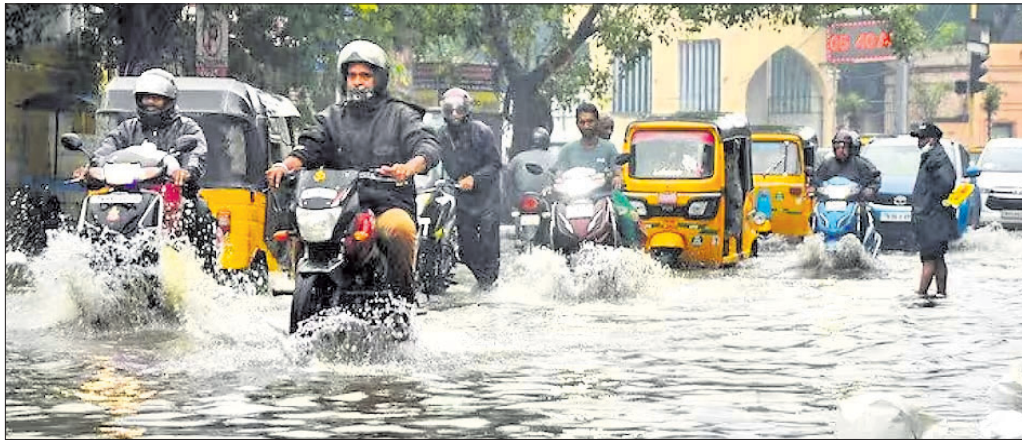
ଭୁବନେଶ୍ୱର, ୫୧୧୨ (ପି.ଟି.)

ଜଳବାୟୁ ପରିବର୍ତ୍ତନର ପ୍ରଭାବ ଯୋଗୁ ୨୦୧୧ରୁ ୨୦୨୦ ଦଶକରେ ଭାରତ ଅଧିକ ଉତ୍ପାଦିତ ଓ ଆର୍ଥିକ ଦେଶ ଭାବେ ଚିହ୍ନିତ ହେବାର ସମ୍ଭାବନା ରହିଛି।