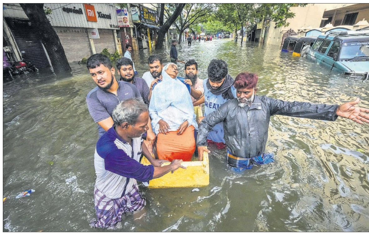
ବାତ୍ୟା ପ୍ରଭାବରେ ପ୍ରବଳ ବର୍ଷା ଯୋଗୁ ଜଳାଶୁଷ୍କ ହୋଇପଡ଼ିଥିବା ଚେନ୍ନାଇର ଏକ ଅଞ୍ଚଳକୁ ଜଣେ ବୁଢ଼ାଙ୍କୁ ସୁରକ୍ଷିତ ସ୍ଥାନକୁ ନିଆଯାଇଛି।

ଅମରାବତୀ/ଚେନ୍ନାଇ, ୫।୧୨ ଭାରତୀୟ ସାମୁଦ୍ରିକ ବାତ୍ୟା ମିଗ୍‌ଲୋମ୍ ମଙ୍ଗଳବାର ମଧ୍ୟାହ୍ନ ୧୨ଟା ୩୦ରୁ ୨ଟା ୩୦ ମଧ୍ୟରେ ଆନ୍ଧ୍ରପ୍ରଦେଶ ଉପକୂଳ ଅତିକ୍ରମ କରିଛି। ନେଲୋର ଏବଂ ମହଲିପତନମ୍ ମଧ୍ୟବର୍ତ୍ତୀ ବାପାଟଲା ନିକଟରେ ବାତ୍ୟା ସ୍ଥଳଭାଗ ଛୁଇଁଥିଲା। ଏହି ସମୟରେ ପବନର ଘଣ୍ଟା ପ୍ରତି ବେଗ ସର୍ବାଧିକ ୯୦ରୁ ୧୦୦ କିଲୋମିଟର ଥିଲା ବୋଲି ଅମରାବତୀ ପାଣିପାଗ କେନ୍ଦ୍ର ପକ୍ଷରୁ କୁହାଯାଇଛି। ସ୍ଥଳଭାଗ ଛୁଇଁବା ପରେ ବାତ୍ୟା ଉତ୍ତର ଦିଗରେ ଗତି କରିବା ସହ କ୍ରମଶଃ ଦୁର୍ବଳ ହୋଇଛି। ଏହାର ପ୍ରଭାବରେ ତାମିଲନାଡୁ, ପଶ୍ଚିମ ଓ ଆନ୍ଧ୍ରପ୍ରଦେଶରେ ୩ ଦିନ ଧରି ପ୍ରବଳ ବର୍ଷା ଲାଗିରହି ବ୍ୟାପକ କ୍ଷୟକ୍ଷତି ଘଟିଛି। ବାତ୍ୟା ପ୍ରଭାବରେ ଚେନ୍ନାଇରେ ପ୍ରବଳ ବର୍ଷା ବିପାତରେ ୧୨ ଜଣଙ୍କ ଜୀବନ ଯାଇଛି। ସେଠାରେ ରାସ୍ତାଗୁଡ଼ିକ ନଦୀର ଭ୍ରମ ସୃଷ୍ଟି କରିଛି। ରାଜ୍ୟରାଜ୍ୟରେ ତଳା ବାଲିଥିବା ଦେଖାଯାଇଥିଲା। ସୋମବାର ବର୍ଷାଜଳ ସୁଅରେ କେତେକ ଗାଡ଼ି ଭାସିଯାଇଥିଲା। ଫଳରେ କର୍ତ୍ତୃପକ୍ଷ ବିଦ୍ୟାଳୟଗୁଡ଼ିକୁ ଛୁଟି ଘୋଷଣା କରିଥିଲେ। ଘରୋଇ ସଂସ୍ଥାଗୁଡ଼ିକ ସେମାନଙ୍କ କର୍ମଚାରୀଙ୍କୁ ଘରେ ରହି କାମ କରିବାକୁ କହିଥିଲେ। ବର୍ଷା ଓ ପବନରେ ପୃଷ୍ଠା-୨