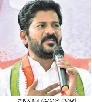
ଆନୁମୂଲ୍ୟା ରେଭନ୍ୟୁ ରେଞ୍ଜୀ

କେ.ସି. ବେଣ୍ଟଗୋପାଳ ଓ ଅନ୍ୟମାନେ ଯୋଗଦେଇଥିଲେ। ଏହା ପରେ ହାଇଦ୍ରାବାଦରେ କଂଗ୍ରେସ ବିଧାୟକ ଦଳ ବୈଠକ ବସିବା ପରେ ମୁଖ୍ୟମନ୍ତ୍ରୀଙ୍କ ନାମ ଘୋଷଣା କରାଯାଇଛି। ରେଭନ୍ୟୁ ଆସନ୍ତା ଗୁରୁବାର ପୂର୍ବାହ୍ନ ୧୧ଟାରେ ନୂଆ ମୁଖ୍ୟମନ୍ତ୍ରୀ ଭାବେ ଶପଥ ନେବେ ବୋଲି ବେଣ୍ଟଗୋପାଳ ଏକ ଖବରଦାତା ସଂକଳନରେ ଘୋଷଣା ପୃଷ୍ଠା-୨