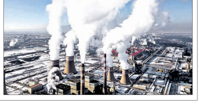
ଭୁବନେଶ୍ୱର, ୫୧୨ (ପି.ଟି.): ଭାରତର ମୁଖ୍ୟ ପିଛା ଅନ୍ତର୍ଜାତୀୟ ଉତ୍ପାଦନ ବୈଶିକ ହାରାହାରିର ଅଧାରୁ କମ୍

ଭାରତର ମୁଖ୍ୟ ପିଛା ଅନ୍ତର୍ଜାତୀୟ ଉତ୍ପାଦନ ବୈଶିକ ହାରାହାରିର ଅଧାରୁ କମ୍ ହେବାର ମୁଖ୍ୟ କାରଣ ହେଉଛି ପରାମ୍ପରାଗୋଦାନୀ ପରିସରରେ ଉଚ୍ଚ ପ୍ଲାଣ୍ଟ ରହିଛି। ମୁଖ୍ୟ ପିଛା ଅନ୍ତର୍ଜାତୀୟ ଉତ୍ପାଦନ ବୈଶିକ ହାରାହାରିର ଅଧାରୁ କମ୍ ହେବାର ମୁଖ୍ୟ କାରଣ ହେଉଛି ପରାମ୍ପରାଗୋଦାନୀ ପରିସରରେ ଉଚ୍ଚ ପ୍ଲାଣ୍ଟ ରହିଛି।