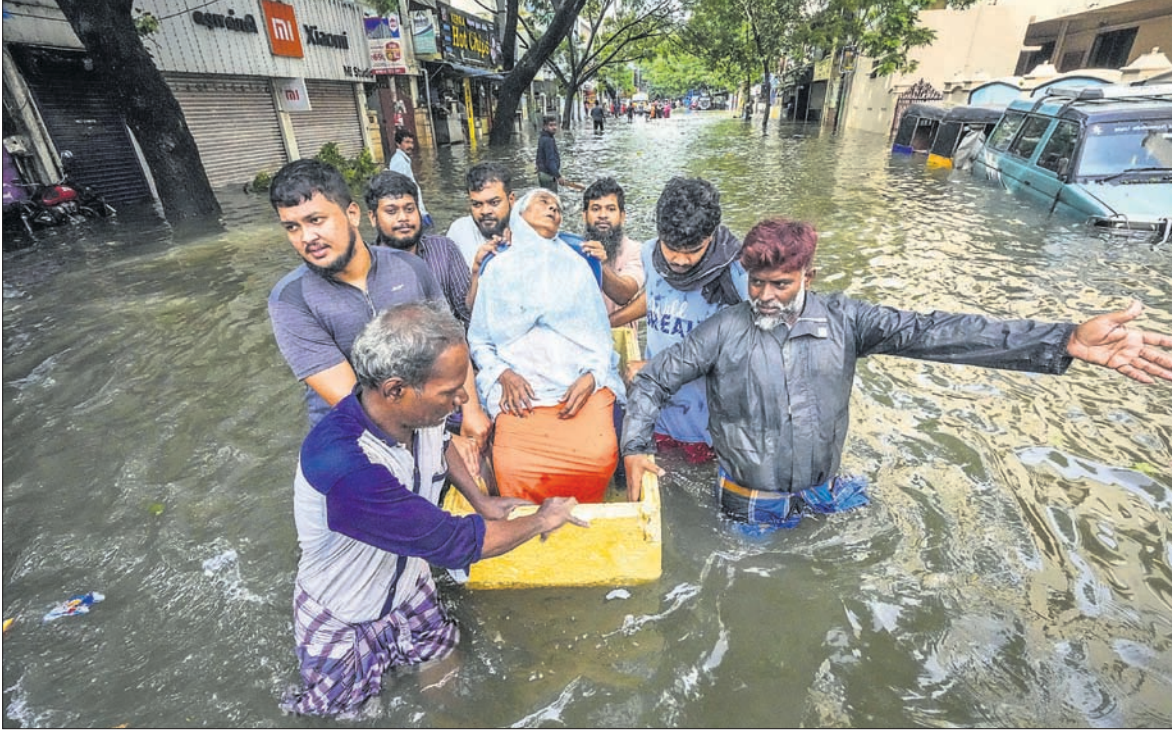
ବାତ୍ୟା ପ୍ରଭାବରେ ପ୍ରବଳ ବର୍ଷା ଯୋଗୁ ଜଳାଶୁଷ୍କ ହୋଇପଡ଼ିଥିବା ଚେନ୍ନାଇର ଏକ ଅଞ୍ଚଳକୁ ଜଣେ ବୁଦ୍ଧଙ୍କୁ ସୁରକ୍ଷିତ ସ୍ଥାନକୁ ନିଆଯାଇଛି।

ଭାରତୀୟ ସାମୁଦ୍ରିକ ବାତ୍ୟା ମିଗ୍‌କୋମ୍ ମଙ୍ଗଳବାର ମଧ୍ୟାହ୍ନ ୧୨ଟା ୩୦ରୁ ୨ଟା ୩୦ ମଧ୍ୟରେ ଆନ୍ଧ୍ରପ୍ରଦେଶ ଉପକୂଳ ଅତିକ୍ରମ କରିଛି।